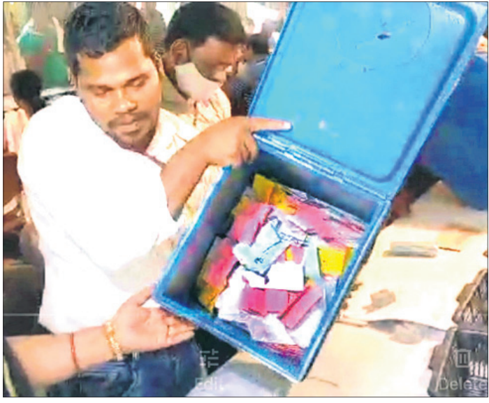
ପୁରୀ ଆଇଡିଆଲ କଲେଜ ପରିସରରେ ଭୋଟ ଗଣତି ପାଇଁ ବାଲେଟ୍ ପେପର ଜମାଯାଇଛି।

ଭୁବନେଶ୍ୱର, ୨୬/୨ (ବୁଧବାର) ତ୍ରିପୁରାୟ ପଞ୍ଚାୟତ ନିର୍ବାଚନ ଭୋଟ ଗଣତି ଶିବିରର କଡ଼ା ସୁରକ୍ଷା ମଧ୍ୟରେ ରାଜ୍ୟର ବୃକ୍ ମୁଖ୍ୟମନ୍ତ୍ରୀଙ୍କୁ ଚିତ୍ତରେ ଆରମ୍ଭ ହୋଇଛି। ଆସନ୍ତା ୨୮ ତାରିଖ ପର୍ଯ୍ୟନ୍ତ ଭୋଟ୍ ଗଣନା କାରି ରହିବ। ତେବେ ଗଣନାର ପ୍ରଥମ ଦିବସରେ ବିଜେଡିକୁ ବିପୁଳ ଜନସମର୍ଥନ ମିଳିଛି। ଫଳାଫଳ ଏକତରଫା ଆଡ଼କୁ ଚଳିଯାଇଛି। ୨୧ ବର୍ଷର ଶାସନ ପରେ ମଧ୍ୟ ମୁଖ୍ୟମନ୍ତ୍ରୀ ନବୀନ ପଟ୍ଟନାୟକଙ୍କ ଛବି ଅମଳିନ ରହିଛି। ରାଜ୍ୟର ପ୍ରାୟ ଅଧିକାଂଶ ଜିଲ୍ଲା ପରିଷଦ ଆସନରେ ବିରୋଧୀ ଭାଜପା ଓ କଂଗ୍ରେସକୁ ବହୁ ପକ୍ଷରେ ପକାଇ ବିଜୟ ଆଡ଼କୁ ଆଗେଇ ଚାଲିଛି ବିଜେଡି। ଶାସକ ଦଳର ପ୍ରାର୍ଥୀମାନେ କେତେକ ସ୍ଥାନରେ ନିଜ ପ୍ରତିଦ୍ୱନ୍ଦ୍ୱୀଙ୍କୁ ବହୁ ପକ୍ଷରେ ପକାଇଛନ୍ତି। କେବଳ ଉପକୂଳ ମୁହେଁ, ଦକ୍ଷିଣ ଓ ପଶ୍ଚିମ ଓଡ଼ିଶାରେ ମଧ୍ୟ ବିରୋଧୀଙ୍କୁ ବିଜେଡି ମାତ୍ର ଦେଇଚାଲିଛି। ଭାଜପାର ବଡ଼ କୁହାଯାଉଥିବା ବାଲେଶ୍ୱର, ବଲାଙ୍ଗୀର, ମୟୂରଭଞ୍ଜ, ସମ୍ବଲପୁର, କଳାହାଣ୍ଡି, ସୁନ୍ଦରଗଡ଼ ଆଦି ଜିଲ୍ଲାରେ ବିଜେଡି ମୁଖ୍ୟ ପ୍ରତିଦ୍ୱନ୍ଦ୍ୱୀ ଭାଜପାକୁ ବହୁ ପକ୍ଷରେ ବିଜୟ ପଥରେ ଆଗେଇ ଚାଲିଛି। ଦୀର୍ଘ ବର୍ଷ ଧରି କଂଗ୍ରେସ କବ୍ଜାରେ ଥିବା ଝାରସୁଗୁଡ଼ାରେ ମଧ୍ୟ ରାଜନୈତିକ ଚିତ୍ର ବଦଳିଯାଇଛି।