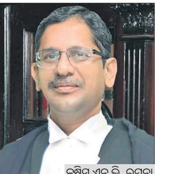
ଜଷ୍ଟିସ୍ ଏନ୍.ଭି. ରମନା

ଦେଶର ନ୍ୟାୟିକ ଭିତ୍ତିଭୂମିରେ ସର୍ବନିମ୍ନ ମୌଳିକ ମାନର ଅଭାବ ରହିଥିବା ଭାରତର ପ୍ରଧାନ ବିଚାରପତି (ସିଜେଆଇ) ଏନ୍.ଭି. ରମନା ଶନିବାର କହିଛନ୍ତି।