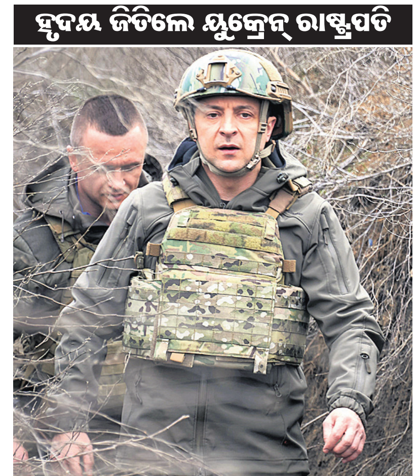
ସେନା ୟୁନିଟ୍ସରେ ୟୁକ୍ରେନ୍ ରାଷ୍ଟ୍ରପତି ଭୋଲୋଡିମିର ଜେଲେନ୍ସ୍କି।

କ୍ରିକ/ଓଶିଟ୍ଟର/ମସ୍କୋ, ୨୬/୨ 'ମୁଁ ନିଜ ଭୂମିରେ ଛିଡ଼ା ହୋଇଛି। ଦେଶ ଛାଡ଼ି କୁଆଡ଼େ ଯିବିନା। ମୋତେ ଗୋଳାବାରୁଦ ବରକାର। ପକାୟନ ପାଇଁ ଗାଡ଼ି ନୁହେଁ। ଅତିମ ସମୟ ପର୍ଯ୍ୟନ୍ତ ଏଇଠି ଲଢ଼ିବି'। ୟୁକ୍ରିନ୍ ବିଭାଗିକା ଭିତରେ କ୍ରିକ୍ ଏବେ ମୁହୂର୍ତ୍ତ ନଗରୀ ପାଲଟିଥିବାବେଳେ ୟୁକ୍ରେନ୍ ରାଷ୍ଟ୍ରପତି ଭୋଲୋଡିମିର ଜେଲେନ୍ସ୍କି ଏହି ମନ୍ତବ୍ୟ ବିଶ୍ୱାସଯୋଗ୍ୟ ଦୃଷ୍ଟି ଆକର୍ଷଣ କରିଛନ୍ତି। ଶତ୍ରୁ ଯେତେ ଶକ୍ତିଶାଳୀ ହେଉ ନା କାହିଁକି ୟୁକ୍ରିନ୍ ଅସ୍ତ୍ରରେ ନୁହେଁ, ବରଂ ଦୃଢ଼ ମନୋବଳରେ ଲଢ଼ାଯାଏ ବୋଲି ବିଶ୍ୱାସ ବାଣୀ ଦେଇ ସୁରକ୍ଷା ପାଇଁ ଆମେରିକା ଦେଇଥିବା ପ୍ରସ୍ତାବକୁ ସେ ପ୍ରତ୍ୟାଖାନ କରିଛନ୍ତି। ଦିନେ ଚିଲି ପରଦାରେ କମେଡିଆନ ସାଜି ଲୋକଙ୍କ ମୁହଁରେ ହସ ପୁଟାଉଥିବା ୟୁକ୍ରେନ୍ର ଜେଲେନ୍ସ୍କି ଏବେ ୟୁକ୍ରେନ୍ରାସୀୟ ସୁରକ୍ଷା ପାଇଁ ୟୁକ୍ରେନ୍କୁ ଓହ୍ଲାଇଛନ୍ତି। ସେ ରୁଷିଆ ସୈନ୍ୟଙ୍କ ସହ ମୁହାଁମୁହିଁ ଲଢ଼ିବାକୁ ଅଣ୍ଟା ଭିଡ଼ି ବିଶ୍ୱ ନେତାଙ୍କ ଆଗରେ ବିରକ୍ତ ଦୃଷ୍ଟାନ୍ତ ସାଜିଛନ୍ତି। ଜେଲେନ୍ସ୍କି ମିଲିଟାରୀ ୟୁନିଟ୍ସ ପିଆ ଫଟୋ ସୋସିଆଲ ମିଡିଆରେ ଭାଇରାଲ ହେବାରେ ଲାଗିଛି। ଇନ୍ସ୍ପିରା ସମ୍ପ୍ରଦାୟର ଜେଲେନ୍ସ୍କି ପୂର୍ବରୁ ଜଣେ ଚିଲି ହାସ୍ୟକାର ଥିଲେ। ତାଙ୍କ କେଜେବାପା ଦ୍ୱିତୀୟ ବିଶ୍ୱଯୁଦ୍ଧବେଳେ ରେଡ଼ ୧୬ ପୃଷ୍ଠା-୪