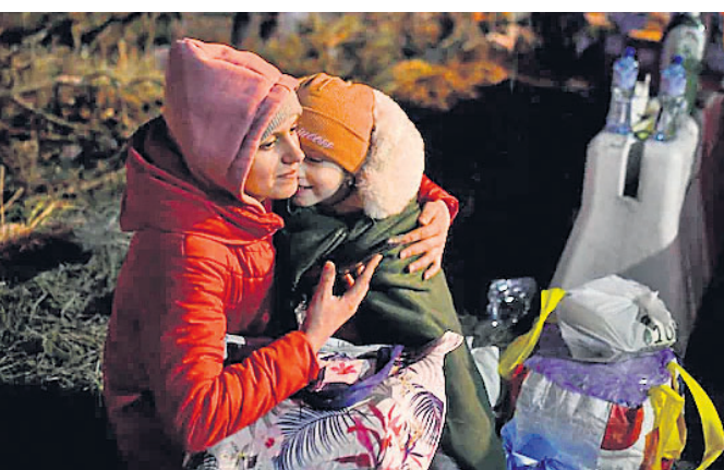
ରୋମାନିଆ ସୀମାରେ ପହଞ୍ଚିଥିବା ଜଣେ ମୁକ୍ତେନ୍ଦ୍ରୁ ମହିଳା ଶିଶୁଙ୍କୁ କୋଳରେ ଧରିଛନ୍ତି।

ଯାଉଥିବାବେଳେ କେତେକ ବେଲାରୁଷ୍ ପକାଇଯାଉଥିବା ଦେଖାଯାଇଛି।