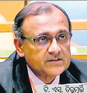
ଡି. ଏସ୍. ତିରୁମୂର୍ତ୍ତି

ଜାତିସଂଘର ସୁରକ୍ଷା ପରିଷଦ (ଧ୍ବଂସନୀୟ)ରେ ଶୁକ୍ରବାର ଆମେରିକା ପକ୍ଷରୁ ପ୍ରସ୍ତୁତ କରାଯାଇଥିବା ରୁଷିଆ ବିରୋଧୀ ନିନ୍ଦା ପ୍ରସ୍ତାବ ଗୃହୀତ ହୋଇପାରିନାହିଁ।