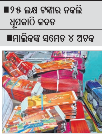
ନକଲି ଧୁପକାଠି ଓ ଖୋଳା।

କଟକ ଅଫିସ, ୨୬/୨ କଟକ ଜିଲ୍ଲା ଲାଲବୀର ଥାନା ଅଧୀନ ରଜା ମନ୍ଦିର ଅଞ୍ଚଳରେ ଥିବା ଡି.ଆର. ଚତୁର୍ଥ ନାମକ ଧୁପକାଠି କାରଖାନା ଶନିବାର ଠାଏ କରାଯାଇଛି।