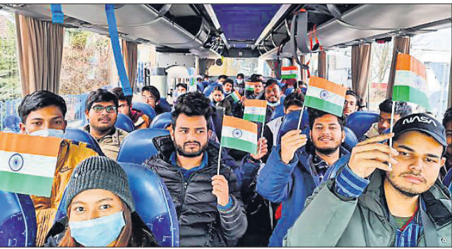
'ଶେଷ ଭାରତୀୟ ଫେରିବା ଯାଏ ନିଶାନ ଚାଲିବ'

ମୁକ୍ତେନ୍ଦ୍ରରେ ମୁକ୍ତେନ୍ଦ୍ର ଲାଗିବା ପରେ ସେଠାରେ ଅଟକି ରହିଥିବା ଭାରତୀୟଙ୍କୁ ଫେରାଇ ଆଣିବା ପାଇଁ ସରକାରଙ୍କ ପକ୍ଷରୁ ଉଦ୍ୟମ କାରି ରହିଛି।