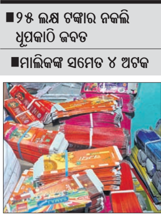
ନକଲି ଧୁପକାଠି ଓ ଖୋଳା।

କଟକ ଅଫିସ, ୨୬/୨ କଟକ ଜିଲ୍ଲା ଲାଲବାଗ ଥାନା ଅଧୀନ ରଜା ମନ୍ଦିର ଅଞ୍ଚଳରେ ଥିବା ଡି.ଆର. ଚନ୍ଦ୍ରଚର୍ଯ୍ୟ ନାମକ ଧୁପକାଠି କାରଖାନା ଶନିବାର ଠାଏ କରାଯାଇଛି।