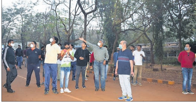
କାର୍ଯ୍ୟକ୍ରମରେ ଯୋଗ ଦେଇଥିବା ଅଧିକାରୀ ପକ୍ଷୀ ବନ୍ଦୀ ବୁଲି ଦେଖୁଛନ୍ତି।

ଭୂକିନ୍ଦା ଟାଟା ଷ୍ଟିଲ୍ସ ମାଲିନି ପକ୍ଷୀକୁ ସ୍ଥାନୀୟ କାଟେପୁଡ଼ି ଅତିଷ୍ଟୋରିୟମ୍ଠାରେ ପକ୍ଷୀଙ୍କୁ ଲୋକଙ୍କ ନିକଟତର କରିବାକୁ ଏକ ସଚେତନତା କାର୍ଯ୍ୟକ୍ରମ ଅନୁଷ୍ଠିତ ହୋଇଯାଇଛି।