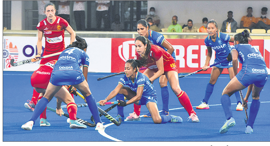
ଭାରତ-ଷ୍ଟେଟ ମହିଳା ହକି ଦଳ ମଧ୍ୟରେ ଅନୁଷ୍ଠିତ ମ୍ୟାଚର ଉତ୍ତରାଂସ୍ପୂର୍ଣ୍ଣ ମୁହୂର୍ତ୍ତ ।