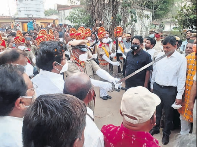
ଓକ୍ସିଡ଼ା ଗ୍ରାମରେ ପାର୍ଥବ ଶରୀରକୁ ଗାର୍ତ୍ ଅଫ୍ ଅନର ବିଧାୟାଉଛି।

ପୂର୍ବତନ ପୁଷ୍ୟମନ୍ତ୍ରୀ ହେମାନନ୍ଦ ବିଶ୍ୱାଳଙ୍କ ଶୁକ୍ରବାର ଭୁବନେଶ୍ୱରର ଏକ ଘରୋଇ ହସ୍ତିଶାଳାରେ ପରଲୋକ ଘଟିଥିଲା।