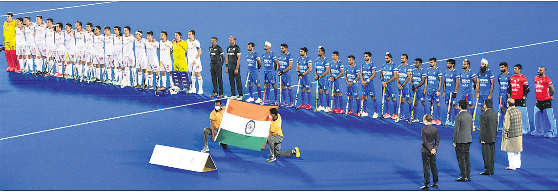
ଭାରତ ଓ ଷ୍ଟେଟ ପୁରୁଷ ହକି ଦଳ ମଧ୍ୟରେ ଏପିଆଇଏଚ୍ ପ୍ରୋ ଲିଗ୍ ହକି ମ୍ୟାଚ ପୂର୍ବରୁ ଅଭିଯୁକ୍ତ ସହ ଦୁଇ ଦଳର ଖେଳାଳିମାନେ ।