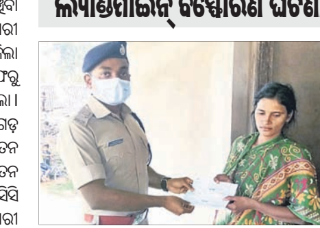
ଏସ୍‌ପି ମୃତ ଖବରଦାତାଙ୍କ ସ୍ତ୍ରୀଙ୍କୁ ଚେକ୍ ପ୍ରଦାନ କରୁଛନ୍ତି।