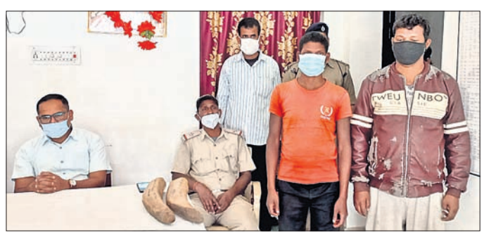
କବଚ ହାତୀଦାନ୍ତ ସହ ଗିରଫ ଅଭିଯୁକ୍ତ।

କେନ୍ଦୁଝର, ୨୭/୨ (ସ.ପ୍ର.) କେନ୍ଦୁଝର ସଦର ରେଞ୍ଜି ଅନ୍ତର୍ଗତ ପାରୁଙ୍ଗା-କଲଣ୍ଡା ରାସ୍ତାରେ ଶନିବାର ରାତିରେ ହାତୀଦାନ୍ତ ବିକ୍ରି ଲାଗି ଭିକ୍ସ ହେଉଥିବା ବେଳେ ଏସ୍ପିଏସ୍ (କ୍ରାନ୍ତମୁଖୀ ଶ୍ରେଣୀର ଗ୍ୟାଙ୍ଗ ଫୋର୍ସ) ଚଢ଼ାଇ କରି ୨ ଅଭିଯୁକ୍ତଙ୍କୁ ଗିରଫ କରିଛି।