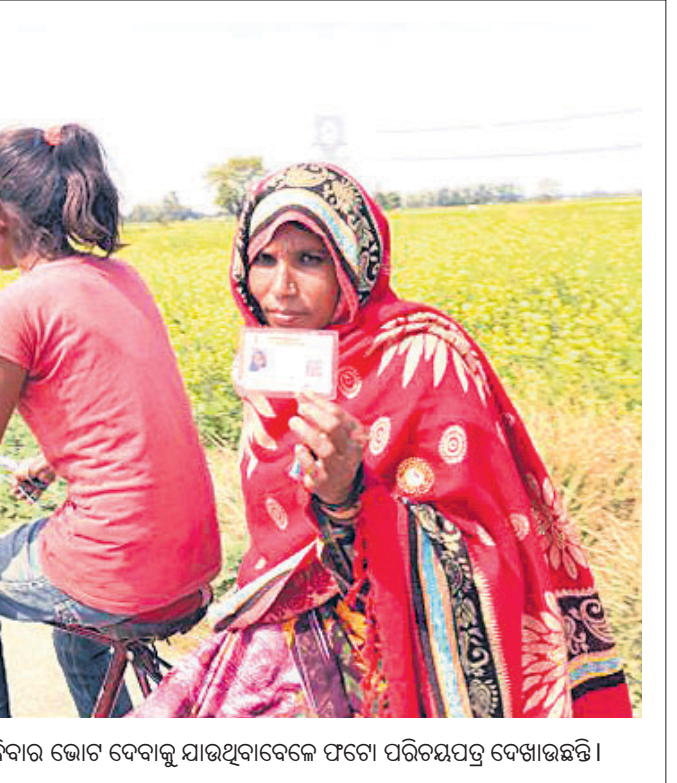
ଯୁପିର ବାରବାଙ୍କୀରେ ଜଣେ ମହିଳା ରବିବାର ଭୋଟ ଦେବାକୁ ଯାଉଥିବାବେଳେ ଫଟୋ ପରିଚୟପତ୍ର ଦେଖାଉଛନ୍ତି।

ନିର୍ବାଚନ ହିଂସା ପ୍ରତିବାଦରେ ଭାଜପା କର୍ମୀ କୋଲକାତା ପୋଲିସ୍ ଠାଣ୍ଡିଆଳୟ(ଲାଇ ବକାର)କୁ ଶୋଭାଯାତ୍ରାରେ ଯାଉଥିବାବେଳେ ସମ୍ପାନଙ୍କୁ ଅଟକା ଯାଇଛି।