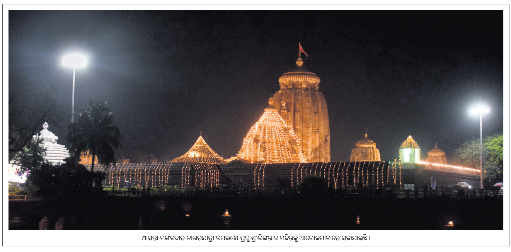
ଆସନ୍ତା ମଙ୍ଗଳବାର କାରଗରଯାତ୍ରା ଉପଲକ୍ଷେ ପ୍ରଭୁ ଶ୍ରୀଲିଙ୍ଗରାଜ ମନ୍ଦିରକୁ ଆଲୋକମାଳାରେ ସଜାଯାଇଛି।