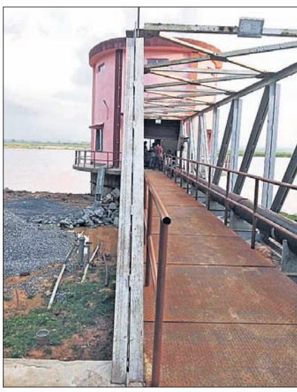
ସୁକିୟା ମେଗା ପାନୀୟକ ପ୍ରକଳ୍ପ।

ଯାକପୁର ଅଫିସ, ୨୭/୨ ଯାକପୁର ଜିଲ୍ଲା ସୁକିୟା ଖଣି ଅଞ୍ଚଳରେ ଓଏନଡିଏସି (ଓଡ଼ିଶା ନିନେରାଲ ଡିଭିଜନ୍) ଏରିଆ ଡେଭଲପମେଣ୍ଟ କର୍ପୋରେଶନ୍) ପାଣ୍ଡିରେ ନିର୍ମାଣ ହେଉଥିବା ମେଗା ପାଇପ୍ ଜଳଯୋଗାଣ ପ୍ରକଳ୍ପ-୨ରେ ବ୍ୟାପକ ତ୍ରୁଟି ହୋଇଛି। ଏହି ପ୍ରକଳ୍ପର ପ୍ରଥମ ଯୋଜନା ନିର୍ମାଣ ପ୍ରକଳ୍ପ ତ୍ରିକ ବିଭାଗୀୟ ଷ୍ଟୁଡିଓରାଲ ଡିଜାଇନ ଅନୁସାରେ ହୋଇନାହିଁ।