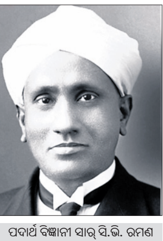
ପଦାର୍ଥ ବିଜ୍ଞାନୀ ସାର୍. ସି. ଭି. ରମଣ

ବିଜ୍ଞାନ ଦ୍ୱାରା ଯେ କୌଣସି ଦେଶ ଅବା ସମଗ୍ର ପୃଥିବୀର ବିକାଶ ସମ୍ଭବ ହୋଇ ପାରିଥାଏ। ବିଜ୍ଞାନକୁ ବିକାଶର ପାହାଚ କହିଲେ ଅତ୍ୟୁକ୍ତି ହେବ ନାହିଁ।