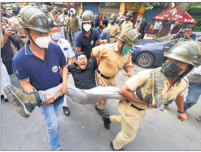
ନିର୍ବାଚନ ହିଂସା ପ୍ରତିବାଦରେ ଭାଜପା କର୍ମୀ କୋଲକାତା ପୋଲିସ୍ ଯୁଦ୍ଧାଳୟ(ଲାଇକଭାର)କୁ ଶୋଭାଯାତ୍ରାରେ ଯାଉଥିବାବେଳେ ସେମାନଙ୍କୁ ଅଟକା ଯାଇଛି।