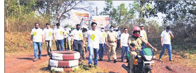
ସଚେତନତା କାର୍ଯ୍ୟକ୍ରମରେ ଚାଟାଷ୍ଟିଲ୍ କର୍ମଚାରୀ ଓ ଅତିଥିମାନେ ।