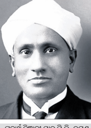
ପଦାର୍ଥ ବିଜ୍ଞାନୀ ସାର୍ ଦି.ଭି. ରମଣ

ବିଜ୍ଞାନ ଦ୍ୱାରା ଯେ କୌଣସି ଦେଶ ଅବା ସମଗ୍ର ପୃଥିବୀର ବିକାଶ ସମ୍ଭବ ହୋଇ ପାରିଥାଏ। ବିଜ୍ଞାନକୁ ବିକାଶର ପାହାଚ କହିଲେ ଅତ୍ୟୁକ୍ତି ହେବ ନାହିଁ।