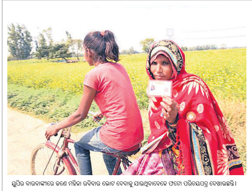
ଯୁପିର ବାରବାଙ୍କୀରେ ଜଣେ ମହିଳା ରବିବାର ଭୋଟ ଦେବାକୁ ଯାଉଥିବାବେଳେ ଫଟୋ ପରିଚୟପତ୍ର ଦେଖାଉଛନ୍ତି ।

ହାଇଦ୍ରାବାଦ, ୨୭।୨: କୋଭିଡ-୧୯ ତୃତୀୟ ଲହର ହ୍ରାସ ପାଇଥିବାବେଳେ ଜୁନ୍ ୨୨ ବେଳକୁ ଚତୁର୍ଥ ଲହର ଆସିବ ବୋଲି ଗବେଷକମାନେ ପୂର୍ବାନୁମାନ କରିଛନ୍ତି । ଏହି ଲହର ଅକ୍ଟୋବର ୨୪ ପର୍ଯ୍ୟନ୍ତ ଚାଲି ରହିବ ।