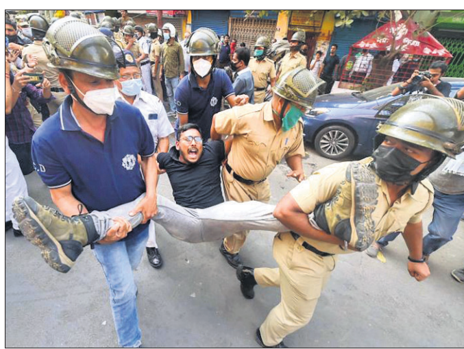
ନିର୍ବାଚନ ହିଂସା ପ୍ରତିବାଦରେ ଭାଙ୍ଗିବା କର୍ମୀ କୋଲକାତା ପୋଲିସ ମୁଖ୍ୟାଳୟ(ଲାଲ୍ ବଜାର)କୁ ଶୋଭାଯାତ୍ରାରେ ଯାଉଥିବାବେଳେ ସେମାନଙ୍କୁ ଅଟକା ଯାଇଛି ।

କୋଲକାତା, ୨୭।୨ ପଶୁମତୀ ଯୌର ସଂସ୍ଥା ପାଇଁ ରବିବାର ସକାଳେ ଆରମ୍ଭ ହୋଇଥିବାବେଳେ କେତେକ ସ୍ଥାନରେ ହିଂସାକାଣ୍ଡ ଘଟିବା ସହ ରୁଥ୍ ଜବରଦସ୍ତୀ ଓ ଲାଲ୍ ଭୋଟିଂ ଅଭିଯୋଗ ହୋଇଛି । ଫଳରେ ବିଭିନ୍ନ ରୂପରେ ମତଦାନ ବାଧାପ୍ରାପ୍ତ ହୋଇଛି ।