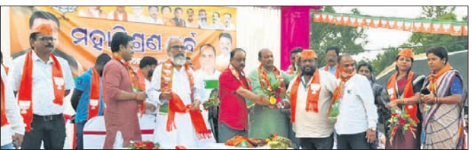
ମିଶ୍ରଣ ପର୍ବରେ ଉପସ୍ଥିତ ଭାଜପା ନେତା ।