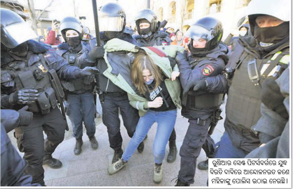
ରୁଷିଆର ସେୱା ପିଟର୍ସବର୍ଗରେ ମୁକ୍ତ ବିରତି ବାବିରେ ଆନ୍ଦୋଳନରତ ଜଣେ ମହିଳାଙ୍କୁ ପୋଲିସ୍ ଡ଼ାକି ନେଇଛି।

ଯୁଦ୍ଧନ ଉପରେ ରୁଷିଆ ଆକ୍ରମଣକୁ ନେଇ ଆମେରିକା ପୂର୍ବଦାନ ରାଷ୍ଟ୍ରପତି ଡୋନାଲ୍ଡ୍ ଟ୍ରମ୍ ନିଜ ସରକାରଙ୍କୁ ସମାଲୋଚନା କରିଛନ୍ତି। ରୁଷିଆ ରାଷ୍ଟ୍ରପତି ଭ୍ଲାଡିମିର ପୁଟିନ୍ ସମସ୍ୟା ଦୁର୍ଦ୍ଦିଗ୍ କିନ୍ତୁ ଆମ ନେତା ମୂର୍ଖ ବୋଲି ଟ୍ରମ୍ କହିଛନ୍ତି। ନିଜୀରକେଟିଙ୍ଗ୍ ପଲିଟିକାଲ୍ ଆକ୍ଟର୍ କନ୍ଫରେନ୍ସରେ ଟ୍ରମ୍ କହିଛନ୍ତି, ରାଷ୍ଟ୍ରପତି ଜୋ ବାଇଡେନ୍ଙ୍କ ଦୁର୍ବଳତା ଯୋଗୁ ରୁଷିଆ ଫିସିଥିବା ଭାରତୀୟଙ୍କୁ ଉତ୍ତର କାର୍ଯ୍ୟ କାରି ରହିଛି। ଶନିବାର ଓ ରବିବାର ୩ଟି ବିମାନରେ ୭୦୯ ଛାତ୍ରଛାତ୍ରୀଙ୍କୁ ଭାରତ ଅଣାଯାଇଛି। ଅନ୍ୟ ଛାତ୍ରଛାତ୍ରୀଙ୍କୁ ନିୟମିତ ଭାବେ ଭାରତ ଫେରାଇ ଆଣିବା ନେଇ ପ୍ରଧାନମନ୍ତ୍ରୀ ନରେନ୍ଦ୍ର ମୋଦି ରବିବାର ଭିନ୍ନ ଦୃଷ୍ଟିରେ ଦେଖୁଥିବା କେତେକ