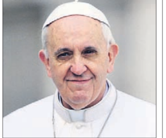
ଶାନ୍ତି ପାଇଁ ପୋପ୍ଙ୍କ ପରାମର୍ଶ

କ୍ରମାଗତ ୪ ଦିନ ହେଲା ଯୁଦ୍ଧନ ଉପରେ ରୁଷିଆ ଆକ୍ରମଣ କରି ରଖୁଥିବାବେଳେ କ୍ୟାଥୋଲିକ୍ ଚର୍ଚ୍ଚ ମୁଖ୍ୟ ପୋପ୍ ଫ୍ରାନ୍ସିସ୍ ବନ୍ଧୁକକୁ ନୀରବ କରି ହିଂସାଳାଭ ରୋକିବାକୁ ଆହ୍ୱାନ ଦେଇଛନ୍ତି। ଏଥିସହ ତୁରନ୍ତ ସେଠାରେ ମାନବୀୟ ସହାୟତା ଯୋଗାଇ ଦିଆଯିବା ଉପରେ ବୁକୁଡ଼ି ଦେଇଛନ୍ତି। ଯୁଦ୍ଧନରୁ ଅନ୍ୟ ଦେଶକୁ ଯାଉଥିବା ଶରଣାର୍ଥୀମାନେ ଆମ ପରିବାର। ସେମାନଙ୍କୁ ସମସ୍ତ ଦେଶ ସହଯୋଗ କରିବାକୁ ପୋପ୍ କହିଛନ୍ତି। କାତିସଂଘ ଶରଣାର୍ଥୀ ଏକେଡ୍