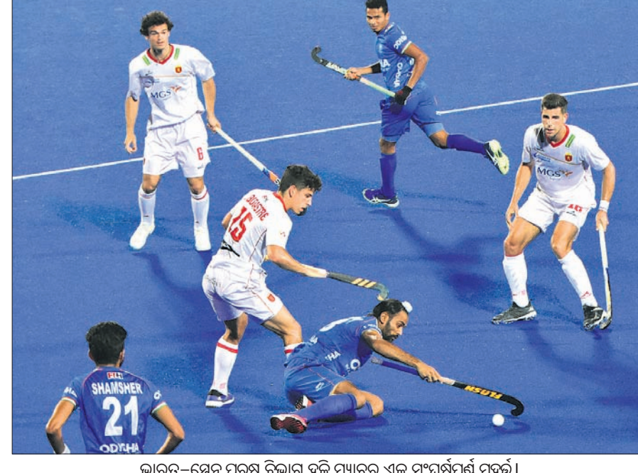
ଭାରତ-ସ୍ପେନ୍ ପୁରୁଷ ବିଭାଗ ହକି ମ୍ୟାଚର ଏକ ସଂଘର୍ଷପୂର୍ଣ୍ଣ ମୁହୂର୍ତ୍ତ।