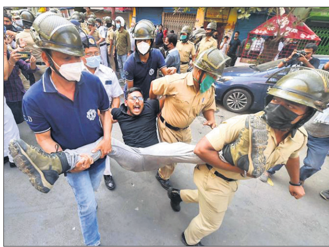
ନିର୍ବାଚନ ହିଂସା ପ୍ରତିବାଦରେ ଭାଙ୍ଗିବା କର୍ମୀ କୋଲକାତା ପୋଲିସ୍ ପୁଞ୍ଜାଳୟ(ଲାଲ୍ ବଜାର)କୁ ଶୋଭାଯାତ୍ରାରେ ଯାଉଥିବାବେଳେ ସେମାନଙ୍କୁ ଅଟକା ଯାଇଛି । ଘଟଣାସ୍ଥଳରେ ପ୍ରତିଶତ ଭୁଗମ୍ଭାବୁ(ଟିଏମ୍ପି)ଦ୍ୱାରା ରୁଥ୍ ମତଦାନ ହୋଇଥିବା ଜଣାପଡ଼ିଛି ।

କୋଲକାତା, ୨୭।୨ ପଶୁମବଳୀ ୧୦୮ ପୌର ସଂସ୍ଥା ପାଇଁ ରବିବାର ସକାଳେ ଆରମ୍ଭ ହୋଇଥିବାବେଳେ କେତେକ ସ୍ଥାନରେ ହିଂସାକାଣ୍ଡ ଘଟିବା ସହ ରୁଥ୍ ଜବରଦସ୍ତୀ ଓ ଲାଲ୍ ଭୋଟିଂ ଅଭିଯୋଗ ହୋଇଛି । ଫଳରେ ବିଭିନ୍ନ ରୂପରେ ମତଦାନ ବାଧାପ୍ରାପ୍ତ ହୋଇଛି । କାଳିପୁରରେ ବିଭିନ୍ନ ଦଳର ସମର୍ଥକମାନଙ୍କ ମଧ୍ୟରେ ସଂଘର୍ଷ ଘଟିଥିଲା । ପୁଣିବାବାଦର ବରହମ୍ପୁର ସହରରେ ପଶୁମବଳୀ କଂଗ୍ରେସ ସଭାପତି ତଥା ସ୍ଥାନୀୟ ଏମ୍ପି ଅଧୀର ରଞ୍ଜନ ଚୌଧୁରୀ ଭୋଟ ଦେବାକୁ ଯାଉଥିବାବେଳେ ତାଙ୍କୁ କେତେଜଣ ଟିଏମ୍ପି କର୍ମୀ ଅଟକାଇଥିଲେ । ସୁଦ୍ଧା ଜିଲ୍ଲାରେ ପୋଲିସ୍ ଉପରେ ଆକ୍ରମଣ ହୋଇଛି । ତେବେ ହିଂସାକାଣ୍ଡରେ କାହାର ମୃତ୍ୟୁ ହୋଇନାହିଁ ।