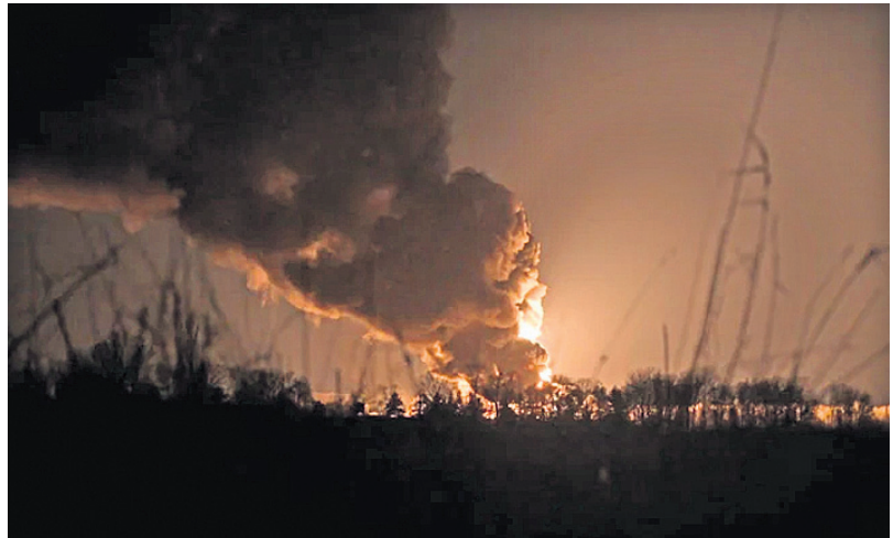
ରୁଷିଆର କ୍ଷେପଣାସ୍ତ୍ର ମାଡ଼ରେ ଯୁକ୍ରେନ୍‌ର ଭାସିଲକିଭ୍‌ସ୍କିଟ୍ ଏକ ଟେକ ଡିପୋ ଜଳିଉଠିଛି।

ବେଳାରୁ ସାମାରେ ରୁଷିଆ-ୟୁକ୍ରେନ୍ ଆଲୋଚନା ପାଇଁ ପ୍ରସ୍ତୁତ