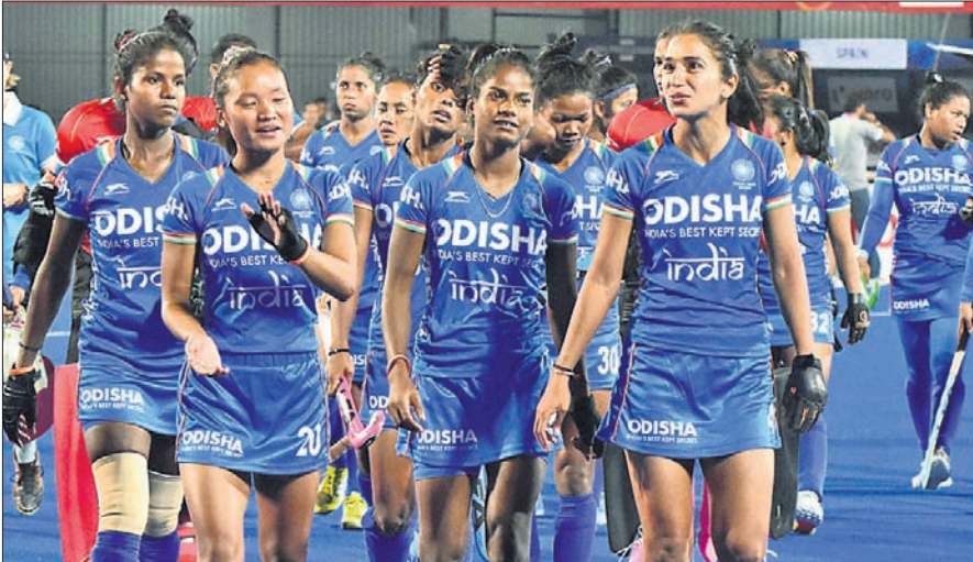
ମ୍ୟାଚ ପରେ ଭୁବନେଶ୍ୱରରେ ଭାରତୀୟ ମହିଳା ହକି ଦଳ।

ଭୁବନେଶ୍ୱର, ୨୭/୨ (କ୍ରୀଡ଼ା ପ୍ରତିନିଧି) ଏଫଆଇଏଚ୍ ପ୍ରୋ ଲିଗର ଚଳିତ ସିଜନରେ ଭାରତୀୟ ମହିଳା ହକି ଦଳ ପ୍ରଥମ ପରାଜୟ ବରଣ କରିଛି। କଳିଙ୍ଗ ଷ୍ଟାଡିୟମରେ ରବିବାର ଅନୁଷ୍ଠିତ ମ୍ୟାଚରେ ଭାରତ ୩-୪ ଗୋଲରେ ହେନ୍‌ଡୋଲ୍ ହାରିଯାଇଛି। ସେହିପରି ଭାରତୀୟ ପୁରୁଷ ହକି ଦଳ ସମାନ ପ୍ରତିସ୍ପର୍ଦ୍ଧାଠାରୁ