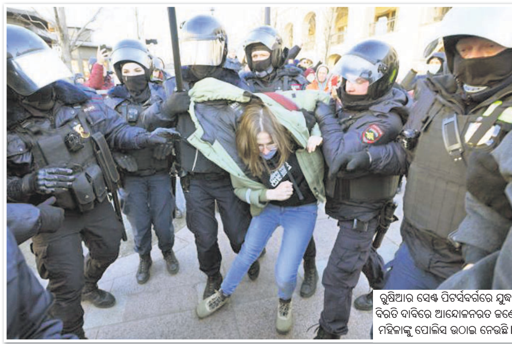
ରୁଷିଆର ସେକ୍ସ ପିଟର୍ସବର୍ଗରେ ମୁକ୍ତ ବିରତି ବାବିରେ ଆଲୋଚନାରେ ଜଣେ ମହିଳାଙ୍କୁ ପୋଲିସ୍ ଡ଼ାଇ ନେଇଛି।

ଯୁକ୍ତେନ୍ଦ୍ର ଉପରେ ରୁଷିଆ ଆକ୍ରମଣକୁ ନେଇ ଆମେରିକା ପୂର୍ବତନ ରାଷ୍ଟ୍ରପତି ଡୋନାଲ୍ଡ୍ ଟ୍ରମ୍ପ୍ ନିଜ ସରକାରଙ୍କୁ ସମାଲୋଚନା କରିଛନ୍ତି। ରୁଷିଆ ରାଷ୍ଟ୍ରପତି ଭ୍ଲାଡିମିର ପୁଟିନ୍ ସମସ୍ୟା ସୃଷ୍ଟି କିନ୍ତୁ ଆମ ନେତା ମୂର୍ଖ ବୋଲି ଟ୍ରମ୍ପ୍ କହିଛନ୍ତି। କଞ୍ଚିତଭେତିକ୍ ପଲିଟିକାଲ୍ ଆକ୍ଟ୍ କନ୍ସପ୍ରେଡ୍ରେ ଟ୍ରମ୍ପ୍ କହିଛନ୍ତି, ରାଷ୍ଟ୍ରପତି କୋ ବାଲଡେନ୍ସ୍କି ଟ୍ରମ୍ପ୍ କତା ଯୋଗୁ ରୁଷିଆ ଯୁକ୍ତେନ୍ଦ୍ର ଉପରେ ଆକ୍ରମଣ କରିଛି। ଯଦି ଆମେରିକା ରାଷ୍ଟ୍ରପତି ନିର୍ବାଚନ ନିରପେକ୍ଷ ହୋଇଥାନ୍ତା ତେବେ ଏପରି ଭୟଙ୍କର ସ୍ଥିତି ଉତ୍ପତ୍ତି ନ ଥାନ୍ତା। ନାଟୋ ମଧ୍ୟ ରୁଷିଆର ମନୋବଳ ଭାଙ୍ଗିବା ବଦଳରେ କେବଳ କଟକଣା ଲଗାଇ ଚତୁରତାର ପରିଚୟ ଦେଇଥି