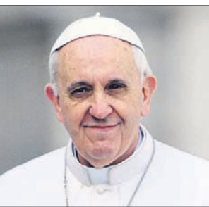
ଶାନ୍ତି ପାଇଁ ପୋପଙ୍କ ପରାମର୍ଶ

କ୍ରମାଗତ ୪ ଦିନ ହେଲା ଯୁକ୍ତେନ୍ଦ୍ର ଉପରେ ରୁଷିଆ ଆକ୍ରମଣ କରି ରଖୁଥିବାବେଳେ କ୍ୟାଥୋଲିକ୍ ଚର୍ଚ୍ଚ ମୁଖ୍ୟ ପୋପ୍ ଫ୍ରାନ୍ସିସ୍ ବନ୍ଧୁକକୁ ନୀରବ କରି ହିଂସାକାଣ୍ଡ ରୋକିବାକୁ ଆହ୍ୱାନ ଦେଇଛନ୍ତି। ଏଥିସହ ତୁରନ୍ତ ସେଠାରେ ମାନବୀୟ ସହାୟତା ଯୋଗାଇ ଦିଆଯିବା ଉପରେ ଗୁରୁତ୍ୱ ଦେଇଛନ୍ତି। ଯୁକ୍ତେନ୍ଦ୍ର ଅନ୍ୟ ଦେଶକୁ ଯାଉଥିବା ଶରଣାର୍ଥୀମାନେ ଆମ ପରିବାର। ସେମାନଙ୍କୁ ସମସ୍ତ ଦେଶ ସହଯୋଗ କରିବାକୁ ପୋପ୍ କହିଛନ୍ତି। କାଗିତସଂଘ ଶରଣାର୍ଥୀ ଏକେଡ୍