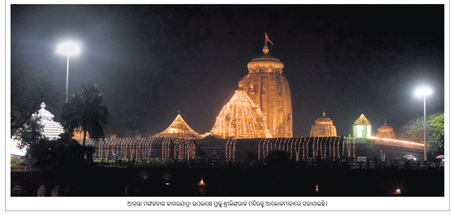
ଆସନ୍ତା ମଙ୍ଗଳବାର କାଗରଯାତ୍ରା ଉପଲକ୍ଷେ ପ୍ରଭୁ ଶ୍ରୀଲିଙ୍ଗରାଜ ମନ୍ଦିରକୁ ଆଲୋକମାଳାରେ ସଜାଯାଇଛି।

ରାଜ୍ୟରେ କରୋନା ସଂକ୍ରମଣ କମିବାରେ ଲାଗିଛି। ଗତ ୨୪ ଘଣ୍ଟାରେ ମୋଟ ୫୪,୦୯୭ ନମୁନା ପରୀକ୍ଷା କରାଯାଇଥିବାବେଳେ ୨୫୨୫୫ ପଜିଟିଭ୍ ବାହାରିଛନ୍ତି। ୮୩୫୫ ୧୮୧୨୫୫ କମ୍ ବୟସ୍କ ରହିଛନ୍ତି। ଫଳରେ ସୈନିକ ସଂକ୍ରମଣ ହାର ୦.୪୬%କୁ ଖସି ଆସିଛି। ନୂଆ ଆକ୍ରାନ୍ତଙ୍କ ମଧ୍ୟରେ ଖୋର୍ଦ୍ଧା ଜିଲ୍ଲାରେ ସର୍ବାଧିକ ୩୩୫୫ ଅଛନ୍ତି। ତେବେ ବରଗଡ଼, ମାଲକାନଗିରି, ଦେବଗଡ଼, ଜେକାନାଳ ଓ ନୂଆପଡ଼ା ଆଦି ୫ ଜିଲ୍ଲାରେ ୧,୪୭୫ ନମୁନା ପରୀକ୍ଷା କରାଯାଇଥିଲେ ମଧ୍ୟ କୌଣସି ଆକ୍ରାନ୍ତ ବିକୃତ ହୋଇନାହାନ୍ତି। ଫଳରେ ଏସବୁ ଜିଲ୍ଲାରେ ସଂକ୍ରମଣ ହାର ୦% ରହିଛି। ସେହିଭଳି ରାଜ୍ୟରେ ଆଉ ୮ ଆକ୍ରାନ୍ତଙ୍କ ମୃତ୍ୟୁ ଘଟିଛି। ଏମାନଙ୍କ ମଧ୍ୟରେ ଅନୁଗୋଳ ଓ ନୟାଗଡ଼ ଜିଲ୍ଲା ୨୫୫ ଜଣଙ୍କର ଥିବାବେଳେ ବାଲେଶ୍ୱର, ଜେକାନାଳ, ଖୋର୍ଦ୍ଧା ଓ ସମ୍ବଲପୁର ଜିଲ୍ଲାକୁ କଣ୍ଠେ ଲେଖାଏ ରହିଛନ୍ତି। ଏହାକୁ ମିଶାଇ ରାଜ୍ୟରେ ମୋଟ କରୋନାଜନିତ ମୃତ୍ୟୁ ସଂଖ୍ୟା ୯,୦୬୪କୁ ବୃଦ୍ଧି ପାଇଛି।