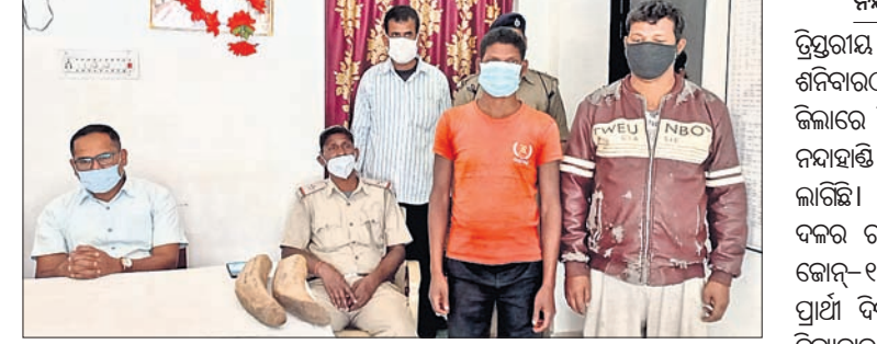
ଜବତ ହାତୀଦାନ୍ତ ସହ ଗିରଫ ଅଭିଯୁକ୍ତ।