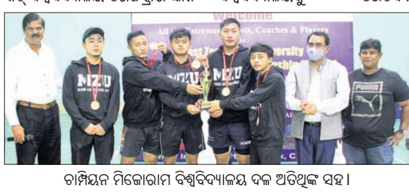
ଚାମ୍ପିୟନ୍ ମିତ୍ରୋତାମ ବିଶ୍ଵବିଦ୍ୟାଳୟ ସଭାପତିଙ୍କ ସହ

ଭୁବନେଶ୍ଵର, ୨୮।୨ (କ୍ରୀଡ଼ା ପ୍ରତିନିଧି): ବିଶ୍ଵବିଦ୍ୟାଳୟ ମିତ୍ରୋତାମ ବିଶ୍ଵବିଦ୍ୟାଳୟ ଚାମ୍ପିୟନ୍