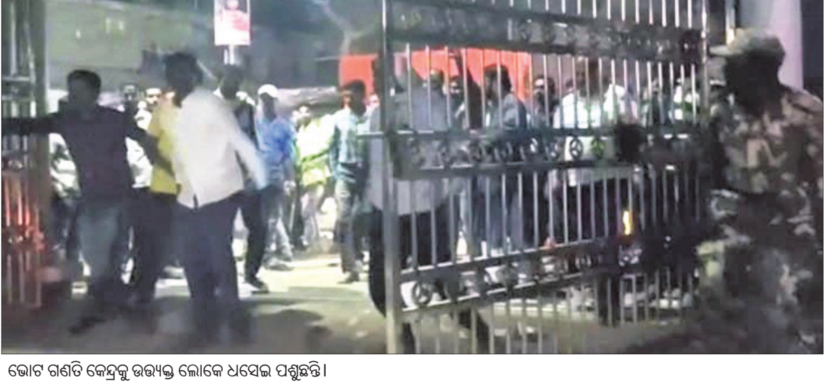
ଭୋଟ ଗଣତି କେନ୍ଦ୍ରକୁ ଉଦ୍ୟତ୍ତ ଲୋକେ ଧସଇ ପଶୁଛନ୍ତି ।