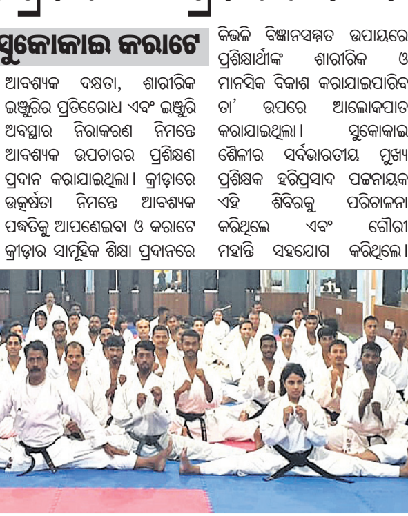
ପ୍ରଶିକ୍ଷଣ ଶିବିରରେ ଯୋଗ ଦେଇଥିବା ବିଭିନ୍ନ ରାଜ୍ୟର କରାଟେକାରୀ