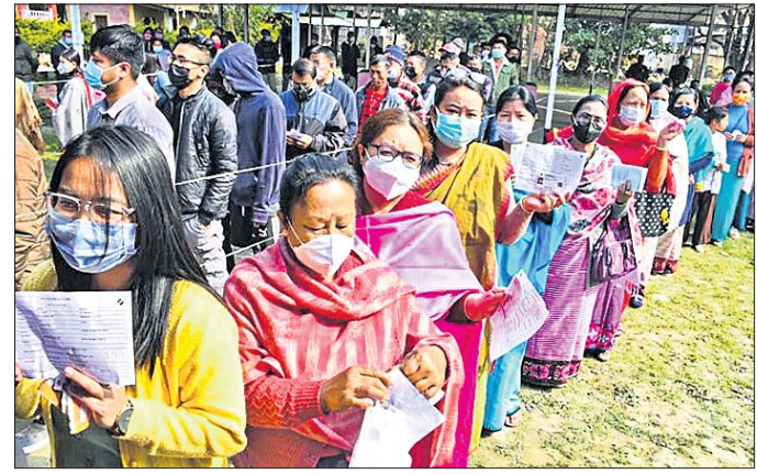
କଙ୍ଗ ପୋଲିସ ଜିଲ୍ଲାର ଏକ ବୁଥକୁ ଭାଙ୍ଗିବା ଦଶକ୍ଷିଣ କଂଗ୍ରେସ ଅଭିଯୋଗ କରିବା ପରେ ଏହାକୁ ନେଇ ଉଭେଜନା ଦେଖାଯାଇଥିଲା। ଉଭୟ ଲୋକଙ୍କୁ ଉଦ୍ଧାରକାରୀ ପାଇଁ ସୁରକ୍ଷା ଦିଆଯାଇଛି।