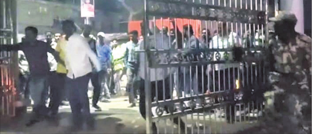
ଭୋଟ ଗଣତି କେନ୍ଦ୍ରକୁ ଉତ୍ତ୍ୟକ୍ତ ଲୋକେ ଧସେଇ ପଶୁଛନ୍ତି ।

ବାଲେଶ୍ୱର ଜିଲା ଭୋଗରାଇ ଆରମ୍ଭାବଦ୍ୟ ପହଞ୍ଚିବ୍ୟାକୟ ଭୋଟ ଗଣତି କେନ୍ଦ୍ରରେ ନାରଣମହାନ୍ତିପତିଆ ପଞ୍ଚାୟତରେ ଜଣେ ପ୍ରାର୍ଥୀ ବିଜୟୀ ହେବା ପରେ ପୁନଃ ଗଣତି ଦାବି କରି ସୋମବାର ରାତିରେ ବୁଲି ଦଳ ମଧ୍ୟରେ ତୀବ୍ର ଉତ୍ତେଜନା ଦେଖାଦେଇଥିଲା । ଉତ୍ତ୍ୟକ୍ତ ଲୋକେ ଭୋଟ ଗଣତି କେନ୍ଦ୍ର କଲେଜ ପୁଖ୍ୟ ଫାଟକ ଠେଲି ପଶିବା ପରେ ନିର୍ବାଚନ ଅଧିକାରୀଙ୍କୁ ଖୋଜି ହୋଇଥିଲେ । ଜଣେ ପ୍ରାର୍ଥୀଙ୍କ ସମର୍ଥନକାରୀମାନେ କଲେଜ ଫାଟକ ସମ୍ମୁଖ ରାସ୍ତାକୁ ଗନ୍ଧାର ଜାଳି ରାସ୍ତା ଅବରୋଧ କରି ନାରୀବାଜି ପ୍ରଦର୍ଶନ କରିଥିଲେ । ପୋଲିସ୍ ପହଞ୍ଚି ଛୁଟି ଉପରେ ନଜର ରଖିଛି । ଖବର ଲେଖା ହେବା ପର୍ଯ୍ୟନ୍ତ ଉତ୍ତେଜନା ଲାଗି ରହିଛି ।