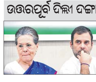
ରିଟ୍ ପିଟିଶନରେ ସେମାନଙ୍କୁ କାର୍ଯ୍ୟକ୍ଷମ କରିବାକୁ ଆଦେଶ ଦିଆଯାଇଛି। ସେହିପରି ଅନ୍ୟ ଏକ ପିଟିଶନ ଆଧାରରେ ଭାଜପା ନେତା କପିଳ ମିଶ୍ରା, ଅରୁଣା ଠାକୁର, ପରେଶ୍ୱରୀ ବର୍ମା ଏବଂ ଅଭୟ ବର୍ମାଙ୍କୁ ମଧ୍ୟ ହାଇକୋର୍ଟ ନୋଟିସ ଜାରି କରିଛନ୍ତି। ସୂଚନାଯୋଗ୍ୟ, ୨୦୨୦ ଫେବୃଆରୀ ୨୩ରେ ଆରମ୍ଭ ହୋଇଥିବା ଉତ୍ତରପ୍ରଦେଶ ଦିଲ୍ଲୀ ଦଳରେ ୫୩ ଜଣଙ୍କ ମୃତ୍ୟୁ ହେବା ସହ ସମ୍ପୂର୍ଣ୍ଣ ନଷ୍ଟ ହୋଇଥିଲା।

ନୂଆଦିଲ୍ଲୀ, ୨୮/୧୨ ଉତ୍ତରପ୍ରଦେଶ ଦିଲ୍ଲୀ ଦଳ ମାମଲାରେ ଦିଲ୍ଲୀ ହାଇକୋର୍ଟ କଂଗ୍ରେସ ଅଧ୍ୟକ୍ଷ ସୋନିଆ ଗାନ୍ଧୀ, ରାହୁଲ ଗାନ୍ଧୀ, ପ୍ରିୟଙ୍କା ଗାନ୍ଧୀ ଭଦ୍ରା, ଏବଂ ନେତା ମନିଷ ସିଂହୋଡ଼ିଆ ଏବଂ ଅମନଜୁଲ୍ଲା ଖାନ୍ଙ୍କୁ ସୋମବାର ନୋଟିସ ଜାରି କରିଛନ୍ତି। ୨୦୨୦ର ଏହି ଦଳ ପୂର୍ବରୁ ଉପରୋକ୍ତ ନେତାମାନେ ଉଭେଜନାପୂର୍ଣ୍ଣ ଭାଷଣ ଦେଇଥିବା ଅଭିଯୋଗ ହୋଇଥିଲା। ସେମାନଙ୍କୁ ମାମଲାରେ ପକ୍ଷଭାବେ ସାମିଲ କରିବା ସହ ସେମାନଙ୍କ ବିରୋଧରେ ଏତଲା ଦାଏର ପାଇଁ ହାଇକୋର୍ଟରେ ରିଟ୍ ପିଟିଶନ ଦାଏର ହୋଇଥିଲା। ଅନ୍ୟମାନଙ୍କ ମଧ୍ୟରେ ଏଆଇଏମ୍‌ଆଇଏମ୍ ନେତା ଖୁରିୟ୍ ପାଠାନ, ଆକବରୁଦ୍ଦିନ ଓଝାଲସି, ମେହମୁଦ୍ ପ୍ରାଗ, ହର୍ସ ମନ୍ଦର ଏବଂ ଅଭିନେତ୍ରୀ ସ୍ୱରା ଭାଷକଙ୍କୁ ମଧ୍ୟ ନୋଟିସ ଜାରି ହୋଇଛି।