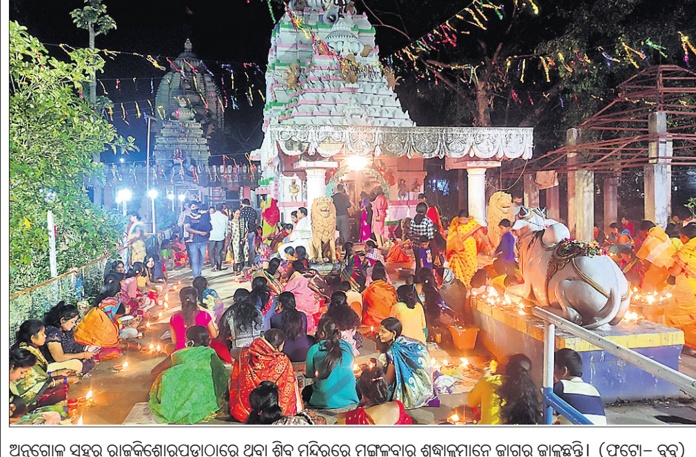
ଅନୁଗୋଳ ସହର ରାଜକିଶୋରପଡ଼ାଠାରେ ଥିବା ଶିବ ମନ୍ଦିରରେ ମଙ୍ଗଳବାର ଶ୍ରଦ୍ଧାଳୁମାନେ ଜାଗର କାଳୁଛନ୍ତି।

ମନ୍ଦିର ୩୨ ଡମ୍ ପ୍ରତିଷ୍ଠା ଉତ୍ସବ ସହ ଜାଗରଯାତ୍ରା ଅନୁଷ୍ଠିତ ହୋଇଥିଲା। ଏହି ଅବସରରେ ମନ୍ଦିରର ମୁଖ୍ୟ ସେବକ ଆକୃଳ ପଣ୍ଡାଙ୍କ ଯୋଗଦେଖିରେ ମଙ୍ଗଳବାର ମହାଶିବରାତ୍ରି ପାଳିତ ହୋଇଯାଇଛି।