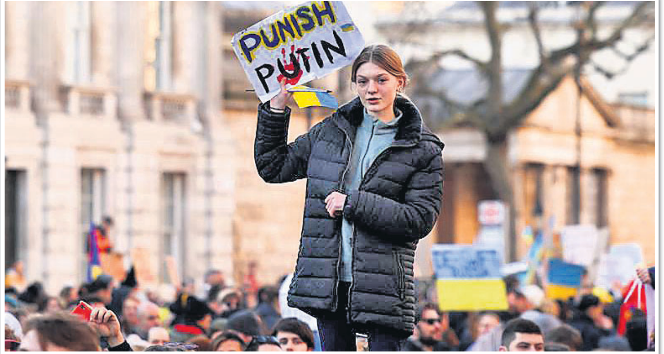
ୟୁକ୍ରେନ୍ ଆନ୍ତର୍ଜାତୀୟ ପ୍ରତିବାଦରେ ଯୋଗାଣ କରାଯାଇଥିବା ଯୁବକମାନଙ୍କ ଦ୍ୱାରା ଉପସ୍ଥାପିତ ହୋଇଥିବା ପ୍ରତିବାଦରେ ପୁଟିନ୍‌ଙ୍କୁ ଦଣ୍ଡିତ କରିବାକୁ ଦାବି କରାଯାଇଛି ।