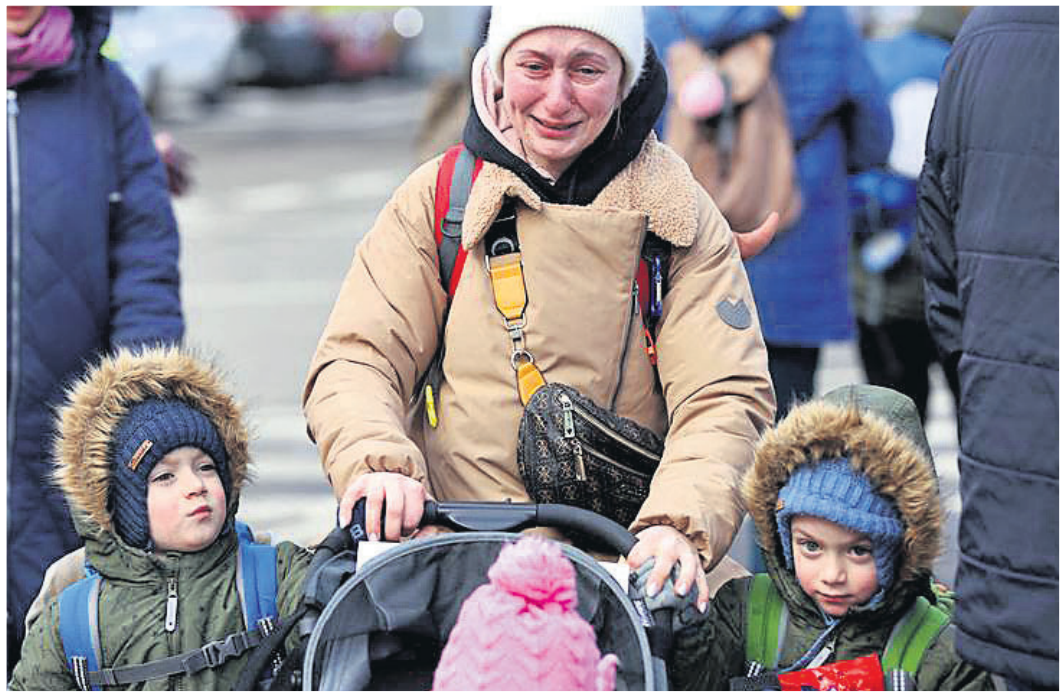
ୟୁକ୍ରେନ୍‌ରୁ ଯୋଗାଣ କରାଯାଇଥିବା ଉତ୍ତମ ଶିଳ୍ପୀଙ୍କ ଦ୍ୱାରା ତିଆରି କରାଯାଇଥିବା ଶିଶୁମାନଙ୍କୁ ଯତ୍ନ ସହାୟତା ପ୍ରଦାନ କରିବା ପାଇଁ ପିଲାଙ୍କୁ ଧରି କାରୁକଳା କରାଯାଇଛି ।