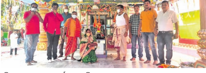
ମନ୍ଦିରରେ ଶ୍ରଦ୍ଧାଳୁମାନେ ଦର୍ଶନ କରୁଛନ୍ତି।