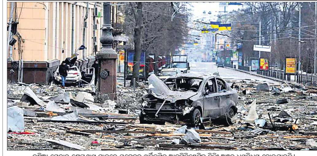
ରୁଷିଆ ସେନାର କ୍ଷେପଣାସ୍ତ୍ର ମାଡ଼ରେ ୟୁକ୍ରେନ୍‌ର ଖର୍କିଭରେ ଆତ୍ମନିଷ୍ଠେତ୍ୱ ବିକ୍ଷୁ ଅଞ୍ଚଳ ଧ୍ୱସ୍ତପୂର୍ଣ୍ଣ ହୋଇଯାଇଛି।