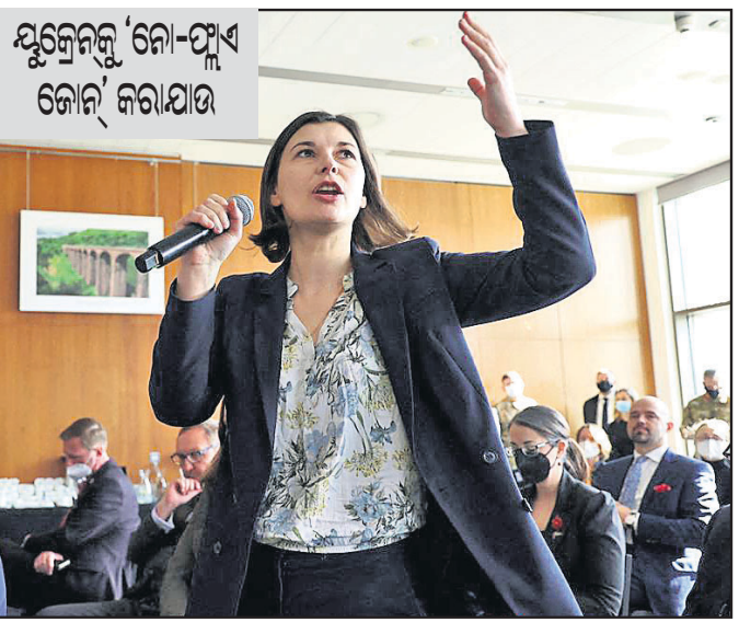
ୟୁକ୍ରେନ୍‌କୁ 'ନୋ-ଫ୍ଲାଏ ଜୋନ୍' କରାଯାଉ