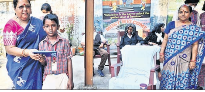
ଜାତୀୟ ବିଜ୍ଞାନ ଦିବସ ପାଳନ ଅବସରରେ କୃତୀ ଛାତ୍ରଙ୍କୁ ପୁରସ୍କୃତ କରାଯାଇଛି।