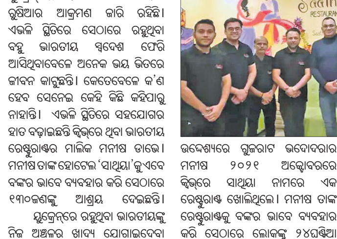
ଭବେଶ୍ୟରେ ରୁକ୍ମିଣୀ ଉଦ୍ଘୋଷଣାରେ ମନାସ ୨୦୨୧ ଅଭିଭାବରେ କୁଭରେ ସାଥୁୟା ନାମରେ ଏକ ରେଷ୍ଟୁରାଣ୍ଟ ଖୋଲିଥିଲେ। ମନାସ ତାଙ୍କ ରେଷ୍ଟୁରାଣ୍ଟକୁ ବଙ୍କର ଭାବେ ବ୍ୟବହାର କରି ସେଠାରେ ଲୋକଙ୍କୁ ୪୪୫୫୫୫