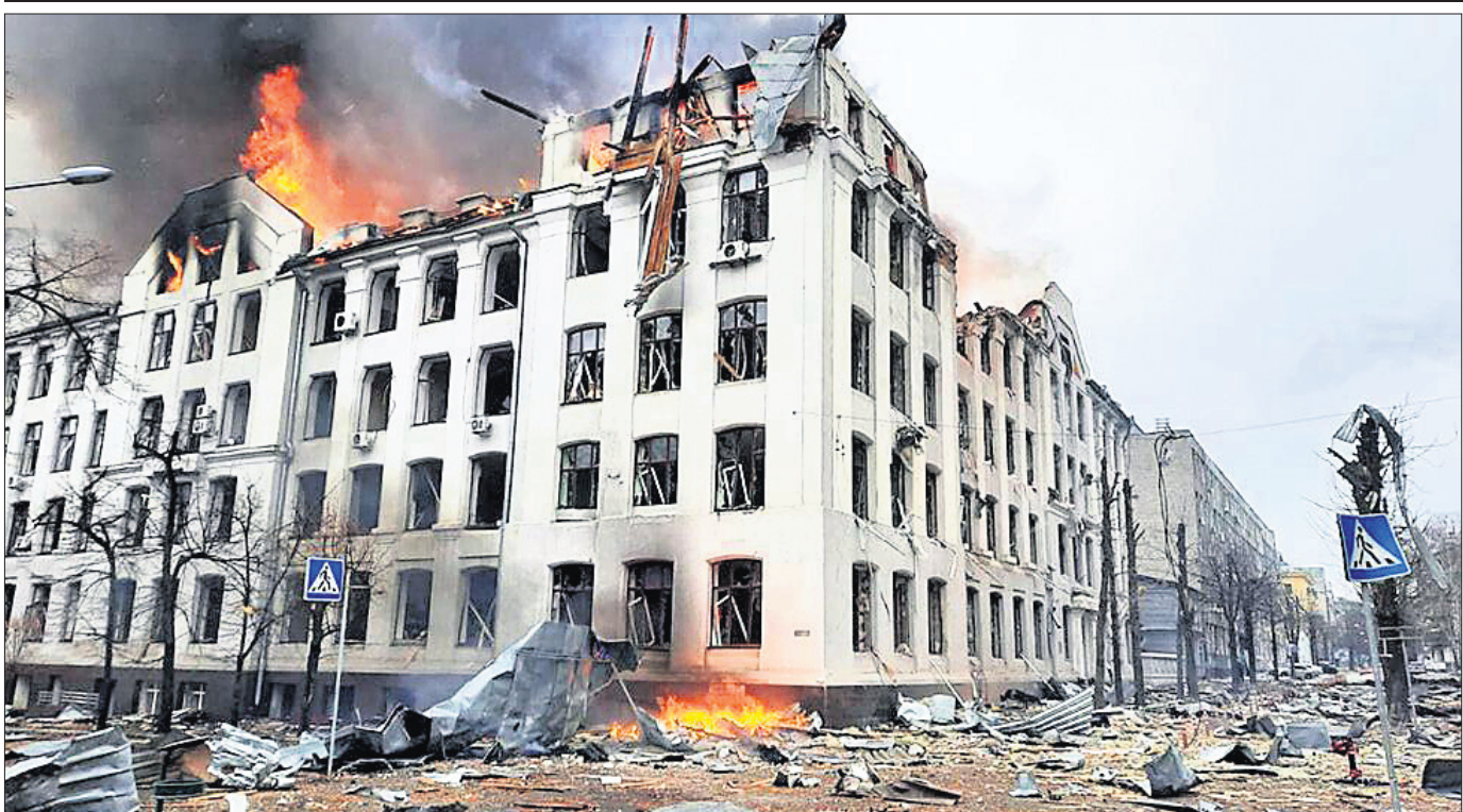
ରୁଷୀୟ ସୈନ୍ୟଙ୍କ ଆକ୍ରମଣରେ ଧ୍ୱସ୍ତବିଧି ଖର୍କିଭ୍ ଅଞ୍ଚଳରେ ଖେରସୋନ୍ ଧ୍ୱଂସ ହୋଇଛି।

ଖର୍କିଭ୍ ଧ୍ୱଂସସ୍ତୂପ, କ୍ରେମ୍ଲିନ ଦଖଲରେ ଖେରସୋନ୍