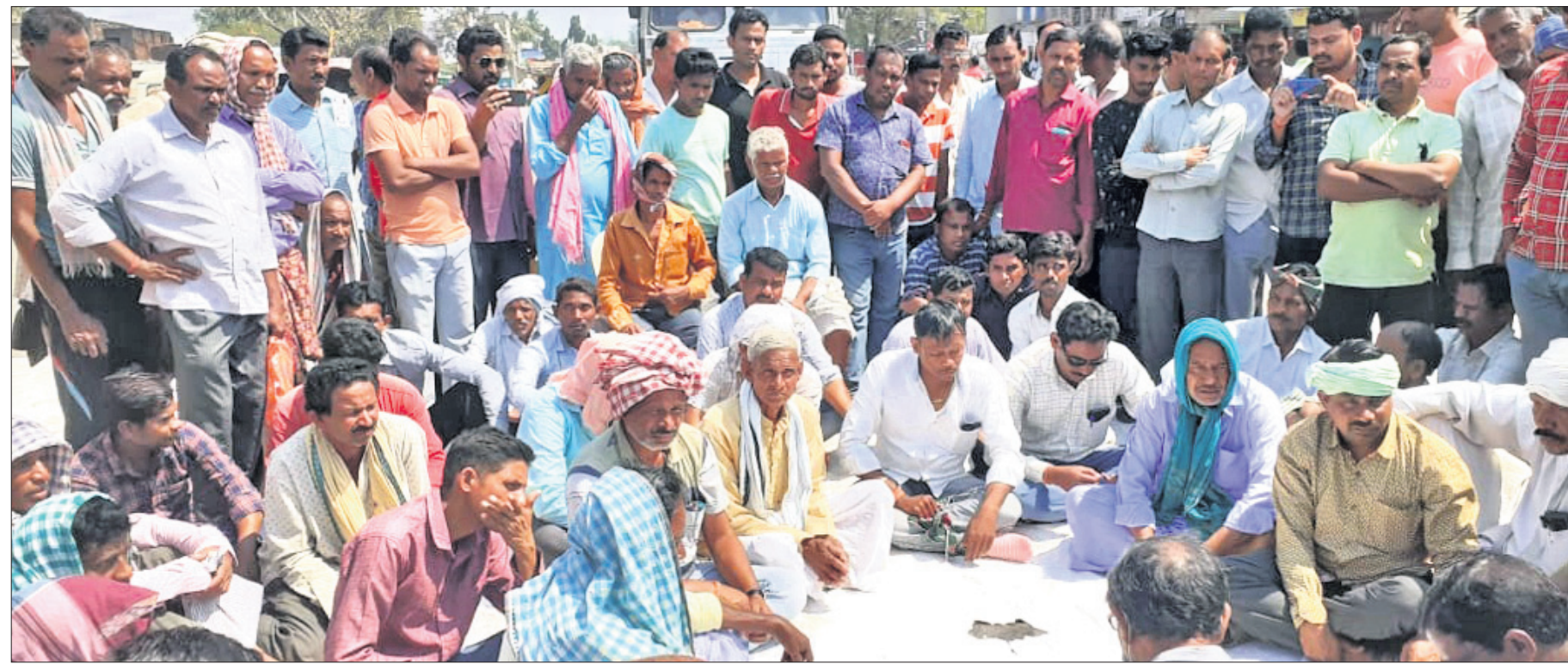
ଗଣମାନେ ସୋହେଲା ଥାନା ଛକଠାରେ ରାୟପୁର-ସମ୍ବଲପୁର ଜାତୀୟ ରାଜପଥ ଅବରୋଧ କରିଛନ୍ତି ।