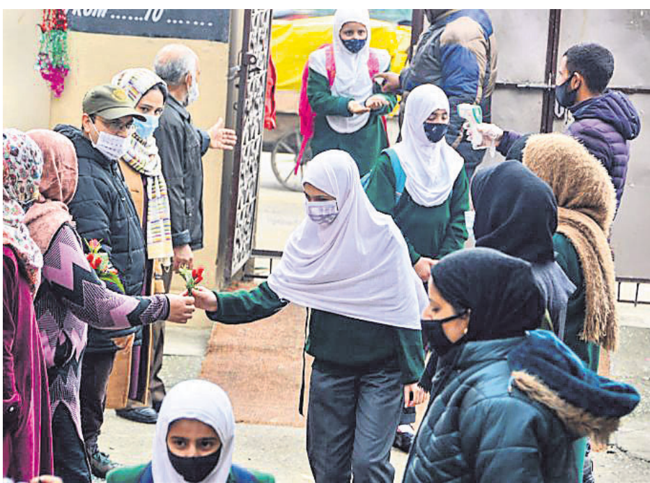
ଶ୍ରୀନଗରରେ ରୁଧିରୀତ ସ୍କୁଲ ଖୋଲିବା ପରେ ପ୍ରଥମ କରି ଆସିଥିବା ଛାତ୍ରାଛାତ୍ରୀମାନଙ୍କୁ ଶିକ୍ଷୟିତ୍ରୀ ଶିକ୍ଷକ ଫୁଲ ଦେଇ ସ୍ୱାଗତ କରୁଛନ୍ତି।