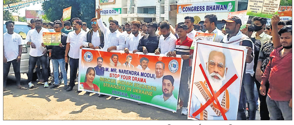
କଂଗ୍ରେସ ଭବନ ସମ୍ମୁଖରେ ଛାତ୍ର କଂଗ୍ରେସ ପକ୍ଷରୁ ବିକ୍ଷୋଭ ପ୍ରଦର୍ଶନ କରାଯାଇଛି ।