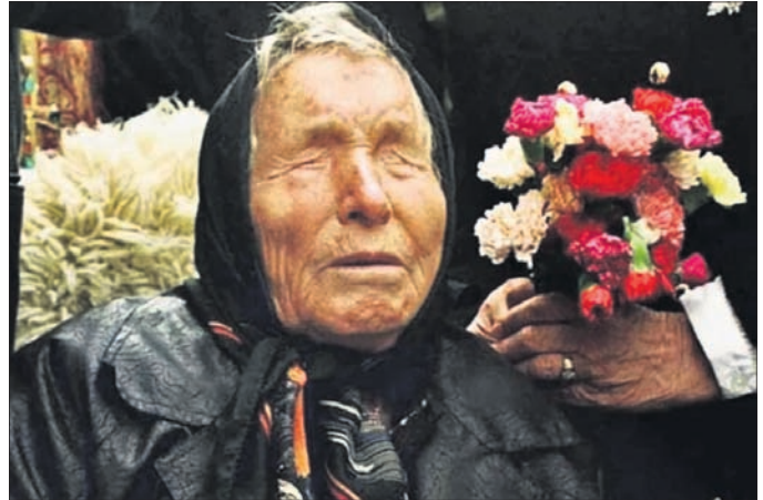
କୁର୍ଣ୍ଣ ଆଣବିକ ବୁଢ଼ାଜାହାଜ ଟ୍ରାଡେଜି

ରୁଷିଆର ଏହି ବୁଢ଼ାଜାହାଜ ବୁଢ଼ିଯିବ ବୋଲି ବାବା ଭେଙ୍ଗା ପୂର୍ବରୁ ଭବିଷ୍ୟବାଣୀ କରିଥିଲେ। ୧୯୮୦ରେ ଭେଙ୍ଗା କହିଥିଲେ, ୧୯୯୯ ଅଗଷ୍ଟରେ କୁର୍ଣ୍ଣ ଜଳମଗ୍ନ ହୋଇଯିବ ଏବଂ ଏହାକୁ ନିଶୋକ ହୋଇଯାଇଥିବା ସମୟରେ ପ୍ରଥମ ଦୃଷ୍ଟିଗ୍ରସ୍ତ ଅନୁଭୂତି ଲାଭ କରିଛନ୍ତି। ଏହା ପରେ ସେ ଲୋକଙ୍କୁ ଆରୋଗ୍ୟ କରି ଭବିଷ୍ୟବାଣୀ କରିବା ଲାଗି ଶକ୍ତି ପ୍ରାପ୍ତ ହୋଇଛନ୍ତି।