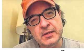
ଲୋକ୍ଷକ ଗୋଷାଲୋ ଲିରା

କିଛି ୨୩୩ ଯୁକ୍ତେନ୍ଦ୍ର ଉପରକୁ ଚାଲି ଯିବାର ସୈନ୍ୟଙ୍କ ଆକ୍ରମଣ ସାଙ୍ଗକୁ ଦେଶରେ ବଢ଼ିଚାଲିଛି ହତ୍ୟା, ବଳାହାର ଏବଂ ଲୁଟ୍ ଭଳି ଅନେକ ଅପରାଧିକ କାରବାର । ରାଷ୍ଟ୍ରପତି କେଲେନସିଙ୍କ ଆହ୍ୱାନକ୍ରମେ ଯୁକ୍ତେନ୍ଦ୍ରର ସାଧାରଣ ଜନତାଙ୍କଠାରୁ ଆରମ୍ଭ କରି କର୍ବଦା ରୁଷିଆ ସୈନ୍ୟ ବିରୋଧରେ ଅସ୍ତ୍ର ଉଠାଇଛି । ଅପରାଧୀମାନେ ସୈନ୍ୟ ଅସ୍ତ୍ର ଧରି ଦେଶରେ ଖୋଲାଖୋଲି ଭାବେ ଲୋକଙ୍କୁ ଡରା ଧମକ ଦେଇ ଲୁଟ୍‌ପାଟ୍ କରୁଥିବାବେଳେ ମହିଳାଙ୍କୁ ବଳାହାର ସାଙ୍ଗକୁ ହତ୍ୟା କରୁଥିବା ଦେଖିବାକୁ ମିଳିଛି । ଯୁକ୍ତେନ୍ଦ୍ରର ଗୋଷାଲୋ ଯୁକ୍ତେନ୍ଦ୍ରରେ ବଢ଼ିଛି ହତ୍ୟା, ବଳାହାର ଓ ଲୁଟ୍