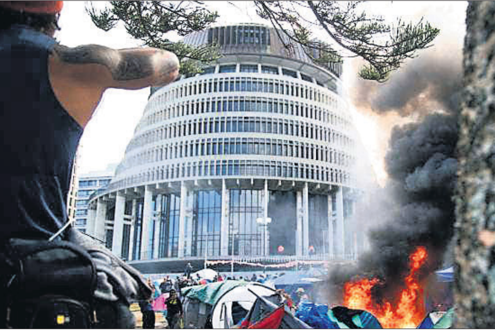
ଲୁକ୍‌ଜିଲ୍ଲାଣ୍ଡ ପାର୍ଲିମେଣ୍ଟ ପରିସରରେ ବିରୋଧକାରୀ ନିଆଁ ଲଗାଇଦେଇଛନ୍ତି। ପ୍ରଦର୍ଶନ ଜାରି ଥିବାବେଳେ ରୁଧିରୀତ ପୋଲିସ୍ ରାସ୍ତାକୁ ଏହି ଗାଡ଼ି ସବୁକୁ ବନ୍ଦ କରିଛନ୍ତି। ଦୀର୍ଘ ୨୩ ଦିନ ଧରି ପୋଲିସ୍ ଅପିସର ଆହତ ହୋଇଛନ୍ତି। ପାର୍ଲିମେଣ୍ଟ ଗ୍ରାଉଣ୍ଡରେ ଅଗ୍ନିକାଣ୍ଡ ଘଟିବା ପରେ ପ୍ରଦର୍ଶନକାରୀ ଚାଲିଯିବାର ସୂଚନା ମିଳିଥିଲା।

କୋଭିଡ୍-୧୯ ପ୍ରାଣାନ୍ତରୀଣ ଚିକିତ୍ସାକର୍ମ ବିରୋଧ କରି ଲୁକ୍‌ଜିଲ୍ଲାଣ୍ଡ ରାଜଧାନୀ ଫ୍ରେଲିଙ୍ଗଫର୍ଡରେ ୨୩ ଦିନ ଧରି ଜାରି ରହିଛି ବିରୋଧ। ବିରୋଧକାରୀମାନେ ଫ୍ରେଲିଙ୍ଗଫର୍ଡରେ ଥିବା ପାର୍ଲିମେଣ୍ଟ ଗ୍ରାଉଣ୍ଡରେ ଚେଷ୍ଟା ବାଧି ପ୍ରତିବାଦ କରୁଥିବାବେଳେ ରୁଧିରୀତ ପୋଲିସ୍ ଓ ସେମାନଙ୍କ ମଧ୍ୟରେ ସଂଘର୍ଷ ଦେଖିବାକୁ ମିଳିଥିଲା। ପ୍ରଦର୍ଶନକାରୀଙ୍କୁ ପାର୍ଲିମେଣ୍ଟ ଗ୍ରାଉଣ୍ଡରୁ ହଟାଇବା ପାଇଁ ପୋଲିସ୍ ସେମାନଙ୍କ ଉପରକୁ ଉଦ୍‌ବଳ ବୁଲାଇ ପ୍ରୟୋଗ କରିଥିଲା। ବୁଲ ଗୋଷ୍ଠୀ ସଂଘର୍ଷ କିନ୍ତୁ ପାର୍ଲିମେଣ୍ଟ ଗ୍ରାଉଣ୍ଡରେ ଥିବା ଚେଷ୍ଟାରେ ବିରୋଧକାରୀମାନେ ନିଆଁ ଲଗାଇଦେଇଥିଲେ। ଘଟଣାର ସୂଚନା ପାଇ ଅଗ୍ନିଶମ ବିଭାଗ ସେଠାରେ ପହଞ୍ଚି ନିଆଁକୁ ଆୟତ୍ତ କରିଥିଲା। ନିଆଁ ଲାଗିବା ବାବୁ ୫,୭୨,୦୦୦ ଡଲାରରେ ତିଆରି ପାର୍ଲିମେଣ୍ଟ ଗ୍ରାଉଣ୍ଡର ଅଧିକାଂଶ ଭାଗ ନଷ୍ଟ ହୋଇଯାଇଛି। ଚିକିତ୍ସାକର୍ମ ବିରୋଧ କରୁଥିବା ଲୋକେ ଫ୍ରେଲିଙ୍ଗଫର୍ଡ ପ୍ରପୁଷ୍ଟ ରାସ୍ତାରେ କାର୍, ଟ୍ରକ୍, ରଥ୍ ରାସ୍ତା ବନ୍ଦ କରିଛନ୍ତି। ଦୀର୍ଘ ୨୩ ଦିନ ଧରି