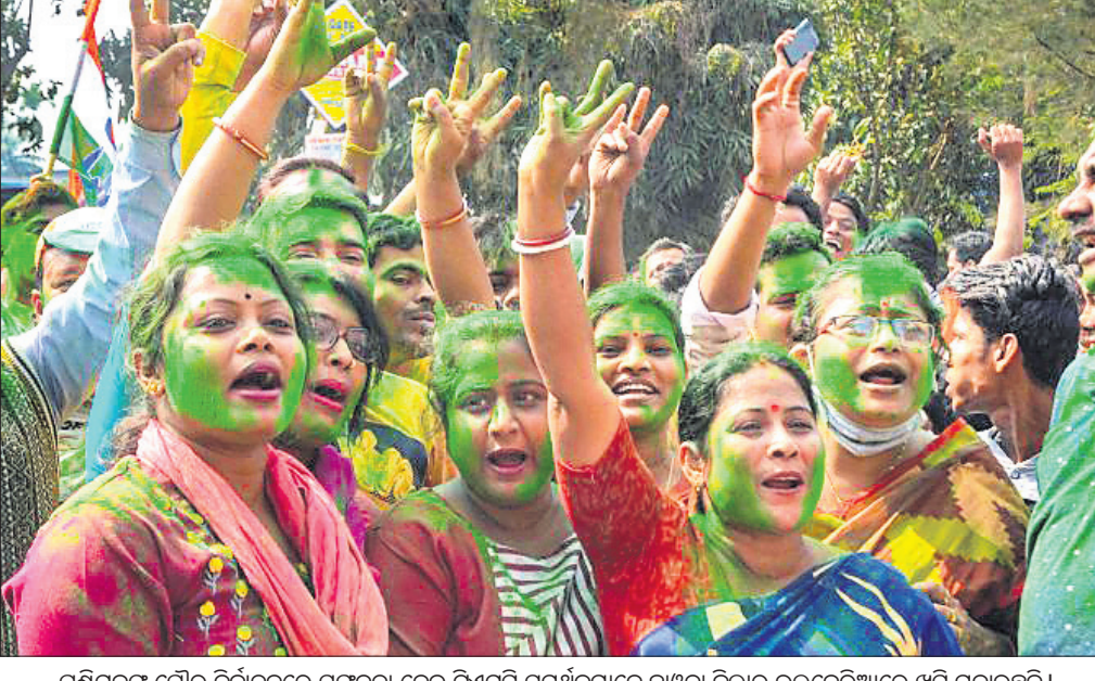
ପଶ୍ଚିମବଙ୍ଗ ପୌର ନିର୍ବାଚନରେ ସଫଳତା ନେଇ ଟିଏମ୍ସି ସମର୍ଥକମାନେ ହାତୁଡ଼ା ଜିଲ୍ଲାର ଭଲବେଟିଆରେ ଖୁସି ମନାଉଛନ୍ତି।