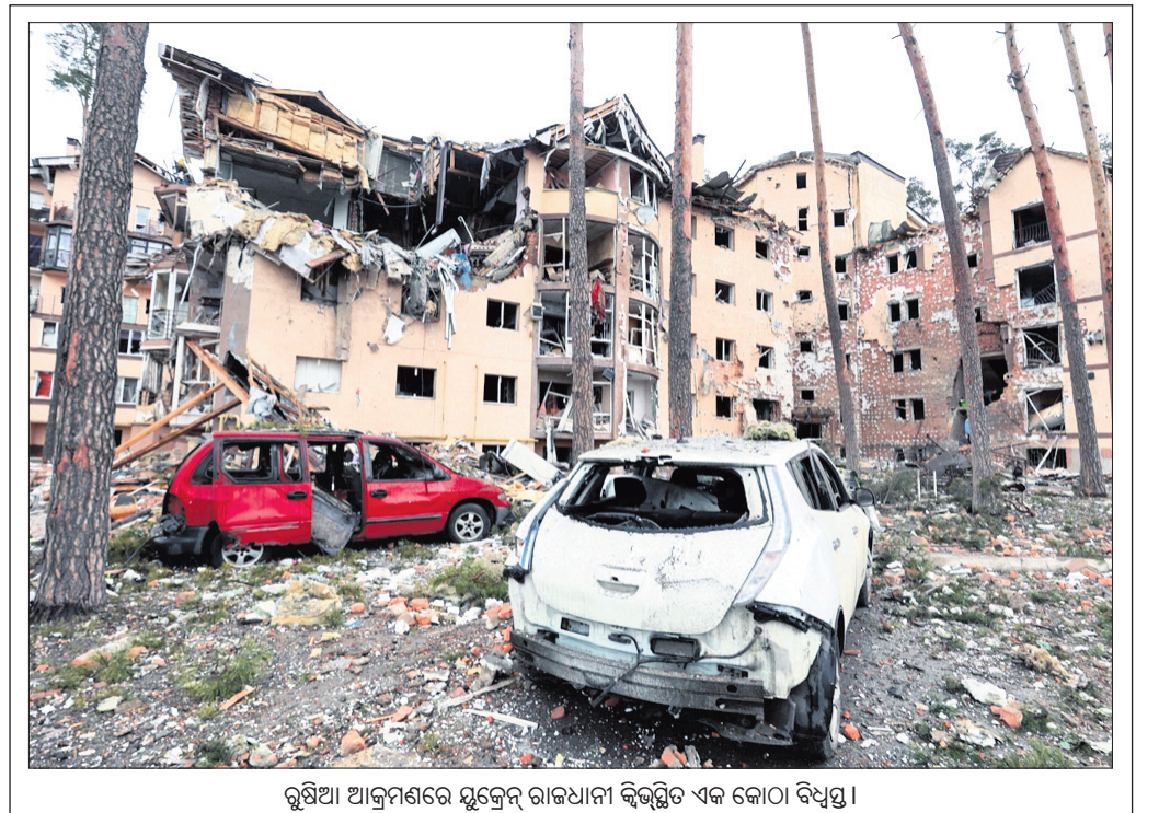
ରୁଷିଆ ଆକ୍ରମଣରେ ଯୁକ୍ତେନ୍ ରାଜଧାନୀ କ୍ୱିବିଟ୍ଟ ଏକ କୋଠା ବିଧ୍ୟୁତ।

ମୁଆଦିଲ୍ଲା, ୩୩୩ (ପି.ଟି.): ନିର୍ବାଚନ କେଳେ ବିଭିନ୍ନ ଦଳ ପକ୍ଷରୁ ଭୋଟରଙ୍କୁ ମାଗଣା ଉପହାର ପ୍ରତିଶ୍ରୁତି ଦିଆଯାଇଛି। ଏଭଳି ପ୍ରତିଶ୍ରୁତି ଦେଉଥିବା ରାଜନୈତିକ ଦଳ ବିରୋଧରେ ଏଭଳି ପାଇଁ ନିର୍ଦ୍ଦେଶ ଦେବାକୁ ଅନୁରୋଧ କରି ଦାବୀ ଜନସ୍ୱାର୍ଥୀ ମାମଲା (ପିଆଇଏଲ୍)ରେ ହସ୍ତକ୍ଷେପ କରିବାକୁ ଗୁରୁତ୍ୱର ସୁପ୍ରିମକୋର୍ଟ ମନା କରିଦେଇଛନ୍ତି। ଏହା ପ୍ରଚାରଣ ଏବଂ ପ୍ରଚାରଣ ସ୍ୱାର୍ଥୀ ମାମଲା ଭଳି ମନେ ହେଉଥିବା ସର୍ବୋଚ୍ଚ ଅଦାଲତ କହିଛନ୍ତି।