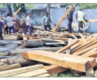
ଜବତ କରାଯାଇଥିବା କାଠ।