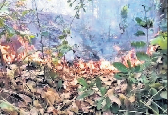
ମାଙ୍କଡ଼ରୁଆ ସଂରକ୍ଷିତ ଜଙ୍ଗଲରେ ଲାଗିଥିବା ନିଆଁ ।