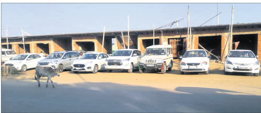
ରାସ୍ତାକଡ଼ରେ ଗାଡ଼ିଗୁଡ଼ିକ ପାର୍କିଂ କରାଯାଇଛି ।

ବରଗଡ଼ ଜିଲ୍ଲା ବରପାଲି ସହରର ଅସ୍ଥାୟୀ ବସ୍‌ଷ୍ଟାଣ୍ଡ ଏବେ ଜାତୀୟ ରାଜପଥ କଡ଼ରେ ରହିଛି । ଏଠାରେ ଯାତ୍ରୀମାନଙ୍କ ବିଶ୍ରାମ ପାଇଁ କିଛି ବ୍ୟବସ୍ଥା ନାହିଁ । ଫଳରେ ସେମାନେ ଖୋଲା ଆକାଶ ତଳେ ଛିଡ଼ା ହେଇ ବସକୁ ଅପେକ୍ଷା କରିଥାନ୍ତି । ବରପାଲି ସହର ଦେଇ ପ୍ରାୟ ୫୦ରୁ ଊର୍ଦ୍ଧ୍ୱ ସରକାରୀ ଓ ବେସରକାରୀ ବସ ଯାତାୟାତ କରୁଛି । ଏଠାରେ ପୂର୍ବରୁ କିଛି ବଡ଼ ଗଛ ଥିଲା । ଯାତ୍ରୀମାନେ ସେଠାରେ ବିଶ୍ରାମ କରୁଥିଲେ । କିନ୍ତୁ ରାଜପଥ ପ୍ରସ୍ତୁତକରଣ ପାଇଁ ଗଛ କାଟି ଦିଆଯାଇଛି । ବର୍ତ୍ତମାନ ମାର୍ଚ୍ଚ ମାସ ଆରମ୍ଭରୁ ଖରାପ ଅବସ୍ଥା ହେଲାଣି । ଆଗରୁ ଗରମ ଆହୁରି ବଢ଼ିବ । ଫଳରେ ଯାତ୍ରୀମାନେ ଅସୁବିଧା ଭୋଗିବେ । ସେହିପରି ବସ୍‌ଷ୍ଟାଣ୍ଡକୁ ପ୍ରତ୍ୟହ ଶହ ଶହ ଯାତ୍ରୀ ଆସୁଥିଲେ ମଧ୍ୟ ପରିଶ୍ରାମୀ ନାହିଁ । ତେଣୁ ମହଲ୍ଲା