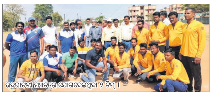
ଉଦ୍‌ଘାଟନା ମୁଖ୍ୟତଃ ଯୋଗଦେଇଥିବା ୨ ଟିମ୍।