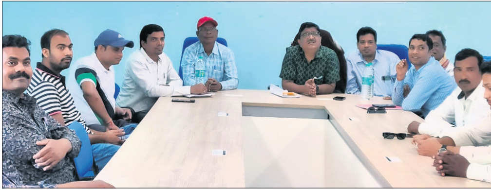
ଗାଷୀ ପଞ୍ଚାକରଣ ପ୍ରକ୍ରିୟା ଶିବିରରେ ଯୋଗାଣ, ସମବାୟ ବିଭାଗର ଅଧିକାରୀ ବୃନ୍ଦ।

ସୁବର୍ଣ୍ଣପୁର ଜିଲ୍ଲାରେ ଚଳିତ ରବି ରାତ୍ରୀ ଧାନ ସଂଗ୍ରହ ନିମନ୍ତେ ଗାଷୀ ପଞ୍ଚାକରଣ ପ୍ରକ୍ରିୟା ଆରମ୍ଭ ହୋଇଛି।