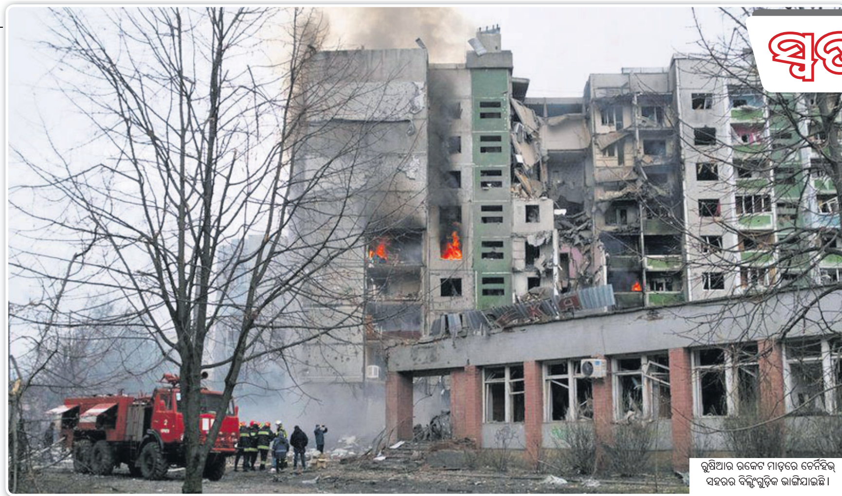
ରୁଷିଆର ରକେଟ୍ ମାଡ଼ରେ ତେନିହିଲ୍ ସହରର ବିଲ୍ଡିଂଗୁଡ଼ିକ ଭାଙ୍ଗିଯାଇଛି।