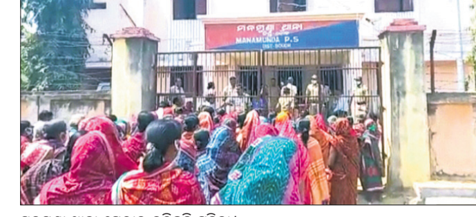
ମନମୁଖା ଧାନା ଘେରାଉ କରିଛନ୍ତି ମହିଳା।

ଗଠା ଉତ୍ତେଜନା। ପୋଲିସର ଏକ ପାଖୁଆ କାର୍ଯ୍ୟାନୁଷ୍ଠାନକୁ ବିରୋଧ କରି ଶୁକ୍ରବାର ଗୋଟିଏ ଗୋଷ୍ଠୀ ଧାନା ଘେରାଉ କରିଥିବା ବେଳେ ଗୁଲିକାଣ୍ଡ ମାମଲାରେ ପୁଖ୍ୟ ଅଭିଯୁକ୍ତ ଓ ମାଷ୍ଟର ମାଲିକମାନଙ୍କୁ ତୁରନ୍ତ ଗିରଫ କରିବାକୁ ଆନ୍ଦୋଳନ ପାଇଁ ଅପର ଗୋଷ୍ଠୀ ସଭାବାଜ୍ଞ ହେଉଥିବା ସୂଚନା ମିଳିଛି।