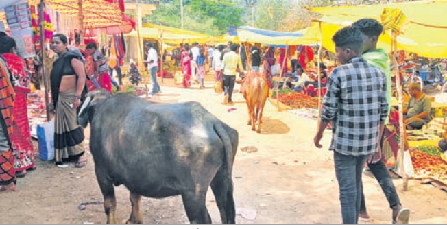
ସପ୍ତାହ ହାଟ ଭିତରେ ବୁଲା ଗୋରୁ, ମଲ୍ଲି।

ହାଟ ବନ୍ଦୁଛି। କେତେକ ସପ୍ତାହ ହାଟ ବସିବା ସ୍ଥାନରେ ଚଟାଣ ଓ ପାଚେରି ନିର୍ମାଣ ହୋଇଛି। ହେଲେ ନିର୍ମାଣର କାମ ଯୋଗୁ ଚଟାଣରୁ ସିମେଣ୍ଟ ଓ ଗୋଟି ବାହାରି ଲାଗିଛି। ହାଟ ଭିତରେ ନକକୁପ ବ୍ୟବସ୍ଥା ନ ଥିବାରୁ ଲୋକେ ପାଣି ପାଇଁ ଅନୁରୋଧ ଦେଖିଛନ୍ତି। ଆଗକୁ ଗ୍ରୀଷ୍ମ ପ୍ରହାର ଚାରିପଟେ ପାଚେରି ନିର୍ମାଣ ହୋଇଥିଲେ ମଧ୍ୟ ଗେଟ ନ ଥିବାରୁ ବୁଲା ଗୋରୁ ମଲ୍ଲି, କୁକୁର ପଶି ବ୍ୟବସାୟୀଙ୍କ ପସରାକୁ ଜିନିଷ ଖାଇ ଦେଉଥିବା ଅଭିଯୋଗ ହେଉଛି। ନିୟନ୍ତ୍ରଣ ବଜାର କମିଟି ପ୍ରତ୍ୟେକ ସପ୍ତାହ ହାଟରୁ ଚିକିତ୍ସା ଆଦାନ କରୁଥିବା ହେଲେ ଲିଛି ବ୍ୟବସ୍ଥା କରୁ ନ ଥିବା ଅଭିଯୋଗ ହେଉଛି। ଛତିଶଗଡ଼ ସୀମାନ୍ତ ଖରିଆର ରୋଡ଼ଠାରୁ ଆରମ୍ଭ କରି ସିନାପାଲି ଛତିଶଗଡ଼ ସୀମା ପର୍ଯ୍ୟନ୍ତ ସପ୍ତାହ ପ୍ରତି ଏହାପ୍ରତି ବିଭାଗୀୟ ଉଚ୍ଚକର୍ତ୍ତୃମଣ ଦୃଷ୍ଟି ଦିନ ୫ ରୁ ୧୦ କି.ମି. ଦୂରରେ ସପ୍ତାହ ହାଟ ବନ୍ଦୁଛି। କେତେକ ସପ୍ତାହ ହାଟ ବସିବା ସ୍ଥାନରେ ଚଟାଣ ଓ ପାଚେରି ନିର୍ମାଣ ହୋଇଛି। ହେଲେ ନିର୍ମାଣର କାମ ଯୋଗୁ ଚଟାଣରୁ ସିମେଣ୍ଟ ଓ ଗୋଟି ବାହାରି ଲାଗିଛି। ହାଟ ଭିତରେ ନକକୁପ ବ୍ୟବସ୍ଥା ନ ଥିବାରୁ ଲୋକେ ପାଣି ପାଇଁ ଅନୁରୋଧ ଦେଖିଛନ୍ତି। ଆଗକୁ ଗ୍ରୀଷ୍ମ ପ୍ରହାର ଚାରିପଟେ ପାଚେରି ନିର୍ମାଣ ହୋଇଥିଲେ ମଧ୍ୟ ଗେଟ ନ ଥିବାରୁ ବୁଲା ଗୋରୁ ମଲ୍ଲି, କୁକୁର ପଶି ବ୍ୟବସାୟୀଙ୍କ ପସରାକୁ ଜିନିଷ ଖାଇ ଦେଉଥିବା ଅଭିଯୋଗ ହେଉଛି। ନିୟନ୍ତ୍ରଣ ବଜାର କମିଟି ପ୍ରତ୍ୟେକ ସପ୍ତାହ ହାଟରୁ ଚିକିତ୍ସା ଆଦାନ କରୁଥିବା ହେଲେ ଲିଛି ବ୍ୟବସ୍ଥା କରୁ ନ ଥିବା ଅଭିଯୋଗ ହେଉଛି। ଛତିଶଗଡ଼ ସୀମାନ୍ତ ଖରିଆର ରୋଡ଼ଠାରୁ ଆରମ୍ଭ କରି ସିନାପାଲି ଛତିଶଗଡ଼ ସୀମା ପର୍ଯ୍ୟନ୍ତ ସପ୍ତାହ ପ୍ରତି ଏହାପ୍ରତି ବିଭାଗୀୟ ଉଚ୍ଚକର୍ତ୍ତୃମଣ ଦୃଷ୍ଟି ଦିନ ୫ ରୁ ୧୦ କି.ମି. ଦୂରରେ ସପ୍ତାହ ହାଟ ବନ୍ଦୁଛି।