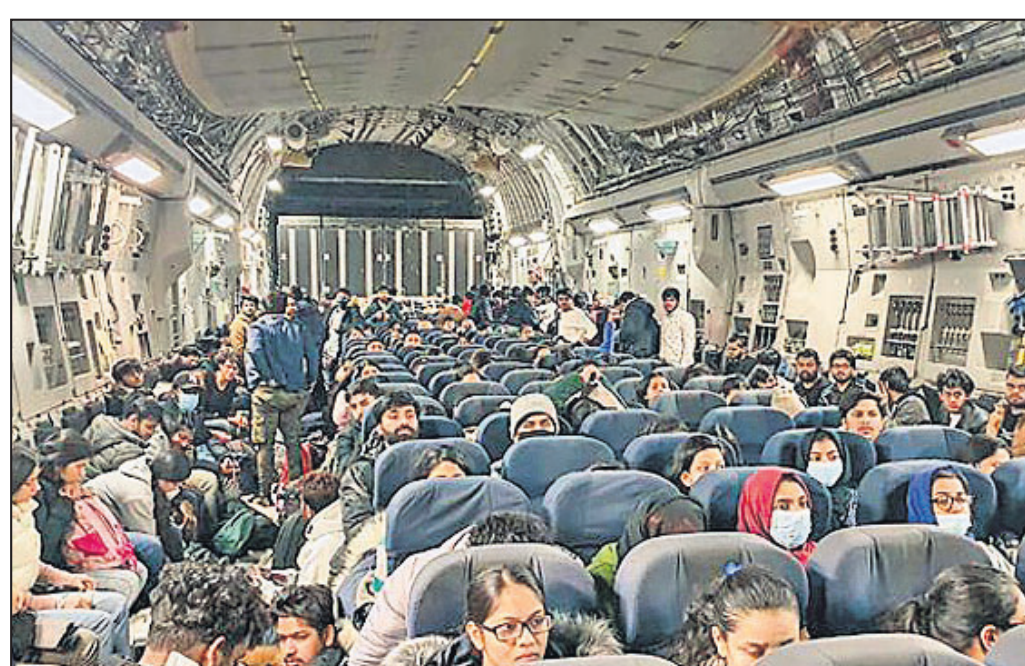
ୟୁକ୍ରେନ୍‌ରେ ଫସିଥିବା ୬୩୦ ଭାରତୀୟଙ୍କୁ ରୋମାନିଆ-ହଙ୍ଗେରି ସୀମାରୁ ନେଇ ବାୟୁସେନାର ସି-୧୭ ବିମାନ ଶୁକ୍ରବାର ସକାଳେ ଗାଜିଆବାଦର ହିଣ୍ଡନ୍ ଏୟାରବେସ୍‌ରେ ପହଞ୍ଚିଛି।