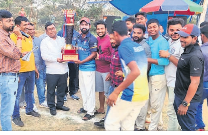
କୃତୀ ଦଳର ଖେଳାଳିଙ୍କୁ ପୁରସ୍କୃତ କରାଯାଇଛି।