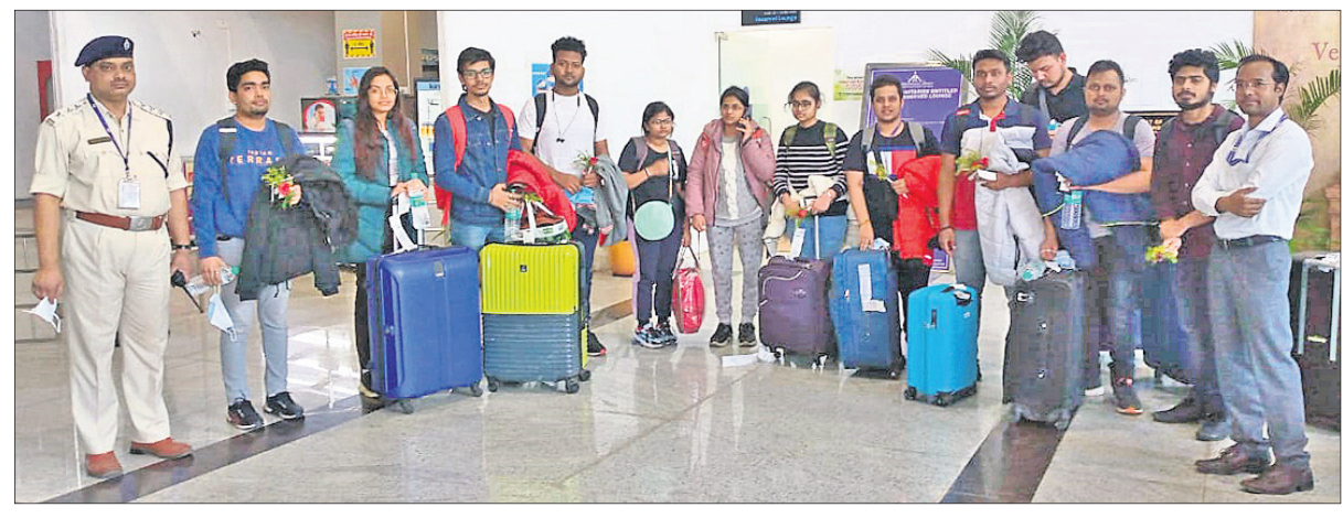
ବିମାନବନ୍ଦରରେ ପହଞ୍ଚିଥିବା ଛାତ୍ରାଛାତ୍ରୀ ।

ଗତ କିଛିଦିନ ହେଲା ରୁଷିଆ ଓ ୟୁକ୍ରେନ୍ ମଧ୍ୟରେ ଘମାଘୋଟ ଯୁଦ୍ଧ ଲାଗିରହିଛି । ଏଥିରେ ୟୁକ୍ରେନ୍ ଧୂସୃଦିଧୂସୃ ହେବାରେ ଲାଗିଛି । ୟୁକ୍ରେନ୍ରେ ଅଧ୍ୟୟନ କରୁଥିବା ଭାରତର ଡାକ୍ତରୀ ଓ ଇଞ୍ଜିନିୟରିଂ ଛାତ୍ରାଛାତ୍ରୀ ନିଜ ଦେଶକୁ ଫେରି ନ ପାରି ଫସି ରହିଛନ୍ତି । ଅଭିଭାବକମାନେ ନିଜ