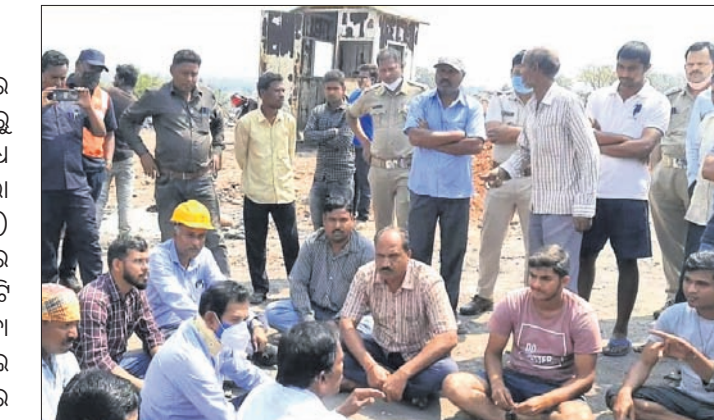
କାମ ବନ୍ଦ କରିଥିବା ବ୍ୟୁଥାପାଲିର ବିସ୍ଥାପିତମାନେ।