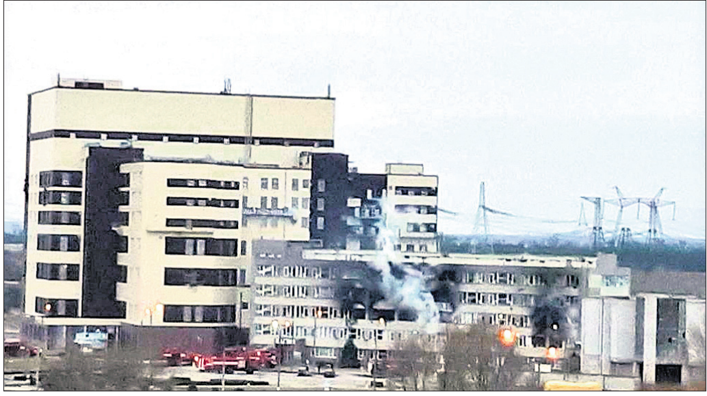
ରୁଷିଆ କବ୍‌ଜାରେ ୟୁରୋପର ସର୍ବବୃହତ୍ ଆଣବିକ ଶକ୍ତି କେନ୍ଦ୍ର କେପୋରି଼ଡିଆ ।

ୟୁକ୍ରେନ୍ ଉପରେ ମସ୍କୋର ଆକ୍ରମଣ ଶୁକ୍ରବାର ନବମ ଦିନରେ ପହଞ୍ଚିଥିବାବେଳେ ରୁଷିଆ ସୈନ୍ୟମାନେ କେପୋରି଼ଡିଆ ସହରସ୍ଥିତ ୟୁରୋପର ସର୍ବବୃହତ୍ ଆଣବିକ ଶକ୍ତି କେନ୍ଦ୍ରକୁ ଟାର୍ଗେଟ କରି ଦଖଲ କରିଛନ୍ତି । ଏହି ୟୁକ୍ରେନ୍ ପାଞ୍ଚର ପାଞ୍ଚର ପାଞ୍ଚର ନେଇ ରୁଷିଆ ରାତିସାରା ରୁଷିଆ ଓ ୟୁକ୍ରେନ୍ ସୈନ୍ୟଙ୍କ ମଧ୍ୟରେ ସଂଘର୍ଷ ଘଟିଥିଲା । ଭୋର ସମୟରେ ରୁଷିଆ ସୈନ୍ୟଙ୍କ ଆକ୍ରମଣରେ ପାଞ୍ଚରେ ନିଆଁ ଲାଗିଯାଇଥିଲା । ଏଥିରେ ୟୁକ୍ରେନ୍ ୩ ସୈନ୍ୟ ନିହତ ହୋଇଥିବାବେଳେ ୨ ଆହତ ହୋଇଥିବା କ୍ରିକ୍ ପକ୍ଷରୁ କୁହାଯାଇଛି । ରୁଷିଆ ପ୍ରତିରକ୍ଷା ମନ୍ତ୍ରଣାଳୟ ଅଭିଯୋଗକୁ ଖଣ୍ଡନ କରି ଏହାକୁ ୟୁକ୍ରେନ୍‌ମାନଙ୍କ ଅତ୍ୟାଚାର କାର୍ଯ୍ୟ ବୋଲି ଓଲଟା ଦୋଷାରୋପ କରିଛି ।