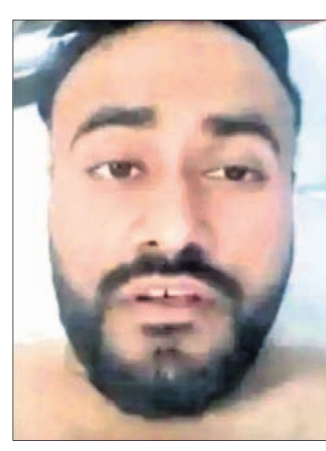
ସହ ସର୍ବାଧିକ ଛାତ୍ରଛାତ୍ରୀଙ୍କୁ ଫେରାଇ ଆଣିବା ଲାଗି କେନ୍ଦ୍ର ସରକାର ଉଦ୍ୟମ ଅବ୍ୟାହତ ରଖୁଛନ୍ତି। ଏବେ ବି ୟୁକ୍ରେନ୍‌ରେ ୧,୭୦୦ ପିଲା ଭାରତ ଫେରିବା ଲାଗି ଅପେକ୍ଷାରେ ରହିଥିବା ମନ୍ତ୍ରୀ ସିଂ କହିଛନ୍ତି। ଉଦ୍ଧାର କାର୍ଯ୍ୟର ତଦାରଖ କରିବା ଲାଗି ଭି.କେ. ସିଂଙ୍କ ସମେତ ୪ କେନ୍ଦ୍ରମନ୍ତ୍ରୀ ହରାଇଥିଲେ। ୟୁକ୍ରେନ୍‌ରୁ ସର୍ବନିମ୍ନ କ୍ଷତି ୟୁକ୍ରେନ୍‌ର ପଡୋଶୀ ଦେଶକୁ ଯାଇଛନ୍ତି।

ୟୁକ୍ରେନ୍ ଖର୍ଚ୍ଚିତ ସହରରେ ଗତ ମଙ୍ଗଳବାର ରୁଷିଆ ସୈନ୍ୟଙ୍କ ସେଲ୍ ମାଡ଼ରେ ଜଣେ ଭାରତୀୟ ଛାତ୍ରଙ୍କ ମୃତ୍ୟୁ ଘଟିଥିଲା। ଏହାର ୨ ଦିନ ପରେ ଭାରତୀୟ ଛାତ୍ରଙ୍କୁ ଗୁଳି କରାଯାଇଥିବା କେନ୍ଦ୍ରମନ୍ତ୍ରୀ ଭି.କେ. ସିଂ ପୂର୍ବନା ଦେଇଛନ୍ତି। ଛାତ୍ର ଜଣକ କିଛି ଛାତ୍ରୀଙ୍କୁ ଉଦ୍ୟମ କରୁଥିବାବେଳେ ଗୁଳି ମାଡ଼ରେ ଆହତ ହୋଇଛନ୍ତି। ତାଙ୍କୁ ସହର ମଧ୍ୟକୁ ଫେରାଇ ନିଆଯାଇ ସହିଷ୍ଣତାରେ ଭର୍ତ୍ତି କରାଯାଇଥିବା ଭି.କେ. ସିଂ ପୋଲିକ୍ଷର ରେଭକୋ ବିମାନବନ୍ଦରରେ ଏକ ଗଣମାଧ୍ୟମକୁ କହିଛନ୍ତି।