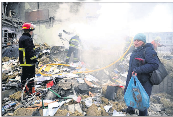
ରୁଷିଆ ଆକ୍ରମଣରେ ଝିଟୋମିରରେ ଏକ ସ୍କୁଲ ଧରାଶାୟୀ ହୋଇଯାଇଥିବାବେଳେ ଉଦ୍ଧାରକାରୀଙ୍କ ଗହଣରେ ଜଣେ ମହିଳା ଛିଡ଼ା ହୋଇଛନ୍ତି।

ଆକାଶରୁ ବୁହା ବର୍ଷା ବର୍ଷା ବୋମା। ରାଜରାପ୍ତରେ ପୁରୁଛି ଗୁଳି। ବଡ଼ ବଡ଼ ଆପାର୍ଟମେଣ୍ଟ ଓ ସରକାରୀ ବିଲ୍ଡିଂଗୁଡ଼ିକୁ ରକେଟ୍ ମାଡ଼ କରି ଧରାଶାୟୀ କରିବାରେ ଲାଗିଛି ରୁଷିଆ ସେନା। ମୃତାହତଙ୍କ ସଂଖ୍ୟା କେବଳ ଅନୁମାନ ମାତ୍ର। ପ୍ରକୃତ ସଂଖ୍ୟା ହିସାବ କାହା ପାଖରେ ନାହିଁ। ସବୁ ଶୁଭୁଛି କ୍ରମନିରୋଧ। ମହିଳା ଓ ଶିଶୁମାନେ ପ୍ରାଣ ବିକଳରେ ଦେଶରୁ ପଳାୟନ କରିବାରେ ଲାଗିଥିବାବେଳେ ପୁରୁଷମାନେ ଘର କରିଛନ୍ତି। ଏହା ହେଉଛି ମୁକ୍ତ ପ୍ରଭାବିତ ପୂର୍ବ ୟୁକ୍ରେନର ରାଷ୍ଟ୍ର ୟୁକ୍ରେନ୍ ସଦ୍ୟ ବିକଳ ଚିତ୍ର।