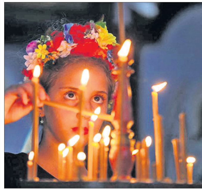
ୟୁକ୍ରେନ୍ ଜଣେ ଶରଣାର୍ଥୀଙ୍କ ଝିଅ ବ୍ରାଜିଲସ୍ଥିତ କାନୋସ୍ତର ଏକ ଚର୍ଚ୍ଚରେ ମୁକ୍ତବରତ ପାଇଁ ପ୍ରାର୍ଥନା କରି କ୍ୟାଣ୍ଡେଲ ଜାଳୁଛନ୍ତି।