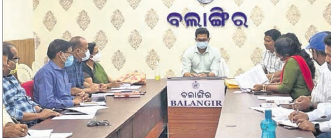
ଜିଲ୍ଲାସ୍ତରୀୟ ପ୍ରସ୍ତୁତି ବୈଠକରେ ମଞ୍ଜୁରୀ ଅଧିକାରୀ ।