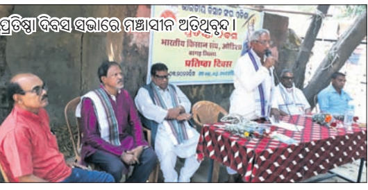
ପ୍ରତିଷ୍ଠାବିକଳ ସଭାରେ ମାଷ୍ଟାଧୀନ ଅତିଥିବୃନ୍ଦ।

ବରଗଡ଼ ଅଫିସ, ୪ମାର୍ଚ୍ଚ: ବରଗଡ଼ ଜିଲ୍ଲା ବରିଷ୍ଠ ନାଗରିକ ସଂଘ କାର୍ଯ୍ୟକ୍ରମରେ ଶୁକ୍ରବାର ଭାରତୀୟ କିଷାନ ସଂଘର ପ୍ରତିଷ୍ଠା ଦିବସ ପାଳିତ ହୋଇଛି।