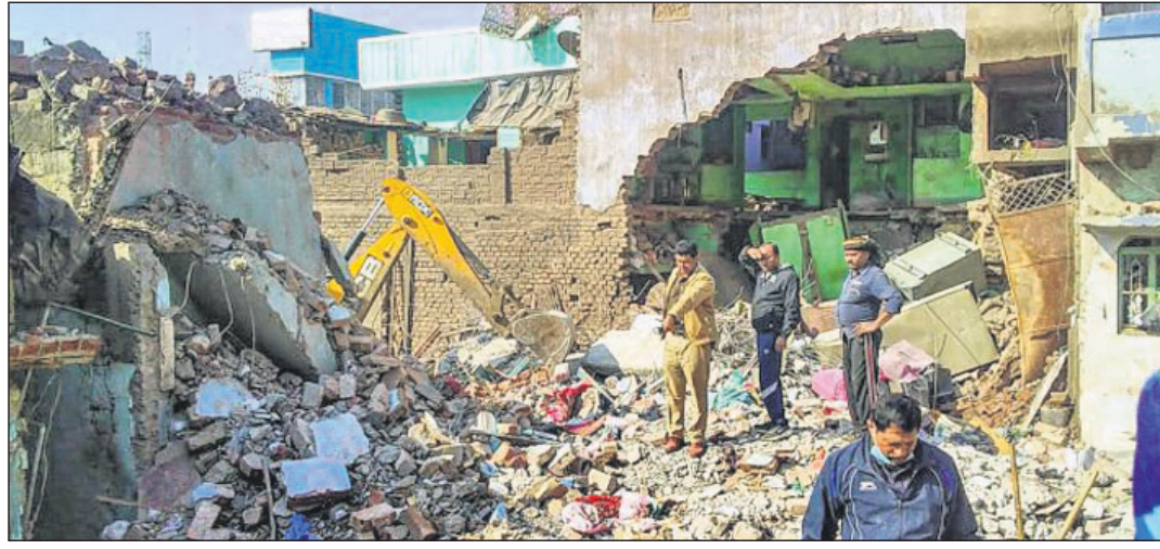
ଭାରତପୁରରେ ବାଣ ବିସ୍ଫୋରଣ ପରେ ଧ୍ବଙ୍ଗି ମଧ୍ୟରେ ଶେଷାଞ୍ଚଳରେ ଭଙ୍ଗା କାର୍ଯ୍ୟ ଚଳାଇଛନ୍ତି।