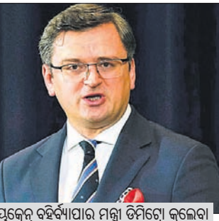
ୟୁକ୍ରେନ ବହିର୍ବ୍ୟାପାର ମନ୍ତ୍ରୀ ଡିମିତ୍ରୋ କୁଲେବା

'ୟୁକ୍ରେନରେ ବଳାଙ୍ଗାର ନିରୁକ୍ତି ରୁଷିଆ ସୈନ୍ୟ'