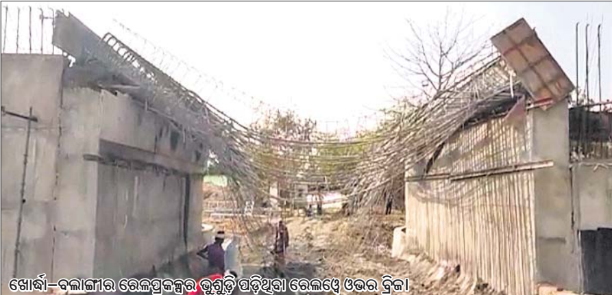
ଖୋର୍ଦ୍ଧା-ବଲାଙ୍ଗୀର ରେଲୱେ ଓଭରବ୍ରିଜର ଭୁଣ୍ଡିଲି ପଡ଼ିଥିବା ରେଲୱେ ଓଭରବ୍ରିଜ।

ବାଇଁଶୁଣୀ/ବୌଦ୍ଧ, ୫୩୩(ଡି.ଏନ.ଏ./ସ୍ପେ.) ନିମ୍ନୋକ୍ତ ଭାବରେ କାର୍ଯ୍ୟ ଆରମ୍ଭ ହେଉଥିବା ଜନସାଧାରଣ ଅଭିଯୋଗ କରିଛନ୍ତି। ଏହାର ତଦନ୍ତ କରାଯାଇ ସମସ୍ତଙ୍କୁ ଲେଉଟାଇ ଦିଆଯାଏ ନାହିଁ ବୋଲି ଅଭିଯୋଗ କରାଯାଇଛି।