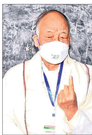
ମଣିପୁର ପୂର୍ବତନ ମୁଖ୍ୟମନ୍ତ୍ରୀ ଓଡ୍ରାମ ଲବୋହି ସିଂହ

ମଣିପୁରରେ ଶନିବାର ବିତର୍କ ତଥା ଚୁଡ଼ାତ ପର୍ଯ୍ୟାୟ ମତଦାନ ଅନୁଷ୍ଠିତ ହୋଇଯାଇଛି।