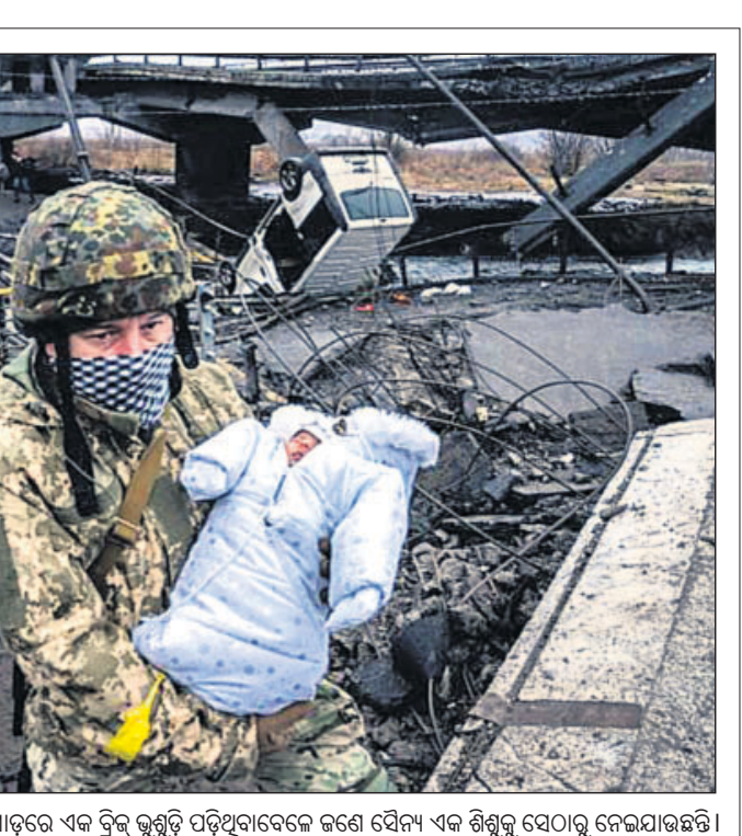
କିରୁ ନିକଟ ଉପରେ ସହରରେ ରୁଷିଆ ସେଲ୍ ମାଡ଼ରେ ଏକ ବ୍ରିକ୍ ଭୁଣ୍ଡି ପଡ଼ିଥିବାବେଳେ ଜଣେ ସୈନ୍ୟ ଏକ ଶିଶୁକୁ ସେଠାରୁ ନେଇଯାଇଛନ୍ତି।

ୟୁକ୍ରେନ ଉପରେ ଆକ୍ରମଣ କରିବାର ୧୦ମ ଦିନରେ ରୁଷିଆ ଶନିବାର ସାମୟିକ ଅସ୍ତବିରତି ଘୋଷଣା କରିଛି।