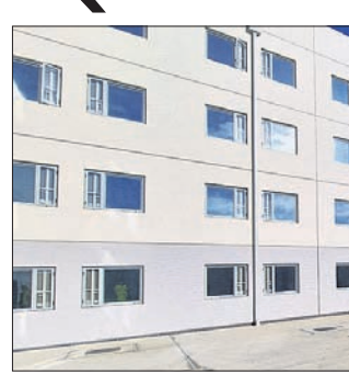
ଅନେକ ଅତ୍ୟାଧୁନିକ ସୁବିଧା ଉପଲବ୍ଧ କରାଯାଇଛି।

ଅପରାଧ କର୍ମ କରିବା ସହ ଜେଲରେ କର୍ମଚାରୀଙ୍କୁ ସମାଜରେ ପ୍ରତିଷ୍ଠିତ କରି ନୂଆ ପରିଚୟ ଦେବା ଲାଗି ଦ୍ରୈଚେନ୍ ଅଭିନବ ଉପାୟ ଆପଣାଇଛି।