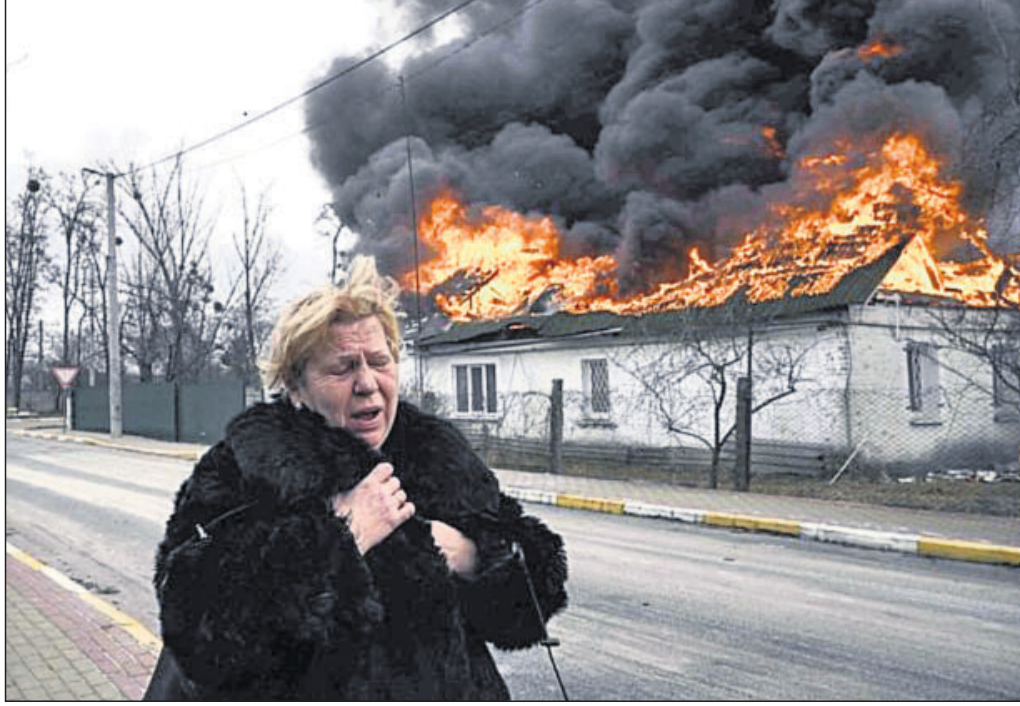
ୟୁକ୍ରେନ ଆକ୍ରମଣରେ ଯୁକ୍ରେନର ଏକ ସହରରେ କନୁହାୟ ଘର ସାମ୍ନା ଦେଇ ଜଣେ ଭୟଭୀତ ମହିଳା ପଳାଇଯାଇଛନ୍ତି।

ୟୁକ୍ରେନ ଉପରେ ଆକ୍ରମଣ କରିବାର ୧୦ମ ଦିନରେ ରୁଷିଆ ଶନିବାର ସାମୟିକ ଅସ୍ତବିରତି ଘୋଷଣା କରିଛି।