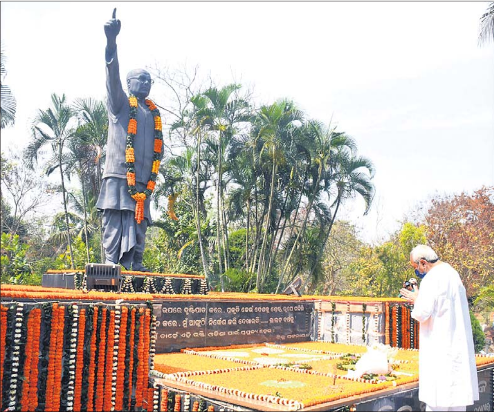
ଓଡ଼ିଶାର ପୂର୍ବତନ ମୁଖ୍ୟମନ୍ତ୍ରୀ ତଥା ପ୍ରବାସ ପୁରୁଷ ବିଜୁ ପଟ୍ଟନାୟକଙ୍କ ୧୦୬ତମ ଜନ୍ମଦିନରେ ତାଙ୍କ ପୁତ୍ର ତଥା ମୁଖ୍ୟମନ୍ତ୍ରୀ ନବାନ ପଟ୍ଟନାୟକ ଶନିବାର ଭୁବନେଶ୍ୱରସ୍ଥିତ ବିଜୁ ପଟ୍ଟନାୟକ ପାର୍କରେ ଥିବା ପ୍ରତିମୁର୍ତ୍ତିରେ ପୁଷ୍ପମାଳା ଅର୍ପଣ କରିଥିଲେ।