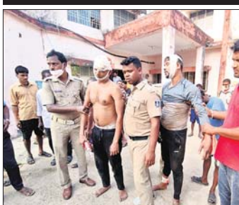
ଗିରଫ ୨ ଅଭିଯୁକ୍ତ। କେନ୍ଦ୍ରାପଡ଼ା ଅଧିକାରୀ/ସହାଧିକାରୀଙ୍କ, ୫୩୩(ଡି.ଏନ.ଏ.)