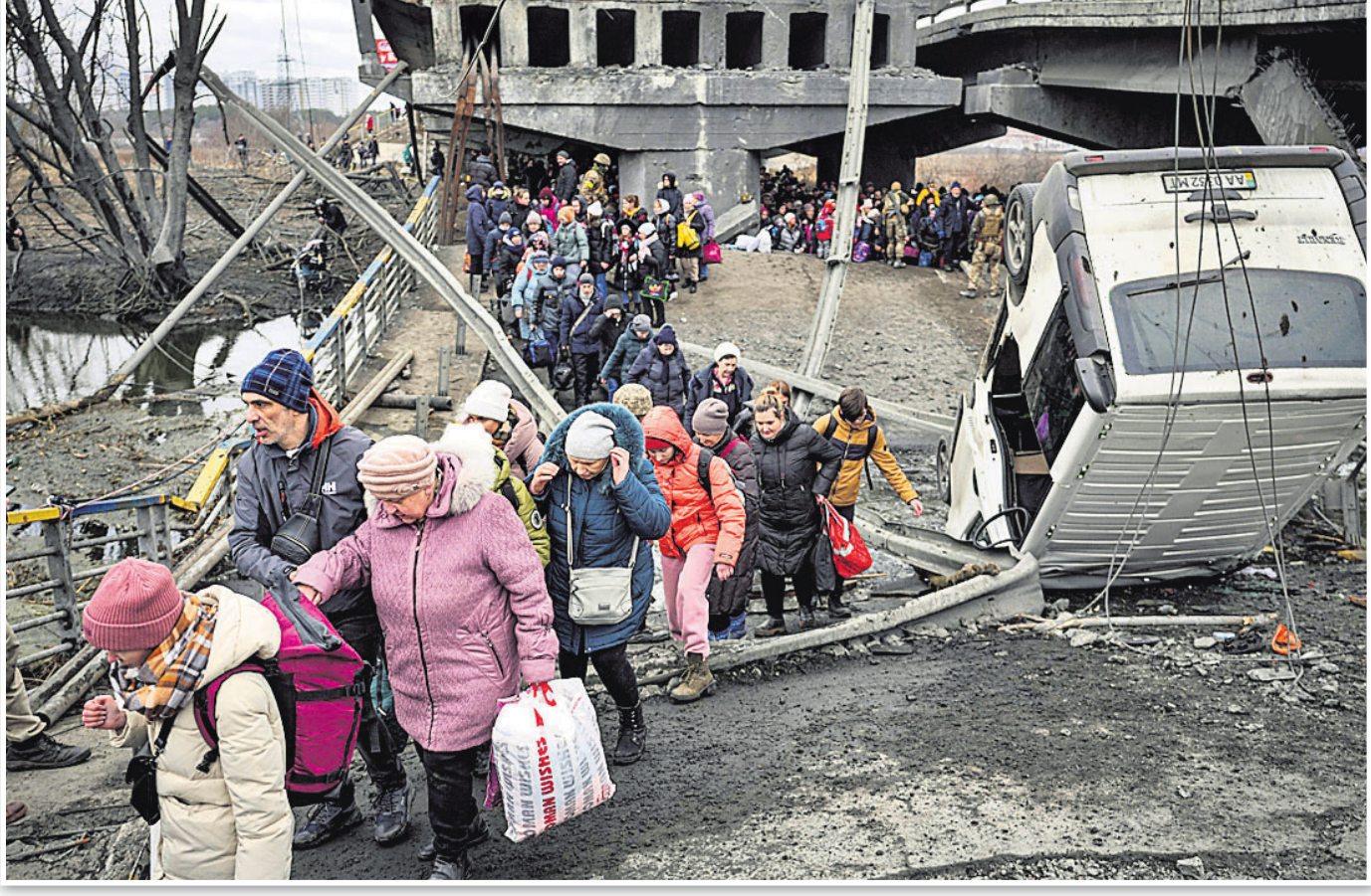
ଉପେନ୍ ନଦୀ ପାର ହେବାକୁ ବହୁ ସଂଖ୍ୟାରେ ମୁକ୍ତେନ୍ ନାଗରିକ ରୁଷିଆ ଆକ୍ରମଣରେ ଭାଙ୍ଗିଯାଇଥିବା ଏକ ପୋଲକୁ ଅତିକ୍ରମ କରୁଛନ୍ତି।

ଭୂମିରେ ପୂର୍ବରେ ଉତ୍ତରୀନ ସୃଷ୍ଟିକାରୀ ପଦକ୍ଷେପ ଦିବା ହେବା କରୁଆ ବୋଲି କହିବା ସହ ଯୁଦ୍ଧ ରୋକିବାକୁ ୬ ଉପାୟ ଦେଇଛନ୍ତି। ସେଗୁଡ଼ିକ ହେଲା, ମୁକ୍ତେନ୍ ପାଇଁ ବିଶ୍ଵ ନେତାମାନେ ଅର୍ତ୍ତତତ୍ଵ ମାନବୀୟ ସହାୟତା ପାଇଁ ଆଗେଇ ଆସନ୍ତୁ। ମୁକ୍ତେନ୍ ଯେପରି ନିକ ରକ୍ଷା ନିଜେ କରିପାରିବ ସେ ଦିଗରେ ବିଶ୍ଵ ନେତା ସହଯୋଗ କରନ୍ତୁ। ରୁଷିଆ ଉପରେ ଆର୍ଥିକ କଟକଣା କଠୋର କରାଯାଉ। ମୁକ୍ତେନ୍ରେ ରୁଷିଆର ଆତଙ୍କକୁ ପ୍ରତିରୋଧ କରିବା ଦିଗରେ ବିଶ୍ଵ ସମ୍ପ୍ରଦାୟ ସହଯୋଗ ହେଉ। ମୁକ୍ତେନ୍ ରୋକିବାକୁ କୃତନୈତିକ ରାସ୍ତା ବନ୍ଧାଯାଉ, କିନ୍ତୁ ଏଥିରେ ମୁକ୍ତେନ୍ ସରକାରଙ୍କ ଲକ୍ଷ୍ୟ ଯାମିଲି କରାଯିବ ଆବଶ୍ୟକ। ଏଥିସହ ନାଟୋ ଦେଶଗୁଡ଼ିକ ନିଜର ପୁରୁଣା ଓ ପ୍ରତିରୋଧ ସମ୍ମତୀ ବହୁଳତା ନିମନ୍ତେ କମ୍ପାଇନ ଅଭିଯାନ ଆରମ୍ଭ କରିବା ଉଚିତ ବୋଲି ବୋରିସ୍ କହିଛନ୍ତି।