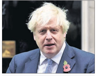
ଯୁଦ୍ଧ ରୋକିବାକୁ ଦେଲେ ୬ ଉପାୟ

ଲଣ୍ଡନ, ୬ ମାର୍ଚ୍ଚ: ବ୍ରିଟେନ୍ ପ୍ରଧାନମନ୍ତ୍ରୀ ବୋରିସ୍ ଜନ୍ସନ୍ ରୁଷିଆକୁ ଏକ ମହାନ ରାଷ୍ଟ୍ର ଏବଂ ମହାଶକ୍ତି ଭାବେ ଅଭିହିତ କରିଛନ୍ତି। ଏ ନେଇ ଗୁମାସ୍ତକ ନେତୃତ୍ଵରେ ଜନ୍ସନ୍ଙ୍କ ଏକ ଆଲୋଚନା ପ୍ରକାଶ ପାଇଛି। ରୁଷିଆ ଲୋକଙ୍କ ସହ କୌଣସି ଶତ୍ରୁତା ନାହିଁ କିମ୍ବା ଏକ ମହାଶକ୍ତି ସହ ବିବାଦ ସୃଷ୍ଟି କରିବାକୁ ଲକ୍ଷ୍ୟ ନ ଥିବା ବୋରିସ୍ଙ୍କ ଘୋଷଣା। ନିକଟ ଭବିଷ୍ୟତରେ ମୁକ୍ତେନ୍ ନାଟୋରେ ସାମିଲ ହେବା ନିମନ୍ତେ କୌଣସି ଗମନ ପଦକ୍ଷେପ ନେଇ ନ ଥିଲେ। ତେଣୁ ସମ୍ପ୍ରତି ମୁକ୍ତେନ୍ ସଙ୍କଟରେ ନାଟୋ ବିବାଦ ସ୍ପଷ୍ଟ ଏବଂ କେବେ ଦି ଏହା ନାଟୋ ଦ୍ଵାରା ସୃଷ୍ଟି ଏକ ସମସ୍ୟା ହେବ ନାହିଁ ବୋଲି ବୋରିସ୍ କହିଛନ୍ତି। ତେବେ ରୁଷିଆ ରାଷ୍ଟ୍ରପତି