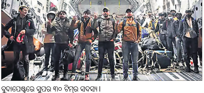
ରୁଦ୍ରପେଷ୍ଠରେ ସୁପର ୩୦ ଟିମ୍ପର ସଫର।