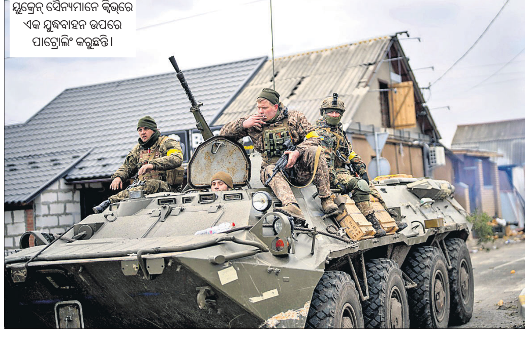
ଯୁଦ୍ଧେତ୍ନ ସୈନ୍ୟମାନେ କ୍ଵିଭରେ ଏକ ଯୁଦ୍ଧବାହନ ଉପରେ ପାଟ୍ରୋଲି କରୁଛନ୍ତି।

■ ମାରିୟୁପୋଲରେ ଦ୍ଵିତୀୟ ଅସ୍ତବିରତି ■ ପୁଣି ଯୁଦ୍ଧେତ୍ନର ଉଲ୍ଲଙ୍ଘନ ଅଭିଯୋଗ ଆଣିବାର ଉଦ୍ଦେଶ୍ୟ