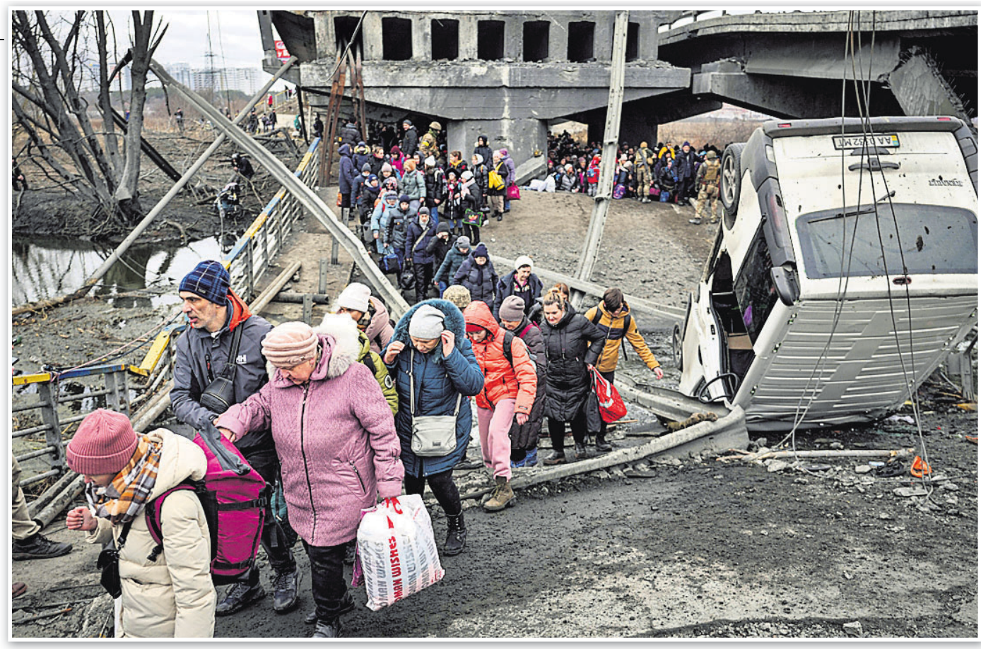
ଇଉକ୍ରେନ ନଦୀ ପାର ହେବାକୁ ବହୁ ସଂଖ୍ୟାରେ ଯୁଦ୍ଧେତ୍ନ ନାଗରିକ ରୁଷିଆ ଆକ୍ରମଣରେ ଭାଙ୍ଗିଯାଇଥିବା ଏକ ପୋଲକୁ ଅତିକ୍ରମ କରୁଛନ୍ତି।