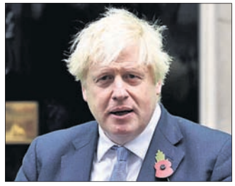
ଯୁଦ୍ଧ ରୋଜିବାକୁ ଦେଲେ ୬ ଉପାୟ