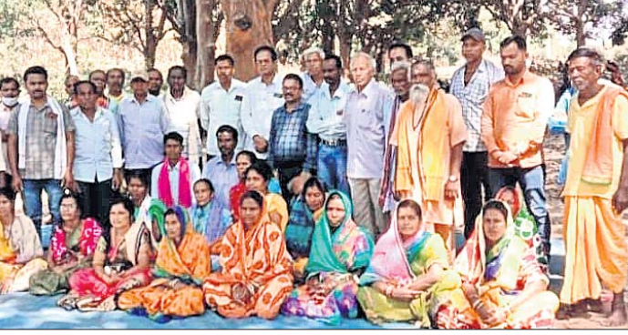
ଢେଙ୍କାନାଳ କଳାକାର ସଂଘ ପ୍ରମୁଖ କାର୍ଯ୍ୟକର୍ମୀଙ୍କ ସମେତ ଅନ୍ୟମାନେ।

କଣିଆଁ, ୬ମାର୍ଚ୍ଚ (ବି.ଏ.ଏ.): କଣିଆଁ ବ୍ଲକ୍ କଳାସଂସ୍କୃତି ସଂଘର ଏକ ବୈଠକ ରବିବାର ଗହମ ଆନ୍ଦୋଳନରେ ଅନୁଷ୍ଠିତ ହୋଇଛି।