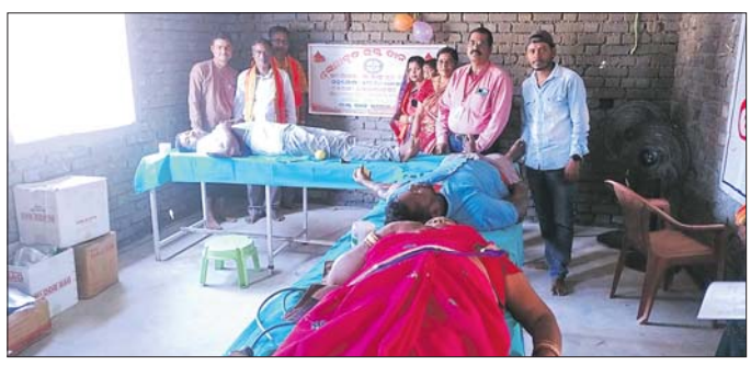
ଜଣେ ସ୍ତ୍ରୀଙ୍କୁ ସେବାକାଠୀ ରକ୍ତ ସଂଗ୍ରହ କରାଯାଇଛି।

ବରଂସା, ୬ମାର୍ଚ୍ଚ (ବି.ଏ.ଏ.): ଆଠମଲିକ ବ୍ଲକ୍ ସାମୁଦ୍ରିକ ପଞ୍ଚାୟତ ସଦରରେ ରବିବାର ମା' ଲକ୍ଷ୍ମୀ କ୍ଲବ ଓ ବଜରଞ୍ଜା କ୍ଲବ ଆରମ୍ଭରେ ଏକ ରକ୍ତଦାନ ଶିବିର ଅନୁଷ୍ଠିତ ହୋଇଯାଇଛି।