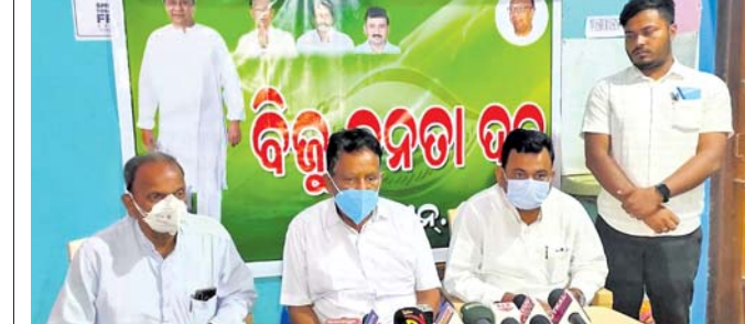
ଖରବଦା ସମ୍ମିଳନୀରେ ମନ୍ତ୍ରୀ ପ୍ରମୁଖ ମଲିକ ଏବଂ ଅଧ୍ୟକ୍ଷ ପ୍ରାର୍ଥୀ ଭାବେ ଶୁଭେନ୍ଦୁଙ୍କୁ ନାମ ଦୋଷଣା କରୁଛନ୍ତି।