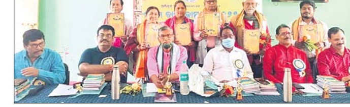
ଢେଙ୍କାନାଳ ଅଫିସରେ ଉଦ୍ଘାଟନା ହେଉଛି।

ତୁଟିପୁର୍ଣ୍ଣ ସାହିତ୍ୟ ସର୍ଜନା ଉତ୍ତରପିଢ଼ି ପାଇଁ ଘାତକ। କେବଳ ଲୋକାଭିମୁଖୀ ରଚନା ଏବଂ ଶୁଦ୍ଧ ସାହିତ୍ୟକୁ କାଳକ୍ରମେ କଳାକାରୀ ବୋଲି ଚିହ୍ନିତ କରିଛନ୍ତି।