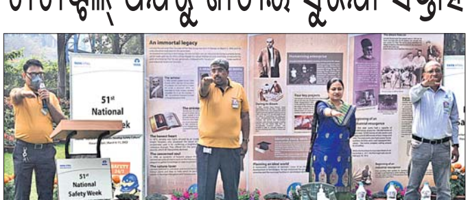
କମ୍ପାନୀର ଅଧିକାରୀମାନେ ଶପଥପାଠ କରୁଛନ୍ତି।

ଢେଙ୍କାନାଳ ଜିଲ୍ଲା ଟାଟାଷ୍ଟିଲ୍, ପରଜଙ୍ଗ କମ୍ପାନୀ ପରିସରରେ ଫେବୃଆରୀ ୪ରୁ ଆରମ୍ଭ ହୋଇଛି ୫୧ତମ ଜାତୀୟ ସୁରକ୍ଷା ସପ୍ତାହ।