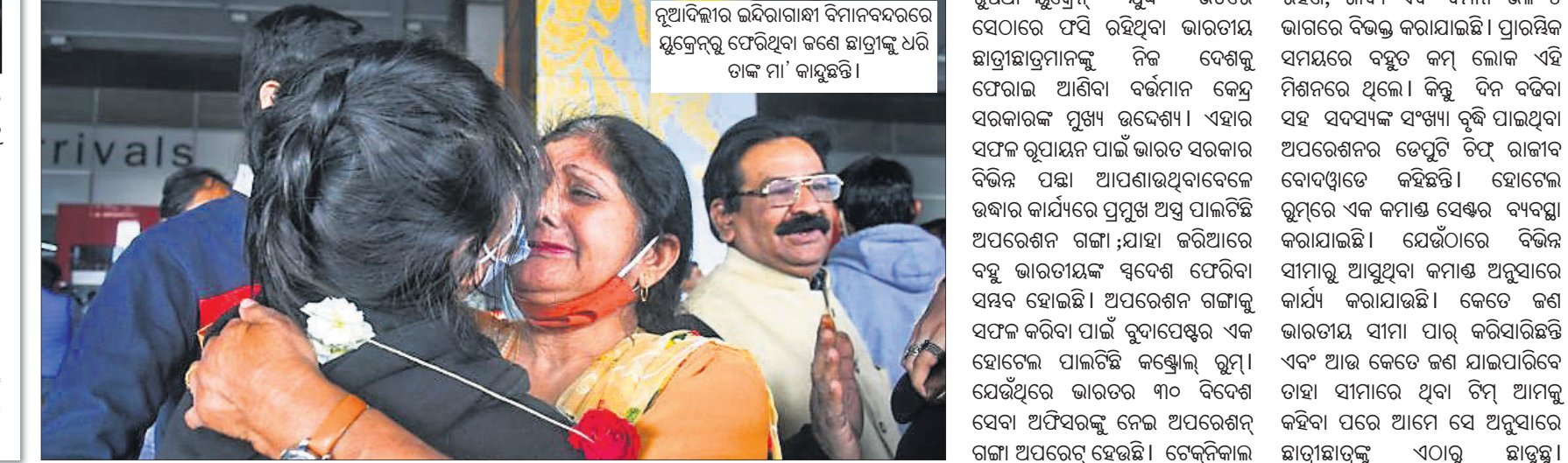
କ୍ୟୁଆପିକାର ଇନ୍ଦିରାଗାମ୍ପା ବିମାନବନ୍ଦରେ ଯୁଦ୍ଧେ ଫେରିଥିବା ଜଣେ ଛାତ୍ରାଳୁ ଧରି ତାଙ୍କ ମା' କାନ୍ଦୁଛନ୍ତି।

କ୍ୟୁଆପିକା, ୬ ମାର୍ଚ୍ଚ ଯୁଦ୍ଧେ ଉଦ୍ଧାର କାର୍ଯ୍ୟ ଶେଷ ପର୍ଯ୍ୟାୟରେ ପହଞ୍ଚିଛି। ସେଠାରେ ଆହୁରି ଅନେକ ରହିଯାଇଥିବାବେଳେ ଭାରତୀୟ ଦୂତାବାସ ପକ୍ଷରୁ ସେମାନଙ୍କ ପାଇଁ ରବିବାର ନୂଆ ଆଡ଼ଭାଇଜରି ଜାରି କରାଯାଇଛି। ମୁକ୍ତେନ୍ଦ୍ର ଓ ହଜେନ୍‌ରେ ଥିବା ଦୂତାବାସ ସେମାନଙ୍କୁ ଗୁଚ୍ଚତର ହ୍ୟାଣ୍ଡେଲରେ ଭାରତୀୟମାନଙ୍କୁ ହଜେନ୍