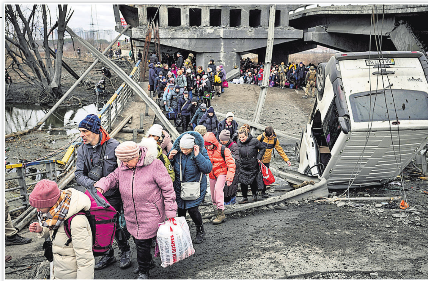
ଇଉକ୍ରେନ୍ ନଦୀ ପାର ହେବାକୁ ବହୁ ସଂଖ୍ୟାରେ ମୁକ୍ତେନ୍ଦ୍ର ନାଗରିକ ରୁଷିଆ ଆକ୍ରମଣରେ ଭାଙ୍ଗିଯାଇଥିବା ଏକ ପୋଲକୁ ଅତିକ୍ରମ କରୁଛନ୍ତି।