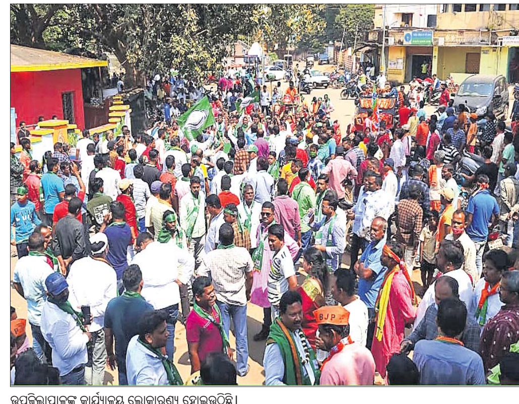
ଉପଜିଲାପାଳଙ୍କ କାର୍ଯ୍ୟାଳୟ ଲୋକାରଣ୍ୟ ହୋଇଉଠିଛି।