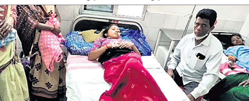
ସୁନ୍ଦରଗଡ଼ ଜିଲ୍ଲା ମୁଖ୍ୟ ଚିକିତ୍ସାଳୟରେ ଯୁବତୀ ଚିକିତ୍ସିତ ହେଉଛନ୍ତି ।