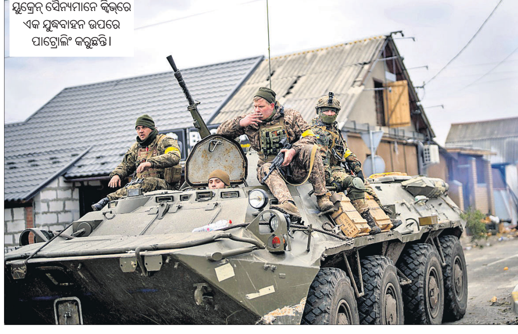
ଯୁକ୍ତେ ଯୈନ୍ୟମାନେ କିରୁରେ ଏକ ଯୁକ୍ତବାହନ ଉପରେ ପାଟ୍ରୋଲି କରୁଛନ୍ତି।

ଯୁକ୍ତେ ଉପରେ ରୁଷିଆର ଆକ୍ରମଣକୁ ରବିବାର ୧୧ ଦିନ ପୂରିଥିବାବେଳେ ଦକ୍ଷିଣ-ପୂର୍ବ ବନ୍ଦର ସହର ମାରିୟୁପୋଲରେ ଦ୍ଵିତୀୟ ଥର ସାମୟିକ ଭାବେ ଅସ୍ତବିରତି ଘୋଷଣା କରାଯାଇଛି। ସାଧାରଣ ନାଗରିକ ସେଠାରୁ ସୁରକ୍ଷିତ ଭାବେ ବାହାରିବା ନିମନ୍ତେ ମାନବୀୟ କ୍ରିଡ଼ା ପାଇଁ ରୁଷିଆ ଓ ଯୁକ୍ତେ ମଧ୍ୟରେ ହୋଇଥିବା ଦ୍ଵିତୀୟ ପର୍ଯ୍ୟାୟ ବୈଠକରେ ଉଭୟ ପକ୍ଷ ସହମତ ହୋଇଥିଲେ। ଯୁକ୍ତ ଆରମ୍ଭ ହେବା ପରଠାରୁ ଶନିବାର ପ୍ରଥମ ଥର ରୁଷିଆ ସେଠାରେ ଅସ୍ତବିରତି ଘୋଷଣା କରିଥିଲେ ହେଁ ଏହାର ଉଲ୍ଲଙ୍ଘନ କରାଯାଇଥିବା ଉଭୟ ଯୁକ୍ତେ ଓ ରୁଷିଆ ଅଭିଯୋଗ ଆଣିଥିଲେ। ପରେ ପୁଣି ରୁଷିଆ ପକ୍ଷରୁ ଆକ୍ରମଣ ଜାରି ରହିଥିଲା। ବନ୍ଦର ସହର ମାରିୟୁପୋଲ ନାଗରିକଙ୍କୁ ସୁରକ୍ଷା ଦେବା ନିମନ୍ତେ ରୁଷିଆ ଯୈନ୍ୟ ଓ ଯୁକ୍ତେ ସୁରକ୍ଷାକର୍ତ୍ତାଙ୍କ ମଧ୍ୟ ଏକ ନୂଆ କ୍ରିଡ଼ା ନିମନ୍ତେ ନିମନ୍ତେ ରାଜି ହୋଇଥିଲେ। ତେବେ ଅସ୍ତବିରତି ପୁଣି ଉଲ୍ଲଙ୍ଘନ କରି ରୁଷିଆ ଆକ୍ରମଣ ଜାରି ରଖିଥିବା ଯୁକ୍ତେ ଅଭିଯୋଗ ଆଣିଥିବା ବେଳେ ଯୁକ୍ତେ ପୁନର୍ବାର ସର୍ବ ଖୁଲାସା କରିଥିବା ମଧ୍ୟେ ପକ୍ଷରୁ ଜଣାଯାଇଛି। ପ୍ରମୁଖ ବନ୍ଦର ସହର ମାରିୟୁପୋଲକୁ ରୁଷିଆ କବ୍ଜା କରିନେଇ ଯୁକ୍ତେ ଲୁଣ ଯିବାକୁ କୃଷ୍ଣସାଗରକୁ ଆକ୍ରମଣ ହୋଇଯିବ। ସେଥିପାଇଁ ରୁଷିଆ ଯୁକ୍ତେର ଦକ୍ଷିଣ ଭାଗକୁ ଅଭିଆର କରିବାକୁ ଉଦ୍ୟମ କରୁଥିବା କିଛି ପକ୍ଷରୁ ଜଣାଯାଇଛି। ଏଥିସହ ଅନ୍ୟତମ ବନ୍ଦର ସହର ଓଡ଼େଶାକୁ ମଧ୍ୟ ରୁଷିଆ ଯୈନ୍ୟ ବୋମା