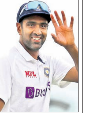
ଅଶ୍ୱିନ ପ୍ରଥମ ଇନିଂସରେ ୨ଟି ଓ ଦ୍ୱିତୀୟ ଇନିଂସରେ ୪ଟି ଉଇକେଟ ନେଇଛନ୍ତି । ଫଳରେ ତାଙ୍କ ଟେଷ୍ଟ ଉଇକେଟ ସଂଖ୍ୟା ୪୩୬ରେ ପହଞ୍ଚି ଯାଇଛି ।