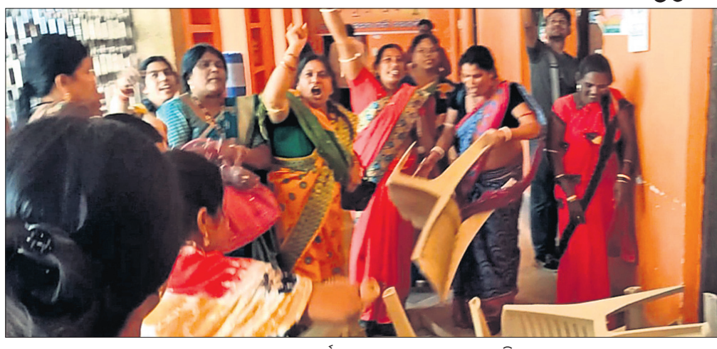
ଭାଜପା ଦଳୀୟ କାର୍ଯ୍ୟକ୍ରମରେ ଭଙ୍ଗାଚୁଡ଼ା କରାଯାଇଛି।