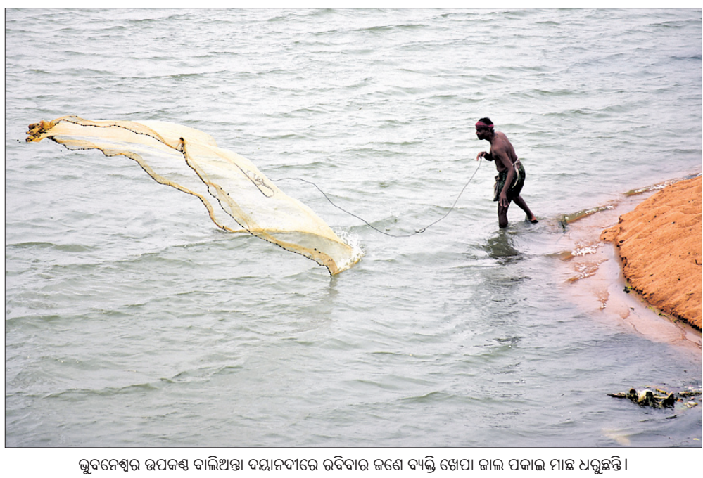
ଭୁବନେଶ୍ୱର ଉପକଣ୍ଠ ବାଲିଆଡ଼ା ଦୟାନନ୍ଦୀରେ ରବିବାର ଜଣେ ବ୍ୟକ୍ତି ଖେପା ଜାଲ ପକାଇ ମାଛ ଧରୁଛନ୍ତି ।