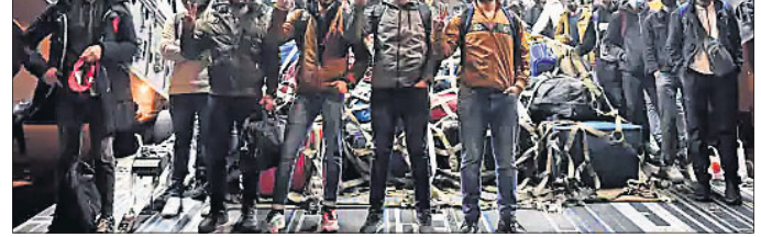
ବୁଦାପେଷ୍ଟରେ ସୁପର ୩୦ ଚିମ୍ପର ସଦସ୍ୟ।