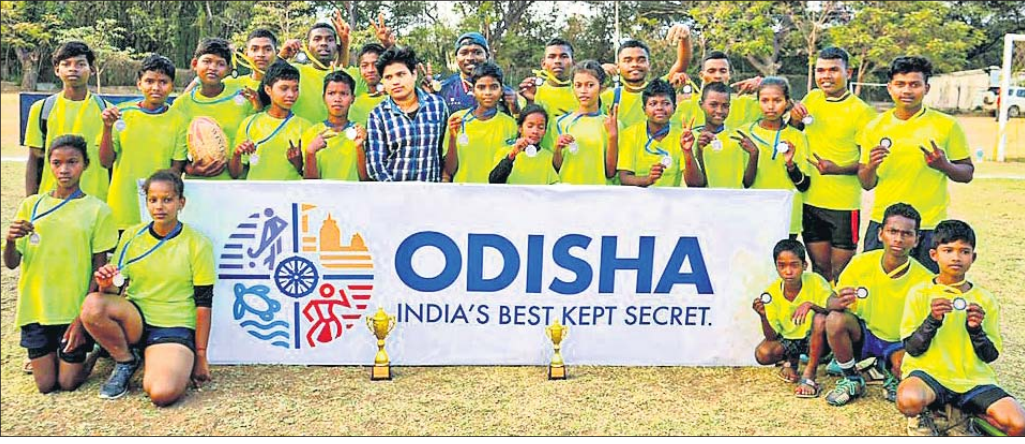
ସିକନ୍ଦରାବାଦରେ ଅନୁଷ୍ଠିତ ୧୪ ବର୍ଷରୁ କମ୍ ଜାତୀୟ ସର୍ବକ୍ରୀଡ଼ାରେ ଉତ୍ତୀର୍ଣ୍ଣ ପ୍ରାପ୍ତ ଗାମ୍ପିନଶିଳ୍ପରେ ଓଡ଼ିଶାର ନିର୍ଦ୍ଦେଶକ ସମେତ ବାଳକ ବନ୍ଦୀ।

କୋ ସାମ୍ରାଜ୍ୟ (ଥାଇଲାଣ୍ଡ), ୬୩୩ (ପି.ଟି.): ଥାଇଲାଣ୍ଡ ପୋଲିସ୍ କିମ୍ବଦନ୍ତୀ ଅଷ୍ଟ୍ରେଲୀୟ କ୍ରୀଡ଼ାକର୍ତ୍ତା ଶେନ୍ ଓଡ଼ିଶା ଆକାଶ ମୁହୂର୍ତ୍ତ ନେଇ ତଦନ୍ତ ବେଳେ ତାଙ୍କ ରୁମ୍‌ରେ ତଟାଣ ଏବଂ ଗାଧୁଆ ଟାଙ୍ଗେଇରେ ରକ୍ତ ଦାଗ ଦେଖିବାକୁ ପାଇଛି। ଓଡ଼ିଶା ଆକାଶକୁ ଛୁଟି କଟାଇବାକୁ ଆସିଥିବା ବେଳେ ଏକ ଦିନାସପୁର୍ଣ୍ଣ ଭିଲାଇରେ ଅବସ୍ଥାନ କରୁଥିଲେ। ସେଠାରେ ତାଙ୍କର ହୃଦ୍‌ଘାତରେ ପ୍ରାଣହାନି ଘଟିଥିବା ସନ୍ଦେହ କରାଯାଇଛି। ଆମ୍ବୁଲାନ୍ସ ଆସିବା ପର୍ଯ୍ୟନ୍ତ ଦିନାସପୁର୍ଣ୍ଣ ଭିଲାଇରେ ଓଡ଼ିଶା ବନ୍ଧୁକାଳୀ ଲାଗି ପ୍ରଥମେ ତାଙ୍କ ବନ୍ଧୁମାନେ ଚେଷ୍ଟା କରି ବିଫଳ ହୋଇଥିଲେ। ଶୁକ୍ରବାର ରାତିରେ ଥାଇଲାଣ୍ଡର ନ୍ୟାଶନାଲ ହସ୍ପିଟାଲରେ ତାଙ୍କୁ ଚିକିତ୍ସା କରାଯାଇଛି। ୫୨ବର୍ଷୀୟ କ୍ରୀଡ଼ାକର୍ତ୍ତାଙ୍କୁ ମୃତ ଘୋଷଣା କରିଥିଲେ। କୃତ୍ରିମ ଉପାୟରେ ଓଡ଼ିଶା ସ୍ୱାଭାବିକ କରିବାଲାଗି ଚେଷ୍ଟା ବେଳେ ତାଙ୍କ ପାଟିକୁ ତରଳ ପଦାର୍ଥ ସହ ରକ୍ତ ବାହାରିଥିଲା। ସ୍ଥାନୀୟ ପୋଲିସ୍ କର୍ମଚାରୀ କହିଛନ୍ତି, ଓଡ଼ିଶା ନିକଟରେ ଜଣେ ଡାକ୍ତରଙ୍କୁ ଭେଟି ତାଙ୍କ ହାତର ଅବସ୍ଥା ନିକଟରେ ଥିବା ଦେଖି ପ୍ରଶ୍ନ କରାଯାଇଥିଲା। ତେଣୁ ତାଙ୍କର ହୃଦ୍‌ଘାତରେ ମୃତ୍ୟୁ ଘଟିଥିବା ସନ୍ଦେହ କରାଯାଇଛି। ଓଡ଼ିଶା ସାଙ୍ଗମାନଙ୍କ ସହ ଥାଇଲାଣ୍ଡ ଉପସାହାୟତା ଅର୍ଜନ ଲୋକପ୍ରିୟ ହୁଏ କୋ' ସାମ୍ରାଜ୍ୟରେ ଛୁଟି କଟାଇବା ଲାଗି ଯାଇଥିଲେ। ସନ୍ଧ୍ୟା ୫ଟା ବେଳେ ଓଡ଼ିଶା ନିପ୍ରେତ ଅବସ୍ଥାରେ ପଡ଼ି ରହିଥିବା କ୍ରୀଡ଼ାକର୍ତ୍ତାଙ୍କ ଜଣେ ବନ୍ଧୁ ପ୍ରଥମେ ଦେଖିବାକୁ ପାଇଥିଲେ। ସାଙ୍ଗମାନେ ଆମ୍ବୁଲାନ୍ସକୁ ଅପେକ୍ଷା କରି ପ୍ରଥମେ ଓଡ଼ିଶା ସ୍ୱାଭାବିକ ଚାଲୁ ପାଇଁ କୃତ୍ରିମ ଉପାୟରେ ଚେଷ୍ଟା କରିଥିଲେ। ଓଡ଼ିଶା ମ୍ୟାନେଜମେଣ୍ଟ ପରେ ଏକ ସଂକ୍ଷିପ୍ତ ବିବୃତିରେ ତାଙ୍କୁ ମୃତ ଘୋଷଣା କରିଥିଲା।