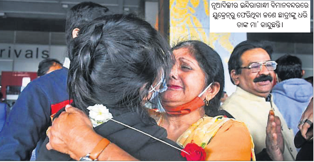
ନୂଆଦିଲ୍ଲୀର ଇନ୍ଦିରାଗାନ୍ଧୀ ବିମାନବନ୍ଦରରେ ଯୁକ୍ତେରୁ ଫେରିଥିବା ଜଣେ ଛାତ୍ରାହାରୀ ଧରି ଚାକ ମା' କାହୁଛନ୍ତି।

ଏପର୍ଯ୍ୟନ୍ତ ୧୫,୯୨୦ ଭାରତୀୟଙ୍କୁ ଫେରାଇ ଆଣାଯାଇଥିବା ସରକାରଙ୍କ ପକ୍ଷରୁ ଜଣାଯାଇଛି। ଯେଉଁ ଛାତ୍ରାହାରୀ ରହିଯାଇଛନ୍ତି, ସେମାନେ ହଜେରିର ବୁଦାପେଷ୍ଟ ସହରରେ ଗ୍ଲାମାୟ ସମୟ ସମ୍ଭାଳି ୧୦ରୁ ୧୨ଟା ମଧ୍ୟରେ ପହଞ୍ଚିବାକୁ ସେଠାରେ ଥିବା ଭାରତୀୟ ଦୂତାବାସ ପକ୍ଷରୁ ପରାମର୍ଶ ଦିଆଯାଇଛି। ସେହିପରି ଗୁରୁତ୍ଵ ଫର୍ମରେ ରୁକ୍ଷ ନିଜ ପରିଚୟ, ରହିବା ଗ୍ଲାମ ଆଦି ଅନୁଲୋଚନରେ ପୂରଣ କରିବାକୁ ଯୁକ୍ତେରୁ ଦୂତାବାସ କହିଛି।