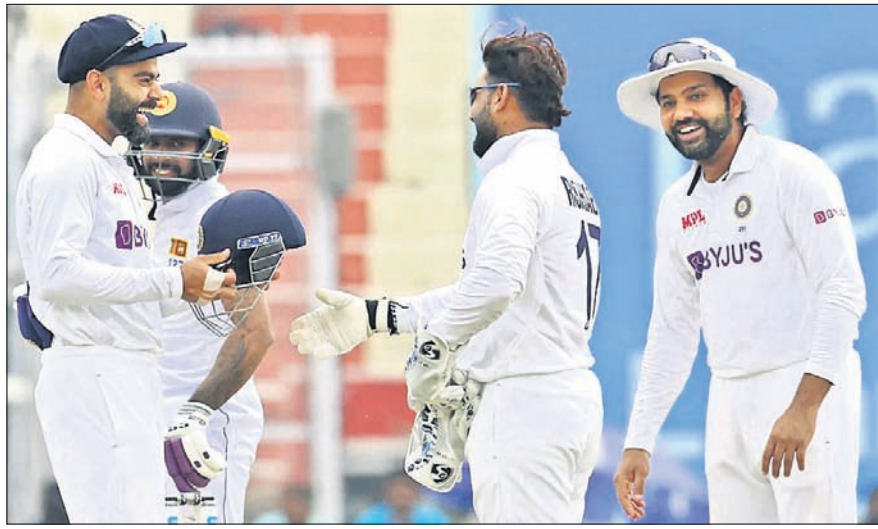
ଖୁସି ମୁହୂର୍ତ୍ତରେ ବିରାଟ କୋହଲି, ରିଷଭ ପନ୍ତ ଓ ଅଧିନାୟକ ରୋହିତ ଶର୍ମା ।