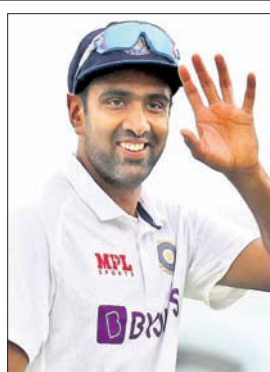
ଅଶ୍ୱିନ ପ୍ରଥମ ଇନ୍ଦିଆରେ ୨୮ଟି ଓ ବିତ୍ରୀୟ ଇନ୍ଦିଆରେ ୪୮ଟି ଉଇକେଟ ନେଇଛନ୍ତି । ଫଳରେ ତାଙ୍କ ଟେଷ୍ଟ ଉଇକେଟ ସଂଖ୍ୟା ୪୩୯ରେ ପହଞ୍ଚି ଯାଇଛି ।

ମୋହଲି, ୬୩ (ପି.ଟି.): ଟେଷ୍ଟ ଜିକେଟରେ ସର୍ବାଧିକ ଉଇକେଟ ନେବାରେ କିଏପଟା ଖେଳାଳି କପିଳ ଦେବଙ୍କ ରେକର୍ଡକୁ ଅତିକ୍ରମ କରିଛନ୍ତି ଚାରକା ସିନର ରବିଚନ୍ଦ୍ର ଅଶ୍ୱିନ । ଏଠାରେ କ୍ୟାରିୟରର ୮୫୪ତମ ଟେଷ୍ଟ ଖେଳିଥିବା ଅଶ୍ୱିନ ଶ୍ରୀମଙ୍ଗଳ ବିତ୍ରୀୟ ଇନ୍ଦିଆରେ ଚତୁର୍ଥ ଅଧିକାଙ୍କ ଭାବେ ୨୮ଟି ଉଇକେଟ ନେଇ କପିଳଙ୍କ ୪୩୯ ଟେଷ୍ଟ ଉଇକେଟ ରେକର୍ଡକୁ ପଛରେ ପକାଇଛନ୍ତି । ଏଠାରେ