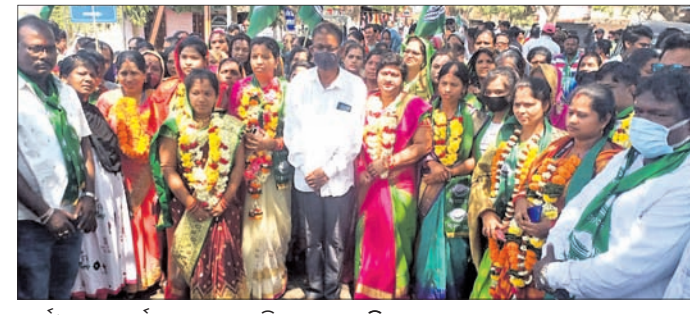
ପ୍ରାର୍ଥୀମାନେ ପ୍ରାର୍ଥପତ୍ର ଦାଖଲ କରିବାକୁ ଯାଉଛନ୍ତି।

ଭୁବନେଶ୍ୱର, ୬ମାର୍ଚ୍ଚ (ସ.ପ୍ର.): ଛତ୍ରପୁର ଏନ୍-ଏସିରେ ପ୍ରତିଯୋଗିତା ହୋଇଛି।