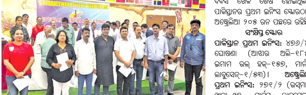
ରବିବାର ବୈଠକ ପରେ ଭୁବନେଶ୍ୱର ଆଥଲେଟିକ୍ ଆସୋସିଏଶନର ନୂଆ କର୍ମକର୍ତ୍ତା।