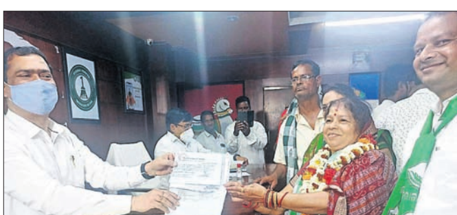
ନିର୍ବାଚନ ଅଧିକାରୀ ଲଗେ ପ୍ରାର୍ଥୀଙ୍କ ନାମାଙ୍କନ ପତ୍ର ଗ୍ରହଣ କରୁଛନ୍ତି ।