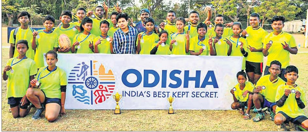
ବିକାସପୂର୍ଣ୍ଣରେ ଅନୁଷ୍ଠିତ ୧୫ ବର୍ଷୀୟ କମ୍ କାଠାୟ ସର୍ବନିମ୍ନର ରକ୍ତଦା ଚାପିନିଶିପରେ ଓଡ଼ିଶାର ନିର୍ଦ୍ଦୋଷ ବିଜୟୀ ବାଳିକା ଓ ଡ୍ରୋୱ୍ଡ଼ ବଜେଟା ବାକକ ଦକ।

କୋ ସାମୁଦ୍ର (ଥାଇଲ୍ୟାଣ୍ଡ), ୬୩ (ସି.ଟି.): ଥାଇଲ୍ୟାଣ୍ଡ ପୋଲିସ୍ କମିସନରୀ ଅସ୍ପେକ୍ଟାଭଲ୍ କ୍ରିକେଟର ଶେନ୍ ଓଡ଼ିଶା ଆକାଶ ମ୍ୟୁଜିକ୍ ନେଲ୍ ତଦନ୍ତ ବେଳେ ତାଙ୍କ ରୂମ୍ରେ ଚଟାଣ ଏବଂ ଗାଧୁଆ ଟାଙ୍ଗୁଣରେ ରକ୍ତ ଦାଗ ଦେଖିବାକୁ ପାଇଛି। ଓଡ଼ିଶା ଆଇଲାଣ୍ଡକୁ ହୁଟି କଟାଇବାକୁ ଆସିଥିବା ବେଳେ ଏକ ବିକାସପୂର୍ଣ୍ଣ ଭିଲରେ ଅବସ୍ଥାନ କରୁଥିଲେ। ସେଠାରେ ତାଙ୍କର ହୃଦୟତାରେ ପ୍ରାଣହାନି ଘଟିଥିବା ସନ୍ଦେହ କରାଯାଇଛି। ଆଲୁଲାସ୍ ଆସିବା ପର୍ଯ୍ୟନ୍ତ ବିକାସପୂର୍ଣ୍ଣ ଭିଲରେ ଓଡ଼ିଶା ବନ୍ଧୁକବା ଲାଗି ପ୍ରଥମେ ତାଙ୍କ ବନ୍ଧୁକରେ ଚେଷ୍ଟା କରି ବିଫଳ ହୋଇଥିଲେ। ଶୁକ୍ରବାର ରାତିରେ ଥାଇଲ୍ୟାଣ୍ଡର ନ୍ୟାଶନାଲ ହସ୍ପିଟାଲରେ ତାଙ୍କୁ ନିର୍ଦ୍ଦୋଷ ୫୨ ବର୍ଷୀୟ କ୍ରିକେଟ୍ କମିସନରୀକୁ ମୃତ ଘୋଷଣା କରିଥିଲେ। କୁଟିମ୍ ଉପାୟରେ ଓଡ଼ିଶା ଶ୍ୱାଭାବିକ କରିବାଲାଗି ଚେଷ୍ଟା ବେଳେ ତାଙ୍କ ପାଟିକୁ ତରଳ ପଦାର୍ଥ ସହ ରକ୍ତ ବାହାରିଥିଲା। ଗୁଣାମୟ ପୋଲିସ୍ କର୍ମୀଙ୍କ କହିଛନ୍ତି, ଓଡ଼ିଶା ନିକଟରେ କଣେ ତାଙ୍କୁ ଭେଟି ତାଙ୍କ ହାତର ଅବସ୍ଥା କିପରି ଅଛି ସେ ସମ୍ବନ୍ଧରେ ପତାର ବୁଝିଥିଲେ। ତେଣୁ ତାଙ୍କର ହୃଦୟତାରେ ମୃତ୍ୟୁ ଘଟିଥିବା ସନ୍ଦେହ କରାଯାଇଛି। ଓଡ଼ିଶା ସାଙ୍ଗମାନଙ୍କ ସହ ଥାଇଲ୍ୟାଣ୍ଡ ଉପସାଗର ଅନ୍ତର୍ଗତ ଲୋକପ୍ରିୟ ହାପି କୋ ସାମୁଦ୍ରରେ ହୁଟି କଟାଇବା ଲାଗି ଯାଇଥିଲେ। ସନ୍ଧ୍ୟା ୫ଟା ବେଳେ ଓଡ଼ିଶା ନିଷ୍ପେଦ ଅବସ୍ଥାରେ ପଡ଼ି ରହିଥିବା କ୍ରିକେଟ୍ କମିସନରୀଙ୍କ ଜଣେ ବନ୍ଧୁ ପ୍ରଥମେ ଦେଖିବାକୁ ପାଇଥିଲେ। ସାଙ୍ଗମାନେ ଆଲୁଲାସ୍ ଅପେକ୍ଷା କରି ପ୍ରଥମେ ଓଡ଼ିଶା ଶ୍ୱାସପ୍ରକ୍ରିୟା ଚାଲୁ ପାଇଁ କୁଟିମ୍ ଉପାୟରେ ଚେଷ୍ଟା କରିଥିଲେ। ଓଡ଼ିଶା ମ୍ୟାନେଜମେଣ୍ଟ ପରେ ଏକ ସଂକ୍ଷିପ୍ତ ବିବୃତ୍ତିରେ ତାଙ୍କୁ ମୃତ ଘୋଷଣା କରିଥିଲା।