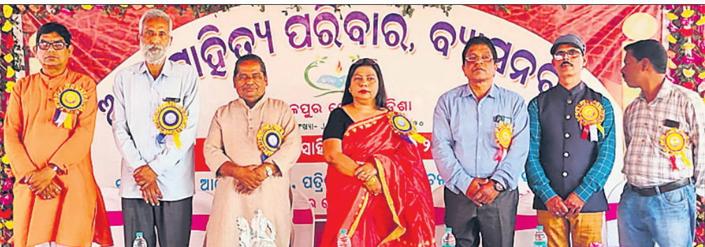
ଆମ ସାହିତ୍ୟ ପରିବାର ପକ୍ଷରୁ ଅନୁଷ୍ଠିତ କାର୍ଯ୍ୟକ୍ରମରେ ମହାଧିକାରୀ ଅତିଥି ।

ରାଜ୍ୟସ୍ତରୀୟ ସାହିତ୍ୟ ମହୋତ୍ସବ । ରାଜ୍ୟସ୍ତରୀୟ ସାହିତ୍ୟ ମହୋତ୍ସବ । ରାଜ୍ୟସ୍ତରୀୟ ସାହିତ୍ୟ ମହୋତ୍ସବ ।