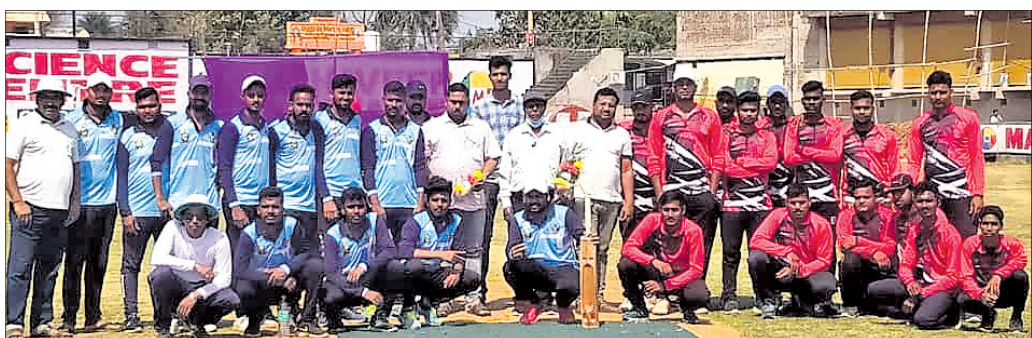
ଅତିଥିଙ୍କ ସହ ଭଲ ସମ୍ପର୍କ ସ୍ଥାପନ କରାଯାଇଛି।

ଭୁବନେଶ୍ୱର, ୬ମାର୍ଚ୍ଚ (ସ.ପ୍ର.): ସିଲେକ୍ସନ ଓ ରିୟର, ଟାଇଗର ଟିମ୍ ବିଜୟୀ ହୋଇଛି।