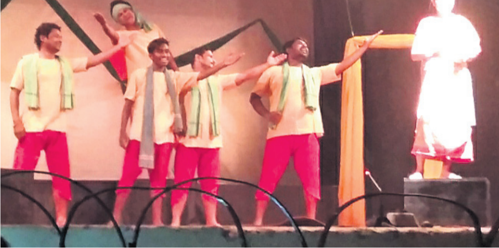
ନାଟକ 'ଦୂର ଆକାଶ'ର ଏକ ଦୃଶ୍ୟ।