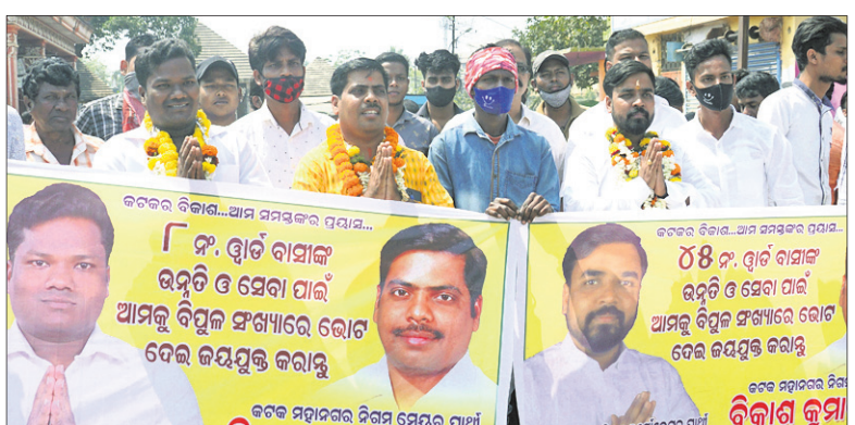
ବିଜେଡି, କଂଗ୍ରେସ ଓ ସାଧାରଣ ପ୍ରାର୍ଥୀ ନାମାଙ୍କନ ପତ୍ର ଦାଖଲ କରିବାକୁ ରବିବାର ଶୋଭାଯାତ୍ରାରେ ସିଏମ୍‌ସି ବିଜୁ ଭବନକୁ ଯାଉଛନ୍ତି ।