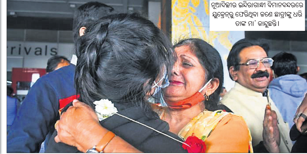
ନୂଆଦିଲ୍ଲୀର ଇନ୍ଦିରାଗାନ୍ଧୀ ବିମାନବନ୍ଦରେ ୟୁକ୍ରେନ୍‌ରୁ ଫେରିଥିବା ଜଣେ ଛାଡ଼ିବାକୁ ଧରି ତାଙ୍କ ମା' କାନ୍ଦୁଛନ୍ତି।

ଏପର୍ଯ୍ୟନ୍ତ ୧୫,୯୨୦ ଭାରତୀୟଙ୍କୁ ଫେରାଇ ଅଣାଯାଇଥିବା ସରକାରଙ୍କ ପକ୍ଷରୁ ଜଣାଯାଇଛି। ଯେଉଁ ଛାଡ଼ିଛାଡ଼ି ରହିଯାଇଛନ୍ତି, ସେମାନେ ହଙ୍ଗେରିର ଦୂତାପେଷ୍ଠ ସହରରେ ଗ୍ଲାମାୟ ସମୟ ସମ୍ଭାଳି ୧୦ରୁ ୧୨ଟି ମଧ୍ୟରେ ପହଞ୍ଚିବାକୁ ସେଠାରେ ଥିବା ଭାରତୀୟ ଦୂତାବାସ ପକ୍ଷରୁ ପରାମର୍ଶ ଦିଆଯାଇଛି। ସେହିପରି ଗୁରୁତ୍ଵ ଫର୍ମରେ ତୁରନ୍ତ ନିଜ ପରିଚୟ, ରହିବା ଗ୍ଲାମ ଆଦି ଅନୁଲୋଚନରେ ପୂରଣ କରିବାକୁ ୟୁକ୍ରେନ୍‌ରୁ ଦୂତାବାସ କହିଛି।