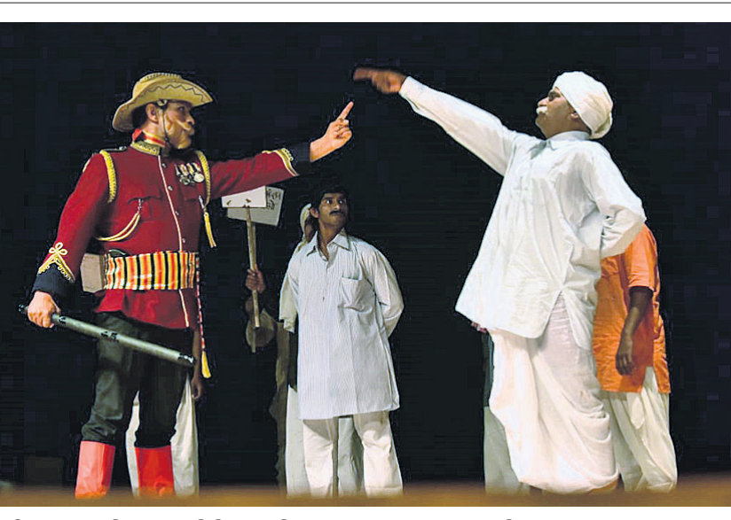
ଓଡ଼ିଆ ଭାଷା, ସାହିତ୍ୟ ଓ ସଂସ୍କୃତି ବିଭାଗ, ଓଡ଼ିଶା ସଙ୍ଗୀତ ନାଟକ ଏକାଡେମୀ, ଓଡ଼ିଶା ନାଟ୍ୟସଂଘ ପକ୍ଷରୁ ଭୁବନେଶ୍ୱର ରବୀନ୍ଦ୍ର ମଣ୍ଡପରେ ଚାଲିଥିବା ପୂର୍ବତନ ଜାତୀୟ ନାଟ୍ୟ ଉତ୍ସବର ରବିବାର ସନ୍ଧ୍ୟାରେ ପରିବେଷିତ ନାଟକ 'ଶ୍ରୁତି ଦୀର ଆବାଦ'।