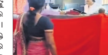
ସମ୍ପର୍କରେ ଜଣାଇଥିଲେ। ଜଳ ନିଷ୍କାସନ ପଥକୁ କେତେଜଣ ଲୋକ ପୋଖରୀ

ଆତିବନ୍ଧ କରିବା ଦ୍ୱାରା ଜଳ ନିଷ୍କାସନରେ ବ୍ୟାଧାତ ହେଉଛି ବୋଲି ସେ ଅଭିଯୋଗ କରିଥିଲେ। କୌଣସି କାରଣରୁ ସମାଧାନ ହୋଇପାରିନଥିଲା। ଏନେଇ ମହିଳା ଜଣକ ଜିଲ୍ଲାପାଳଙ୍କ ନିକଟରେ ଅଭିଯୋଗ କରିଥିଲେ। ଆସନ୍ତା ୧୦ତାରିଖରେ ଜିଲ୍ଲାପାଳ ଶୁଣାଣି କରିବେ ବୋଲି ମହିଳା ଜଣକ ଜାଣିବା ପରେ ନୂତନ ତହସିଲଦାର ପରିଡ଼ାଙ୍କୁ ଭେଟିବା ପାଇଁ ଯାଇଥିଲେ। ଏହି ସମୟରେ ତହସିଲଦାର ପରିଡ଼ା ଏକ କେସ୍