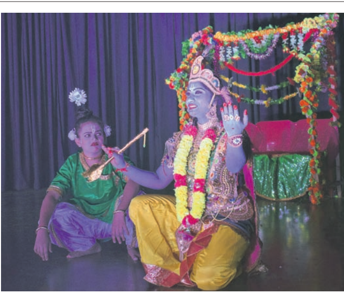
ସମ୍ରାଟ ସେଇ କଳାର ପୂଜାରୀ ଅନୁଷ୍ଠାନ ପକ୍ଷରୁ ଭୁବନେଶ୍ୱର ସୂଚନା ଭବନରେ ପରିବେଷିତ ନାଟକ 'ରାସଲୀଳା' ଏକ ଦୃଶ୍ୟ।