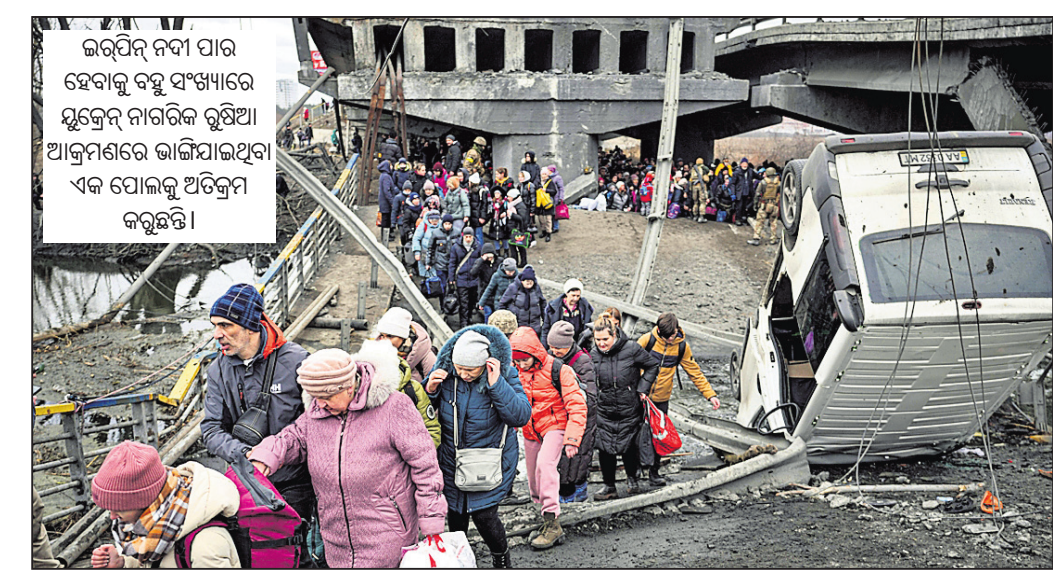
ଇଉକ୍ରେନ୍ ନଦୀ ପାର ହେବାକୁ ବହୁ ସଂଖ୍ୟାରେ ୟୁକ୍ରେନ୍ ନାଗରିକ ରୁଷିଆ ଆକ୍ରମଣରେ ଭାଙ୍ଗିଯାଇଥିବା ଏକ ପୋଲକୁ ଅତିକ୍ରମ କରୁଛନ୍ତି।

ସେପରି ନିଜ ରକ୍ଷା ନିଜେ କରିପାରିବେ ସେ ଦିଗରେ ବିଶ୍ଵ ନେତା ସହଯୋଗ କରନ୍ତୁ। ରୁଷିଆ ଉପରେ ଆର୍ଥିକ କଟକଣା କଠୋର କରାଯାଉ। ୟୁକ୍ରେନ୍‌ରେ ରୁଷିଆର ପ୍ରତିରୋଧ କରିବା ଦିଗରେ ଶତ୍ରୁତା ନାହିଁ କିମ୍ବା ଏକ ମହାଶକ୍ତି ସହ ବିବାଦ ସୃଷ୍ଟି କରିବାକୁ ଇଚ୍ଛା ନ ଥିବା ବୋରିସ୍ ଲେଖିଛନ୍ତି। ୟୁକ୍ରେନ୍ ରୋକିବାକୁ ୬ ଉପାୟ ଦେଇଛନ୍ତି। ସେଗୁଡ଼ିକ ହେଲା, ୟୁକ୍ରେନ୍ ପାଇଁ ବିଶ୍ଵ ନେତାମାନେ ଅତ୍ୟନ୍ତ ମାନବୀୟ ସହାୟତା ପାଇଁ ଆଗେଇ ଆସନ୍ତୁ। ୟୁକ୍ରେନ୍