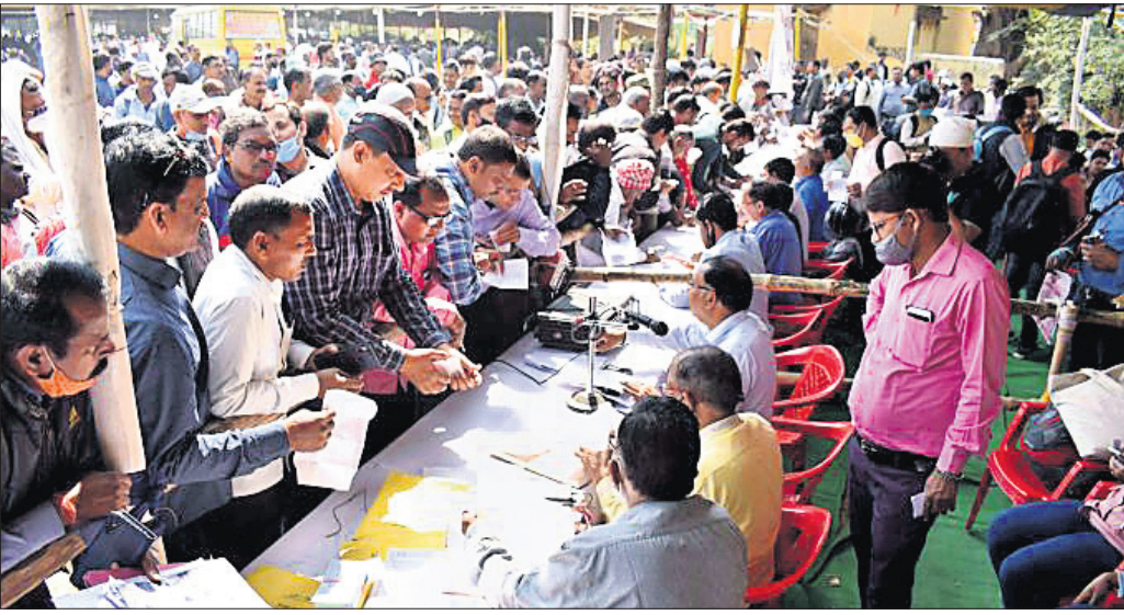
ବାରାଣସୀରେ ଭୋଟ ପାଇଁ ପୋଲିଙ୍ଗ କର୍ମଚାରୀମାନେ ଲକ୍ଷିମ୍ପୂର୍ଣ୍ଣ ଅନାମ୍ୟ ସାମଗ୍ରୀ ସଂଗ୍ରହ କରୁଛନ୍ତି ।

ଉତ୍ତରପ୍ରଦେଶ ବିଧାନସଭା ନିର୍ବାଚନର ସପ୍ତମ ତଥା ଚୁଡ଼ାନ୍ତ ପର୍ଯ୍ୟୟ ଭୋଟ ସୋମବାର ହେବାକୁ ଯାଉଛି । ଏହି ପର୍ଯ୍ୟୟରେ ପ୍ରଧାନମନ୍ତ୍ରୀ ନରେନ୍ଦ୍ର ମୋଦିଙ୍କ ବାରାଣସୀ ଲୋକ ସଭା ନିର୍ବାଚନମଣ୍ଡଳୀ ସମେତ ୫୪ ଆସନରେ ଭୋଟରମାନେ ୬ମାର୍ଚ୍ଚ ପ୍ରାର୍ଥୀଙ୍କ ଭାଗ୍ୟ ନିର୍ଦ୍ଧାରଣ କରିବେ । ଆଜପରତ୍ନ, ମାଉ, ଉତ୍ତରପୁର, ଗାଜପୁର, ଚାଣ୍ଡୋଲି, ବାରାଣସୀ, ମିର୍ଜାପୁର, ଇସ୍ମେଲି ଏବଂ ସୋନଭଡ଼ା ଜିଲ୍ଲାରେ ସକାଳ ୭ଟି ସମ୍ପନ୍ନ ୬ ପର୍ଯ୍ୟନ୍ତ ଭୋଟଗ୍ରହଣ କରାଯିବ । ଏଥିପାଇଁ ଶନିବାର ସମ୍ପନ୍ନ ପ୍ରଚାର ଶେଷ ହୋଇଛି । ଶାସକ ଭାଜପା ଏବଂ ବିରୋଧୀ ଦଳଗୁଡ଼ିକ ବିଭିନ୍ନ ପ୍ରସଙ୍ଗ ନେଇ ପରସ୍ପରକୁ ସମାଲୋଚନା କରିଥିଲେ ।