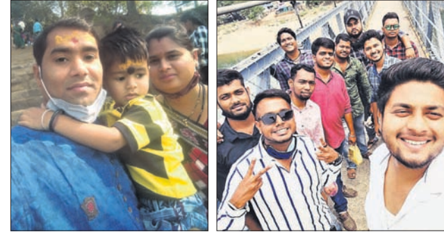
@ ସୁମତ୍ତ @ ପ୍ରିୟନ୍ତତ