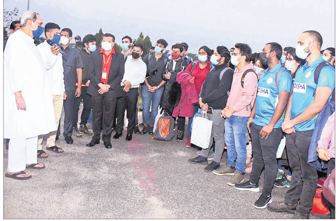
ସ୍ୱତନ୍ତ୍ର ବିମାନ ଯୋଗେ ଭୁବନେଶ୍ୱର ବିମାନ ବନ୍ଦରରେ ସୋମବାର ପହଞ୍ଚିଥିବା ଛାତ୍ରାଛାତ୍ରୀଙ୍କୁ ମୁଖ୍ୟମନ୍ତ୍ରୀ ନବୀନ ପଟ୍ଟନାୟକ ସାଗତ କରୁଛନ୍ତି। ପାଖରେ ଅଛନ୍ତି ୫-ଟି ସଚିବ ଭି.କେ. ପାଣ୍ଡିଆନ।

ସୋମବାର ରାତି ୧୦ଟା ସୁଦ୍ଧା (+ ଅନ୍ୟ ରୋଗର କରୋନା ଆକ୍ରମଣ ମୃତ୍ୟୁ) ଉପ୍ୟ: https://www.worldometers.info/coronavirus/ ଏବଂ ଓଡ଼ିଶା ସରକାର