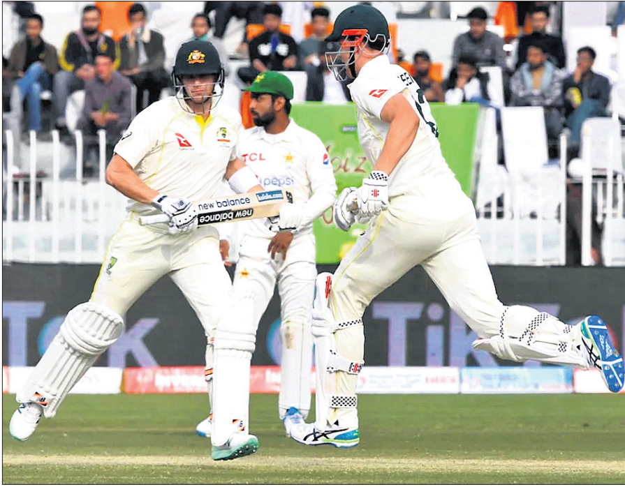
ସୋମବାର ଭାଗାଦାରି ଅବସରରେ ଷ୍ଟିଭେନ୍ ସ୍ମିଥ ଓ କାମେରନ ଗ୍ରାନ୍ ।

ଏଠାରେ ଚାଲିଥିବା ପାକିସ୍ତାନ-ଅଷ୍ଟ୍ରେଲିଆ ପ୍ରଥମ କ୍ରିକେଟ ଟେଷ୍ଟ ଡ୍ର ଅଭିମୁଖେ ଗତି କରିଛି । ମ୍ୟାଚର ୪ ଦିନ ଖେଳ ଶେଷ ହୋଇ ଯାଇଥିଲେ ହେଁ ଏପର୍ଯ୍ୟନ୍ତ ପ୍ରଥମ ଇନିଂସ ଖେଳ ଶେଷ ହୋଇନାହିଁ । ଟେଷ୍ଟ ମଙ୍ଗଳବାର ଅନ୍ତିମ ଦିବସରେ ମ୍ୟାଚରୁ ଫଳାଫଳ ମିଳିବା ସମ୍ଭାବନା କମ୍ । ସୋମବାର ଚତୁର୍ଥ ଦିବସ ଷ୍ଟମ୍ପ ଅପସାରଣ ବେଳକୁ ଅଷ୍ଟ୍ରେଲିଆ ପ୍ରଥମ ଇନିଂସରେ ୭ ଉଇକେଟ ହରାଇ ୪୪୯ ରନ ସଂଗ୍ରହ କରିଛି । ହାତରେ ୩ ଉଇକେଟ ବାକିଥାଇ ଭ୍ରମଶଙ୍କାରୀ ଦଳ ପାକିସ୍ତାନ ପ୍ରଥମ ଇନିଂସଠାରୁ ୨୭ ରନ ପଛରେ ରହିଛି । ପାକିସ୍ତାନ ଏହାର ପ୍ରଥମ ଇନିଂସକୁ ୪୭୬/୪ରେ ଯୋଷଣା କରିଥିଲା । ତୃତୀୟ ଦିବସର ଅସମାପ୍ତ ଷ୍ଟୋର ୨୭୧/୨ରୁ ଖେଳ ଆରମ୍ଭ କରିଥିଲା ଅଷ୍ଟ୍ରେଲିଆ । ମାର୍ଚ୍ଚ ଲାହୁସେନ ଓ ଷ୍ଟିଭେନ୍ ସ୍ମିଥ ତୃତୀୟ ଉଇକେଟରେ ୧୦୮ ରନର ଭାଗାଦାରି ଗଢ଼ିଥିଲେ । ଲାହୁସେନ ୧୫୮ ବଲ୍‌ରୁ ୧୨ ଚୋକା ସହାୟତାରେ ୯୦ ରନ କରି ଆଉଟ ହେବାରୁ ଯୋଡ଼ି ଭାଙ୍ଗିଥିଲା । ଲାହୁସେନଙ୍କୁ ଆଉଟ କରି ଛୁଟ ବୋଲର ଶାହିନ ଶାହ ଆଫ୍ରିଦୀ ପାକିସ୍ତାନକୁ ଟ୍ରକ ଥୁ ଦେଇଥିଲେ । ଗ୍ରାଭିସ ହେଡ୍ (୮) ଫେଲ୍ ମାରିଥିଲେ ହେଁ ସ୍ମିଥ ଓ କାମେରନ ଗ୍ରାନ୍ ୫ମ ଉଇକେଟରେ ୮୧ ରନ ଯୋଗକରି ଇନିଂସକୁ ଆଗେଇ ନେଇଥିଲେ । ଗ୍ରାନ୍ ୪୮ ରନ