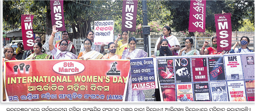
ଭୁବନେଶ୍ୱରଠାରେ ସର୍ବଭାରତୀୟ ମହିଳା ସାଂସ୍କୃତିକ ସଂଗଠନ ପକ୍ଷରୁ ନାରୀ ବିରୋଧୀ ଆଭିଯୁକ୍ତ ବିରୋଧରେ ପ୍ରତିବାଦ କରାଯାଇଛି।