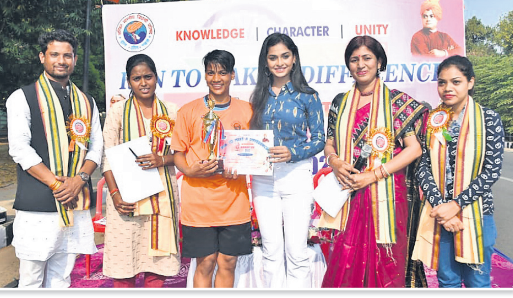
ଅଧିକ ଭାରତୀୟ ବିଦ୍ୟାର୍ଥୀ ପରିଷଦ ପକ୍ଷରୁ ଭୁବନେଶ୍ୱରସ୍ଥିତ ରମାଦେବୀ ମହିଳା ବିଶ୍ୱବିଦ୍ୟାଳୟ ନିକଟରେ ଆୟୋଜିତ ମହିଳା ଦିବସ କାର୍ଯ୍ୟକ୍ରମରେ ଜଣେ ପ୍ରତିଯୋଗୀଙ୍କୁ ପୁରସ୍କୃତ କରାଯାଇଛି।