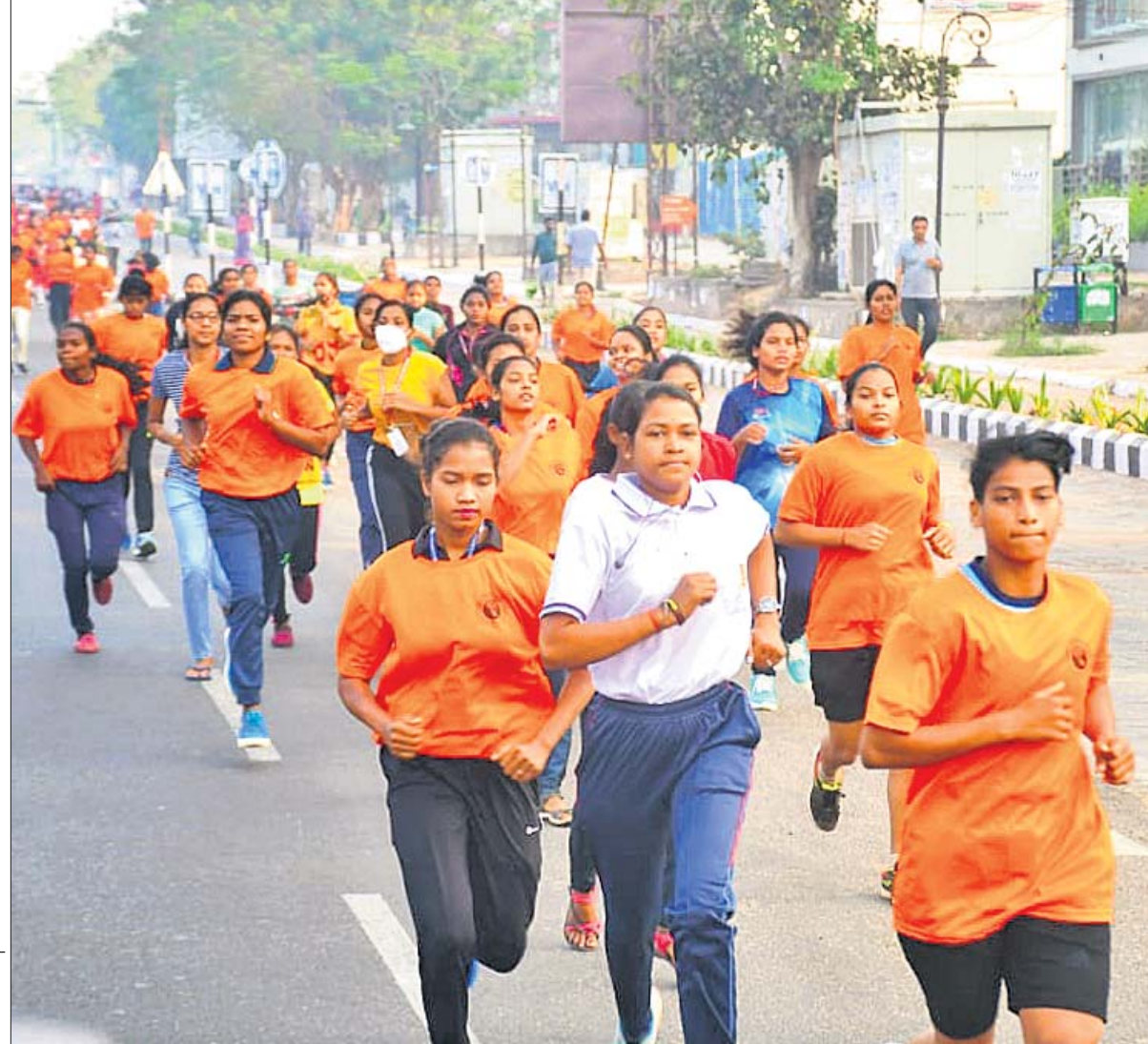
ଅନ୍ତର୍ଜାତୀୟ ମହିଳା ଦିବସ ଅବସରରେ ଭୁବନେଶ୍ୱରସ୍ଥିତ ରମାଦେବୀ ମହିଳା ବିଶ୍ୱବିଦ୍ୟାଳୟ ସମ୍ମୁଖରେ ମଙ୍ଗଳବାର ଏକିକିପି ପକ୍ଷରୁ ନିର୍ଦ୍ଧାରିତ।