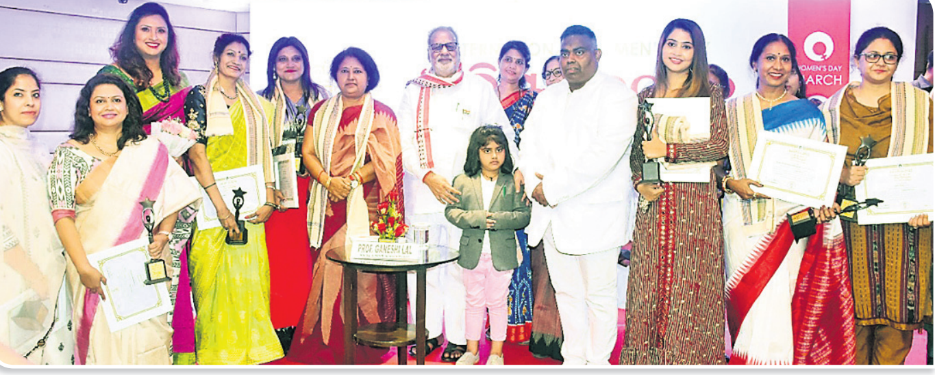
ଭୁବନେଶ୍ୱର ଗୌତମନଗରଠାରେ ଅଭିଭାଷିତ ଅନୁଷ୍ଠାନ ପକ୍ଷରୁ ଆୟୋଜିତ ଅଭିଭାଷିତ ଆଫିର୍ ଉତ୍ସବରେ ରାଜ୍ୟପାଳ ପ୍ରଫେସର ଗଣେଶ ଲାଲ ଏବଂ ଅନ୍ୟମାନେ।