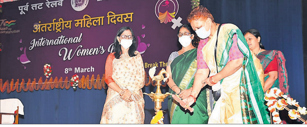
ପୂର୍ବତନ ରେଳପଥର ମହିଳା କଲ୍ୟାଣ ସଂଗଠନ ପକ୍ଷରୁ ଏହାର ସମସ୍ତ ମହିଳା କର୍ମଚାରୀଙ୍କ ଅବଦାନ ଉଦ୍ଦେଶ୍ୟରେ ଅନ୍ତର୍ଜାତୀୟ ମହିଳା ଦିବସ ପାଳିତ।