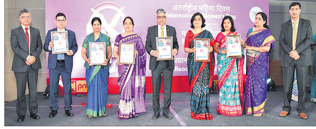
ଅନ୍ତର୍ଜାତୀୟ ମହିଳା ଦିବସ ଅବସରରେ ପଞ୍ଜାବ ନ୍ୟାଶନାଲ୍ ବ୍ୟାଙ୍କ (ପିଏନ୍‌ସି) ର ସମସ୍ତ ବରିଷ୍ଠ ଅଧିକାରୀଙ୍କ ଗହଣରେ ବିଭିନ୍ନ ମହିଳା କ୍ଷେତ୍ରକୁ ଯୋଜନାରେ ଶୁଭାଚରଣ କରାଯାଇଛି।

ହୋଟେଲ ଆସୋସିଏସନ୍ ଅଫ୍ ଇଣ୍ଡିଆର ଏକ୍ସିକ୍ୟୁଟିଭ୍ କମିଟି ସଦସ୍ୟମାନଙ୍କ ମଧ୍ୟରେ ନିକଟରେ ଏକ ଗୁରୁତ୍ୱପୂର୍ଣ୍ଣ ବୈଠକ ଅନୁଷ୍ଠିତ ହୋଇଯାଇଛି। ଉକ୍ତ ବୈଠକରେ କେନ୍ଦ୍ର ପର୍ଯ୍ୟଟନ ମନ୍ତ୍ରୀ ଜି. କିଶନ ରେଡ୍ଡୀ ମୁଖ୍ୟ ଅତିଥି ଭାବେ ଯୋଗ ଦେଇ ଆସୋସିଏସନ୍ର ବିଭିନ୍ନ ଦାବି ସମ୍ପର୍କରେ ଆଲୋଚନା କରିଥିଲେ। ଉକ୍ତ ବୈଠକରେ ହୋଟେଲ ଉଦ୍ୟୋଗକୁ ଇନପ୍ରାଣ୍ଟିଫୁଲ୍ ଷ୍ଟାର୍ଟ୍ସ ଅଫ୍ ଇଣ୍ଡିଆ ପକ୍ଷରୁ ଦାବି କରାଯାଇଛି। ଏଥିସହିତ ପର୍ଯ୍ୟଟନ ମନ୍ତ୍ରଣାଳୟ ଏହି ପ୍ରସଙ୍ଗକୁ ପ୍ରତିରୋଧ ଭାବେ ଗ୍ରହଣ କରିବେ, ଯାହାଦ୍ୱାରା ଏହା ଆଗାମୀ ସଂସଦୀୟ ଅଧିବେଶନରେ ଉପସ୍ଥାପିତ ହୋଇପାରିବ ବୋଲି ସେମାନେ କହିଛନ୍ତି। ପର୍ଯ୍ୟଟନ ଉପରେ କାର୍ଯ୍ୟ କରୁଥିବା ପାର୍ଲିମେଣ୍ଟରୀ ଡ୍ୱାର୍ଡ୍ ଗ୍ରୁପ୍ ପକ୍ଷରୁ ୧୨ତମ ପଞ୍ଚ ବାର୍ଷିକ ଯୋଜନା ପାଇଁ ଦେଇଥିବା ରିପୋର୍ଟରେ ଦେଶରେ ହୋଟେଲ ଉତ୍ପାଦନ ବହୁମାତ୍ରାରେ ଅଭାବ ରହିଥିବା ଉଲ୍ଲେଖ କରାଯାଇଛି। ଏଥିସହିତ ହୋଟେଲ ଉତ୍ପାଦନରେ ଉଲ୍ଲେଖନୀୟ ବୃଦ୍ଧି କରିବା ପାଇଁ ପରିବହନ, ପର୍ଯ୍ୟଟନ ଏବଂ ସଂସ୍କୃତି ପାଇଁ ଥିବା ପାର୍ଲିମେଣ୍ଟରୀ ଷ୍ଟାଣ୍ଡିଂ କମିଟି ପକ୍ଷରୁ ପରାମର୍ଶ ଦିଆଯାଇଛି।