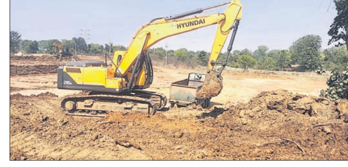
କେସିବି ସାହାଯ୍ୟରେ ବେଆଇନ ମାଟି ଖନନ କରାଯାଉଛି ।

ସମ୍ବଲପୁର ଜିଲ୍ଲା ସୁମୁମୁରା ତହସିଲ ଅଞ୍ଚଳରେ ମାଟି ମାଟିଆମାନେ ସକ୍ରିୟ ହୋଇପଡ଼ିଛନ୍ତି । ସେମାନେ ସରକାରୀ ଜମି, ଗ୍ରାମ୍ୟ ଜଙ୍ଗଲ, ସଂରକ୍ଷିତ ଜଙ୍ଗଲକୁ ମାଟି ଉଠାଇଚାଲିଛନ୍ତି । ଫଳରେ ବନୀକରଣ ଓ ପୁରୁଣା ଗଛ ନଷ୍ଟ ହେବାରେ ଲାଗିଛି । ଗ୍ଳାନାୟ ଲୋକେ ଅଭିଯୋଗ କଲେ କାର୍ଯ୍ୟାନୁଷ୍ଠାନ ବଦଳରେ କିଛିଦିନ କାମ ବନ୍ଦ କରିଦିଆଯାଇଛି । ଧରାପଡ଼ିଲେ କିଛି ଟଙ୍କା ଟିକସ ଓ ଜରିାମାନା ଆଦାୟ କରାଯାଇଛି । ଫଳରେ ଜରିାମାନା ନାମରେ ମାଟିଆମାନଙ୍କୁ ପ୍ରୋତ୍ସାହନ ଦିଆଯାଉଥିବା ଅଭିଯୋଗ ହେଉଛି । କୌଣସି କାର୍ଯ୍ୟାନୁଷ୍ଠାନ ଗ୍ରହଣ କରାଯାଇ ନ ଥିବାରୁ