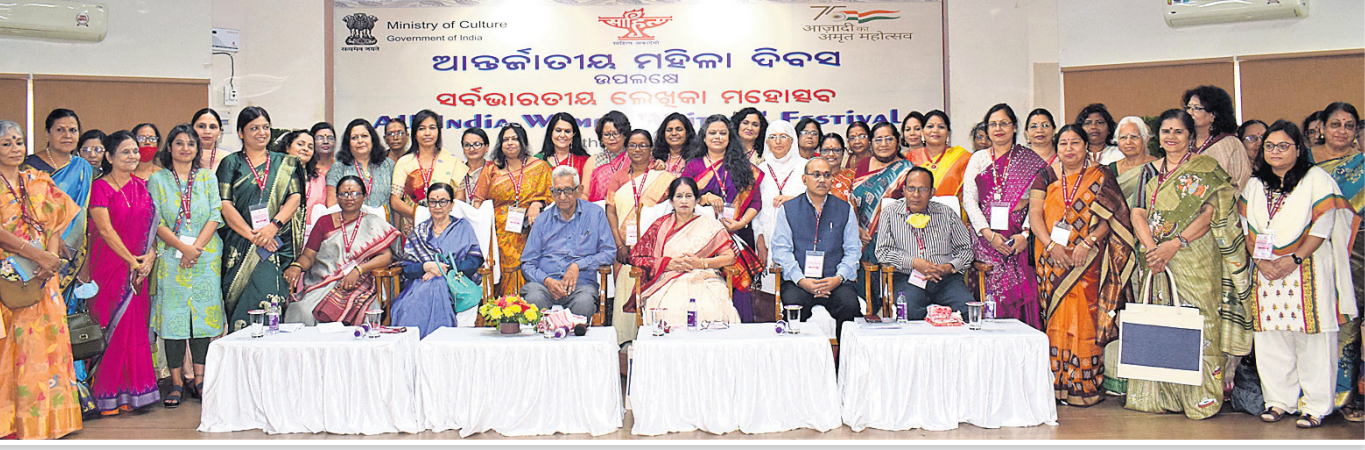
ଭୁବନେଶ୍ୱର ଗୀତଗୋବିନ୍ଦ ସଦନରେ ମଙ୍ଗଳବାର କେନ୍ଦ୍ର ସାହିତ୍ୟ ଏକାଡେମୀ ପକ୍ଷରୁ ଆୟୋଜିତ ସର୍ବଭାରତୀୟ ଲେଖକା ମହୋତ୍ସବରେ ଉପସ୍ଥିତ ଅତିଥି ଓ ଲେଖକମାନେ।