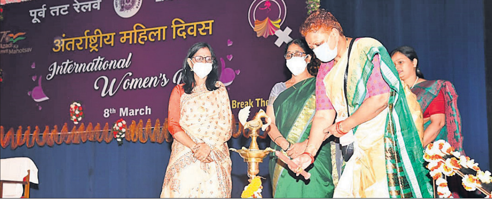
ପୂର୍ବତନ ରେଳପଥର ମହିଳା କଲ୍ୟାଣ ସଂଗଠନ ପକ୍ଷରୁ ଏହାର ସମସ୍ତ ମହିଳା କର୍ମଚାରୀଙ୍କ ଅବଦାନ ଉଦ୍ଦେଶ୍ୟରେ ଅନ୍ତର୍ଜାତୀୟ ମହିଳା ଦିବସ ପାଳିତ।