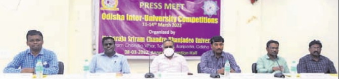
ପ୍ରତିଯୋଗିତା ଲାଗି ଆୟୋଜିତ ବୈଠକରେ ଉପସ୍ଥିତ ଅଧିକାରୀ।