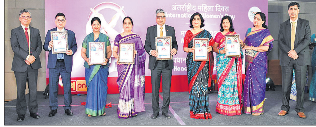
ଅନ୍ତର୍ଜାତୀୟ ମହିଳା ଦିବସ ଅବସରରେ ପଞ୍ଜାବ ନ୍ୟାଶନାଲ୍ ବ୍ୟାଙ୍କ (ପିଏନ୍‌ସି) ର ସମସ୍ତ ବରିଷ୍ଠ ଅଧିକାରୀଙ୍କ ଗହଣରେ ବିଭିନ୍ନ ମହିଳା କ୍ଷେତ୍ରରେ ଯୋଗଦାନ ଶୁଭାଚରଣ କରାଯାଇଛି।