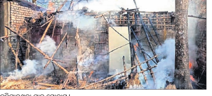
କୁଳିଆଶାରେ ମାଛ ଗୋଦାମ।

ମାଛ ବିକ୍ରି କରି ସାରି ଅବଶିଷ୍ଟ ମାଛକୁ ଗୋଦାମ ଘରେ ରଖି ଘରକୁ ଯାଇଥିଲେ। ଅପରାହ୍ଣରେ ତାଙ୍କ ଗୋଦାମ ଘରେ କୌଣସି କାରଣରୁ ନିଆଁ ଲାଗିଯାଇଥିଲା। ଚାଳ ଛପର ଘର ହେବୁ ଖୁବଶୀଘ୍ର ନିଆଁ ସମଗ୍ର ଘରକୁ ଗ୍ରାସ କରିଥିଲା। ଉପସ୍ଥିତ ମଲିକ ବଜାରରେ ଏକ ମାଛ ଗୋଦାମ ମିଳିକ ବଜାରରେ ଏକ ମାଛ ଗୋଦାମ କରି ବ୍ୟବସାୟ କରୁଥିଲେ। ପୂର୍ବାହ୍ଣରେ