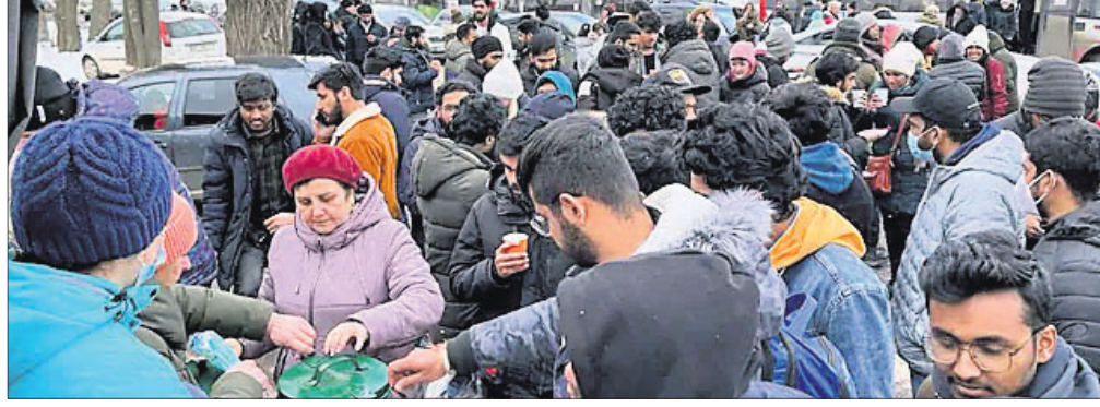
ସୁମିରେ ଫସିଥିବା ଭାରତୀୟ ପୋଲଣ୍ଡା ଅଭିମୁଖେ ଯାଉଛନ୍ତି ।

ଭାରତୀୟଙ୍କ ଉଦ୍ଧାର ପାଇଁ କେନ୍ଦ୍ର ସରକାରଙ୍କ ପକ୍ଷରୁ ଅପରେଶନ ଗଢ଼ା ଆରମ୍ଭ କରାଯାଇଥିଲା । ଯୁଦ୍ଧ ସମୟରେ ପାଖାପାଖି ୨୦ ହଜାର ଭାରତୀୟ ସେଠାରେ ଫସି ରହିଥିବାବେଳେ ଏହି ମିଶନ ଜରିଆରେ ୧୬ ହଜାରରୁ ଊର୍ଦ୍ଧ୍ଵ ଭାରତ ଫେରିଛନ୍ତି ।