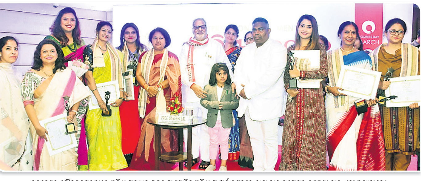
ଭୁବନେଶ୍ୱର ଗୌତମନଗରଠାରେ ଅଭିଭାଷିତ ଅନୁଷ୍ଠାନ ପକ୍ଷରୁ ଆୟୋଜିତ ଅଭିଭାଷିତ ଆଫିର୍ଟ ଉତ୍ସବରେ ରାଜ୍ୟପାଳ ପ୍ରଫେସର ଗଣେଶୀ ଲାଲ ଏବଂ ଅନ୍ୟମାନେ।