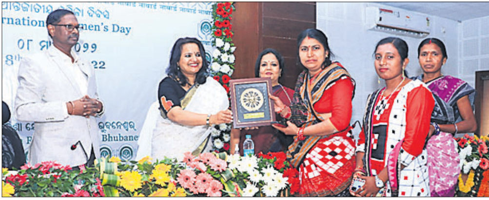
ଓଡ଼ିଶାର ଉନ୍ନତ ଉପାଦାନୀ ଓ କର୍ମଚାରୀ ମହିଳାଙ୍କ ସମ୍ମାନ ଉଦ୍ଦେଶ୍ୟରେ ନାବାର୍ତ୍ତ ପକ୍ଷରୁ ମଙ୍ଗଳବାର ଅନ୍ତର୍ଜାତୀୟ ମହିଳା ଦିବସ ଅବସରରେ ବିଭିନ୍ନ କ୍ଷେତ୍ରରେ ପରିବର୍ତ୍ତନକାରୀ ଭୂମିକା ନିର୍ବାହ କରିଥିବା ମହିଳାମାନଙ୍କୁ ସମ୍ମାନିତ କରାଯାଇଛି।