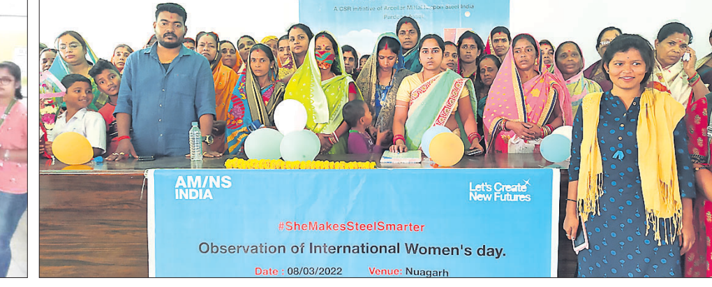
ଏଏମ୍‌ଏସ୍‌ଏସ୍ ଇଣ୍ଡିଆର ମହିଳା କର୍ମଚାରୀଙ୍କୁ ଉତ୍ସାହିତ ଓ ସମ୍ମାନ ଜଣାଇ ଅନ୍ତର୍ଜାତୀୟ ମହିଳା ଦିବସ ପାଳିତ ହୋଇଯାଇଛି।