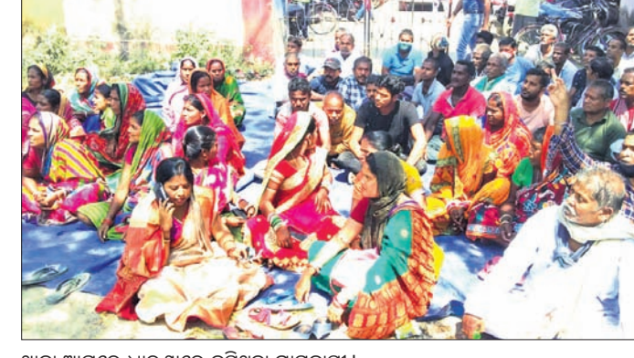
ଥାନା ଆଗରେ ଧାରଣାରେ ବସିଥିବା ଗ୍ରାମବାସୀ।