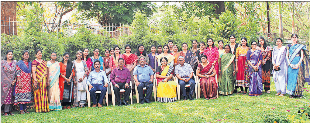
ଆମନ୍ତ୍ରିତ ଅତିଥିଙ୍କ ଗହଣରେ ଓଏସ୍‌ସିଭିର ମହିଳା ପଦାଧିକାରୀ ଓ କର୍ମଚାରୀମାନେ ଅନ୍ତର୍ଜାତୀୟ ମହିଳା ଦିବସ ପାଳନ କରୁଛନ୍ତି।