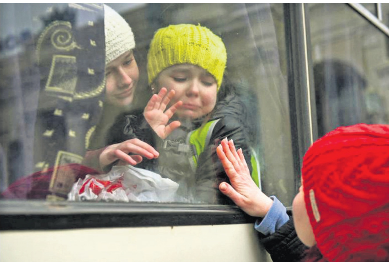
ଯୁକ୍ତ ପ୍ରଭାବିତ ଯୁକ୍ତେନ୍ଦ୍ର ଓ ତେସାୟା ବସରେ ପଳାୟନ କରୁଥିବା ନିଜ ଝିଅକୁ ବିଦାୟ ଜଣାଉଛନ୍ତି ଜଣେ ମହିଳା ।

କୋଭିଡ଼ ମହାମାରୀ ଯୋଗୁ ବାଧାପ୍ରାପ୍ତ ହୋଇଥିବା ଅନ୍ତରାଷ୍ଟ୍ରୀୟ ବିମାନ ସେବା ୨ବର୍ଷ ପରେ ସ୍ୱାଭାବିକ ହେବାକୁ ଯାଉଛି । ଆସନ୍ତା ୨୭ରୁ ଅନ୍ତରାଷ୍ଟ୍ରୀୟ ଉଡ଼ାଣ ହେବ ବୋଲି ମଙ୍ଗଳବାର ବେସାମରିକ ବିମାନ ଚଳାଚଳ ମନ୍ତ୍ରଣାଳୟ ପକ୍ଷରୁ ସ୍ୱାଧୀନ କରାଯାଇଛି । କରୋନା ଯୋଗୁ ୨୦୨୦ ମାର୍ଚ୍ଚ ୨୩ରୁ ଅନ୍ତରାଷ୍ଟ୍ରୀୟ ଉଡ଼ାଣ ଉପରେ କଟକଣା କାରି ହୋଇଥିଲା । ତେବେ କରୁଣା ସେବା ପାଇଁ ଭାରତରୁ ୨୭ଟି ଦେଶକୁ ସ୍ୱତନ୍ତ୍ର ବିମାନ ଚଳାଚଳ କରୁଛି । କୋଭିଡ଼ ସଂକ୍ରମଣରେ ୧୬ ପୃଷ୍ଠା-୫