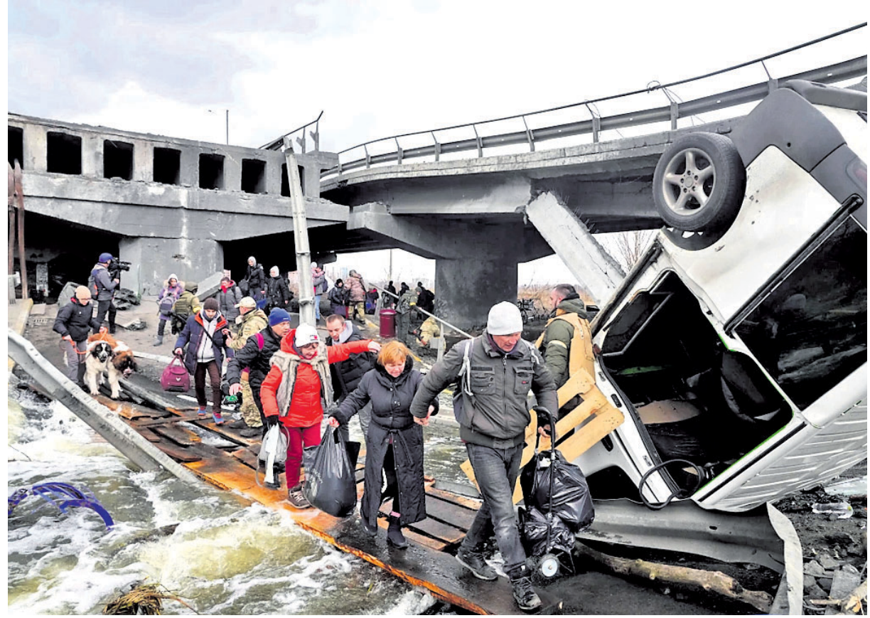
ବିଧୂସ୍ତ ବ୍ରିକ୍ ଦେଇ ଇଉପିନ୍ ଅଭିମୁଖେ ଯାଉଛନ୍ତି ଯୁକ୍ତେନ୍ଦ୍ରବାସୀ ।