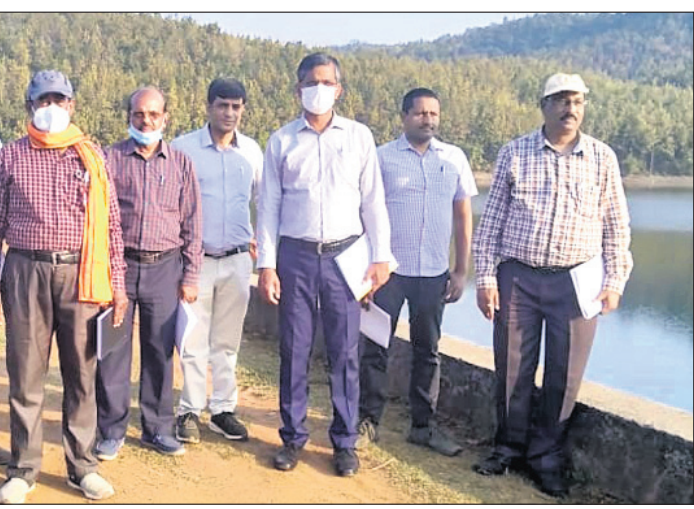
ପରିବର୍ତ୍ତନରେ ଆସିଥିବା ଅଧିକାରୀ।