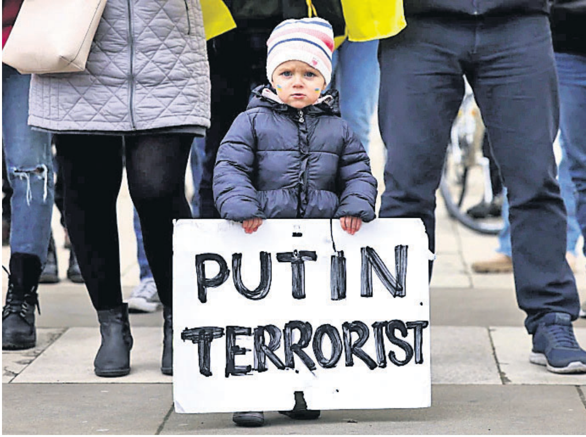
ରୁଷିଆ ଆକ୍ରମଣକୁ ବିରୋଧ କରି ପ୍ରଦର୍ଶନବେଳେ ଏକ ଶିଶୁ ପ୍ଲାକାର୍ଡ ଧରି ଛିଡା ହୋଇଛନ୍ତି ।