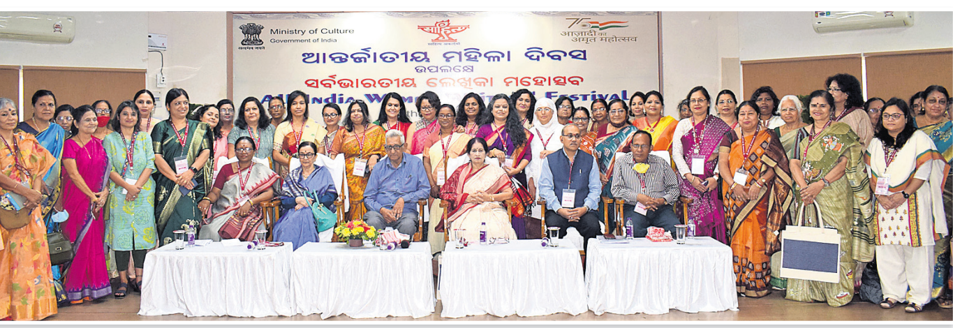
ଭୁବନେଶ୍ୱର ଗୀତଗୋବିନ୍ଦ ସଦନରେ ମଙ୍ଗଳବାର କେନ୍ଦ୍ର ସାହିତ୍ୟ ଏକାଡେମୀ ପକ୍ଷରୁ ଆୟୋଜିତ ସର୍ବଭାରତୀୟ ଲେଖକା ମହୋତ୍ସବରେ ଉପସ୍ଥିତ ଅତିଥି ଓ ଲେଖକାମାନେ।