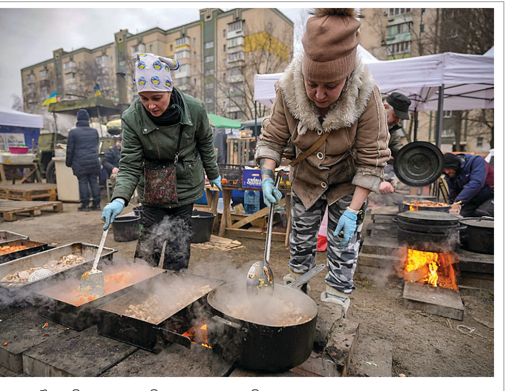
ୟୁକ୍ରେନ୍ ସୈନ୍ୟକ ନିମନ୍ତେ ରାଜଧାନୀ କିଭୁରେ ରୋଷେଇ କରୁଛନ୍ତି ସାଧାରଣ ଲୋକେ ।

ଜଣକ ବ୍ୟାଗ୍ରିକୁ ଘୋଷାଡ଼ି ଘୋଷାଡ଼ି ନେଉଛନ୍ତି । ଯେଉଁ ପିଲାଙ୍କ ସହ ସେମାନଙ୍କ ପରିବାର କିମ୍ବା ବାପା ଯାଉଥିବା ଭିଡିଓରେ ଦେଖିବାକୁ ମିଳିଛି । ସେ ଦେଖୁଥିବା ଭିଡିଓରେ ରହିଛି । ପିଲାଟିକୁ ଦେଖି ଆଖପାଖରେ ଥିବା ଲୋକ ମଧ୍ୟ ଭାବବିହ୍ୱଳ ହୋଇପଡ଼ିଛନ୍ତି ।