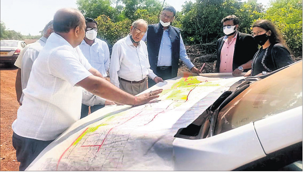
ପୁରୀରେ ଅନ୍ତର୍ଜାତିକ ବିମାନବନ୍ଦର ନିର୍ମାଣ ନେଇ ମଙ୍ଗଳବାର ଉଜ୍ଜଣିଆ ଦୈନିକ ଚିନ୍ତା ସିପସରୁବାଲିରେ ସ୍ଥିତି ପରଖିବା ସହ ନବୀ ଦେଖୁଛନ୍ତି।

ପହାମାରିଆ ପ୍ରଥମ ଲହରୀ ଲୁଚାଇ ବ୍ୟବସାୟ ଉପରେ ବିଶେଷ ପ୍ରଭାବ ପକାଇଥିଲା। ୪-୫ ମାସ ପର୍ଯ୍ୟନ୍ତ ବ୍ୟବସାୟ ସମ୍ପୂର୍ଣ୍ଣ ଠିକ୍ ହୋଇଯାଇଥିଲା।