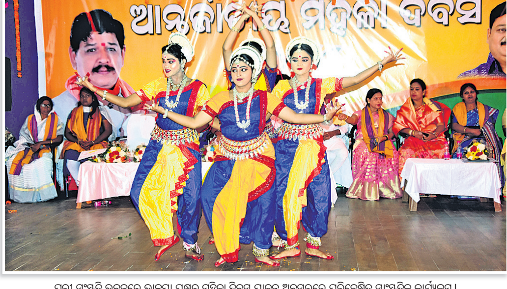
ପୁରୀ ସଂସ୍କୃତି ଭବନରେ ଭାବପା ପକ୍ଷରୁ ମହିଳା ଦିବସ ପାଳନ ଅବସରରେ ପରିବେଷିତ ସାଂସ୍କୃତିକ କାର୍ଯ୍ୟକ୍ରମ।