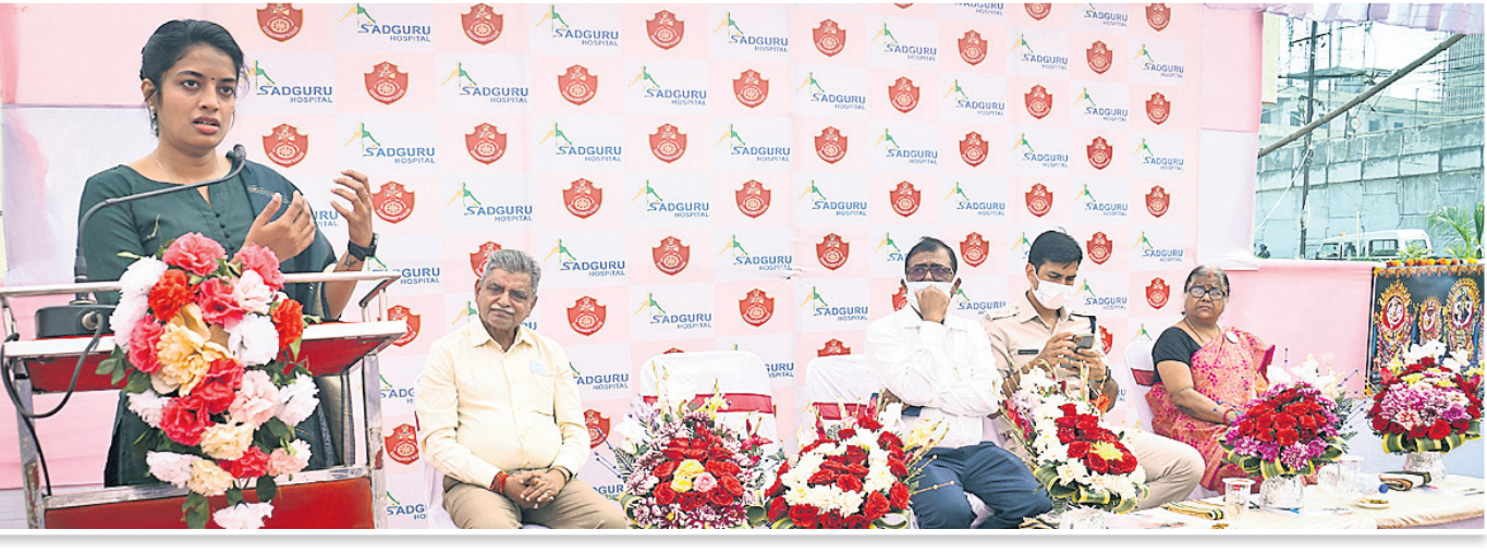
କଟକସ୍ଥିତ ସର୍ବଭାରତୀୟ ହସ୍ତିନାଳ ପକ୍ଷରୁ ମଙ୍ଗଳବାର ଲିଙ୍କରୋଡ଼ ଗ୍ରାମିକ ଡାକ୍ତରୀଠାରେ ଗ୍ରାମିକ ମହିଳା ପୋଲିସ୍‌ସ୍‌କ ସାମ୍ମୁଖ୍ୟ ପରାମ୍ପା ଶିବିର ଅବସରରେ ଆୟୋଜିତ ସଭାରେ ମହାସାଧନ ଅତିଥିବୁଦ୍ଧ।