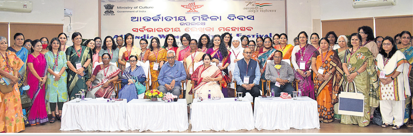
ଭୁବନେଶ୍ୱର ଗୀତଗୋବିନ୍ଦ ସଦନରେ ମଙ୍ଗଳବାର କେନ୍ଦ୍ର ସାହିତ୍ୟ ଏକାଡେମୀ ପକ୍ଷରୁ ଆୟୋଜିତ ସର୍ବଭାରତୀୟ ଲେଖକା ମହୋତ୍ସବରେ ଉପସ୍ଥିତ ଅତିଥି ଓ ଲେଖକାମାନେ।