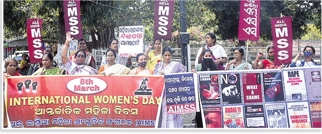
ଭୁବନେଶ୍ୱରଠାରେ ସର୍ବଭାରତୀୟ ମହିଳା ସାଂସ୍କୃତିକ ସଂଗଠନ ପକ୍ଷରୁ ନାରୀ ବିରୋଧୀ ଆଭିଯୁକ୍ତ ବିରୋଧରେ ପ୍ରତିବାଦ କରାଯାଇଛି।