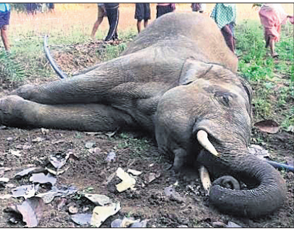
ଘଟଣାସ୍ଥଳରେ ମରିପଡ଼ିଥିବା ଦନ୍ତା ।