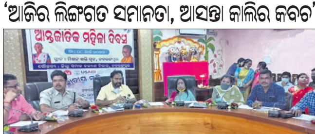
ବୈଠକରେ ଜିଲ୍ଲାପାଳ ଓ ଅନ୍ୟ ଅଧିକାରୀମାନେ ।

ରାୟଗଡ଼ା ଜିଲ୍ଲା ଆଇନ ସେବା ପ୍ରାଧିକାରଣ(ଡିଏଲ୍‌ଏସ୍‌ଏ) ପକ୍ଷରୁ ମଙ୍ଗଳବାର ଗ୍ରାମୀଣ ସହୋଦୟ ଇନିସିଆଟିଭ୍ ଅଫ୍ ଡିଏନ୍‌ଏଫ୍ ଟ୍ରେନିଂ କଲେଜରେ ଅନ୍ତର୍ଜାତୀୟ ମହିଳା ଦିବସ ପାଳିତ ହୋଇଯାଇଛି ।