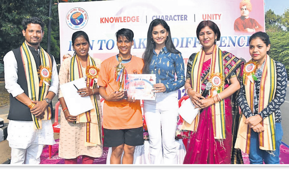
ଅଧିକ ଭାରତୀୟ ବିଦ୍ୟାର୍ଥୀ ପରିଷଦ ପକ୍ଷରୁ ଭୁବନେଶ୍ୱରସ୍ଥିତ ରମାଦେବୀ ମହିଳା ବିଶ୍ୱବିଦ୍ୟାଳୟ ନିକଟରେ ଆୟୋଜିତ ମହିଳା ଦିବସ କାର୍ଯ୍ୟକ୍ରମରେ ଜଣେ ପ୍ରତିଯୋଗୀଙ୍କୁ ପୁରସ୍କୃତ କରାଯାଇଛି।