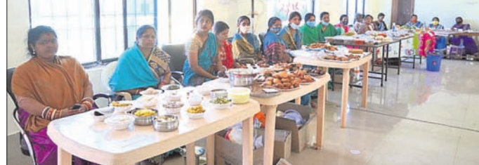
ମହିଳା ଦିବସ ଅବସରରେ ଆୟୋଜିତ ପୁଷ୍ପସାଧନ ଖାଦ୍ୟ ପ୍ରଦର୍ଶନ ।

କୋରାପୁଟର ସଦ୍‌ଭାବନା ସଭାଗୃହ ପରିସରରେ ମଙ୍ଗଳବାର ଅନ୍ତର୍ଜାତୀୟ ମହିଳା ଦିବସ ପାଳିତ ହୋଇଯାଇଛି ।