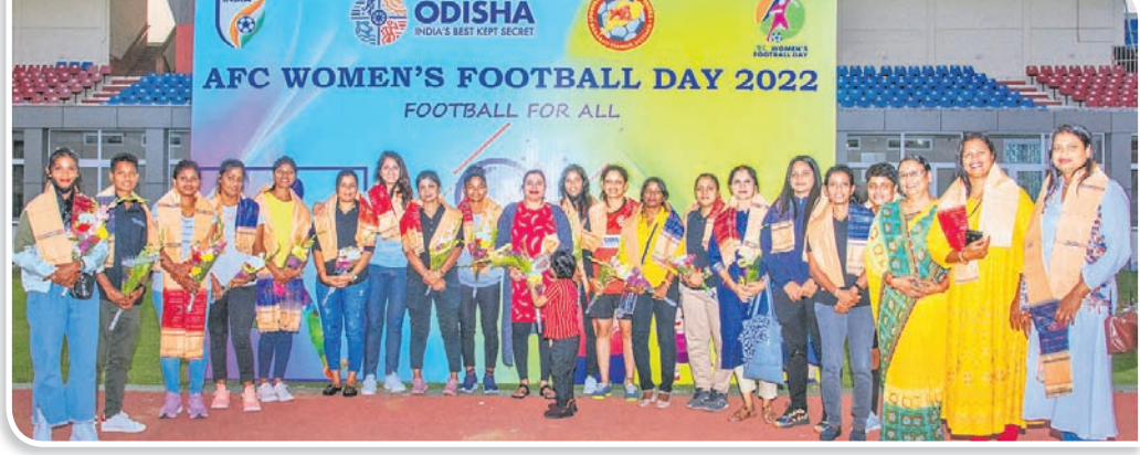
କଳିଙ୍ଗ କ୍ଷୁଦ୍ରତମରେ ଏଏସ୍‌ସି ମହିଳା ଦିବସ ପାଳନ ଅବସରରେ ସମ୍ବର୍ଦ୍ଧିତ ପୁରସ୍କାର ଖେଳାଳି।