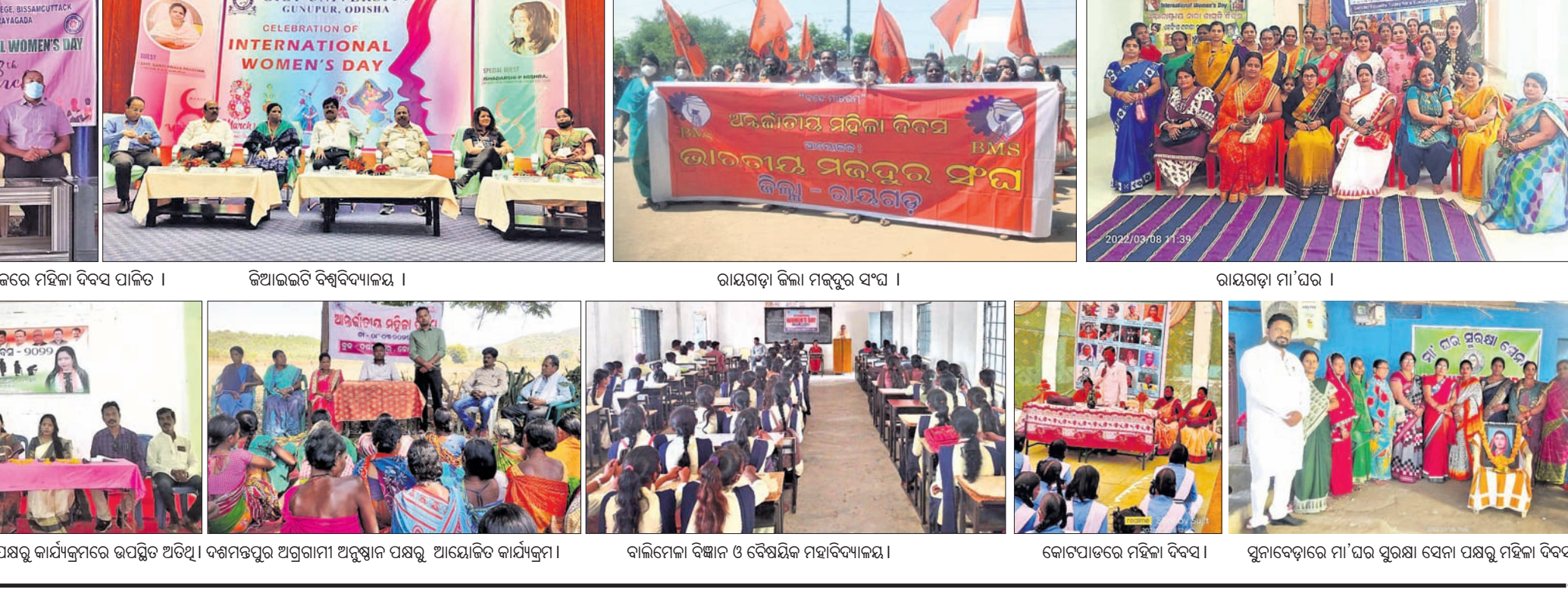
ରାୟଗଡ଼ାଜିଲ୍ଲା ବିସମ୍ପର୍କକର୍ମ ମାଁ ମାର୍ଚ୍ଚା କଲେଜରେ ମହିଳା ଦିବସ ପାଳିତ ।