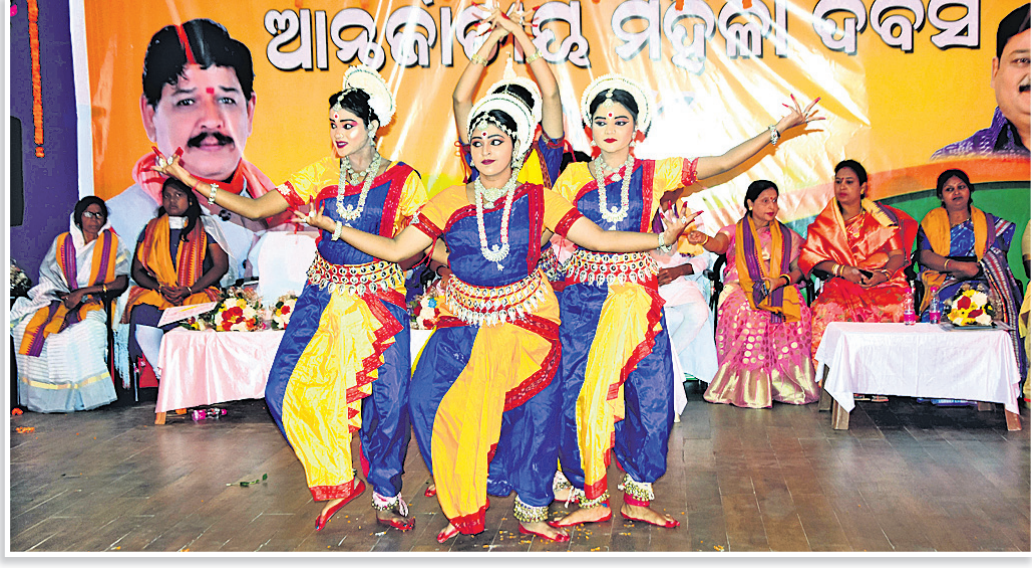
ପୁରୀ ସଂସ୍କୃତି ଭବନରେ ଭାବପା ପକ୍ଷରୁ ମହିଳା ଦିବସ ପାଳନ ଅବସରରେ ପରିବେଷିତ ସାଂସ୍କୃତିକ କାର୍ଯ୍ୟକ୍ରମ।