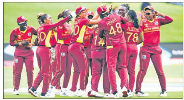
ଫ୍ରେସ୍‌କଣ୍ଠିକ ମହିଳା କ୍ରିକେଟ ଦଳର ଖେଳାଳିମାନେ ଖୁସି ମୁହଁରେ।