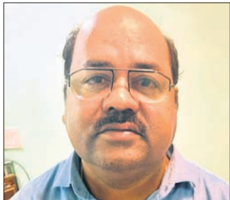
ନିର୍ବାହୀ ଯନ୍ତ୍ରୀ ଜଗନ୍ନାଥ ସେଠୀ