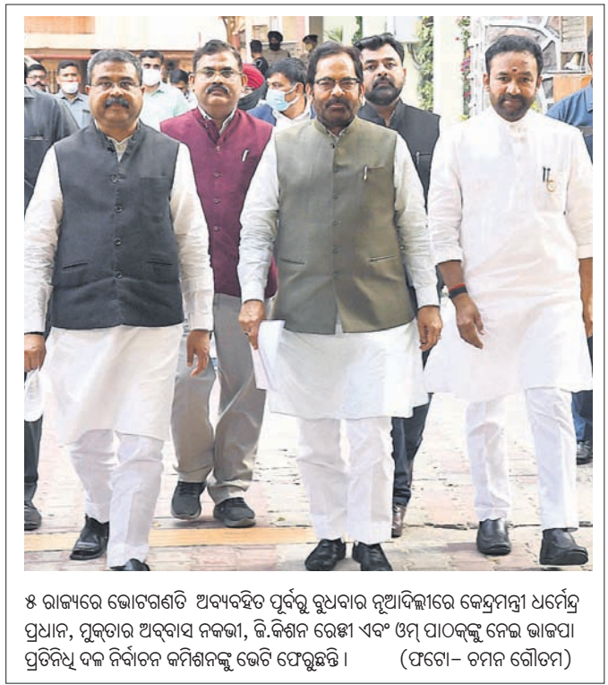
୫ ରାଜ୍ୟରେ ଭୋଟଗଣତି ଅବସରରେ ପୂର୍ବରୁ ରୁଧିରୀର ରୂପାଦିକାରେ କେନ୍ଦ୍ରମନ୍ତ୍ରୀ ଧର୍ମେନ୍ଦ୍ର ପ୍ରଧାନ, ମୁକ୍ତାର ଅବସର ନକରା, ଡି.କିଶନ ରେଡ୍ଡି ଏବଂ ଓମ୍ ପାଠକଙ୍କୁ ନେଇ ଭାଜପା ପ୍ରତିନିଧି ଦଳ ନିର୍ବାଚନ କମିଶନଙ୍କୁ ଭେଟି ଫେରୁଛନ୍ତି।