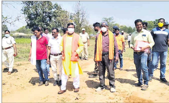
କେନ୍ଦ୍ରମନ୍ତ୍ରୀ ଇ. ବିଶେଷ୍ୱର ରୁଦ୍ର କାନ୍ଥୁ ଉଦ୍ୟାନ ପରିଦର୍ଶନ କରୁଛନ୍ତି।

ମୟୂରଭଞ୍ଜ ଜିଲ୍ଲା କୁଳିଆଣା ବ୍ଲକ ଅଧୀନ ଚାନ୍ଥୁଆ ପଂଚାୟତରେ ଥିବା କାନ୍ଥୁ ଜଙ୍ଗଲକୁ କେନ୍ଦ୍ର ଜଳଶକ୍ତି ଓ ଆଦିବାସୀ ବ୍ୟାପାର ମନ୍ତ୍ରୀ ଇ. ବିଶେଷ୍ୱର ରୁଦ୍ର ମଙ୍ଗଳଦାର ପରିଦର୍ଶନ କରିଛନ୍ତି।