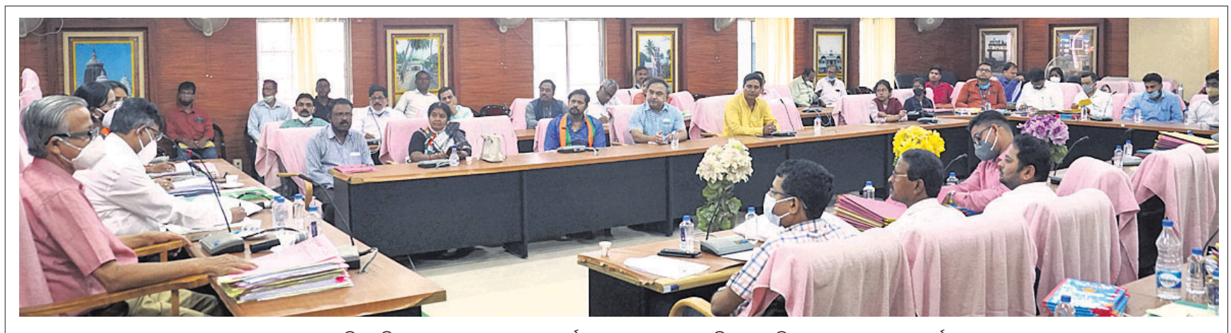
କଟକ ମହାନଗର ନିଗମ ବିଜୁ ଭବନରେ ରୁଧିରୀର ବୃତ୍ତାନ୍ତ ପ୍ରାର୍ଥୀଙ୍କୁ ସମାବେଶରେ ଉପସ୍ଥିତ ପ୍ରଶାସନିକ ଅଧିକାରୀ ଓ ମେୟର ପ୍ରାର୍ଥୀମାନେ।