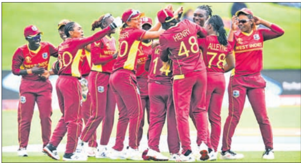
ଫ୍ରେସ୍କଇଣ୍ଡିଜ ମହିଳା କ୍ରିକେଟ ଦଳର ଖେଳାଳିମାନେ ଖୁସି ମୁହଁରେ।

ଭୁବନେଶ୍ୱର, ୯ମ ଚଳିତ ଆଇସିସି ମହିଳା କ୍ରିକେଟ ବିଶ୍ୱକପର ରୂପବାର ଅନୁଷ୍ଠିତ ଏକ ସଂଘର୍ଷପୂର୍ଣ୍ଣ ଲିଗ୍ ମ୍ୟାଚରେ ଫ୍ରେସ୍କଇଣ୍ଡିଜ ଗତପରତ ଚାମ୍ପିୟନ ଇଂଲଣ୍ଡକୁ ୬ ରନରେ ହରାଇ ଦେଇଛି। ଫ୍ରେସ୍କଇଣ୍ଡିଜ ପକ୍ଷରୁ ଧୀର୍ଯ୍ୟ ୨୨.୬ ରନ ବିଜୟ ଲକ୍ଷ୍ୟର ପିଛା କରି ଇଂଲଣ୍ଡ ୪୭.୪ ଓଭରରେ ୨୧୮ ରନକରି ଅଲ୍‌ଆଉଟ ହୋଇ ଯାଇଥିଲା। ବିଶ୍ୱକପରେ ଇଂଲଣ୍ଡ ବିପକ୍ଷରେ ଫ୍ରେସ୍କଇଣ୍ଡିଜର ଏହାଥିଲା