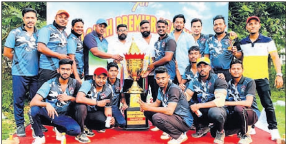
ଚାମ୍ପିୟନ ମା’ ଦୁର୍ଗା ଏକାଦଶ ଦଳର ଖେଳାଳିମାନେ ଟ୍ରଫି ଓ ଅତିଥିଙ୍କ ସହ ।

ରଘୁଲଗଡ଼ ଯୁଧ୍ କ୍ଲବ ଆରୁକ୍ଲ୍ୟରେ ଜିଜିପି ହାଇସ୍କୁଲ ପଡ଼ିଆରେ ୭ମ ରଘୁଲଗଡ଼ ପ୍ରିମିୟର ଲିଗ୍ କ୍ରିକେଟ ଟୁର୍ନାମେଣ୍ଟ ଅନୁଷ୍ଠିତ ହୋଇ ଯାଇଛି। ଏହାର ଫାଇନାଲରେ ଗୋପୀନାଥ ଦେବ ଏକାଦଶକୁ ୧୬ ରନରେ ହରାଇ ମା’ ଦୁର୍ଗା ଏକାଦଶ ଚାମ୍ପିୟନ ହୋଇଛି। ପ୍ରଥମେ ବ୍ୟାଟିଂ କରିଥିବା ମା’ ଦୁର୍ଗା ଦଳ ୧୨ ଓଭରରେ ୬ ଉଇକେଟ ହରାଇ ୧୨.୫ ରନ କରିଥିଲା। ଉମାକାନ୍ତ ଜଗଦେବ ସର୍ବାଧିକ ୪୮ ରନ କରିଥିଲେ। ବିପକ୍ଷ ଦଳର ନାକେଶ ବଳିୟାରସିଂ ୩ଟି ଉଇକେଟ ନେଇଥିଲେ। ୧୨୬ ରନ ବିଜୟ ଲକ୍ଷ୍ୟରେ ଗୋପୀନାଥ ଏକାଦଶ ୧୨ ଓଭରରେ ୬ ଉଇକେଟ