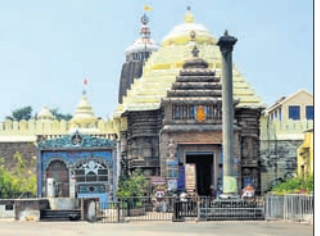
ପୁରୀ ଓ ବସିବା ସ୍ଥାନ ଇତ୍ୟାଦି ନିର୍ମାଣ ଲାଗି ଜାତୀୟ ସ୍ତରରୁ ସ୍ୱାଗତ୍ୟ ପ୍ରାଧିକରଣ (ଏନ୍‌ଏମ୍‌ଏ)ର ଅନୁମୋଦନ ରହିଛି ।

ଶ୍ରୀମନ୍ଦିର ପରିକ୍ରମା ପ୍ରକଳ୍ପ ବିବାଦ ଜଟିଳ ହେବାରେ ଲାଗିଛି । ପ୍ରକଳ୍ପ କାର୍ଯ୍ୟ ପାଇଁ ଜାତୀୟ ସ୍ତରରୁ ସ୍ୱାଗତ୍ୟ ପ୍ରାଧିକରଣ (ଏନ୍‌ଏମ୍‌ଏ)ର ଅନୁମୋଦନ ରହିଛି ବୋଲି ପୁରୀ ଜିଲ୍ଲାପାଳ ସମର୍ଥନ ଦେଇଥିବାବେଳେ ଏନେଇ ଭାରତୀୟ ପ୍ରକଳ୍ପ ସର୍ବେକ୍ଷଣ ସମ୍ମିତୀ (ଏଏସ୍‌ଆଇ) ଆପଣ ଉଠାଇଛି ।