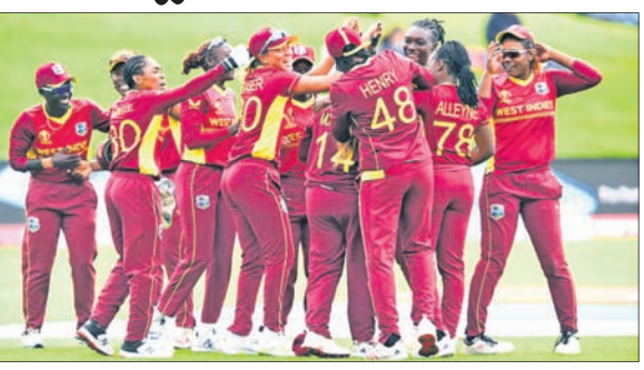
ଫ୍ରେସ୍‌କଣ୍ଡିଜ ମହିଳା କ୍ରିକେଟ ଦଳର ଖେଳାଳିମାନେ ଖୁସି ପୁହୁଛନ୍ତି।

ଭୁବନେଶ୍ୱର, ୯ମ କ୍ୟାମ୍ପବେଲ (୨୬) ଓ ଚେତେନ ଚଳିତ ଆଇସିସି ମହିଳା କ୍ରିକେଟ ବିଶ୍ୱକପର ରୁପବାର ଅନୁଷ୍ଠିତ ଏକ ସଂଘର୍ଷପୂର୍ଣ୍ଣ ଲିଗ୍ ମ୍ୟାଚରେ ଫ୍ରେସ୍‌କଣ୍ଡିଜ ଗତପରର ଚାମ୍ପିୟନ ଇଂଲଣ୍ଡକୁ ୬ ରନରେ ହରାଇ ଦେଇଛି। ଫ୍ରେସ୍‌କଣ୍ଡିଜ ପକ୍ଷରୁ ଧୀର୍ଘ ୨୨୬ ରନ ବିଜୟ ଲକ୍ଷ୍ୟର ପିଛା କରି ଇଂଲଣ୍ଡ ୪୭.୪ ଓଭରରେ ୨୧୮ ରନକରି ଅଲଆଉଟ ହୋଇ ଯାଇଥିଲା। ବିଶ୍ୱକପରେ ଇଂଲଣ୍ଡ ବିପକ୍ଷରେ ଫ୍ରେସ୍‌କଣ୍ଡିଜର ଏହାଥିଲା