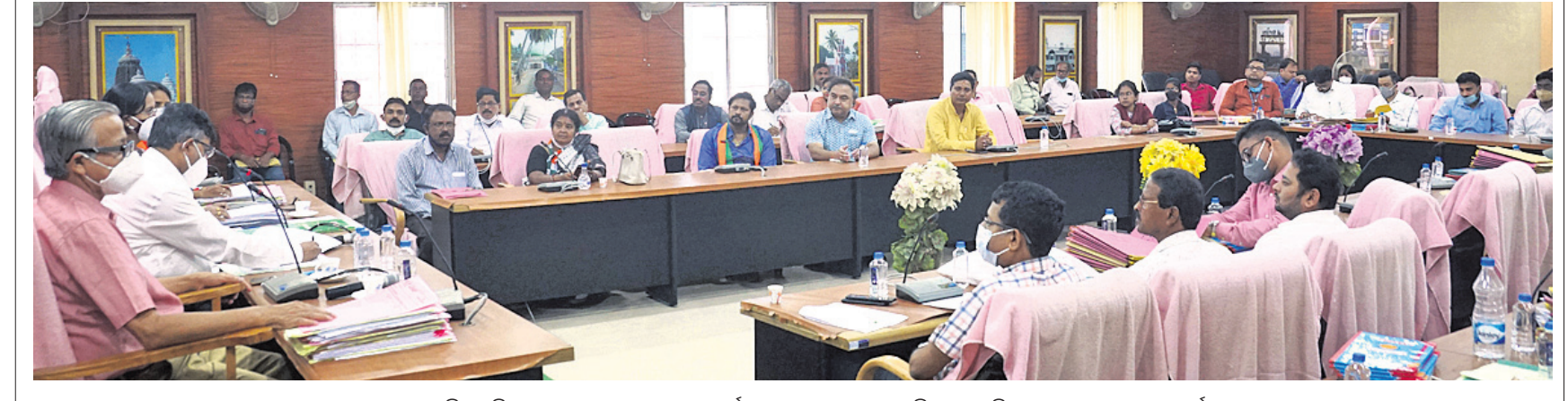
କଟକ ମହାନଗର ନିଗମ ବିଜୁ ଭବନରେ ରୁଧିରୀ ଶେଷ ପ୍ରାର୍ଥୀପତ୍ର ଯାଞ୍ଚ ସମୟରେ ଉପସ୍ଥିତ ପ୍ରଶାସନିକ ଅଧିକାରୀ ଓ ମେୟର ପ୍ରାର୍ଥୀମାନେ।