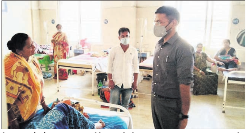
ଜିଲ୍ଲାପାଳ ସମର୍ଥ ବର୍ମା ଚୁରୁବାର ପୂରୀ ମୁଖ୍ୟ ବିକାୟକ, ପରିବର୍ତ୍ତନ ଅବସରରେ ରୋଗୀଙ୍କ ସହ ଆଲୋଚନା କରୁଛନ୍ତି।

ପୂରୀ ଅଫିସ୍, ୧୦୩: ପୂରୀ ସହରର ରାମଚଣ୍ଡୀ ବାଲିକୁଦା ବସ୍ତି ଉଦ୍ଧେଦ ପାଇଁ ପ୍ରାରମ୍ଭିକ ପ୍ରକ୍ରିୟା ଆରମ୍ଭ ହୋଇଛି।