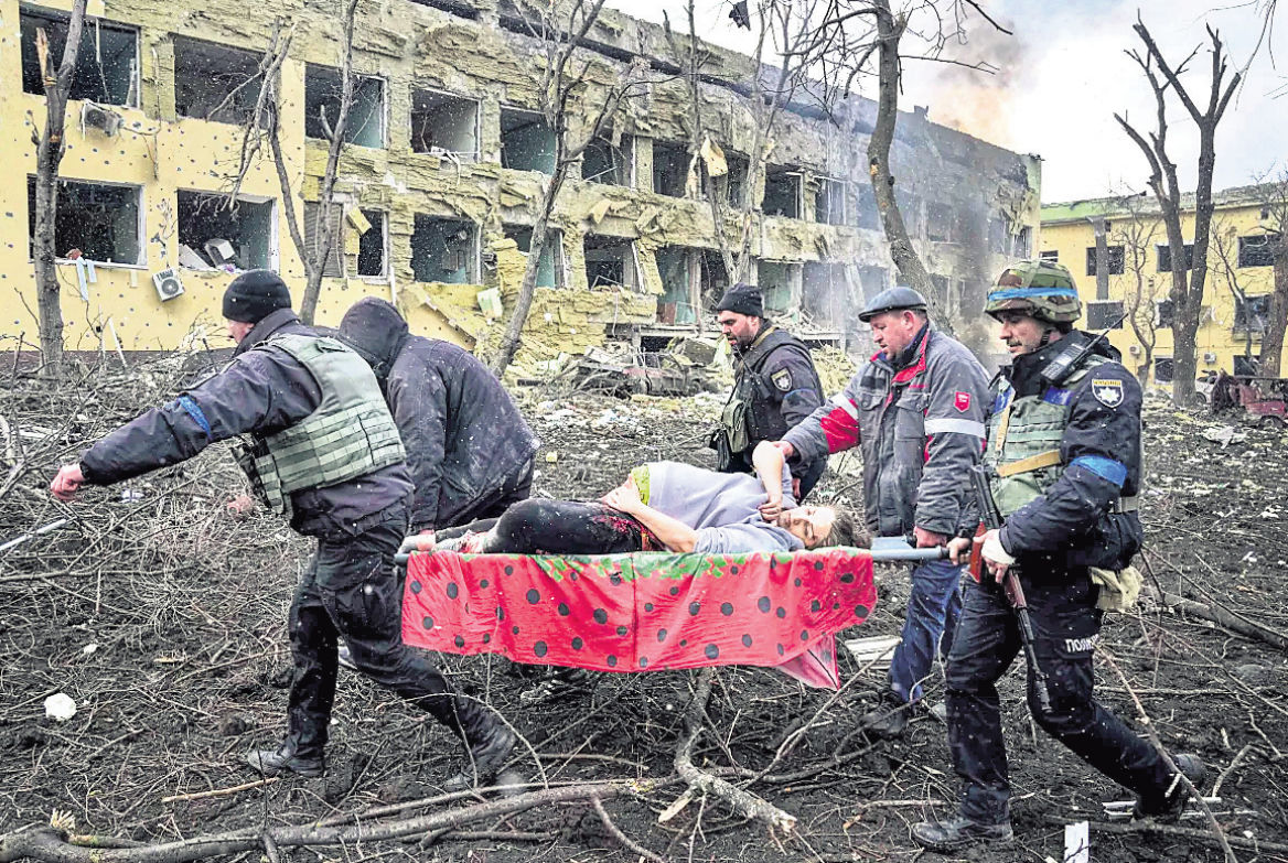
ରୁଷିଆ ଆକ୍ରମଣରେ ଆହତ ହୋଇଥିବା ଜଣେ ଗର୍ଭବତୀଙ୍କୁ ମାରିଦିଆଯାଇଛି ଏକ ହସିଗାଲରୁ ଯୁଦ୍ଧରେ ବେହେରାମାନେ ଉଦ୍ଧାର କରୁଛନ୍ତି ।