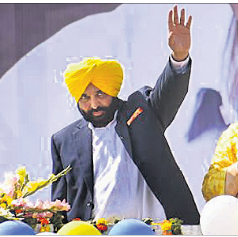
ଭଗତ ସିଂ ମାନ୍