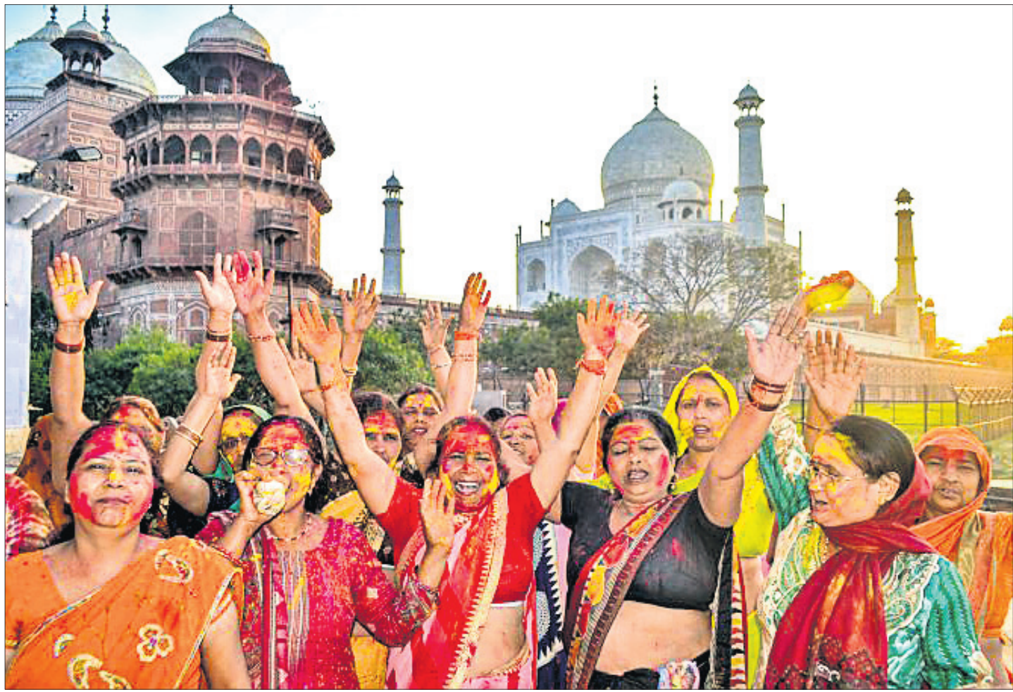
ଭାରତୀୟ ଗୃହ ମନ୍ତ୍ରାଳୟରେ ଉତ୍ତରପ୍ରଦେଶର ଆଗ୍ରାଠାରେ ମହିଳା ସମର୍ଥକମାନେ ଉତ୍ସବ ପାଳନ କରୁଛନ୍ତି ।