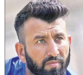
ହୋଇ (ଇଲିଆ), ୧୦୩ (ପି.ଟି.)