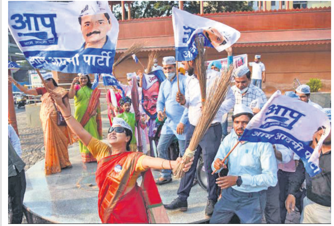
ପଞ୍ଚାବରେ ଆମ୍ଭ ଆତ୍ମା ପାଟିର ବିଜୟ ପରେ ପୁଣ୍ୟରେ ସମର୍ଥକମାନେ ଖୁସି ମନାଉଛନ୍ତି।

ଦଳର ବିଶାଳ ବିଜୟ ପରେ ରାଜ୍ୟବାସୀଙ୍କୁ ସମାଧିକାର କରି କେନ୍ଦ୍ରୀୟ କହିଥିଲେ, ନିର୍ବାଚନ ପ୍ରକାର ବେଳେ ତାଙ୍କୁ ବିଚ୍ଛିନ୍ନତାବାଦୀଙ୍କ ସମର୍ଥକ ବୋଲି ପୂର୍ବତନ ଏବଂ ନେତା କୁମାର ବିଶ୍ୱାସ ଅଭିଯୋଗ ଆଣିଥିଲେ। କେନ୍ଦ୍ରୀୟ ପଞ୍ଚାବ ମୁଖ୍ୟମନ୍ତ୍ରୀ କିମ୍ବା ଖଲିସ୍ତାନ ପ୍ରଧାନମନ୍ତ୍ରୀ ହେବାକୁ ଚାହାନ୍ତି ବୋଲି କୁମାର ଅଭିଯୋଗ କରିବା ପରେ ଏହାକୁ ନେଇ ବଡ଼ ବିବାଦ ସୃଷ୍ଟି ହୋଇଥିଲା। ଯଦି ସେ ବିଚ୍ଛିନ୍ନତାବାଦୀ ସମର୍ଥକ ତେବେ ପ୍ରଧାନମନ୍ତ୍ରୀ ମୋଦି ତାଙ୍କ ବିରୋଧରେ ଚପଟ କବ୍‌ଚୁନାହାନ୍ତି କାହିଁକି ବୋଲି କେନ୍ଦ୍ରୀୟ ସେତେବେଳେ କହିଥିଲେ।