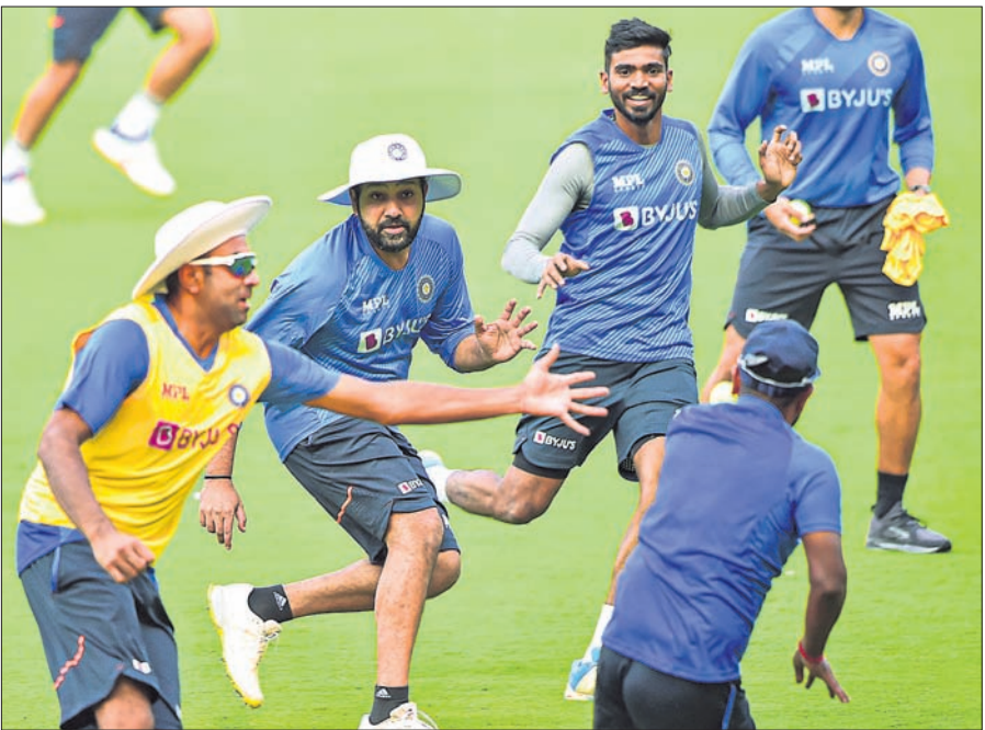
ଶ୍ରୀଲଙ୍କା ବିପକ୍ଷ ବିପକ୍ଷ ଟେଷ୍ଟ ପାଇଁ ଗୁରୁବାର ଅଭ୍ୟାସ କରୁଛନ୍ତି ଭାରତୀୟ ଖେଳାଳିମାନେ।

ବୁଧାବିଳା, ୧୦ମା (ପି.ଟି.) ଶ୍ରୀଲଙ୍କା ବିପକ୍ଷ ପ୍ରଥମ ଟେଷ୍ଟରେ ଏକ ଇନିଂସ୍ ଓ ୨୨୨ ରନରେ ବିପୁଳ ବିଜୟ ହାସଲ କରିଥିବାରୁ ବେଙ୍ଗାଳୁରୁରେ ଖେଳାଯିବାକୁ ଥିବା ବିପକ୍ଷ କ୍ରିକେଟ ଟେଷ୍ଟ ଲାଗି ଭାରତ ପୃଷ୍ଠା କୋର୍ ଡାକ୍ତରୀ ଡ୍ରାଭିଟ ଓ ଅଧିନାୟକ ରୋହିତ ଶର୍ମା ଦଳରେ କୌଣସି ପରିବର୍ତ୍ତନ ନ କରିବା ସମ୍ଭାବନା ଯଥେଷ୍ଟ। ହେଲେ ଶନିବାର ବେଙ୍ଗାଳୁରୁରେ ଖେଳାଯିବାକୁ ଥିବା ବିପକ୍ଷ ଟେଷ୍ଟ ମ୍ୟାଚ ଦିବାରାତ୍ର ବିଶିଷ୍ଟ। ଏଥିପାଇଁ ଦୁହେଁ କି ଯୋଜନା ରଖିଛନ୍ତି ସେ ନେଇ ମନରେ କୌତୁହଳ ସୃଷ୍ଟି ହେବା ସ୍ୱାଭାବିକ। ଗତ ମ୍ୟାଚରେ ପତନ ଘଟିଥିବା ୨୦ଟି ଉଇକେଟ ମଧ୍ୟରେ ୧୫ଟି ରବୀନ୍ଦ୍ର ଜାଡେଜା ଓ ରବିଚନ୍ଦ୍ର ଅଶ୍ୱିନ ସେମାନଙ୍କ ମଧ୍ୟରେ ବାଣ୍ଟି ନେଇଛନ୍ତି। ହେଲେ ଏଥରେ ହରିଯାଣା ଅପହ୍ରିନର ଇୟତ ଯାବଦଙ୍କ ପ୍ରଦର୍ଶନ ଉଦ୍ଦୀକ୍ଷାକର ନ ଥିଲା। ସେ ଦୁଇଟି ଇନିଂସରେ ମୋଟ ୧୭ ଓଭର ବୋଲି କରିଥିଲେ ମଧ୍ୟ ଗୋଟିଏ ହେଲେ ଉଇକେଟ ନେଇ ପାରି ନ ଥିଲେ। ଚିନ୍ତାସୀନା ଗ୍ରାକ୍ଟର