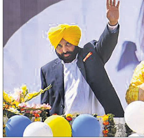
ଭଗତ ସିଂ ମାନ୍