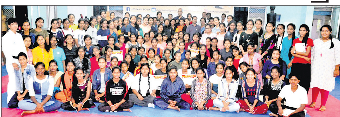
ଅତିଥି ଓ କର୍ମକର୍ତ୍ତାଙ୍କ ଗହଣରେ ଆୟତ୍ତ ପ୍ରଶିକ୍ଷଣ ଶିବିରରେ ଭାଗ ନେଇଥିବା ଛାତ୍ରୀମାନେ।