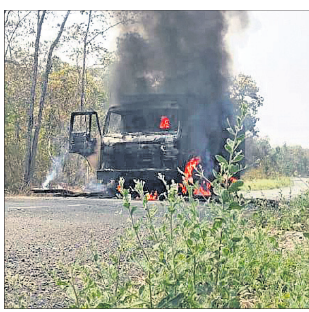
ମାଓବାଦୀମାନେ ପୋଡ଼ିଦେଇଥିବା ଗାଡ଼ି।

ମାଲକାନଗିରି ଜିଲ୍ଲା ସାମାନ୍ତ ଛତିଶଗଡ଼ରେ ମାଓବାଦୀମାନେ ରାସ୍ତା କାମରେ ନିୟୋଜିତ ଗାଡ଼ି ପୋଡ଼ିଦେଇଛନ୍ତି। ଛତିଶଗଡ଼ର ସୁନ୍ଦା ଜିଲ୍ଲା କିନ୍ଦ୍ରାପା ଗ୍ରାମ ନିକଟସ୍ଥ ଧର୍ମାପେଟା ଠାରେ ଏପରି ଘଟଣା ଘଟିଛି। ରାସ୍ତା ନିର୍ମାଣ ପାଇଁ ସାମଗ୍ରୀ ଧରି ଯାଉଥିବା ମାଲ ବୋହେଇ ଗାଡ଼ିକୁ ମାଓବାଦୀମାନେ ଅଟକାଇ ନିଆଁ ଲଗାଇ ଦେଇଥିଲେ। ଖବରପାଇ ପୋଲିସ୍ ପହଞ୍ଚି ଘଟଣାର ତଦନ୍ତ ଆରମ୍ଭ କରିଛି। ସମ୍ପୂର୍ଣ୍ଣ ଅଞ୍ଚଳରେ କୋର୍ଟି ଅପରେଶନକୁ କୋର୍ଡ଼ଦାର କରାଯାଇଛି। ସୂଚନାଯୋଗ୍ୟ, ରାସ୍ତାକାମ କରୁଥିବା ଠିକାଦାରଙ୍କ ଉପରେ ମାଓବାଦୀମାନେ ଆକ୍ରମଣ କରିବା ବେଳେ ସେ ଏଥିରୁ ଅଳ୍ପକେ ବର୍ତ୍ତିଯାଇଛନ୍ତି।