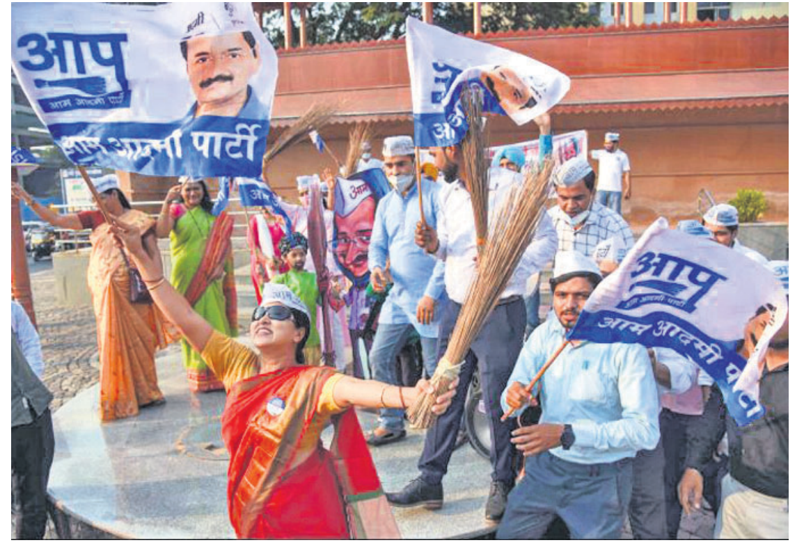
ପଞ୍ଚାବରେ ଆମ୍ଭ ଆତ୍ମା ପାଟିର ବିଜୟ ପରେ ପୁଣ୍ୟରେ ସମର୍ଥକମାନେ ଖୁସି ମନାଉଛନ୍ତି।

'କେନ୍ଦ୍ରୀୟ ଆତଙ୍କବାଦୀ ଦୁହେଁ' ପଞ୍ଚାବ ଜନସାଧାରଣ ଭୋଟ ମାଧ୍ୟମରେ ଏହି ରାଜ୍ୟ ଦେଇଥିବା ଏବଂ ପିଠି ଲାଗି ଆବାହକ ଅରବିନ୍ଦ କେନ୍ଦ୍ରୀୟ ସମର୍ଥକମାନଙ୍କୁ ଉଦ୍‌ବୋଧନ ଦେଇ କହିଛନ୍ତି। ଆମ୍ଭ ଆତ୍ମା ପାଟି ବିରୋଧରେ ସବୁ ରାଜନୈତିକ ଦଳ ଏକାଠି ହୋଇଥିଲେ। ଏବଂ ପିଠି ହରାଇବା ସେମାନଙ୍କର ଏକମାତ୍ର ଲକ୍ଷ୍ୟ ଥିଲା। ଏଥିପାଇଁ ବଡ଼ ଷଡ଼ଯନ୍ତ୍ର ହୋଇଥିଲା। ଶେଷରେ ଜନାଦେଶ ଜଣାଇଦେଲା କେନ୍ଦ୍ରୀୟ ଆତଙ୍କବାଦୀ ଦୁହେଁ, ପ୍ରକୃତ ଭୃମିପୁତ୍ର, ଜଣେ ସକ୍ଷମ ଲାଗିଆତଙ୍କବାଦୀ ବୋଲି ଦିଲ୍ଲୀ ମୁଖ୍ୟମନ୍ତ୍ରୀ କହିଛନ୍ତି। ପଞ୍ଚାବରେ ଦଳର ବିଶାଳ ବିଜୟ ପରେ ରାଜ୍ୟବାସୀଙ୍କୁ ସମାଧିଷ୍ଠ କରି କେନ୍ଦ୍ରୀୟ କହିଥିଲେ, ନିର୍ବାଚନ ପ୍ରକାର ବେଳେ ତାଙ୍କୁ ବିଚ୍ଛିନ୍ନତାବାଦୀଙ୍କ ସମର୍ଥକ ବୋଲି ପୂର୍ବତନ ଏବଂ ନେତା କୁମାର ବିଶ୍ୱାସ ଅଭିଯୋଗ ଆଣିଥିଲେ। କେନ୍ଦ୍ରୀୟ ପଞ୍ଚାବ ମୁଖ୍ୟମନ୍ତ୍ରୀ କିମ୍ବା ଖଲିସ୍ତାନ ପ୍ରଧାନମନ୍ତ୍ରୀ ହେବାକୁ ଚାହାନ୍ତି ବୋଲି କୁମାର ଅଭିଯୋଗ କରିବା ପରେ ଏହାକୁ ନେଇ ବଡ଼ ବିବାଦ ସୃଷ୍ଟି ହୋଇଥିଲା। ଯଦି ସେ ବିଚ୍ଛିନ୍ନତାବାଦୀ ସମର୍ଥକ ତେବେ ପ୍ରଧାନମନ୍ତ୍ରୀ ମୋଦି ତାଙ୍କ ବିରୋଧରେ ଚପଟ କବ୍‌ଚୁନାହାନ୍ତି କାହିଁକି ବୋଲି କେନ୍ଦ୍ରୀୟ ସେତେବେଳେ କହିଥିଲେ।