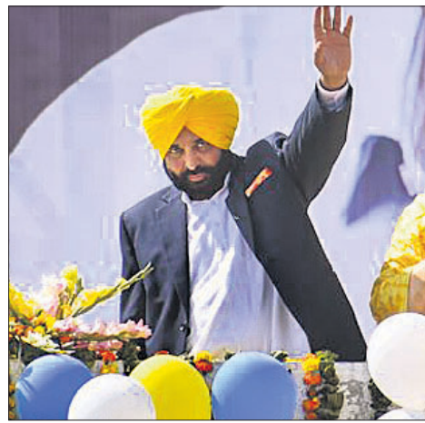
ଭଗଞ୍ଜ ସିଂ ମାନ୍