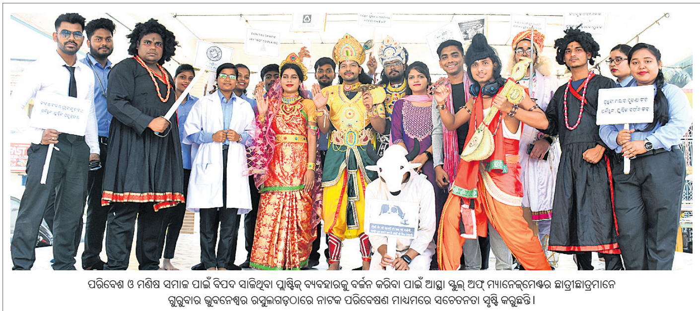
ପରିବେଶ ଓ ମଣିଷ ସମାଜ ପାଇଁ ବିପଦ ସୃଷ୍ଟି ହେଉଥିବା ସ୍ୱାସ୍ଥ୍ୟକ ବିଦ୍ୟାରୁ ବର୍ଜନ କରିବା ପାଇଁ ଆସ୍ଥା ସ୍କୁଲ ଅଫ ମ୍ୟାନେଜମେଣ୍ଟର ଛାତ୍ରାଛାତ୍ରମାନେ ଗୁରୁବାର ଭୁବନେଶ୍ୱର ରସୁଲଗଡ଼ଠାରେ ନାଟକ ପରିବେଷଣ ମାଧ୍ୟମରେ ସଚେତନତା ସୃଷ୍ଟି କରୁଛନ୍ତି।