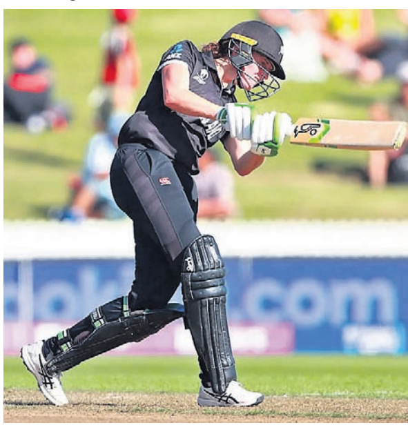
ଅର୍ଦ୍ଧଶତକୀୟ ଇନିଂସ୍ ଅବସରରେ ଆମି ସାଗର୍ଥଫ୍ରେଟ୍

ଚଳିତ ଆଇସିସି ମହିଳା କ୍ରିକେଟ ବିଶ୍ଵକପ୍ଟର ଲିଟ୍ ପର୍ଯ୍ୟାୟରେ ଭାରତ ଏହାର ବିପକ୍ଷ ମ୍ୟାଚ ହାରିଯାଇଛି। ଭାରତକୁ ନ୍ୟୁଜିଲ୍ୟାଣ୍ଡ ୬୨ ରନରେ ପରାସ୍ତ କରିଛି। ଏହି ମ୍ୟାଚରେ ପ୍ରଥମେ ବ୍ୟାଟିଂ କରିଥିବା ନ୍ୟୁଜିଲ୍ୟାଣ୍ଡ ୯ ଉଇକେଟ ବିନିମୟରେ ୨୬୦ ରନ କରିଥିଲା। ଭାରତ ୪୬.୪ ଓଭରରେ ୧୯୮ ରନ କରି ଅଲଆଉଟ ହୋଇଯାଇଥିଲା। ନ୍ୟୁଜିଲ୍ୟାଣ୍ଡଠାରୁ ପରାସିତ ହେବା ପରେ ଭାରତ ୮ଟି ଦଳକୁ ନେଇ ଅନୁଷ୍ଠିତ ହେଉଥିବା ଏହି ଚୁନାଁମେଣ୍ଟର ପଏଣ୍ଟ ଟେବୁଲର