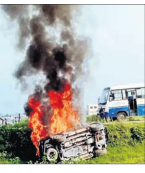
ଭାଜପା ସରକାର ଏହାକୁ ଘଷ ଘୋଡ଼ାଉଥିବା ବିରୋଧୀ ଅଭିଯୋଗ କରିଥିଲେ । ଏହାର ପ୍ରଭାବ ବିଧାନସଭା ନିର୍ବାଚନ ଉପରେ ପଡ଼ିବ ବୋଲି ଅଧିକାରୀଙ୍କ ବିଶ୍ଵାସ କରୁଥିଲେ । ତେବେ