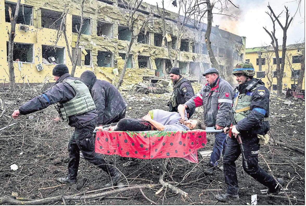
ରୁଷିଆ ଆକ୍ରମଣରେ ଆହତ ହୋଇଥିବା ଜଣେ ଗର୍ଭବତୀକୁ ମାରିଦିଆଯାଇଛି ଏକ ହସିଗାଲରୁ ଯୁଦ୍ଧରେ ବେହାରୀମାନେ ଉଦ୍ଧାର କରୁଛନ୍ତି ।