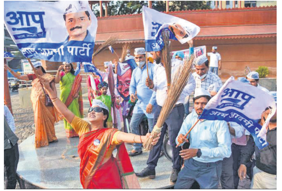
ପଞ୍ଜାବରେ ଆମ୍ଭ ଆତ୍ମା ପାଟିର ବିଜୟ ପରେ ମୁଖ୍ୟମନ୍ତ୍ରୀ ସମର୍ଥକମାନେ ଖୁସି ମନାଉଛନ୍ତି।

'କେନ୍ଦ୍ରୀୟ ଆତଙ୍କବାଦୀ ଦୁହେଁ' ପଞ୍ଜାବ ଜନସାଧାରଣ ଭୋଟ ମାଧ୍ୟମରେ ଏହି ରାଜ୍ୟ ଦେଇଥିବା ଏବଂ ପିଠି ଛାଡ଼ି ଆବାହକ ଅଭିବ୍ୟକ୍ତି କେନ୍ଦ୍ରୀୟ ସମର୍ଥକମାନଙ୍କୁ ଉଦ୍‌ବୋଧନ ଦେଇ କହିଛନ୍ତି। ଆମ୍ଭ ଆତ୍ମା ପାଟି ବିରୋଧରେ ସବୁ ରାଜନୈତିକ ଦଳ ଏକାଠି ହୋଇଥିଲେ। ଏବଂ ପିଠି ହରାଇବା ସେମାନଙ୍କର ଏକମାତ୍ର ଲକ୍ଷ୍ୟ ଥିଲା। ଏଥିପାଇଁ ବଡ଼ ଷଡ଼ଯନ୍ତ୍ର ହୋଇଥିଲା। ଶେଷରେ ଜନାଦେଶ ଜଣାଇଦେଲା କେନ୍ଦ୍ରୀୟ ଆତଙ୍କବାଦୀ ଦୁହେଁ, ପ୍ରକୃତ ଭୃମିପୁତ୍ର, ଜଣେ ସକ୍ଷମ ଛାତ୍ରାଧିକାରୀ ବୋଲି ଦିଲ୍ଲୀ ମୁଖ୍ୟମନ୍ତ୍ରୀ କହିଛନ୍ତି। ପଞ୍ଜାବରେ ଦଳର ବିଶାଳ ବିଜୟ ପରେ ରାଜ୍ୟବାସୀଙ୍କୁ ସମାଧିକାର କରି କେନ୍ଦ୍ରୀୟ କହିଥିଲେ, ନିର୍ବାଚନ ପ୍ରକାର ବେଳେ ତାଙ୍କୁ ବିଚ୍ଛିନ୍ନତାବାଦୀଙ୍କ ସମର୍ଥକ ବୋଲି ପୂର୍ବତନ ଏବଂ ନେତା କୁମାର ବିଶ୍ୱାସ ଅଭିଯୋଗ ଆଣିଥିଲେ। କେନ୍ଦ୍ରୀୟ ପଞ୍ଜାବ ମୁଖ୍ୟମନ୍ତ୍ରୀ କିମ୍ବା ଖଲିସ୍ତାନ ପ୍ରଧାନମନ୍ତ୍ରୀ ହେବାକୁ ଚାହାନ୍ତି ବୋଲି କୁମାର ଅଭିଯୋଗ କରିବା ପରେ ଏହାକୁ ନେଇ ବଡ଼ ବିବାଦ ସୃଷ୍ଟି ହୋଇଥିଲା। ଯଦି ସେ ବିଚ୍ଛିନ୍ନତାବାଦୀ ସମର୍ଥକ ତେବେ ପ୍ରଧାନମନ୍ତ୍ରୀ ମୋଦି ତାଙ୍କ ବିରୋଧରେ ଚପଟ କବ୍‌ଚୁନାହାନ୍ତି କାହିଁକି ବୋଲି କେନ୍ଦ୍ରୀୟ ସେତେବେଳେ କହିଥିଲେ।