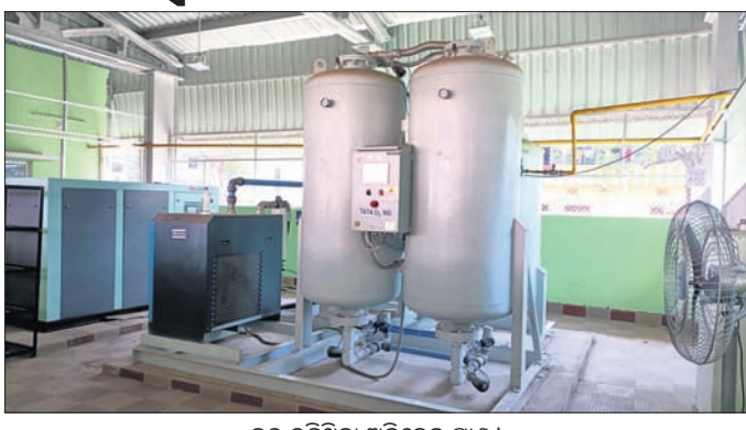
ବନ୍ଦ ରହିଥିବା ଅକ୍ଷିଜେନ ପ୍ଲାଣ୍ଟ

କେନ୍ଦୁଝର ଜିଲ୍ଲା ମୁଖ୍ୟ ଡାକ୍ତରଖାନାରେ ଲକ୍ଷ୍ମଣ ଚକା ବ୍ୟୟରେ ବସିଥିବା ଅକ୍ଷିଜେନ ଜେନେରେଟର କାମରେ ଲାଗୁନି। ଏହା କାର୍ଯ୍ୟକ୍ଷମ ହେବା ଦିନ ଠାରୁ ଅକ୍ଷିଜେନ ଲିଭ ହେଉଥିବାରୁ ବ୍ୟବହାର ହୋଇପାରୁନାହିଁ। ଫଳରେ ଏହାକୁ ନେଇ ରୋଗୀ ମାନେ ସେବା ପାଇବାକୁ ବଞ୍ଚିତ ରହିଥିବା ବେଳେ ଏହାର ରକ୍ଷଣାବେକ୍ଷଣ ଦାୟିତ୍ଵରେ ଥିବା କର୍ମଚାରୀ ବସି ବସି ଦରମା ନେଉଥିବାରୁ ଲକ୍ଷ ଲକ୍ଷ ଟଙ୍କା ଅର୍ଥ ଅପତ୍ୟ ଖର୍ଚ୍ଚ ହେଉଛି।