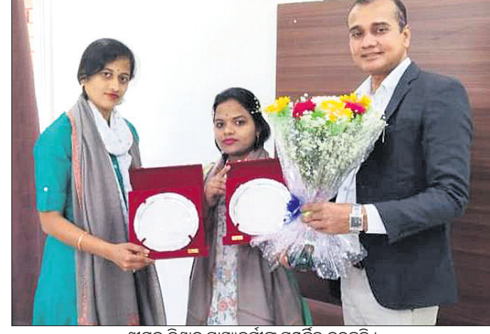
ଶ୍ରୀମତ ବିଶ୍ଵାଳ ସ୍ଵାସ୍ଥ୍ୟକର୍ମୀଙ୍କୁ ସମ୍ବର୍ଦ୍ଧିତ କରୁଛନ୍ତି।

ଖଜରା, ୧୦୩୩(ଡି.ଏନ.ଏ.): କେନ୍ଦ୍ର ସ୍ଵାସ୍ଥ୍ୟ ମନ୍ତ୍ରାଳୟ ପକ୍ଷରୁ ବାଲେଶ୍ଵରର ୨ ସ୍ଵାସ୍ଥ୍ୟକର୍ମୀ ଶ୍ରେଷ୍ଠ ଚିକିତ୍ସାକାରୀ ଭାବେ ମନୋନୀତ କରାଯାଇ ପୁରସ୍କୃତ କରାଯିବା ପରେ ସେମାନଙ୍କୁ ସମ୍ବର୍ଦ୍ଧନାର ସ୍ଵପ୍ନ ଛୁଇଁଛି। ଉଭୟ ଡି.ଲି.ଏ. ଖଜରା, ସିପ୍ରିଲିଆରେ ଜନସେବକରେ ନିଯୋଜିତ ଅଧ୍ୟକ୍ଷ ଫାଉଣ୍ଡେଶନ ପକ୍ଷରୁ ଏହି ସ୍ଵାସ୍ଥ୍ୟକର୍ମୀ