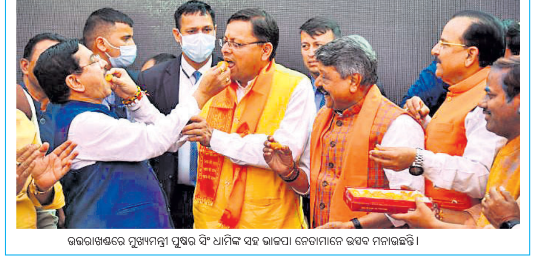
ଉତ୍ତରାଖଣ୍ଡରେ ମୁଖ୍ୟମନ୍ତ୍ରୀ ପୁଷ୍ପର ସିଂ ଧୀରଙ୍କ ସହ ଭାଜପା ନେତାମାନେ ଉତ୍ସବ ମନାଉଛନ୍ତି।