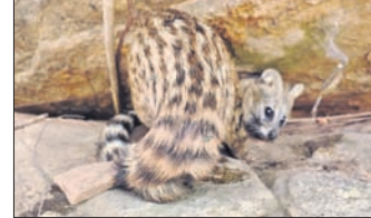
ଭଞ୍ଜର ହୋଇଥିବା ଶାଳିଆପତଙ୍ଗ।

ସକନାଗଡ଼, ୧୦୩୩(ଡି.ଏନ.ଏ.) ବାଲେଶ୍ଵର ଜିଲ୍ଲା ନାଳଗିରି କୁଳଡ଼ିଆ ଅଭୟାରଣ୍ୟ ପାଦଦେଶ ପ୍ରସିଦ୍ଧ ଶୈବପୀଠ ନିକଟରେ ଗୁରୁବାର ଏକ ବିରଳ ପ୍ରଜାତିର ଜଙ୍ଗଲୀୟ ଶାଳିଆପତଙ୍ଗକୁ ଠାବ କରାଯାଇଛି। ଏହି ଜନ୍ତୁ ଓଡ଼ିଶା ତଥା ଭାରତର ବିଶେଷ କରି ଶ୍ରୀଲଙ୍କା, ମିୟାମାର, ଥାଇଲାଣ୍ଡ, ଚୀନ, ବାଙ୍ଗଳାଦେଶ, ନେପାଳ ଆଦି ଦେଶରେ ଦେଖାଯାନ୍ତି। ନାଳଗିରିର ଅନୁପାଳନ ଉପରେ ନଜର ରଖିବା ସହିତ ସମ୍ପୂର୍ଣ୍ଣ ନିର୍ବାଚନ ପ୍ରକ୍ରିୟା ସମ୍ପର୍କରେ ସମୀକ୍ଷା କରିବେ। ଏତଦ୍ଵ୍ୟତୀତ ନିର୍ବାଚନ ସଂକ୍ରାନ୍ତୀୟ ବିଭିନ୍ନ ଅଭିଯୋଗର ସମାଧାନ ସହ ସ୍ଵଳ୍ପ ଓ ଅବାଧି ନିର୍ବାଚନ ପାଇଁ ଆବଶ୍ୟକ ପଦକ୍ଷେପ ଗ୍ରହଣ କରିବେ।