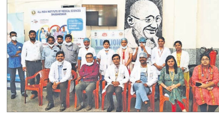
ବିଶ୍ୱ କିଡ୍ନୀ ଦିବସ ପାଳନ ଅବସରରେ ଏମ୍ବୁର ଡାକ୍ତର ଓ ଅନୁମୋଦନ।

ଭୁବନେଶ୍ୱର ୨୦୧୯ରୁ ଡାଏଲିସିସ୍ ସେବା ଯୋଗାଇ ଆସୁଛି। ଏସ୍ପିକେଏମ୍ ବିଭାଗ କିଡ୍ନୀ ରୋଗ ପାଇଁ ପ୍ଲାକାମାଫେରେସିସ୍, ସିଆର୍ଆର୍ଡି, ରୋନାଲ୍ ବାୟୋସି ଭଳି ସେବା ଉପଲବ୍ଧ ରହିଛି। ଓଡ଼ିଶାରେ କ୍ରମାଗତ ଭାବେ କ୍ରମିକ ବୃକ୍କଜ ରୋଗୀଙ୍କ ସଂଖ୍ୟା ବୃଦ୍ଧି ପାଇଛି। ତଥ୍ୟାନୁସାରେ ରାଜ୍ୟର ମୋଟ ଜନସଂଖ୍ୟାର ପ୍ରାୟ ୧୦-୧୫ ପ୍ରତିଶତ କିଡ୍ନୀଜନିତ ରୋଗରେ ପୀଡ଼ିତ। ଏପରିକି ରାଜ୍ୟରେ କିଛି ଅଞ୍ଚଳରେ ଏହା ପ୍ରାୟ ୨୦ ପ୍ରତିଶତ ରହିଛି ଓ ଏ ସମସ୍ତ ଅଞ୍ଚଳକୁ ସିକ୍ସିଟି ହର୍ସ୍ସର୍ ଭାବେ ବିଦେଶିତ କରାଯାଇଛି। ଏହା ଚିକିତ୍ସକ ବୋଲି ତା. ପଞ୍ଚା ମତବ୍ୟକ୍ତ କରିଛନ୍ତି। ଆହୁରି ମଧ୍ୟ ସେ କହିଛନ୍ତି, ସାମୁଦ୍ରିକ ପରିସ୍ଥିତିରେ ବିଶ୍ୱବ୍ୟାପୀ ଡାକ୍ତରୀକି ସ୍ ମେଲିଟସ୍ ହେଉଛି ଉଚ୍ଚ