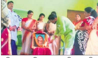
ସାବିତ୍ରୀବାଲିକୁ ଅତିଥିମାନେ ଶ୍ରଦ୍ଧାଞ୍ଜଳି ଜଣାଉଛନ୍ତି ।

ସାବିତ୍ରୀବାଲି, ୧୦୩(ଡି.ଏ.ଏ.ଏ.)- ସାବିତ୍ରୀବାଲି ପୁଲେଙ୍କ ମହାପରିନିର୍ବାଣ ଦିବସ ଉପଲକ୍ଷେ ଏକ ସମାଧାନ କାର୍ଯ୍ୟକ୍ରମ ଆୟତ୍ତ ହେବ। ଯେଉଁ ସମୟରେ ଗାଧୋଇବାକୁ ଯାଉଥିଲେ ସେ ସମୟରେ ସେ ନଦୀର ତୀରରେ ଖଣ୍ଡରେ ବୁଡ଼ିଯାଇଥିଲେ।