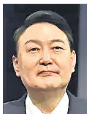
ୟୋନ୍ ସୁକ୍ ଯୋଲ୍

ଦକ୍ଷିଣ କୋରିଆର ବିରୋଧୀ ନେତା ତଥା କଞ୍ଚରଭେଟିଭ୍ ଯୋନ୍ ସୁକ୍ ଯୋଲ୍ ଗୁରୁବାର ରାଷ୍ଟ୍ରପତି ନିର୍ବାଚିତ ହୋଇଛନ୍ତି । ଗୁଧବାର ହୋଇଥିବା ନିର୍ବାଚନରେ ଯୋନ୍‌ଙ୍କୁ ଡାକ୍ ପ୍ରତିଦ୍ୱନ୍ଦ୍ୱୀ ଉଦାରିବାଦୀ ଲି ଜେ ମୁଙ୍ଗୁକ୍ କଡ଼ା ଚଙ୍କର ଦେଇଥିଲେ । ପିପୁଲ୍ ପାର୍ଟିର ପାର୍ଟିର ଯୋନ୍ ସୁକ୍ ଯୋଲ୍ ୪୮.୫୦% ଭୋଟ ପାଇଥିବାବେଳେ ଶାସକ ଦଳ ଡେମୋକ୍ରାଟିକ୍ ପାର୍ଟିର ଲି ଜେ-ମୁଙ୍ଗୁକ୍ ୪୭.୮୦% ଭୋଟ ପାଇ କମ୍ ବ୍ୟବଧାନରେ ପରାଜିତ ହୋଇଛନ୍ତି । ବିଜୟୀ ହେବା ପରେ ୬୦ ବର୍ଷୀୟ ଯୋନ୍ ପାଇଁମେଣ୍ଟ ଏବଂ ସମ୍ପାଦନକୁ ସମ୍ମାନ କରିବା ସହ ବିରୋଧୀଙ୍କ ସହ ମିଶି କାମ କରିବେ ବୋଲି କହିଛନ୍ତି । ଏବେ ପ୍ରତିଦ୍ୱନ୍ଦ୍ୱିତା ଶେଷ ହୋଇଛି । ତେଣୁ ଆମେ ଏକାଠି ହୋଇ ଦେଶ ପାଇଁ