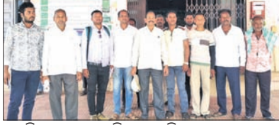
ଉପଜିଲାପାଳଙ୍କୁ ଭେଟିବାକୁ ଆସିଥିବା ଚାଷୀ ।

କରପୁର, ୧୦୩(ନି.ପ୍ର.)- କରପୁର ଉପଖଣ୍ଡ ବୋରିଗୁମ୍ମା ବ୍ଲକ୍ରେ ତେଲେଜିରି ଜଳସେଚନ ପ୍ରକଳ୍ପ କାର୍ଯ୍ୟକାରୀ ହୋଇଛି। ଏହି ପ୍ରକଳ୍ପ କାର୍ଯ୍ୟକାରୀ ହେବା ଦ୍ୱାରା ଧାର୍ଯ୍ୟ ଚାଷୀ ଉପକ୍ରମରେ କେନ୍ଦ୍ରୀୟ ଭାବରେ ଗାଧୋଇବାକୁ ଯାଉଥିଲେ ସେ ସମୟରେ ସେ ନଦୀର ତୀରରେ ଖଣ୍ଡରେ ବୁଡ଼ିଯାଇଥିଲେ।