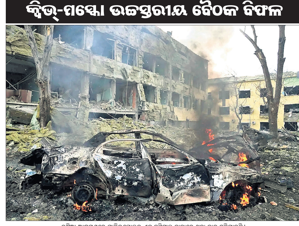
ରୁଷିଆ ଆକ୍ରମଣରେ ମାରିଭପୋଲର ଏକ ହସିଗାଲ ବାହାରେ ଥିବା କାରୁ କଳିଯାଇଛି।

କଣ୍ଟ୍ରୋଲ୍, ୧୦୩୩ ମୁକବିରତି ପାଇଁ ରୁଷିଆ ଏବଂ ଯୁକ୍ତେନ ମଧ୍ୟରେ ତୁର୍କୀର ଆଞ୍ଚଳିକାଠାରେ ବସିଥିବା ଉଚ୍ଚପ୍ରୋଫାଇଲ୍ ଟେଓକରୁ କୌଣସି ନିର୍ଦ୍ଦେଶ ବାହାରିପାରିନାହିଁ। ଯୁକ୍ତେନ ଉପରେ ରୁଷିଆର ଆକ୍ରମଣକୁ ରୁଷିଆ ୧୫ ଦିନ ପୂରିତନାକେ ମୁକପରଠାରୁ ଏହା ଯୁକ୍ତେନ ବହିର୍ବିତାପାର ମନୁା ତିନିଗୋଳୁଲେବା ଏବଂ ରୁଷିଆ ପ୍ରତିପକ୍ଷ ସେଠାରେ ଲାଭୋକ୍ଷ୍ମ ଥିଲା ପ୍ରଥମ ଟେଓକ। ଆଲୋଚନାରେ ତୁର୍କୀ ବହିର୍ବିତାପାର ମନୁା ମେଜଲୁଟ୍ କାବୁସୋଗଲୁ ମଧ୍ୟ ଉପସ୍ଥିତ ଥିଲେ। ଯୁକ୍ତେନର ବନ୍ଦର ସହର ମାରିଭପୋଲରେ ୨୪ ଘଣ୍ଟିଆ ମୁକବିରତି ସହ ମାନବୀୟ କ୍ଷତିର ନିର୍ମାଣ ନିମନ୍ତେ କିଛି ପ୍ରସ୍ତାବ ରଖିଥିଲେ ହେଁ ମନ୍ତ୍ରେ ସେଥରେ ରାଜି ହୋଇ ନ ଥିବା କୁଲେବା କହିଛନ୍ତି। ଏଥିସହ ଯୁକ୍ତେନ ରୁଷିଆ ଆଗରେ ଆତ୍ମସମର୍ପଣ କରିବା ନିମନ୍ତେ ଲାଭୋକ୍ଷ୍ମ ପ୍ରସ୍ତାବ ରଖିଛନ୍ତି। ହେଲେ କିଛି କେବେ ତାହା କରିବ ନାହିଁ ବୋଲି କୁଲେବା ସୂଚନା ଦେଇଛନ୍ତି। ଏହି ଟେଓକ ବେଳାକ୍ଷ୍ମ ସୀମା ନିକଟରେ ହୋଇଥିବା ପୂର୍ବ ଆଲୋଚନାର ବିକଳ ହୋଇପାରିବ ନାହିଁ ବୋଲି ଲାଭୋକ୍ଷ୍ମ କହିଛନ୍ତି। ଏଥିସହ ମୁକ ବନ୍ଦ କରିବା ପାଇଁ କୌଣସି ସମାଧାନର ବାଟ ବାହାରିଲେ