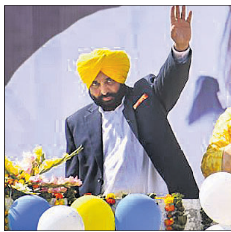
ଭଗତ ସିଂ ମାନ୍