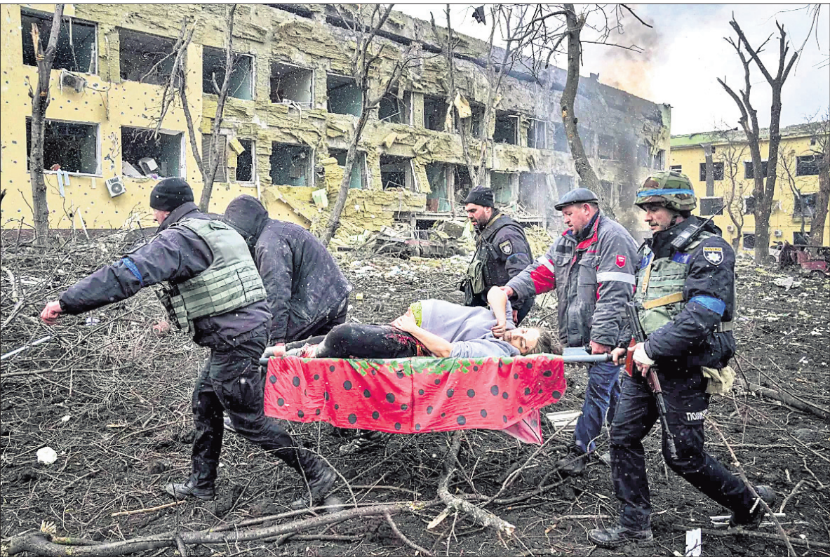
ରୁଷିଆ ଆକ୍ରମଣରେ ଆହତ ହୋଇଥିବା ଜଣେ ଗର୍ଭବତୀକୁ ମାରିଦିଆଯାଇଛି ଏକ ହସିଗାଲରୁ ଯୁଦ୍ଧରେ ବେହାରୀମାନେ ଉଦ୍ଧାର କରୁଛନ୍ତି ।