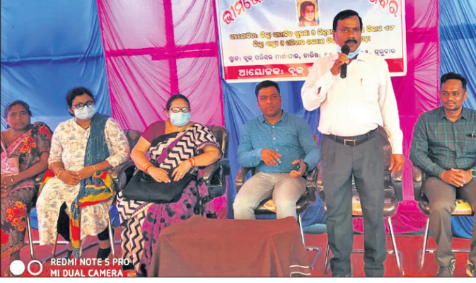
ଭିନ୍ନକ୍ଷମ ସାମର୍ଥ୍ୟ ଶିବିରରେ ମଞ୍ଚାସୀନ ଅତିଥି।