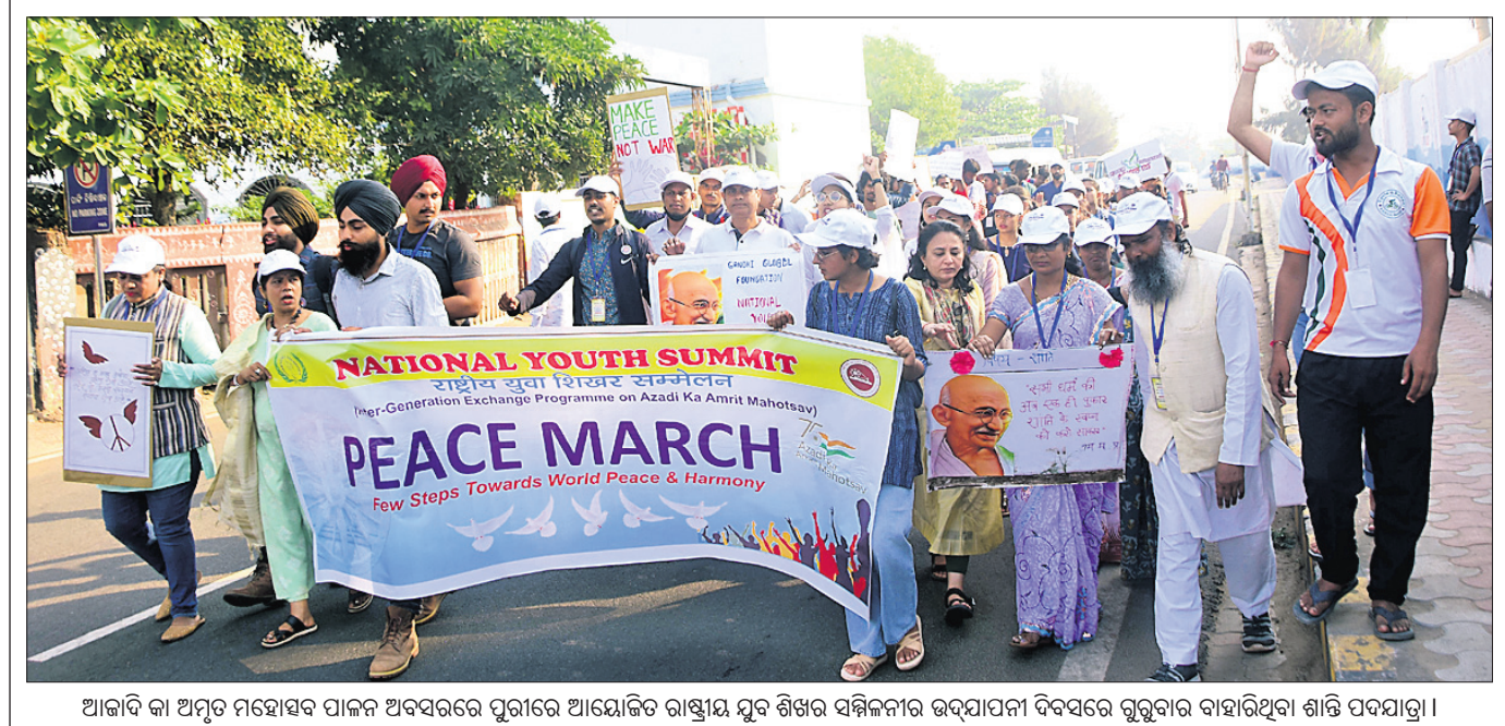
ଆକାଶିକା ଅନୁତ ମହାସଭା ପାଳନ ଅବସରରେ ପୁରୀରେ ଆୟୋଜିତ ରାଷ୍ଟ୍ରୀୟ ଯୁବ ଶିଖର ସମ୍ମିଳନୀର ଉଦ୍‌ଘାଟନା ଦିବସରେ ଗୁରୁବାର ବାହାରିଥିବା ଶାନ୍ତି ପଦଯାତ୍ରା।

ଭୁବନେଶ୍ୱର, ୧୦ମାର୍ଚ୍ଚ(ବୁଧବେଳା): କୋଭିଡ୍ ମୃତ୍ୟୁ ସହାୟତା ପ୍ରଦାନ ସହ ପ୍ରମାଣପତ୍ର ତୁରନ୍ତ ପ୍ରଦାନ କରିବାକୁ ରାଜ୍ୟ ସରକାର ସମସ୍ତ ଜିଲ୍ଲା ମୁଖ୍ୟ ଚିକିତ୍ସାଧିକାରୀଙ୍କୁ ନିର୍ଦ୍ଦେଶ ଦେଇଛନ୍ତି।