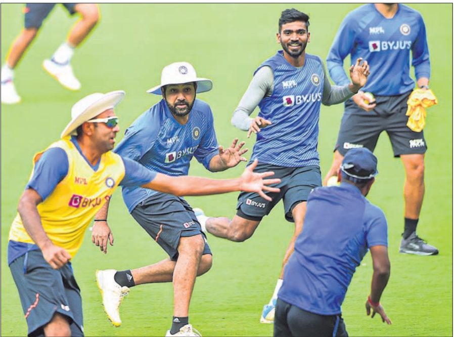
ଶ୍ରୀଲଙ୍କା ବିପକ୍ଷ ବିପକ୍ଷ ଟେଷ୍ଟ ପାଇଁ ଭୁବନେଶ୍ୱର ଅଭ୍ୟାସ କରୁଛନ୍ତି ଭାରତୀୟ ଖେଳାଳିମାନେ।