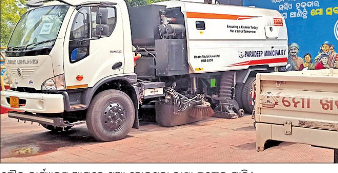
ପୌର କାର୍ଯ୍ୟାଳୟ ଆଗରେ ଥୁଆ ହୋଇଥିବା ରାସ୍ତା ସଫେଇ ଗାଡ଼ି।

ପୌର ପରିଷଦକୁ ଅତ୍ୟାଧୁନିକ ରାସ୍ତା ସଫେଇ ଗାଡ଼ିକୁ ଦିଆଯାଇଥିଲା। ସେତେବେଳେ ଏହି ଗାଡ଼ିକୁ ପାରାଦୀପ ବିଧାନ ସଭା ସଭାପତି ରାଉତରାୟ, ତତ୍କାଳୀନ ବନ୍ଦର ଅଧ୍ୟକ୍ଷ ଭିକି କୁମାର, ପୌର ପ୍ରଶାସନିକ ଅଧିକାରୀ ଓ କମ୍ପାନୀର ବରିଷ୍ଠ ଅଧିକାରୀ ପ୍ରମୁଖଙ୍କ ଉପସ୍ଥିତିରେ ଶୁଭାରମ୍ଭ କରାଯାଇଥିଲା। କଳା ଧୂଳି ଆହ୍ଲାଦିତ ପୌରାଞ୍ଚଳ ରାସ୍ତାକୁ ଯାନ୍ତ୍ରିକାକରଣ ଦ୍ୱାରା ସଫା କରିବାକୁ ବନ୍ଦର ପକ୍ଷରୁ ରାସ୍ତା ସଫେଇ ଗାଡ଼ିର ବ୍ୟବସ୍ଥା ରହିଛି। ପାରାଦୀପ ଗଡ଼ନିଶିପ୍ ଭିତରେ ବନ୍ଦର ପ୍ରଶାସନ ପକ୍ଷରୁ ବୁଲିତ ରାସ୍ତା ସଫେଇ