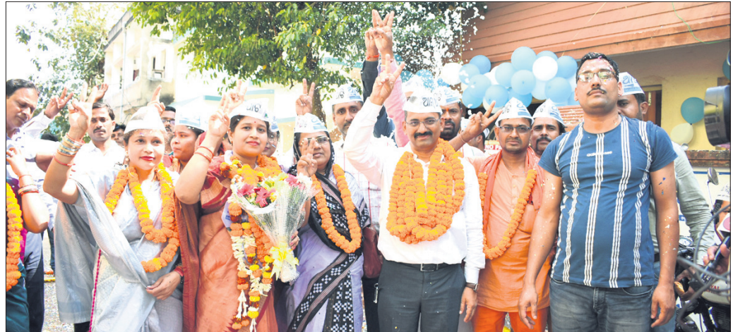
ପଞ୍ଚାବିରେ ଏଏପି ବିଜୟଲାଭ କରିଥିବା ଭୁବନେଶ୍ୱରସ୍ଥିତ ରାଜ୍ୟ କାର୍ଯ୍ୟାଳୟରେ ନେତା ଓ କର୍ମୀମାନେ ଖୁସି ମନାଉଛନ୍ତି।