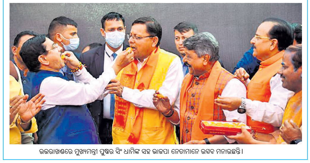
ଉତ୍ତରାଖଣ୍ଡରେ ମୁଖ୍ୟମନ୍ତ୍ରୀ ପୁଷ୍ପର ସିଂ ଧୀରଙ୍କ ସହ ଭାଜପା ନେତାମାନେ ଉତ୍ସବ ମନାଉଛନ୍ତି।