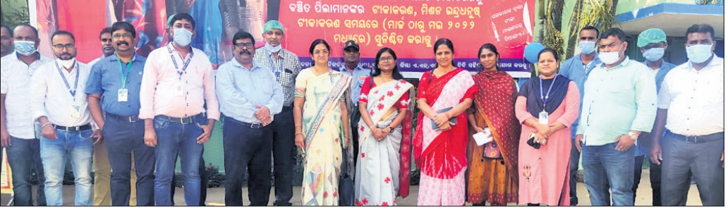
ପାଟକୁରା ସ୍ୱାସ୍ଥ୍ୟକେନ୍ଦ୍ର ପରିବର୍ଦ୍ଧନରେ ଆସିଥିବା 'କାୟାକଳ୍ପ' ଚମ୍ପର ସଭ୍ୟ ଓ ଅନ୍ୟମାନେ।