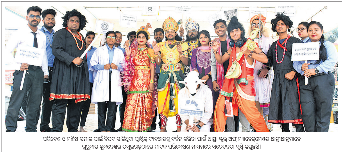
ପରିବେଶ ଓ ମଣିଷ ସମାଜ ପାଇଁ ବିପଦ ସୃଷ୍ଟି ହେଉଥିବା ସ୍ୱାସ୍ଥ୍ୟକ ବିଦ୍ୟାରୁ ବର୍ଜନ କରିବା ପାଇଁ ଆସିଲା ସ୍କୁଲ ଅଫ ନ୍ୟାସନେଲ୍ ମେଡିକାଲ ଛାତ୍ରାଛାତ୍ରମାନେ ଗୁରୁବାର ଭୁବନେଶ୍ୱର ରସୁଲଗଡ଼ଠାରେ ନାଟକ ପରିବେଷଣ ମାଧ୍ୟମରେ ସଚେତନତା ସୃଷ୍ଟି କରୁଛନ୍ତି।