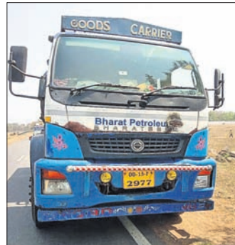
ଦୁର୍ଘଟଣା ଘଟାଇଥିବା ଟ୍ୟାଙ୍କର।

ବରଗଡ଼ ଅପିସ/ଲୋକସିଂହା, ୧୦ମାର୍ଚ୍ଚ ବରଗଡ଼ ଜିଲ୍ଲା ଗାଜପିଲେଟ ଥାନା ଶରଧାପାଲି କଲେଜ ସମ୍ମୁଖରେ ଟ୍ୟାଙ୍କର ଚାପାରେ ମୃତ୍ୟୁବରଣ କରିଥିବା ଛାତ୍ରୀଙ୍କୁ ଉଦ୍ଧାର କରିବା ପାଇଁ ଚାପାରେ ଗୁରୁତର କଣେ କଲେଜ ଛାତ୍ରୀଙ୍କ ମୃତ୍ୟୁ ହୋଇଛି।