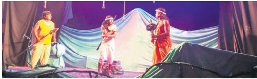
ନାଟକର ଏକ ଦୃଶ୍ୟ ।