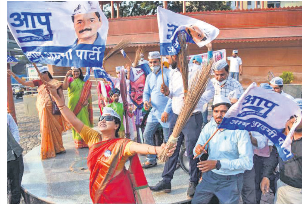
ପଞ୍ଜାବରେ ଆମ୍ଭ ଆତ୍ମା ପାଟିର ବିଜୟ ପରେ ପ୍ରମୁଖରେ ସମର୍ଥକମାନେ ଖୁସି ମନାଉଛନ୍ତି।

ଦଳର ବିଶାଳ ବିଜୟ ପରେ ରାଜ୍ୟବାସୀଙ୍କୁ ସମୟୋଚ୍ଚ କରି କେନ୍ଦ୍ରୀୟ ଲୋକସଭା ଦଳ ନୁହେଁ, ନିର୍ବାଚନ ପ୍ରଚାର ବେଳେ ତାଙ୍କୁ ବିଚ୍ଛିନ୍ନତାବାଦୀଙ୍କ ସମର୍ଥକ ବୋଲି ପୂର୍ବତନ ଏବଂ ନେତା କୁମାର ବିଶ୍ୱାସ ଅଭିଯୋଗ ଆଣିଥିଲେ। କେନ୍ଦ୍ରୀୟ ଲୋକସଭା ଦଳ ପ୍ରମୁଖ୍ୟମନ୍ତ୍ରୀ କିମ୍ବା ଖଲିସ୍ତାନ ପ୍ରଧାନମନ୍ତ୍ରୀ ହେବାକୁ ଚାହାନ୍ତି ବୋଲି କୁମାର ଅଭିଯୋଗ କରିବା ପରେ ଏହାକୁ ନେଇ ବଡ଼ ବିବାଦ ସୃଷ୍ଟି ହୋଇଥିଲା। ଯଦି ସେ ବିଚ୍ଛିନ୍ନତାବାଦୀ ସମର୍ଥକ ତେବେ ପ୍ରଧାନମନ୍ତ୍ରୀ ମୋଦି ତାଙ୍କ ବିରୋଧରେ ଚପଟ କଳ୍ପନାହାନ୍ତି କାର୍ଯ୍ୟକ୍ରମ ବୋଲି କେନ୍ଦ୍ରୀୟ ଲୋକସଭା ଦଳ କହିଥିଲେ।