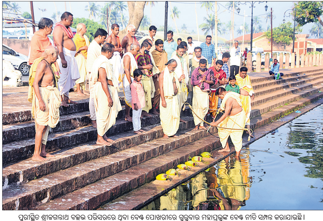
ପୁରୀସ୍ଥିତ ଶ୍ରୀଜଗନ୍ନାଥ ବଲ୍ଲଭ ପରିସରରେ ଥିବା ବେଷ୍ଟ ପୋଖରୀରେ ଗୁରୁବାର ମହାପ୍ରଭୁଙ୍କ ବେଷ୍ଟ ନୀତି ସମ୍ପନ୍ନ କରାଯାଇଛି।