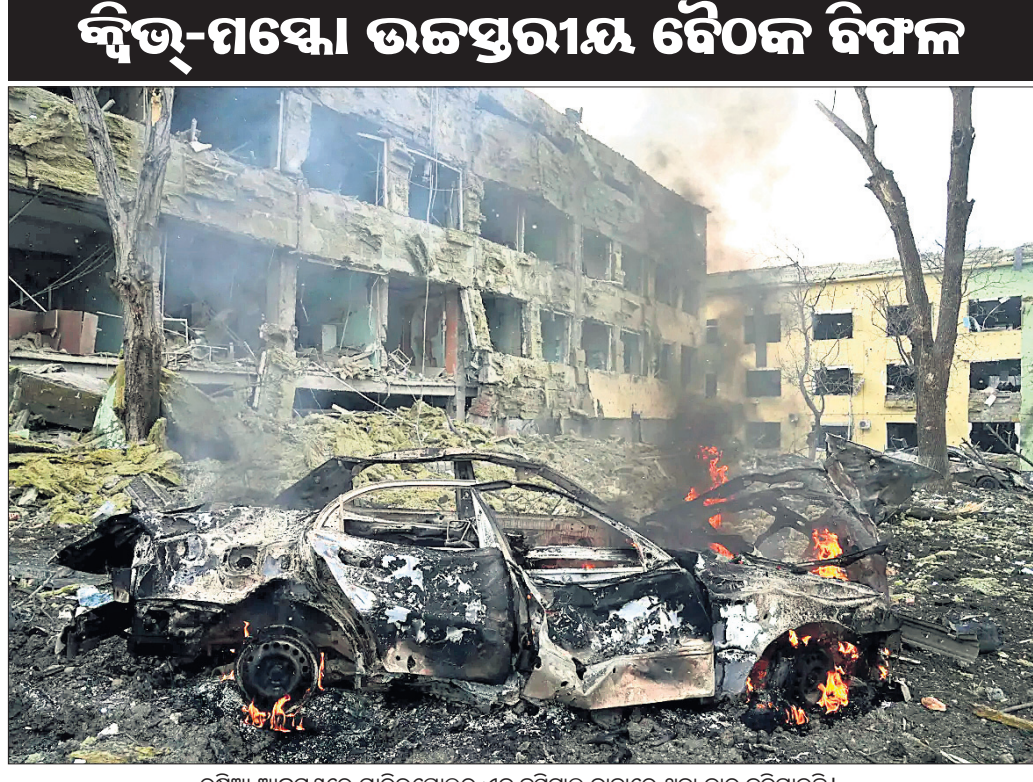
ରୁଷିଆ ଆକ୍ରମଣରେ ମାରିଉପୋଲର ଏକ ହତ୍ୟାଗଣ ବାହାରେ ଥିବା କାର୍ କଳିଯାଇଛି।

କଣ୍ଠାପୁର, ୧୦୩୩ ମୁକ୍ତିରତ୍ନ ପାଇଁ ଗୁରୁବାର ରୁଷିଆ ଏବଂ ଯୁକ୍ତମୁଖ୍ୟ ମଧ୍ୟରେ ବୁର୍ଜା ଆକାଶ୍ୟାଠାରେ ବସିଥିବା ଉଚ୍ଚପ୍ରମାଣ ଦୈଠକକୁ କୌଣସି ନିଷର୍ଷ ବାହାରିପାରିନାହିଁ। ଯୁକ୍ତମୁଖ୍ୟ ଉପରେ ରୁଷିଆର ଆକ୍ରମଣକୁ ଗୁରୁବାର ୧୫ ଦିନ ପୂରିତୁଣାବେଳେ ମୁକ୍ତିପରଠାରୁ ଏହା ଯୁକ୍ତମୁଖ୍ୟ ବହିର୍ବ୍ୟାପାର ମନ୍ତ୍ରୀ ତିମୋଟ୍ସୋ କୁଲେବା ଏବଂ ରୁଷିଆ ପ୍ରତିପକ୍ଷ ସେବେ ଲାଭୋତ୍ତମ ଥିଲା ପ୍ରଥମ ଦୈଠକ। ଆଲୋଚନାରେ ବୁର୍ଜା ବହିର୍ବ୍ୟାପାର ମନ୍ତ୍ରୀ ମୋଇଲୁର୍ କାକୁସୋଗଲୁ ମଧ୍ୟ ଉପସ୍ଥିତ ଥିଲେ। ଯୁକ୍ତମୁଖ୍ୟ ବନ୍ଦର ସହର ମାରିଉପୋଲରେ ୨୪ ଘଣ୍ଟିଆ ମୁକ୍ତିରତ୍ନ ସହ ମାନବୀୟ କ୍ଷତିର ନିର୍ମାଣ ନିମନ୍ତେ କିଛି ପ୍ରସ୍ତାବ ରଖିଥିଲେ ହେଁ ମଧ୍ୟ ସେଥିରେ ରାଜି ହୋଇ ନ ଥିବା କୁଲେବା କହିଛନ୍ତି। ଏଥିପ୍ରତି ଯୁକ୍ତମୁଖ୍ୟ ରୁଷିଆ ଆଗରେ ଆତ୍ମସମର୍ପଣ କରିବା ନିମନ୍ତେ ଲାଭୋତ୍ତମ ପ୍ରସ୍ତାବ ରଖିଛନ୍ତି। ହେଲେ କିଛି କେବେ ତାହା କରିବ ନାହିଁ ବୋଲି କୁଲେବା ସୂଚନା ଦେଇଛନ୍ତି। ଏହି ଦୈଠକ ବେଳାକ୍ରମେ ସାମାଜିକଗଣ ହୋଇଥିବା ପୂର୍ବ ଆଲୋଚନାରେ ବିକଳ ହୋଇପାରିବ ନାହିଁ ବୋଲି ଲାଭୋତ୍ତମ କହିଛନ୍ତି। ଏଥିପ୍ରତି ଯୁକ୍ତମୁଖ୍ୟ ବନ୍ଦ କରିବା ପାଇଁ କୌଣସି ସମାଧାନର ବାଟ ବାହାରିଲେ