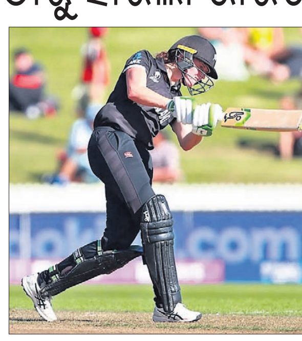
ଅର୍ଦ୍ଧଶତକୀୟ ଲନିଂସ ଅବସରରେ ଆମି ସାତର୍‌ପ୍ରେକ୍‌।

ଚଳିତ ଆଇସିସି ମହିଳା କ୍ରିକେଟ ବିଶ୍ୱକପ୍‌ର ଲିଗ୍ ପର୍ଯ୍ୟାୟରେ ଭାରତ ଏହାର ବିପକ୍ଷ ମ୍ୟାଚ ହାରିଯାଇଛି। ଭାରତକୁ ଟ୍ୱାଣ୍ଟିଲ୍ୟାଣ୍ଡ ୬୨ ରନରେ ପରାସ୍ତ କରିଛି। ଏହି ମ୍ୟାଚରେ ପ୍ରଥମେ ବ୍ୟାଟିଂ କରିଥିବା ଦୁ୍ୟଜିଲ୍ୟାଣ୍ଡ ୯ ଉଇକେଟ ବିନିମୟରେ ୨୬୦ ରନ କରିଥିଲା। ଭାରତ ୪୪.୪ ଓଭରରେ ୧୯୮ ରନ କରି ଅଲଆଉଟ ହୋଇଯାଇଥିଲା। ଦୁ୍ୟଜିଲ୍ୟାଣ୍ଡଠାରୁ ପରାସିତ ହେବା ପରେ ଭାରତ ୮ଟି ଦଳକୁ ନେଇ ଅନୁଷ୍ଠିତ ହେଉଥିବା ଏହି ଟୁର୍ନାମେଣ୍ଟର ପଏଣ୍ଟ ଟେବୁଲ୍‌ର