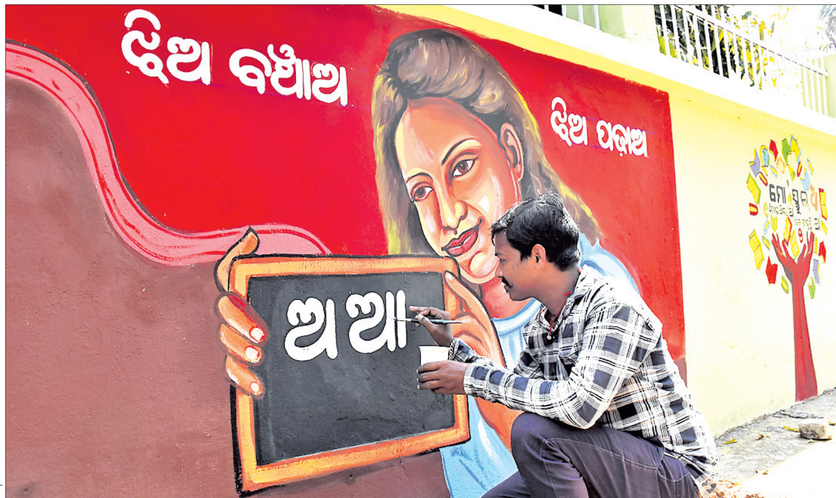
ଓଡ଼ିଶା ଶୁକ୍ରବାର ପାଳନ କରିଛି ଓଡ଼ିଆ ଶାସ୍ତ୍ରୀୟ ଭାଷା ଦିବସ: ଭୁବନେଶ୍ୱର ଯୁନିଟ୍-୩ ଭାଗ ଭୋଇ ଦୁଷ୍ଟହୀନ ବିଦ୍ୟାଳୟ କାନ୍ଥରେ ଜଣେ ଚିତ୍ରକର ଓଡ଼ିଆ ଭାଷାର ଆଦ୍ୟ ଅକ୍ଷରକୁ ଆଙ୍କିଛନ୍ତି।