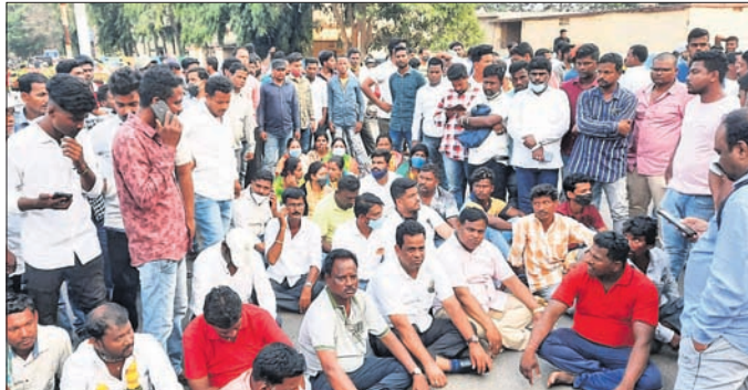
ଜିଲାପାଳଙ୍କ ବଙ୍ଗଳା ଆଗରେ ଧାରଣା ଦିଆଯାଇଛି ।

■ ୬ ସମିତିସଭାଙ୍କୁ କରୋନା କହି ନିର୍ବାଚନ ବାଟିଲ ■ ପ୍ରତିବାଦରେ ଜିଲାପାଳଙ୍କ ବଙ୍ଗଳା ଆଗରେ ଧାରଣା