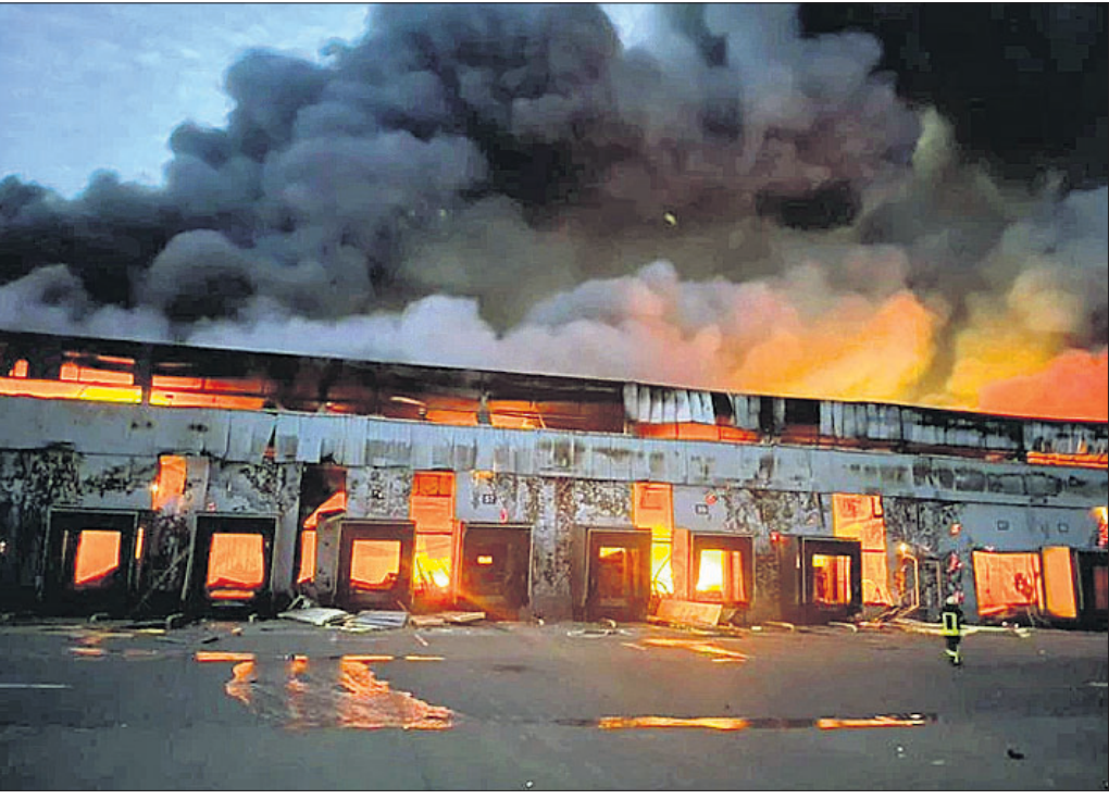
ରୁଷିଆର ମୋର୍ଟାର ମାଡ଼ରେ ଯୁଦ୍ଧେତ୍ତର ଟ୍ରୋଭାରା ଜିଲ୍ଲାରେ ଥିବା ଏକ ଖାଦ୍ୟ ଗୋଦାମ୍ ଜଳୁଛି।

ଟ୍ୟାଙ୍କ, ମିଶାଲ, ବୋମା, ଏୟାରକ୍ରାଫ୍ଟରେ ଲଢ଼େଇ ପରେ ଏବେ ଯୁଦ୍ଧ ପ୍ରଭାବିତ ଯୁଦ୍ଧେତ୍ତର ଉପରେ ରାସ୍ତାୟନିକ ଏବଂ ଜୈବିକ ଅସ୍ତ୍ର ବିପଦ ଘନେଇଛି। ଯୁଦ୍ଧେତ୍ତର ଆମେରିକା ବାୟୋଲୋଜିକାଲ ଓ କେମିକାଲ ଅସ୍ତ୍ର ପ୍ରସ୍ତୁତ କରୁଥିବା ରୁଷିଆ ଅଭିଯୋଗ ଆଣିଛି। ସେପତେ ଯୁଦ୍ଧେତ୍ତର ରୁଷିଆ ଏହି ଘାତକ ଡ୍ରିପ୍ ପ୍ରୟୋଗ କରିବାକୁ ଯାଉଛି ବୋଲି ଆମେରିକା କହିଛି। ଯଦି ରୁଷିଆ ଏପରି କରେ ତେବେ ଏହାର ଭୟଙ୍କର ପରିଣତି ଭୋଗିବ ବୋଲି ଆମେରିକା ରାଷ୍ଟ୍ରପତି ଜୋ ବାଇଡେନ୍ ଚେତାବନା ଦେଇଛନ୍ତି। ରୁଷିଆ କାଟିସଂଘକୁ ଭୁଲ୍ ତଥ୍ୟ ଦେଉଥିବା ଖ୍ରୀଷ୍ଟିଆନ୍ ଅଭିଯୋଗ କରିଛି। ଅପରପକ୍ଷେ ଯୁଦ୍ଧେତ୍ତର ପଶ୍ଚିମ ଯୁଦ୍ଧେତ୍ତର ପାଇଁ ମସ୍କୋ ପକ୍ଷରୁ ମାଧ୍ୟ ଯୋଗାଯାଉଥିବା ଜଣାପଡ଼ିଛି। କେତେକ ସୈନ୍ୟକ ନିକଟରୁ ଯୁଦ୍ଧେତ୍ତର ସେନା ଏଭଳି ମାଧ୍ୟ ଜବତ କରିବା ପରେ ସେଠାରେ ସାଧାରଣ ନାଗରିକଙ୍କ ସୁରକ୍ଷାକୁ ନେଇ ଚିନ୍ତା ବଢ଼ିଛି। ଯୁଦ୍ଧେତ୍ତର ଆମେରିକା ଜୈବିକ ଅସ୍ତ୍ର ବିକଶିତ କରୁଥିବା ନେଇ ରୁଷିଆ କାଟିସଂଘ ନିକଟରେ ଅଭିଯୋଗ କରିଥିଲା। ଏହି ପ୍ରସଙ୍ଗରେ ଶୁକ୍ରବାର କାଟିସଂଘ ସୁରକ୍ଷା ପରିଷଦ (ୟୁଏନ୍ଏସ୍ସି)ର କରୁରୀ ଦୈନିକ ବସିଥିଲା। କିନ୍ତୁ କାଟିସଂଘରେ ମସ୍କୋର ଅଭିଯୋଗ ଖାରଜ ହୋଇଛି। ଯୁଦ୍ଧେତ୍ତର ରୁଷିଆ ସାଧାରଣ