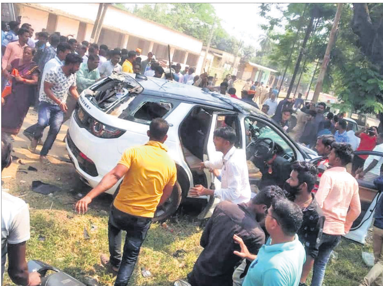
ଉତ୍ତମ ଲୋକେ ବିଧାୟକଙ୍କ ଗାଡ଼ିକୁ ଭଙ୍ଗାଗୁଣ୍ଡା କରୁଛନ୍ତି ।