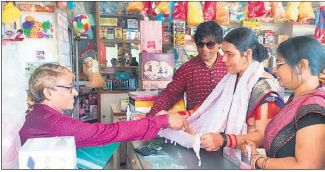
ସ୍ଵାଧୀନ ପ୍ରାର୍ଥନା ପତେଳ ପ୍ରଚାର କରିବା ସହ ଭିକ୍ଷା ମାଗୁଛନ୍ତି ।

ସୁନ୍ଦରଗଡ଼, ୧୨ ମାର୍ଚ୍ଚ (ଡି.ଏନ.ଏ.) ପୌର ନିର୍ବାଚନ ପାଇଁ ସୁନ୍ଦରଗଡ଼ରେ ପତେଳ ପ୍ରାର୍ଥନା ପ୍ରାର୍ଥୀମାନଙ୍କର ପ୍ରଚାର ଜରିଆ ଆରମ୍ଭ କଲାଣି । ପୌର ନିର୍ବାଚନ ପଦବୀ ସମେତ ୧୯ଟି ଖର୍ଚ୍ଚ ପ୍ରାର୍ଥୀମାନେ ଘରକୁ ଘର ବୁଲି