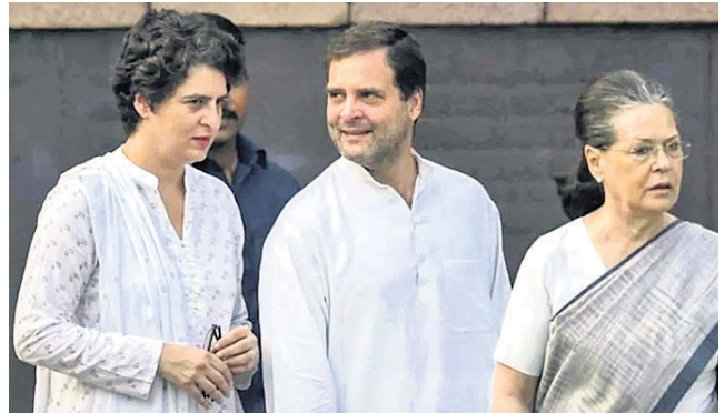
ପ୍ରିୟଙ୍କା, ରାହୁଲ ଓ କଂଗ୍ରେସ ଅଧ୍ୟକ୍ଷା ସୋନିଆ ଗାନ୍ଧୀ ।

ପାଞ୍ଚ ରାଜ୍ୟ ନିର୍ବାଚନରେ କଂଗ୍ରେସର ନୈରାଶ୍ୟଜନକ ପ୍ରଦର୍ଶନ ପରେ ରବିବାର ଅପରାହ୍ଣରେ ଦଳର କାର୍ଯ୍ୟକାରୀ କମିଟି (ସିଡକ୍ସି) ବୈଠକ ଅନୁଷ୍ଠିତ ହେବାକୁ ଯାଉଛି । ଦଳର ପରାଜୟ ପାଇଁ ନୈତିକତା ଦୃଷ୍ଟିରୁ ନିଜକୁ ଦାୟୀ କରି କଂଗ୍ରେସ ଅଧ୍ୟକ୍ଷା ସୋନିଆ ଗାନ୍ଧୀ, ବରିଷ୍ଠ ନେତା ରାହୁଲ ଗାନ୍ଧୀ ଏବଂ ଉତ୍ତରପ୍ରଦେଶରେ ନିର୍ବାଚନ ପ୍ରଚାରର ମଙ୍ଗ ଧରିଥିବା ସାଧାରଣ ସମ୍ପାଦକ ପ୍ରିୟଙ୍କା ଗାନ୍ଧୀ ଉଦ୍ଧୃତ ବୈଠକରେ ଇସ୍ତଫା ପ୍ରସ୍ତାବ ଦେଇପାରନ୍ତି ବୋଲି ଏକ ସୂତ୍ରରୁ ଜଣାପଡ଼ିଛି । ତେବେ ଦଳ ପକ୍ଷରୁ ଏହାକୁ ଖଣ୍ଡନ କରାଯାଇଛି । ଗାନ୍ଧୀ ପରିବାର ଇସ୍ତଫା ଦେବା ଚର୍ଚ୍ଚା ସମ୍ପୂର୍ଣ୍ଣ ଭୁଲ୍ ଓ ଭିତ୍ତିହୀନ ବୋଲି କଂଗ୍ରେସ ମୁଖ୍ୟପାତ୍ର ରଣଦୀପ୍ ସୁରକ୍ଷିତ କହିଛନ୍ତି । ସୋନିଆ ଓ ରାହୁଲ ଇସ୍ତଫା ପ୍ରସ୍ତାବ ଦେବା ନୂଆ ନୁହେଁ । ପୂର୍ବରୁ ସେମାନଙ୍କ ଇସ୍ତଫା ପ୍ରସ୍ତାବକୁ ସିଡକ୍ସି ସମାପ୍ତ କରିବା ସହ ଗାନ୍ଧୀ ପରିବାର ପ୍ରତି ପୁନଃ ସମର୍ଥନ ଜଣାଇଆସିଛି । ଏଥର ବୈଠକକୁ ୫୬ ଜଣ ଗ୍ଲାୟା ଓ ସ୍ଵତନ୍ତ୍ର ନିମନ୍ତ୍ରିତ ସଦସ୍ୟଙ୍କୁ ଡକାଯାଇଛି । କେତେକଙ୍କ ସିଡକ୍ସି ସଦସ୍ୟ ନେତୃତ୍ଵରେ ପରିବର୍ତ୍ତନ ପାଇଁ ଦାବି କରିପାରନ୍ତି ବୋଲି କୁହାଯାଉଛି । ଏଥର ସ୍ଥିତି ଭିନ୍ନ ବୋଲି ଗାନ୍ଧୀ ପରିବାର ଅନୁଭବ କରୁଛନ୍ତି । ସେମାନଙ୍କ