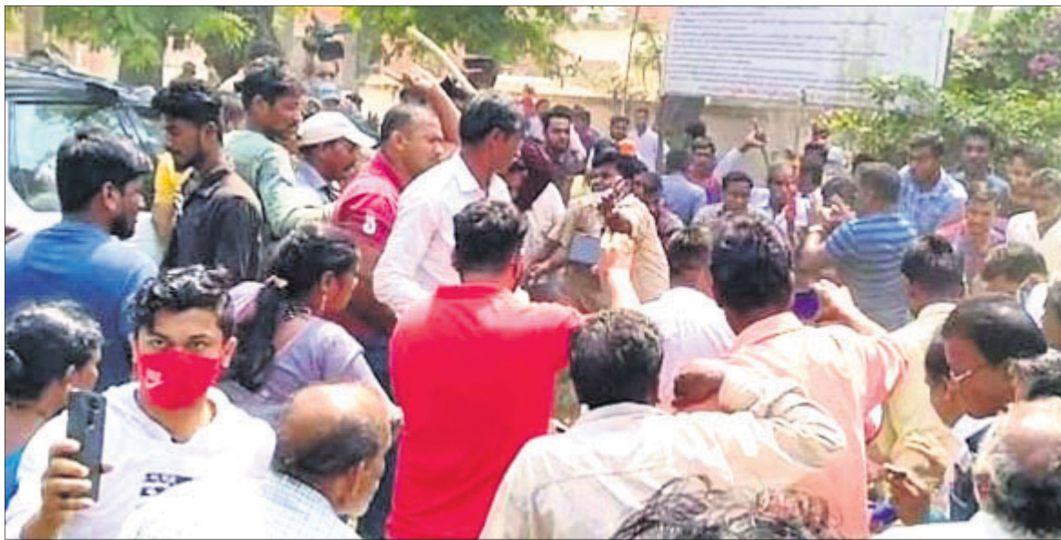
ଘଟଣାସ୍ଥଳରେ ଉତ୍ତମ ଲୋକେ ।

ଖୋର୍ଦ୍ଧା ଅଫିସ, ୧୨/୩: ବାଣପୁର ଏନ୍ଏସରେ ମଧ୍ୟ ୧୪୪ଧାରା ଲାଗୁ କରାଯାଇଛି । ଖୋର୍ଦ୍ଧା ଉପଜିଲ୍ଲାପାଳ ଆଇ.ଗୌରବ ଶିବାଜୀ ଏହି କଟକଣା ଲାଗୁ କରିଛନ୍ତି । ପରିସ୍ଥିତି ନିୟନ୍ତ୍ରଣକୁ ନ ଆସିବା ପର୍ଯ୍ୟନ୍ତ ଏହି ଧାରା ବଳବତ୍ତର ରହିବ । ଆଇନଶୁଖିଲା ଦୃଷ୍ଟିରୁ ଏହି ନିଷ୍ପତ୍ତି ନିଆଯାଇଥିବା ପ୍ରଶ୍ନ ସୂଚନା ଦିଆଯାଇଛି ।