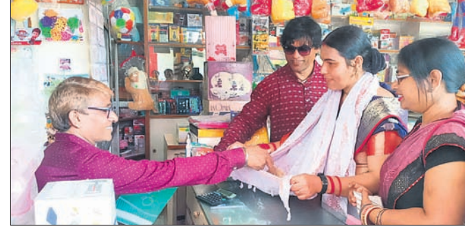
ସ୍ଵାଧୀନ ପ୍ରାର୍ଥନା ନିମିତ୍ତ ପଚେଳ ପ୍ରଚାର କରିବା ସହ ଭିକ୍ଷା ମାଗୁଛନ୍ତି।

ସୁନ୍ଦରଗଡ଼, ୧୨୩୩ (ଡି.ଏନ.ଏ.) ପୌର ନିର୍ବାଚନ ପାଇଁ ସୁନ୍ଦରଗଡ଼ରେ ପଚେଳ ପ୍ରାର୍ଥନା ପ୍ରାର୍ଥୀମାନଙ୍କର