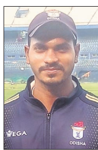
ପ୍ରଶାନ୍ତ ହେଉଛନ୍ତି ଏମିତି ଜଣେ ରଣା କ୍ରିକେଟର, ଯିଏ ଓଡ଼ିଶା ପାଇଁ କୌଣସି କ୍ଲବ୍‌ରେ କ୍ରିକେଟ୍ ମ୍ୟାଚ୍ ଖେଳିନାହାନ୍ତି।