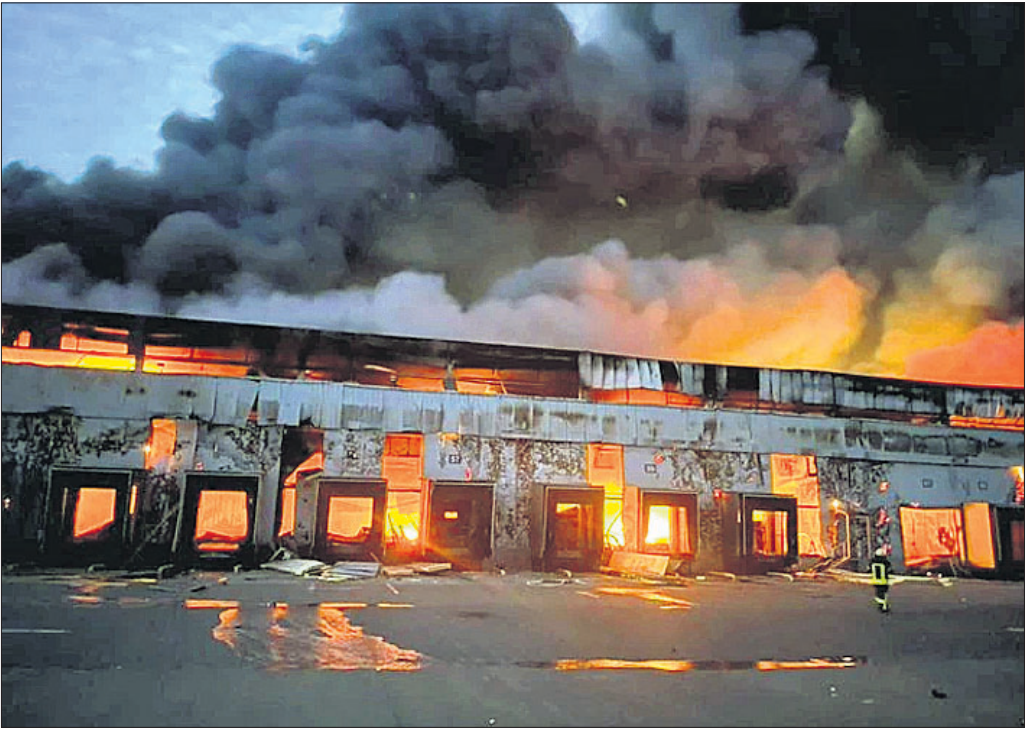
ରୁଷିଆର ମୋର୍ଟାର ମାଡ଼ରେ ସୁକ୍ରେନ୍‌ରେ ବ୍ରୋଭାରା ଜିଲ୍ଲାରେ ଥିବା ଏକ ଖାଦ୍ୟ ଗୋଦାମ ଜଳୁଛି।

ଟ୍ୟାକ୍, ମିଶାଲ, ବୋମା, ଏୟାରକ୍ରାଫ୍ଟରେ ଲଢ଼େଇ ପରେ ଏବେ ସୁଦ୍ଧା ପ୍ରଭାବିତ ସୁକ୍ରେନ୍ ଉପରେ ରାସ୍ତାୟନିକ ଏବଂ ଜୈବିକ ଅସ୍ତ୍ର ବିପଦ ଘନେଇଛି। ସୁକ୍ରେନ୍‌ରେ ଆମେରିକା ବାୟୋଲୋଜିକାଲ ଓ କେମିକାଲ ଅସ୍ତ୍ର ପ୍ରସ୍ତୁତ କରୁଥିବା ରୁଷିଆ ଅଭିଯୋଗ ଆଣିଛି। ସେପଟେ ସୁକ୍ରେନ୍‌ରେ ରୁଷିଆ ଏହି ଘାତକ ଡ୍ରାଏନ୍ ପ୍ରୟୋଗ କରିବାକୁ ଯାଉଛି ବୋଲି ଆମେରିକା କହିଛି। ଯଦି ରୁଷିଆ ଏପରି କରେ ତେବେ ଏହାର ଭୟଙ୍କର ପରିଣତି ଭୋଗିବ ବୋଲି ଆମେରିକା ରାଷ୍ଟ୍ରପତି ଜୋ ବାଇଡେନ୍ ଚେତାବନା ଦେଇଛନ୍ତି। ରୁଷିଆ କାଟିସଂଘକୁ ତଥ୍ୟ ଦେଉଥିବା ଖ୍ରୀଷ୍ଟିୟ ଅଭିଯୋଗ କରିଛି। ଅପରପକ୍ଷେ ସୁକ୍ରେନ୍‌ରେ ପଶିଥିବା ରୁଷିୟ ସୈନ୍ୟଙ୍କ ପାଇଁ ମଧ୍ୟେ ପକ୍ଷରୁ ଗ୍ୟାସ୍ ମାଧ୍ୟମରେ ଯୋଗାଯାଇଥିବା ଜଣାପଡ଼ିଛି। କେତେଜଣ ସୈନ୍ୟଙ୍କ ନିକଟରୁ ସୁକ୍ରେନ୍ ସେନା ଏଭଳି ମାଧ୍ୟମ ଜବତ କରିବା ପରେ ସେଠାରେ ସାଧାରଣ ନାଗରିକଙ୍କ ସୁରକ୍ଷାକୁ ନେଇ ଚିନ୍ତା ବଢ଼ିଛି। ସୁକ୍ରେନ୍‌ରେ ଆମେରିକା ଜୈବିକ ଅସ୍ତ୍ର ବିକଶିତ କରୁଥିବା ନେଇ ରୁଷିଆ କାଟିସଂଘ ନିକଟରେ ଅଭିଯୋଗ କରିଥିଲା। ଏହି ପ୍ରସଙ୍ଗରେ ଶୁକ୍ରବାର କାଟିସଂଘ ସୁରକ୍ଷା ପରିଷଦ (ସୁଏନ୍‌ସି)ର କରୁରୀ ବୈଠକ ବସିଥିଲା। କିନ୍ତୁ କାଟିସଂଘରେ ମଧ୍ୟେର ଅଭିଯୋଗ ଖାରଜ ହୋଇଛି। ସୁକ୍ରେନ୍‌ରେ ରୁଷିଆ ସାଧାରଣ