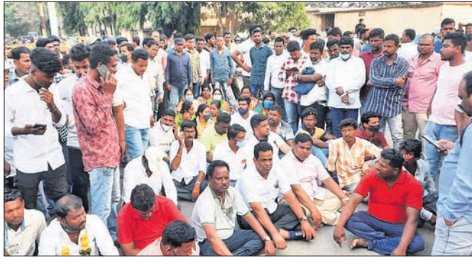
ଜିଲାପାଳଙ୍କ ବଙ୍ଗଳା ଆଗରେ ଧାରଣା ଦିଆଯାଇଛି।

■ ୬ ସମିତିସଭାକୁ କରୋନା କହି ନିର୍ବାଚନ ବାଟିଲ ■ ପ୍ରତିବାଦରେ ଜିଲାପାଳଙ୍କ ବଙ୍ଗଳା ଆଗରେ ଧାରଣା ଛତ୍ରପୁର, ୧୨୩୩ (ଡି.ଏନ.ଏ.)