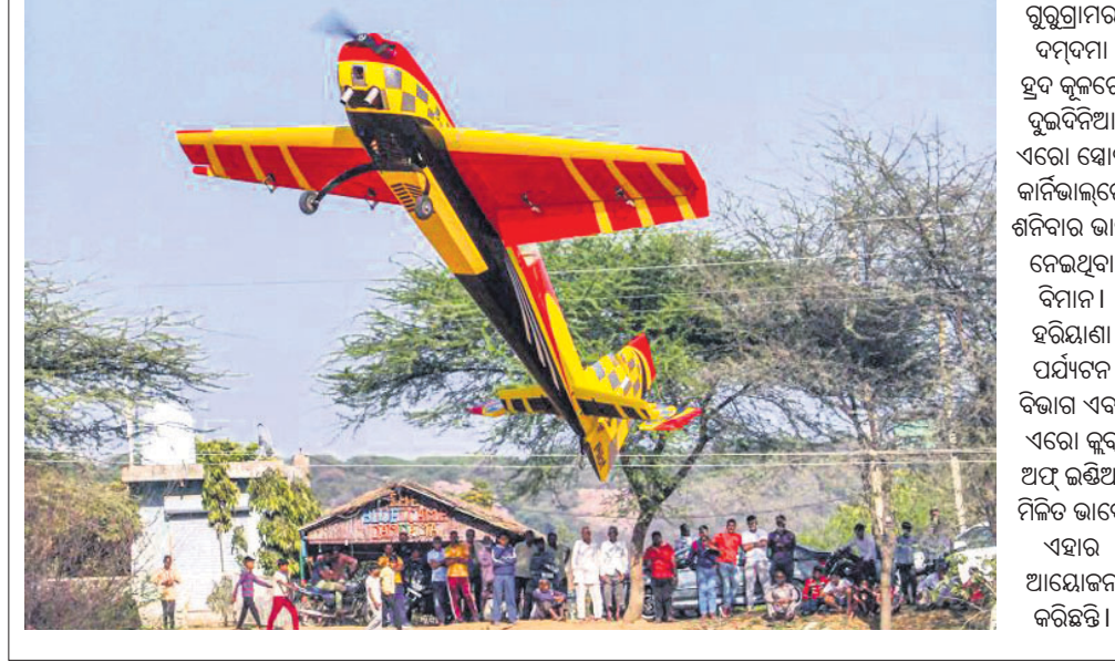
ରୁଷିଆର ଦମ୍‌ଦମା ହୃଦୟରେ ବୁଲିବିନିଆ ଏବେ ସ୍ୱେପ୍ କାର୍ଯ୍ୟକଳାରେ ଶନିବାର ଭାଗ ନେଇଥିବା ବିମାନ। ହରିୟାଣା ପର୍ଯ୍ୟନ୍ତ ବିଭାଗ ଏବଂ ଏବେ କୁର୍ ଅର୍ ଲକ୍ଷିଆ ମିଳିତ ଭାବେ ଆୟୋଜନ କରିଛନ୍ତି।