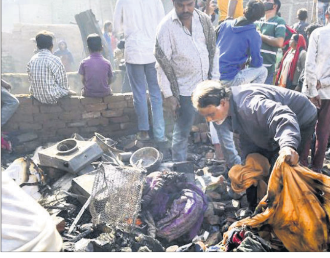
ଜଣେ ବସ୍ତିବାସିନ୍ଦା ଜଳି ଯାଇଥିବା ଘରୁ ଆସିବାବସ୍ତୁ ସଂଗ୍ରହ କରୁଛନ୍ତି। ଲକ୍ଷ ଟଙ୍କା ଅନୁକମ୍ପାନୁକ୍ତ ସହାୟତା ଦେଖାଯାଇଛି। ସେହିପରି ମୃତ ଯୋଗାଇଦେବାକୁ କେଜ୍‌ରିୱାଲ ଶିଶୁଙ୍କ ପରିବାରକୁ ୫ ଲକ୍ଷ ଏବଂ