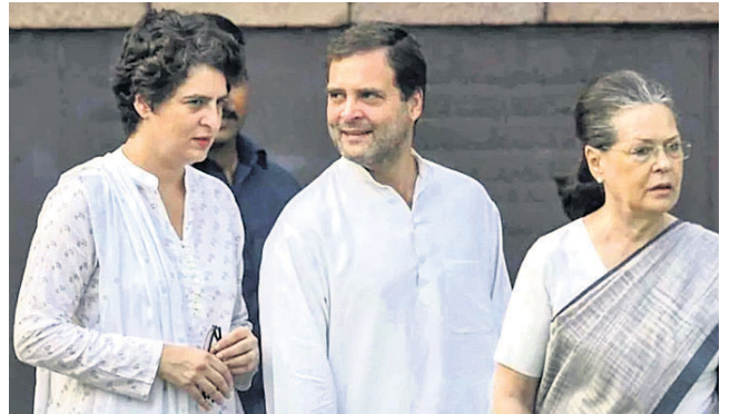
ପ୍ରିୟଙ୍କା, ରାହୁଲ ଓ କଂଗ୍ରେସ ଅଧ୍ୟକ୍ଷା ସୋନିଆ ଗାନ୍ଧୀ।

ପାଞ୍ଚ ରାଜ୍ୟ ନିର୍ବାଚନରେ କଂଗ୍ରେସର ନୈରାଶ୍ୟଜନକ ପ୍ରଦର୍ଶନ ପରେ ରବିବାର ଅପରାହ୍ଣରେ ଦଳର କାର୍ଯ୍ୟକାରୀ କମିଟି (ସିଡ୍‌କ୍ୟୁସି) ବୈଠକ ଅନୁଷ୍ଠିତ ହେବାକୁ ଯାଉଛି। ଦଳର ପରାଜୟ ପାଇଁ ନୈତିକତା ଦୃଷ୍ଟିରୁ ନିଜକୁ ଦାୟୀ କରି କଂଗ୍ରେସ ଅଧ୍ୟକ୍ଷା ସୋନିଆ ଗାନ୍ଧୀ, ବରିଷ୍ଠ ନେତା ରାହୁଲ ଗାନ୍ଧୀ ଏବଂ ଉତ୍ତରପ୍ରଦେଶରେ ନିର୍ବାଚନ ପ୍ରଚାରର ମଙ୍ଗ ଧରିଥିବା ସାଧାରଣ ସମ୍ପାଦକ ପ୍ରିୟଙ୍କା ଗାନ୍ଧୀ ଉଦ୍ଧୃତ ବୈଠକରେ ଇସ୍ତଫା ପ୍ରସ୍ତାବ ଦେଇପାରନ୍ତି ବୋଲି ଏକ ସୂତ୍ରରୁ ଜଣାପଡ଼ିଛି। ତେବେ ଦଳ ପକ୍ଷରୁ ଏହାକୁ ଖଣ୍ଡନ କରାଯାଇଛି। ଗାନ୍ଧୀ ପରିବାର ଇସ୍ତଫା ଦେବା ଚର୍ଚ୍ଚା ସମ୍ପୂର୍ଣ୍ଣ ଭୁଲ୍ ଓ ଭିତ୍ତିହୀନ ବୋଲି କଂଗ୍ରେସ ମୁଖ୍ୟପାତ୍ର ରଣଦୀପ୍ ସୁରଜେଫାଲ୍ କହିଛନ୍ତି। ସୋନିଆ ଓ ରାହୁଲ ଇସ୍ତଫା ପ୍ରସ୍ତାବ ଦେବା ନୂଆ ନୁହେଁ। ପୂର୍ବରୁ ସେମାନଙ୍କ ଇସ୍ତଫା ପ୍ରସ୍ତାବକୁ ସିଡ୍‌କ୍ୟୁସି ଅଗ୍ରାହ୍ୟ କରିବା ସହ ଗାନ୍ଧୀ ପରିବାର ପ୍ରତି ପୁନଃ ସମର୍ଥନ ଜଣାଇଆସିଛି। ଏଥର ବୈଠକକୁ ୫୬ ଜଣ ଗ୍ଲାଇଓ ଓ କ୍ଷତ୍ରଜ ନିମନ୍ତ୍ରିତ ସଦସ୍ୟଙ୍କୁ ଡକାଯାଇଛି। କେତେକଙ୍କ ସିଡ୍‌କ୍ୟୁସି ସଦସ୍ୟ ନେତୃତ୍ଵରେ ପରିବର୍ତ୍ତନ ପାଇଁ ଦାବି କରିପାରନ୍ତି ବୋଲି କୁହାଯାଉଛି। ଏଥର ସ୍ଥିତି ଭିନ୍ନ ବୋଲି ଗାନ୍ଧୀ ପରିବାର ଅନୁଭବ କରୁଛନ୍ତି। ସେମାନଙ୍କ