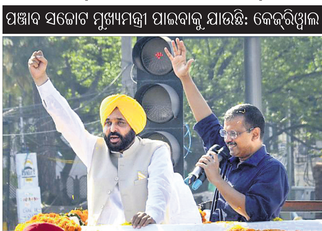
ପଞ୍ଚାବ ଅନୁସରରେ ରବିବାର ଦିଲ୍ଲୀ ମୁଖ୍ୟମନ୍ତ୍ରୀ ଅରବିନ୍ଦ କେନ୍ଦ୍ରାପଡ଼ା ଓ ଭଗଞ୍ଜଳ ପାନ୍ଙ୍କ ରୋଡ୍ ଶୋ'।

ଅନୁସର, ୧୩ମାର୍ଚ୍ଚ(ପି.ବି.) କରୁବର୍ଷ ପରେ ପଞ୍ଚାବ ଜଣେ ସଙ୍ଗେ ମୁଖ୍ୟମନ୍ତ୍ରୀ ପାଇବାକୁ ଯାଉଥିବା ଆମ ଆଦମା ପାର୍ଟି (ଏଏପି) ରାଷ୍ଟ୍ରୀୟ ଆବାହକ ଅରବିନ୍ଦ କେନ୍ଦ୍ରାପଡ଼ା ରବିବାର କହିଛନ୍ତି। ତାଙ୍କ ଦଳ ପଞ୍ଚାବକୁ ଏକ ସଙ୍ଗେ ସରକାର ଦେବ ବୋଲି ଦିଲ୍ଲୀ ମୁଖ୍ୟମନ୍ତ୍ରୀ ପ୍ରତିଶ୍ରୁତି ଦେଇଛନ୍ତି। ବିଧାନସଭା ନିର୍ବାଚନରେ ବିପ୍ଳବ ବିଜୟ ପାଇଁ ଭୋଟରଙ୍କୁ ଧନ୍ୟବାଦ ଜଣାଇବା ନିମନ୍ତେ କେନ୍ଦ୍ରାପଡ଼ା ଏବଂ ପଞ୍ଚାବର ଭାଗ ମୁଖ୍ୟମନ୍ତ୍ରୀ ଭଗଞ୍ଜଳ ପାନ୍ଙ୍କ ନେତୃତ୍ୱରେ ଅନୁସରରେ ବିଶାଳ ରୋଡ୍ ଶୋ' ଆୟୋଜନ କରାଯାଇଥିଲା। ଏଥିରେ ନବନିର୍ବାଚିତ ଏଏପି ବିଧାୟକ ଏବଂ ଦଳୀୟ ସମର୍ଥକମାନେ ଭାଗ ନେଇଥିଲେ। କଟକର ଚୌକକୁ ରୋଡ୍ ଶୋ' ଆରମ୍ଭ ହୋଇଥିଲା। ୧୧୭ ଆସନ ବିଶିଷ୍ଟ ପଞ୍ଚାବ ବିଧାନସଭା ନିର୍ବାଚନରେ ଏଏପି ୯୨ ଆସନରେ ବିଜୟ ହୋଇ ନିରଙ୍କୁଶ ସଂଖ୍ୟାଗରିଷ୍ଠତା ହାସଲ କରିଛି। ଭୋଟରଙ୍କୁ ଧନ୍ୟବାଦ ଜଣାଇବା ଅବସରରେ ପଞ୍ଚାବକୁ ଭଲ ପାଏ ବୋଲି କେନ୍ଦ୍ରାପଡ଼ା କହିଛନ୍ତି। ରାଜ୍ୟରେ ଏକ