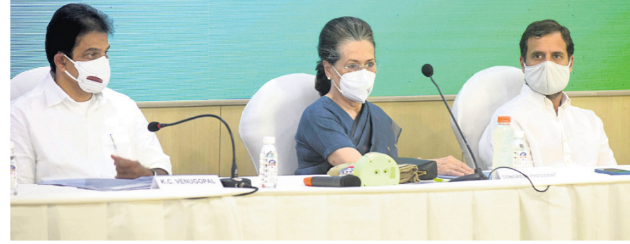
ଭୁବନେଶ୍ୱର, ୧୩/୩ (ବ୍ୟବହାର): ଅର୍ଥତତ୍ତ୍ୱ ଚିନ୍ତାଧାରା ପ୍ରତିଷ୍ଠାପନା...