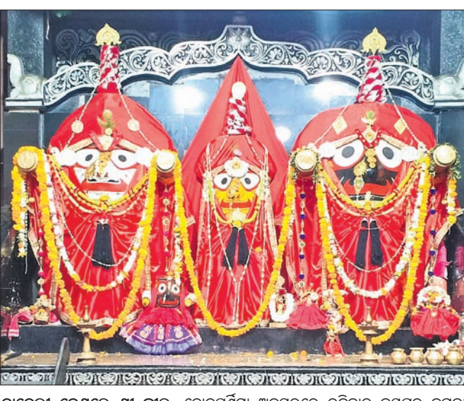
ଚାତରା ବେଶରେ ଶ୍ରୀ ଜୀଉ: ଦୋଳପୂର୍ଣ୍ଣିମା ଅବସରରେ ରବିବାର କନ୍ୟାପୁର ଜଗନ୍ନାଥ ମନ୍ଦିରରେ ଶ୍ରୀଗୀତ ଚାତରା ବେଶରେ ଶ୍ରୀଗୀତଙ୍କୁ ବର୍ଣ୍ଣନା ଦେଇଛନ୍ତି।