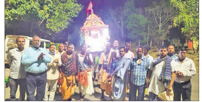
ଶ୍ରୀ ଜୀଉଙ୍କୁ ନଗର ପରିକ୍ରମା କରାଯାଇଛି।