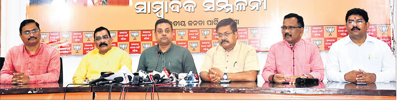
ଖବରଦାତା ସମ୍ମିଳନୀରେ ଭାରତୀୟ ରାଷ୍ଟ୍ରୀୟ ପ୍ରବନ୍ଧା ସମିତ ପାତ୍ର ଓ ଅନ୍ୟ ନେତୃତ୍ୱ।

ସ୍ୱାଭିମାନ ଅଞ୍ଚଳ ବଡ଼ପଡ଼ାର ଦେବାଶିଷ ପାଠିକ୍ର ବିବାହ କରିଥିଲେ। ସେ ସ୍ୱାଭିମାନ ଅଞ୍ଚଳର ମହିଳାମାନଙ୍କୁ ଏକକ୍ରମ କରିବା ସହ ସ୍ୱୟଂ ସହାୟକ ଗୋଷ୍ଠୀ ଗଠନ କରି ସମାଜସେବା ଆରମ୍ଭ କରିଥିଲେ। ମିଶନ ଶକ୍ତି ମାଧ୍ୟମରେ ମହିଳାମାନେ ଅଧିକ ତାଲିମ ପାଇ କିପରି ହଳଦୀ, ଅଦା, ସିଲେଇ ଶିଖା, ମାଛ ଚାଷ, ଛତୁ ଚାଷ ଏବଂ ପରିବା ଚାଷ କରି ସ୍ୱାବଲମ୍ବୀ ହେବେ ସେ ସମ୍ପର୍କରେ ସେ ଜିଲ୍ଲା ପ୍ରଶାସନ ସହ ଯୋଗାଯୋଗ କରି ସମସ୍ତ ପଦକ୍ଷେପ ନେଇଥିଲେ। ବିଦ୍ୟାଳୟରେ ଉଚ୍ଚ