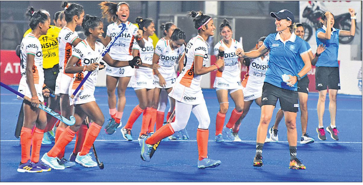
ଏଫଆଇଏଚ୍ ପ୍ରୋ ଲିଗରେ ରବିବାର ଜର୍ମାନୀକୁ ଶୁଭାଧାର ୩-୦ ଗୋଲରେ ହରାଇବା ପରେ ଭାରତୀୟ ମହିଳା ହକି ଦଳ ଖୁସି ପୂର୍ଣ୍ଣରେ ।