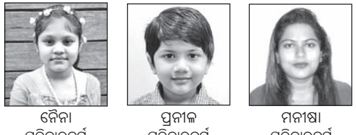
ବୈନା ପରିବାରବର୍ଗ, ପ୍ରଦୀପ ପରିବାରବର୍ଗ, ମନୀଷା ପରିବାରବର୍ଗ