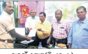
ଡାକ୍ତରୀ, ୧୩ମା (ପି.ଏନ୍.ଏ.)

ସମାଧାନ ଦାବି ଦାବିପତ୍ର ଦେଲେ ଅଧିକାରୀ ସରକାରୀ କର୍ମଚାରୀ