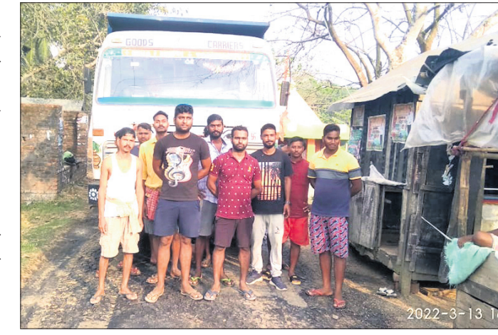
ଗ୍ରାମବାସୀ ରାସ୍ତା କାମକୁ ବନ୍ଦ କରୁଛନ୍ତି।

ନାଉରୀ ବୁକ ଅର୍ଗନାଇଜିଂ ସଂସ୍ଥାରେ ଉପକୂଳରେ ଉପକୂଳରେ ସଂଯୋଗକରଣ ରାସ୍ତା ରହିଛି। ଏହି ରାସ୍ତାଟି ଦୀର୍ଘଦିନ ହେବ ନିର୍ମାଣ ହୋଇଥିବା ବେଳେ ବିପର୍ଯ୍ୟୟ ଅବସ୍ଥାରେ ରହିଛି।