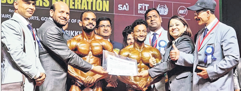
ଫେଡେରେଶନ କମ୍ପ୍ୟୁଟର ସ୍ୱାସ୍ଥ୍ୟରେ ରନର୍ସଅପ୍ ହୋଇଥିବା ଓଡ଼ିଶା ଦଳର ପ୍ରତିଯୋଗୀ ପୁରୁଷାର ଗ୍ରହଣ କରୁଛନ୍ତି।