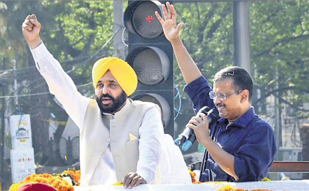
ପଞ୍ଚାବ ଅନୁସରରେ ରବିବାର ଦିଲ୍ଲୀ ମୁଖ୍ୟମନ୍ତ୍ରୀ ଅରବିନ୍ଦ କେନ୍ଦ୍ରୀୟ ଓ ଭଗଞ୍ଜ ପାନ୍ଦ୍ ରୋଡ୍ ଶୋ' ।