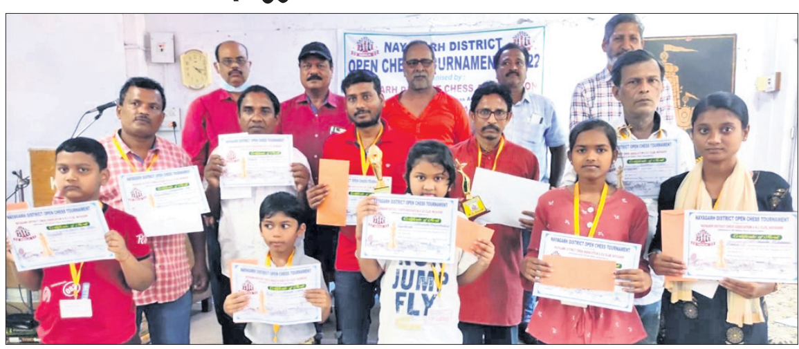
ଅତିଥିକ ଗହଣରେ ଚେସ୍ ଚୁର୍ନାମେଣ୍ଟର କୃତୀ ପ୍ରତିଯୋଗୀ ।

ନୟାଗଡ଼ ଅଫିସ, ୧୩୩୩ : ନୟାଗଡ଼ର ଓପନ ଚେସ୍ ଚୁର୍ନାମେଣ୍ଟ ପ୍ରତିଯୋଗୀ ଓପନ ଚେସ୍ ଚୁର୍ନାମେଣ୍ଟ ପ୍ରତିଯୋଗୀ ଓପନ ଚେସ୍ ଚୁର୍ନାମେଣ୍ଟ ପ୍ରତିଯୋଗୀ ଓପନ ଚେସ୍ ଚୁର୍ନାମେଣ୍ଟ ପ୍ରତିଯୋଗୀ