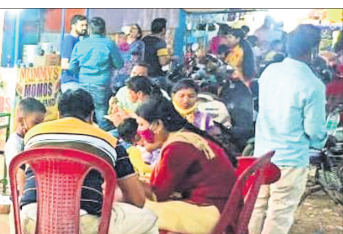
ବ୍ୟାସନଗର ସହରର ଏକ ପାଖୁ ଫୁଡ୍ ବୋକାଳ ଆଗରେ ଲୋକଙ୍କ ଭିଡ଼ ଜମିଛି।

ସହରର ବଡ଼ ହୋଟେଲ, ରେଷ୍ଟୋରାଣ୍ଟ, ଭାବା, ଖୁସୁଟିହୋଟେଲ, ଜଳଖିଆ ବୋକାଳ, ରୁସ୍ତୁୟୁ, ଚାଟ ଆଦି ଖାଦ୍ୟପଦାର୍ଥକୁ ବିନା ଦ୍ୱିଧାରେ ଦୈନିକ ହଜାର ହଜାର ଲୋକ ଖାଇଥାନ୍ତି। ହେଲେ ଭେଜାଲ ଖାଦ୍ୟ ସାମଗ୍ରୀ ଉପରେ ଅଙ୍କୁଶ ଲଗାଇବା ପାଇଁ କୌଣସି ବ୍ୟବସ୍ଥା ନାହିଁ। ସାନ୍ଧ୍ୟ ବିଭାଗ ଏଥିପ୍ରତି ଯତ୍ନଶୀଳ ହୁଅନ୍ତୁ। ୧ ବର୍ଷ ମଧ୍ୟରେ ଜିଲ୍ଲାରେ ୧୧୨ ନମୁନା ସଂଗ୍ରହ କରାଯାଇଥିବାବେଳେ ୨୯ ମାମଲା ରୁଜୁ ହୋଇଛି। କୌଣସି ବ୍ୟବସାୟୀଙ୍କୁ ଦଣ୍ଡିତ କରାଯିବା ଭଳି ଦୃଷ୍ଟିକୋଣ ନାହିଁ। ଏହି ତଥ୍ୟକୁ ଅନୁଧ୍ୟାନ କଲେ ସାନ୍ଧ୍ୟ ବିଭାଗ ଖାଦ୍ୟ ସୁରକ୍ଷା ପ୍ରତିକେତେ ଯତ୍ନବାନ ତାହା ସହଜ ଅନୁମାନ କରିହେଉଛି। ଜିଲ୍ଲାର ଯାକପୁର ଗଊନ ସମେତ ବ୍ୟାସନଗର, ପାଣିକୋଇଲି, ଭାରକା, ଚଣ୍ଡିଖୋଲ, ବାନଗଦା, ବୁରୁରା, କାଳିଆପାଣି ଆଦି ସହରରେ ଖାଦ୍ୟ ଅପମିଶ୍ରଣ ବଢ଼ିବାରେ ଲାଗିଛି। ଏଭଳିସ୍ଥିତି ଜିଲ୍ଲାରେ କଣେ ମାତ୍ର ପୁତ୍ର ଉତ୍ତପେତ୍ର କାର୍ଯ୍ୟ କରୁଛନ୍ତି।