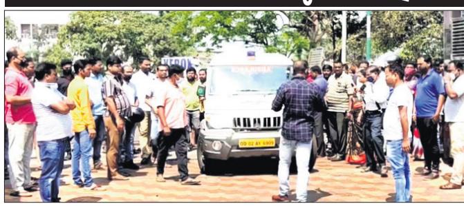
ପାରାଦୀପ ଯୋଗୁ ହସିଗଲ ଆଗରେ ମୃତଦେହ ରଖି ଧରଣୀ