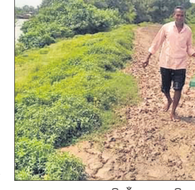
ମହାକାଳପଡ଼ା ବୁକ ଚାପାଳି ଗାଁକୁ ଥିବା ମାଟି ରାସ୍ତା।

କେନ୍ଦ୍ରାପଡ଼ା ଜିଲ୍ଲା ପଟ୍ଟାଭିଷେପ ବୁକ ଅଧିକାରୀଙ୍କୁ ନିର୍ଦ୍ଦେଶ ଦେବା ପାଇଁ ପଞ୍ଚାଳ କଣ୍ଠାଧାରଣରେ ପଞ୍ଚାଳ ଓ ଠିକା ନର୍ସିଙ୍କୁ ମଧ୍ୟରେ ଆଲୋଚନା ପରେ ସାମୟିକ ଭାବେ ଧରଣୀ ରହିଛି।