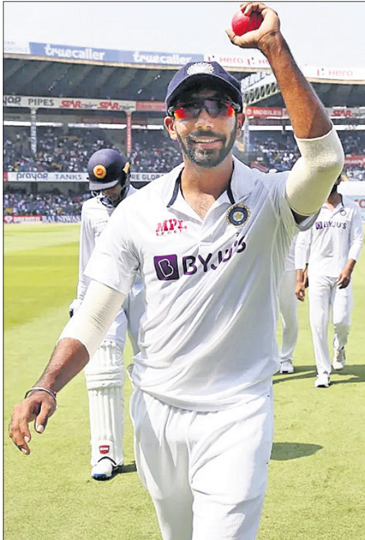
୫ ଉଇକେଟ ସଫଳତା ପରେ ବଲ୍ ସହ ଯଶପ୍ରାଢ଼ ବୁଫା।

ପ୍ରଥମ ଇନିଂସ ଅଗ୍ରଣୀ ହାସଲ କରିଥିବା ଭାରତ ଦ୍ୱିତୀୟ