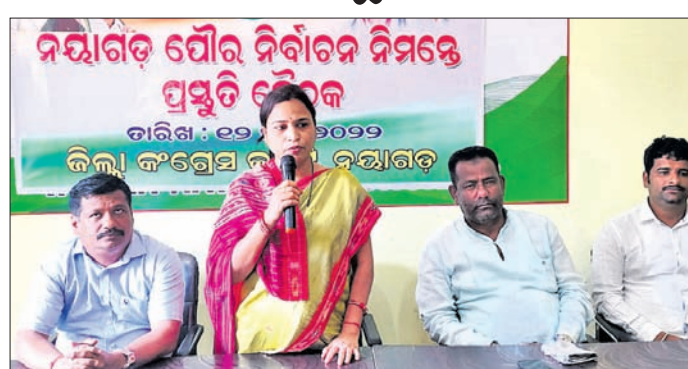
ପ୍ରସ୍ତୁତି ବୈଠକରେ କଂଗ୍ରେସ କର୍ମକର୍ମୀ ।

ନୟାଗଡ଼ ଅଫିସ, ୧୩୩୩ : ନୟାଗଡ଼ର ସୋହମ ଅନୁଷ୍ଠାନ ଓ ନେତାଜୀ ସେବା ସଂଘ, ନେତାଜୀ ନଗରର ମିଳିତ ଆନୁକୁଲ୍ୟରେ ନୟାଗଡ଼ର ଚାରିଶା ନଗରସ୍ଥିତ କାର୍ଯ୍ୟାଳୟ ଠାରେ ଏକ ରକ୍ତଦାନ ଶିବିର ଅନୁଷ୍ଠିତ ହୋଇଯାଇଛି ।