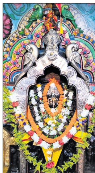
ଖଣ୍ଡପତା, ୧୩୩୩ (ସ୍ୱ.ପ୍ର.)

ଫାଇଗୁନ ଶୁକ୍ଳପକ୍ଷ ତିଥି ରବିବାରଠାକୁ ଠାକୁରଙ୍କ ବୋଲ ପର୍ବ (ଫଗୁ ଦଶମୀ)