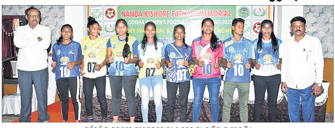
କର୍ମକର୍ତ୍ତାଙ୍କ ଗହଣରେ ଅଂଶଗ୍ରହଣକାରୀ ୬ ଦଳର ଅଧିନାୟିକା ଓ ଖେଳାଳି।

ଭୁବନେଶ୍ୱର, ୧୪ମାର୍ଚ୍ଚ (କ୍ରୀଡ଼ା ପ୍ରତିନିଧି): ସିଟି କ୍ଲବ ଏବଂ କିରୀ ମିଲିଟି ଆନୁକୁଲ୍ୟରେ ନନ୍ଦକିଶୋର ପଞ୍ଚନାୟକ ସ୍ମାରକୀ ମହିଳା ଫୁଟବଲ ଚୁନାବଳୀରେ ଏକ ଦଳର ଚାଳନା କରାଯାଇଛି।