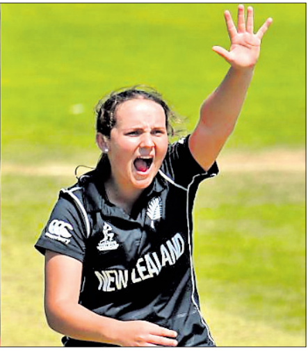
ଶ୍ରେୟାସ ଆୟାର ଓ ଆନେଲିଆ କେର୍।

ଭୁବନେଶ୍ୱର, ୧୪ମାର୍ଚ୍ଚ (ପି.ଟି.) ଭାରତୀୟ ବ୍ୟାଟର ଶ୍ରେୟାସ ଆୟାର ପୁରୁଷ ବର୍ଗରେ ଆଇଭିସି ପ୍ଲେୟର ଅଫ୍ ଦି ମନ୍ଥ ବିବେଚିତ ହୋଇଛନ୍ତି। ନ୍ୟୁଜିଲାଣ୍ଡ ଅଲରାଉଣ୍ଡର ଆନେଲିଆ କେର୍ ମହିଳା ବିଭାଗର ଶ୍ରେଷ୍ଠ ଖେଳାଳି ପୁରସ୍କାର ପାଇଁ ମନୋନୀତ ହୋଇଛନ୍ତି। ଅନ୍ତର୍ଜାତୀୟ କ୍ରିକେଟ କାଉନ୍ସିଲ୍ (ଆଇସିସି) ପକ୍ଷରୁ