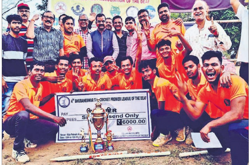
ପୁରସ୍କାର ସହ ଅତିଥିଙ୍କ ଗହଣରେ ଚାମ୍ପିୟନ ନନ୍ଦନକାନନ ବୁଲ୍ସ ଦଳର ଖେଳାଳି।

ପୁରସ୍କାର ସହ ଅତିଥିଙ୍କ ଗହଣରେ ଚାମ୍ପିୟନ ନନ୍ଦନକାନନ ବୁଲ୍ସ ଦଳର ଖେଳାଳିମାନେ ଟ୍ରଫି ସହ ଖୁସି ପୁହୁଡ଼ରେ।