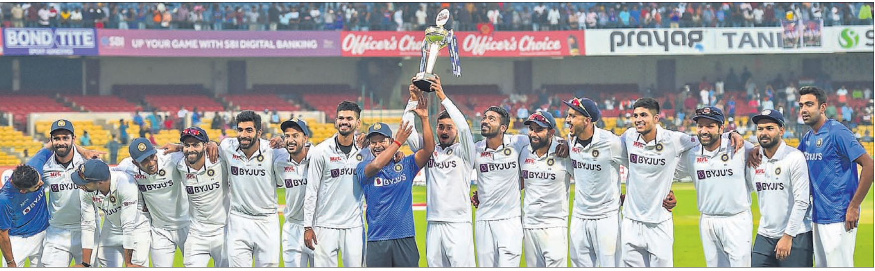
ଶ୍ରୀଲଙ୍କା ବିପକ୍ଷରେ ୨-୦ରେ ଟେଷ୍ଟ ସିରିଜ ବିଜୟୀ ଭାରତୀୟ କ୍ରିକେଟ ଦଳର ଖେଳାଳିମାନେ ଟ୍ରଫି ସହ ଖୁସି ମୁହୂର୍ତ୍ତରେ।