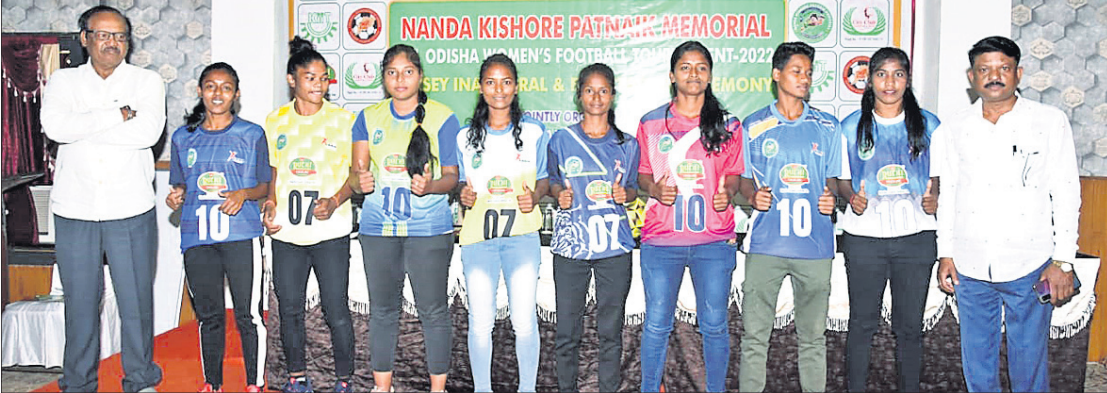
କର୍ମକର୍ମୀଙ୍କ ଗହଣରେ ଅଂଶଗ୍ରହଣକାରୀ ୬ ଦଳର ଅଧିନାୟିକା ଓ ଖେଳାଳି।

ଭୁବନେଶ୍ୱର, ୧୪ମାର୍ଚ୍ଚ (କ୍ରୀଡ଼ା ପ୍ରତିନିଧି): ସିଡି କ୍ଲବ ଏବଂ କିରୀ ପଲିଟି ଆଡଭୁଲ୍ୟାସନ ନନ୍ଦକିଶୋର ପଞ୍ଚନାୟକ ସ୍ମାରକୀ ମହିଳା ପୁରସ୍କାର ପ୍ରଦାନ କରାଯାଇଛି।