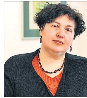
ପର୍ଯ୍ୟଟ ଚାଲୁ ବିନା ଖ୍ୟାପାମାୟରେ ସାମାଜିକ ଅପେକ୍ଷା କରିବାକୁ ପଡ଼ିଥିଲା।

ମୁକ୍ତେନ୍ଦ୍ର ଧୂସ୍ରବିଧି ହୋଇଥିବା ମୁକ୍ତେନ୍ଦ୍ର ପ୍ରଥମ ତଥା ଏକମାତ୍ର ମହିଳା ଇନ୍ଦୁଦୀ ଧର୍ମଗୁରୁ ଚୁଲିଆ ଗ୍ରାମ୍ ଦେଶ ଛାଡ଼ି ଯୋଲାଣି ପଳାଇଛନ୍ତି। ପ୍ରଥମ ଥର ପାଇଁ ସେ ଦେଶ ବାହାରେ ଶକ୍ତ (ଇନ୍ଦୁଦୀଙ୍କ ପବିତ୍ର ଦିନ) ପାଳିଛନ୍ତି।