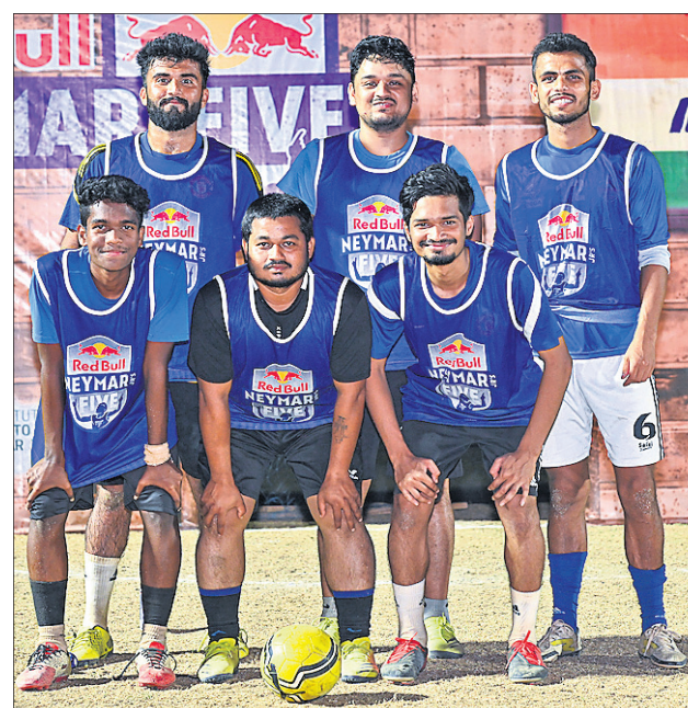
ଜାତୀୟ ପ୍ରତିଯୋଗିତା ପାଇଁ ଯୋଗ୍ୟତା ପାଇଥିବା ଯୋଗା ବୋନିଟୋ ଦଳ।

ଭୁବନେଶ୍ୱର, ୧୪ମାର୍ଚ୍ଚ (କ୍ରୀଡ଼ା ପ୍ରତିନିଧି): ବିଶ୍ୱସ୍ତରରେ ପ୍ରତିଷ୍ଠିତ ରେଡ୍‌ବଲ୍ ନେମାର ଜୁନିୟର୍ ଫାଇଲ୍ ପୁରସ୍କାର ପ୍ରତିଯୋଗିତାରେ ଭୁବନେଶ୍ୱର ଯୋଗ୍ୟତା ପର୍ଯ୍ୟନ୍ତ କିମ୍ପା ପଡ଼ିଥିବାର ଗତ ୧୩ ତାରିଖରେ ଅନୁଷ୍ଠିତ ହୋଇଯାଇଛି।