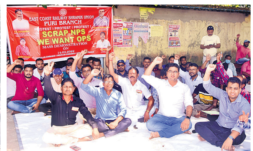
ବିଭିନ୍ନ ଦାବି ନେଇ ଅଲଗାଅଲଗା ରେଲୱେ ମେଡ଼ ଫେଡେରେଶନ ପୁରୀ ଶାଖା ପକ୍ଷରୁ ସୋମବାର ରେଲୱେ କୋର୍ଟ ଡିପୋ କାର୍ଯ୍ୟାଳୟ ସମ୍ମୁଖରେ ଧାରଣା।