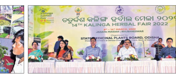
ହର୍ବାଲ ମେଳାର ଏକ ଷ୍ଟଲ୍‌ରେ ଲୋକେ ଔଷଧୀୟ ବୃକ୍ଷ ଜିଣୁଛନ୍ତି। ଉଦ୍‌ଘାଟନା ଉତ୍ସବରେ ଉପସ୍ଥିତ ଅତିଥିମାନେ।

ସାମ୍ପ୍ୟ ସମକ୍ଷୀୟ ପରାମର୍ଶ ନେଇଥିଲେ। ଏଥିସହ ଲୋକଙ୍କୁ ମନୋରଞ୍ଜନ ବିଭିନ୍ନ ବିଭାଗର ଚିକିତ୍ସକଙ୍କୁ ନେଇ ଖୋଲା ଆଲୋଚନା ମଧ୍ୟ ହେଉଥିଲା। ଲୋକେ