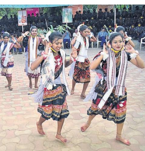
ଭୁବନେଶ୍ୱରସ୍ଥିତ ଭାରତ ଭାଙ୍ଗୁ ଆଶ୍ୱ ଗାଉଡ଼ ମୁଖ୍ୟାଳୟ ପରିସରରେ ସୋମବାର 'ପ୍ରତୀକ୍ଷା' ଶିବିର ଉଦ୍‌ଘାଟନ ଅବସରରେ ଛାତ୍ରମାନେ ନୃତ୍ୟ ପରିବେଷଣ କରୁଛନ୍ତି।