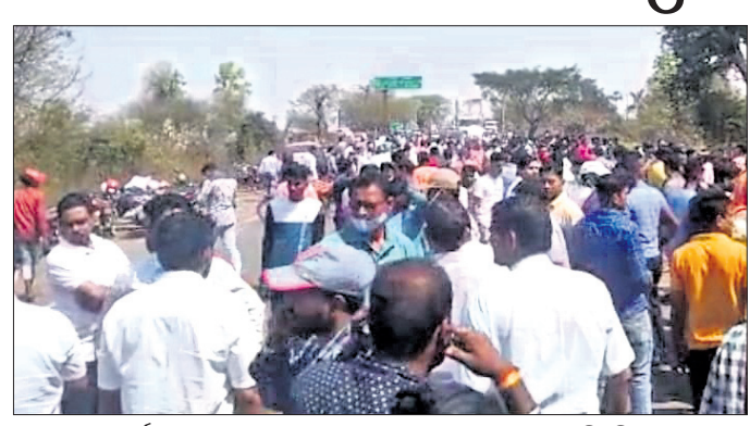
ଭୁବନେଶ୍ୱର ପରେ ଉତ୍ତରୀନା ଲୋକେ ରାଜ୍ୟ ଅବରୋଧ କରିଛନ୍ତି।