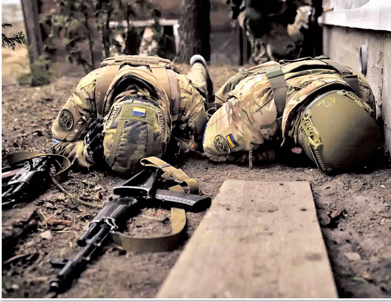
କିଛି ନିକଟ ଉପସ୍ଥିତରେ ରୁଷିଆ ସେନାର କମାଣ୍ଡ ଅନୁମତି କର୍ତ୍ତା ପାଇଁ ମୁକ୍ତେନ୍ଦ୍ର ସୈନ୍ୟ ପ୍ରୟାସ କରୁଛନ୍ତି।