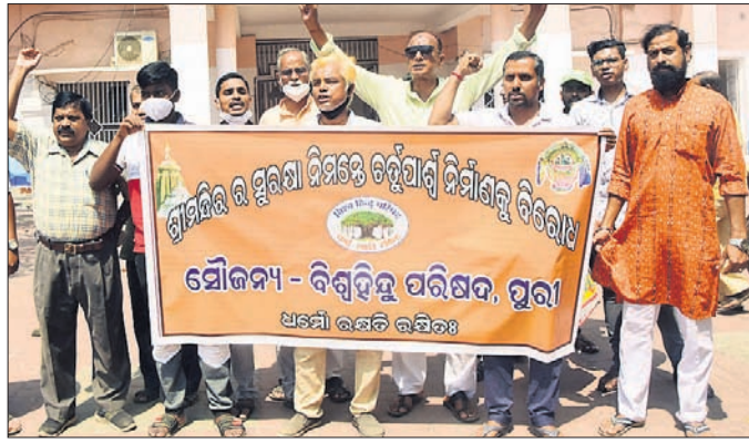
କିଳାପାଳ କାର୍ଯ୍ୟାଳୟ ସମ୍ମୁଖରେ ବିଶ୍ୱ ହିନ୍ଦୁ ପରିଷଦ ପକ୍ଷରୁ ବିରୋଧ ପ୍ରଦର୍ଶନ କରାଯାଇଛି।

ଶ୍ରାମଦିନ ପରିକ୍ରମା ପ୍ରକଳ୍ପ ବିବାଦ କ୍ରମଶଃ କଟିକ ହେବାରେ ଲାଗିଛି। ପ୍ରକଳ୍ପକୁ ଆଣିକ ଅନୁମତି ଥିବାବେଳେ ପ୍ରଶାସନ ମନଲୋଚ୍ଚ ବେଆଇନ ଭାବେ କାର୍ଯ୍ୟ କରୁଥିବା ଅଭିଯୋଗ ହେଉଛି। ବେଆଇନ ନିର୍ମାଣ କାର୍ଯ୍ୟ ବନ୍ଦ କରିବା ପାଇଁ ବିଭିନ୍ନ ମହଲରେ ଦାବି ଜୋର୍ ଧରୁଛି। ଏହି କ୍ରମରେ ସୋମବାର ବିଶ୍ୱ ହିନ୍ଦୁ ପରିଷଦ ପକ୍ଷରୁ ଉପକିଳାପାଳ ପ୍ରତାପ କୁମାର ସାହୁଙ୍କୁ ଦାବିପତ୍ର ଦିଆଯାଇଛି।