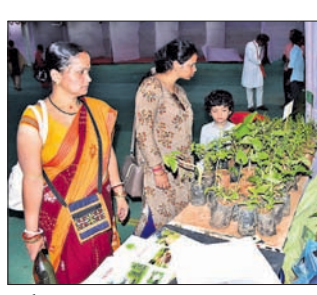
ରାଜ୍ୟସ୍ତରୀୟ ୧୪ତମ କଳିଙ୍ଗ ହର୍ବାଲ ମେଳା ଉଦ୍‌ଘାଟିତ

ସୁସ୍ଥ ରହିବାର ବାର୍ତ୍ତା ଦେଇ ସୋମବାର ଉଦ୍‌ଘାଟିତ ହୋଇଛି ରାଜ୍ୟସ୍ତରୀୟ ୧୪ତମ କଳିଙ୍ଗ ହର୍ବାଲ ମେଳା। ଜନତା ମଇଦାନରେ ଗତ ୮ ତାରିଖରୁ ଏହା ଆରମ୍ଭ ହୋଇଥିଲା। ଆୟୁର୍ବେଦିକ, ହୋମିଓପାଥିକ, ବୈଦ୍ୟ, ଜଡ଼ିବୁଟି, ଯୋଗ ଆଦିକୁ ନେଇ ୧୪୦ ଷ୍ଟଲ୍ ଖୋଲିଥିଲା। ଏଥିମଧ୍ୟରେ ସରକାରଙ୍କ ପକ୍ଷରୁ ୧୦ ଷ୍ଟଲ୍ ଖୋଲାଯାଇଥିଲା। ଯୋଗ ଷ୍ଟଲ୍‌ରେ ଯୋଗଶିକ୍ଷା ଦିଆଯାଇଥିଲା। ମେଳାକୁ ଆସୁଥିବା ଲୋକଙ୍କୁ ଏଠାରେ ସମସ୍ତ ଶାରୀରିକ ସମସ୍ୟା ସମାଧାନର ଉପାୟ ଜାଣିବାକୁ ମିଳୁଥିଲା। ସନ୍ଧ୍ୟା ସମୟରେ ବିଭିନ୍ନ ବିଭାଗର ଚିକିତ୍ସକଙ୍କୁ ନେଇ ଖୋଲା ଆଲୋଚନା ମଧ୍ୟ ହେଉଥିଲା। ଲୋକେ