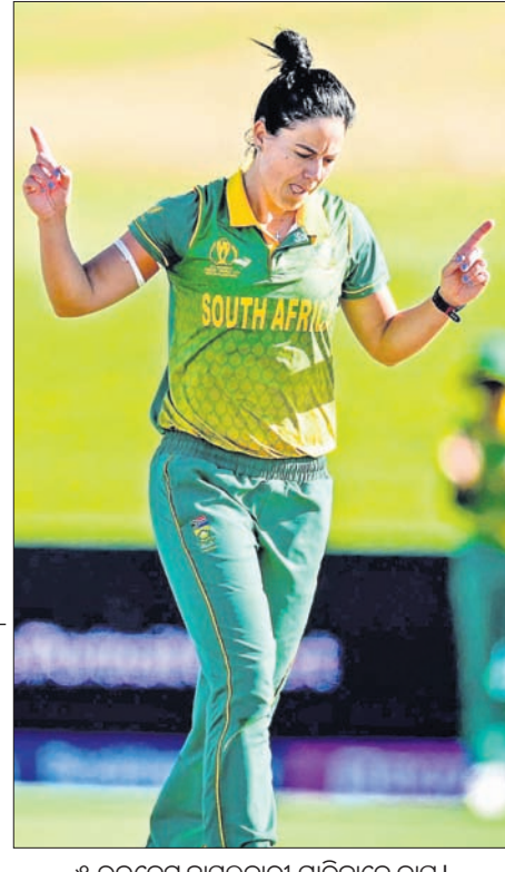
୫ ଉଇକେଟ ହାସଲକାରୀ ମାରିଜାନେ କାପ୍ ।

ଇନିଂସରେ ସେ ୨୦୪ ରନ କରି ଅପରାଜେୟ ରହିଥିଲେ । ତାଙ୍କର ଷ୍ଟ୍ରାଇକହାର ଥିଲା ୧୭୪.୩୬ । ଏହି ରେମ୍ପରେ ସେ ଯଥାକ୍ରମେ ୨୮ ବଲ୍ରେ ୫୬, ୪୪ ବଲ୍ରେ ୬୪ ଓ ୪୫ ବଲ୍ରେ ୬୩ ରନ କରି ଅପରାଜିତ ରହିଥିଲେ । ଏହି ସିରିଜରେ ୨୦ ଚୌକା ଓ ୭ ଛକା ମାରିଥିବା ଆୟାର ପ୍ଲେୟର ଅଫ୍ ଦି ସିରିଜ ବିବେଚିତ ହୋଇଥିଲେ । ଚଳିତ ମାସରେ ମଧ୍ୟ ୨୭ ବର୍ଷୀୟ ଆୟାର ସେହି ଫର୍ମା କାରି ରଖିଛନ୍ତି । ବେଙ୍ଗାଲୁରୁରେ ଅନୁଷ୍ଠିତ ଶ୍ରୀଲଙ୍କା ବିପକ୍ଷ ଦ୍ୱିତୀୟ ଟେଷ୍ଟରେ ସେ ପ୍ରଥମ ଇନିଂସରେ ୯୨ ରନ ଷ୍ଟୋର କରିଥିଲେ । ୨୧ ବର୍ଷୀୟ କେରୁ ଭାରତ ବିପକ୍ଷ ସୀମିତ ଓଭର କ୍ରିକେଟ ସିରିଜରେ ଉତ୍ତମ ବ୍ୟାଟ୍ ଓ ବଲ୍ରେ ଚମକ ଦେଖାଇଥିଲେ । କୋଟିରେ ସେ ଭାରତୀୟ ଦଳର ଅଧିନାୟକା ମିତାଲି ରାଜ ଓ ଅଲରାଉଣ୍ଡର ଦୀପ୍ତି ଶର୍ମାଙ୍କୁ ପଛରେ ପକାଇ ଦେଇଥିଲେ । ଫ୍ଲୋରିଡରେ ଜିନ୍ଦି କେରୁ ଆଧୁନିକ କ୍ରିକେଟରେ ଜଣେ ଶ୍ରେଷ୍ଠ ମହିଳା କ୍ରିକେଟର ଭାବେ ବିବେଚିତ ହେଉଛନ୍ତି ।