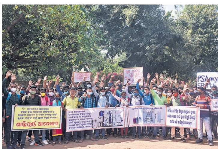
ରାଜ୍ୟର ବିଭିନ୍ନ ଜିଲ୍ଲାରେ ଥିବା ଅଧିକେନ୍ଦ୍ର ପ୍ଲାଣ୍ଟରେ ନିରୁଦ୍ଧିତ ଦାବି କରି ସୋମବାର ଅଲ୍ ଓଡ଼ିଶା ସରକାରୀ ଆଇଡିଆଲ ଛାତ୍ରାହାତ୍ରକ ଭୁବନେଶ୍ୱର ଲୋୟର ପିଏମ୍‌ଜିରେ ବିରୋଧ।