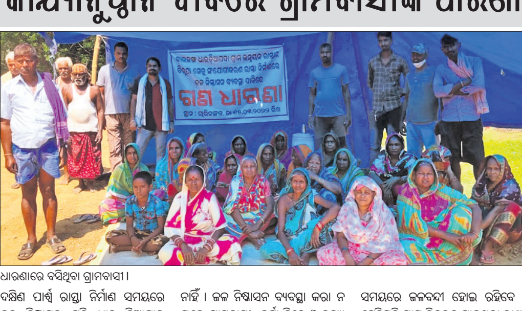
ଧାରଣାରେ ବସିଥିବା ଗ୍ରାମବାସୀ।

ନାହିଁ। କଳ ନିଷାସନ ବ୍ୟବସ୍ଥା କରା ନ ଗଲେ ଗ୍ରାମବାସୀ ବର୍ଷା ଦିନେ ଓ ବନ୍ୟା ସମୟରେ ଜଳବନ୍ଦୀ ହୋଇ ରହିବେ। ସେହିପରି ଗ୍ରାମ ଭିତରକୁ ଯାଇଥିବା ରାସ୍ତା