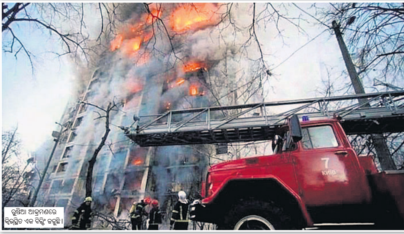
ରୁଷିଆ ଆକ୍ରମଣରେ କ୍ରିମିୟା ଏକ ବିଲ୍ଡିଂ ଜଳୁଛି।

ବୁଧବାର, ୧୫ମାର୍ଚ୍ଚ: ଯୁକ୍ତମାନ ଆକ୍ରମଣ ପାଇଁ ରୁଷିଆ ଉପରେ ଯୁରୋପୀୟ ସଂଘ (ଇୟୁ) ମଙ୍ଗଳବାର ନୂଆ କଟକଣା ଲଗାଇଛି। ରୁଷିଆର ଶକ୍ତି କ୍ଷେତ୍ରରେ ନିବେଶ ବନ୍ଦ ହେବ ଯେଠାକୁ ଲକ୍ଷ୍ୟ କରାଯାଏ। ଗ୍ରୀଷ୍ମ ଋତୁରୁ ଶୁଣ୍ଠି ଉତ୍ପାଦନ ଆମଦାନୀକୁ ବ୍ୟାନ୍ କରାଯାଇଛି। ଏଥିସହ ତେଲ୍‌ସା ପୁରୁବଲ କୁବର ମାଲିକ ରୋମାନ ଆଗ୍ରାମୋଭିଚ୍‌ଙ୍କ ସମେତ ରୁଷିଆର ଅନ୍ୟ ବ୍ୟବସାୟୀଙ୍କ ଉପରେ ମଧ୍ୟ ଇୟୁ କଟକଣା ଲଗାଇଛି। ଏହି କଟକଣା ଶ୍ରୀଲଙ୍କା ରୁଷିଆର ପ୍ରମୁଖ ପେଟ୍ରୋଲିୟମ କମ୍ପାନୀ ରୋଜ୍‌ନେଫ୍, ଗ୍ରାନ୍‌ନେଫ୍, ଗାଜ୍‌ପ୍ରୋମ୍ ନେଫ୍, ପ୍ରୋଭାଟିଟ ହେବେ। ଏହା ସତ୍ତ୍ୱେ ଯୁରୋପୀୟ ଦେଶଗୁଡ଼ିକ ସେମାନଙ୍କଠାରୁ ତୈଳ ଓ ଗ୍ୟାସ୍ କିଣିପାରିବେ ବୋଲି ଇୟୁ ପକ୍ଷରୁ କୁହାଯାଇଛି। ଏତଦ୍‌ସତ୍ତ୍ୱେ କ୍ରେମ୍‌ଲିନ୍ ମିଲିଟାରୀ-ଇଣ୍ଡଷ୍ଟ୍ରିଆଲ କମ୍ପ୍ଲେକ୍ସ ସହ ସଂଯୁକ୍ତ କେତେକ ରାଷ୍ଟ୍ରୀୟ ଉଦ୍ୟୋଗ ସହିତ କାରବାର ଉପରେ ମଧ୍ୟ ନିଷେଧାଦେଶ ଜାରି ହୋଇଛି। ଏହି ବ୍ୟାନ୍ ଫଳରେ ରୁଷିଆର ୩.୬ ବିଲିୟନ ଡଲାର ମୂଲ୍ୟର ଶୁଳ ଉତ୍ପାଦ କାରବାର ପ୍ରଭାବିତ ହେବ ବୋଲି ଇୟୁ ପକ୍ଷରୁ କୁହାଯାଇଛି। ସେହିପରି ଯୁନାଇଟେଡ୍ କିଙ୍ଗଡମ୍ ମଧ୍ୟ ରୁଷିଆ ଉପରେ ମଧ୍ୟ ନୂଆ କଟକଣା ଲଗାଇଛି।