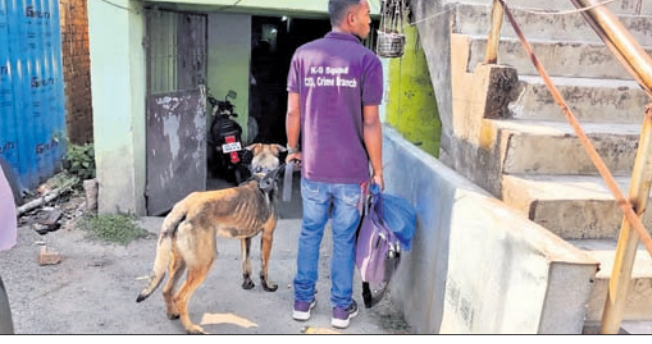
ପୋଲିସ ପକ୍ଷରୁ ଘଟଣାସ୍ଥଳରେ ତଦନ୍ତ ଚାଲିଛି।