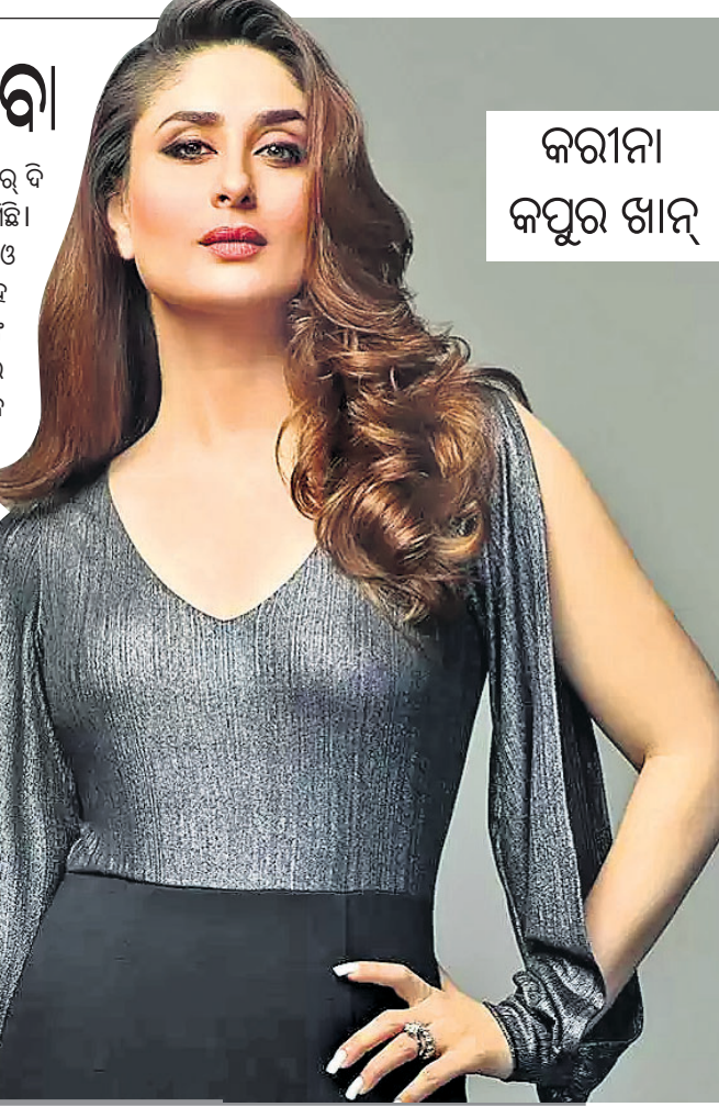
କରୀନା କପୁର ଖାନ

ଭୁବନେଶ୍ୱର: ଓଡ଼ିଶାରେ ବେବୋ ପ୍ରଚାର କରାଯାଇଛି। ଓଡ଼ିଶାରେ ବେବୋ ପ୍ରଚାର କରାଯାଇଛି। ଓଡ଼ିଶାରେ ବେବୋ ପ୍ରଚାର କରାଯାଇଛି।