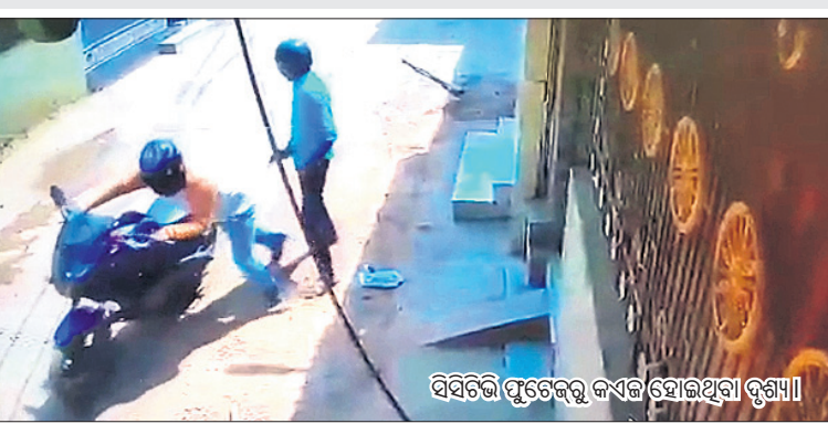
ସିବିଟିଲି ପୁରୁଣୁରୁ କଏଡ଼ ହୋଇଥିବା ଦୁର୍ଭିକ୍ଷ।

ଭୁବନେଶ୍ୱର, (ଧ୍.ଏ.ଏ.)/ଯାଁଲ, ୧୬ମାର୍ଚ୍ଚ (ଧ୍.ଏ.ଏ.): ରାଜଧାନୀରେ ଲୁଚେଇବାକୁ ଉଦ୍ଦିଷ୍ଟ ଦିନିକି ଅପହରଣ ହେବାରେ ଲାଗିଛି। କେତେକଦିନ ପରେ ପୁଣି ଲୁଚେଇବାକୁ ଉଦ୍ଦିଷ୍ଟ ଦିନିକି ଅପହରଣ ହେବାରେ ଲାଗିଛି।