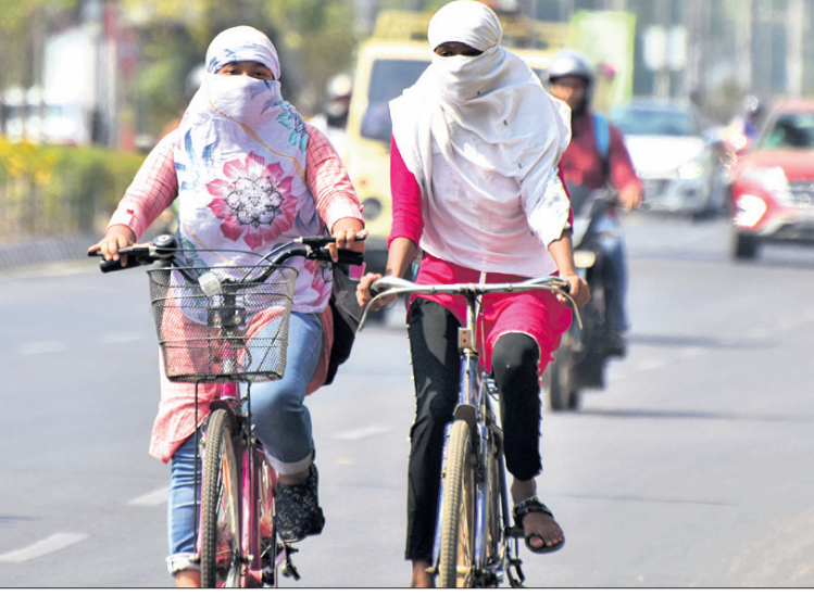
ଭୁବନେଶ୍ୱର, ୧୬ମାର୍ଚ୍ଚ (ଧ୍.ଏ.ଏ.)

ରାଜ୍ୟରେ ପ୍ରବଳ ଗ୍ରୀଷ୍ମ ପ୍ରବାହ ଆରମ୍ଭ ହୋଇଛି। ପାରବ ଉପରମୁଖି ହୋଇଛି। ପ୍ରବଳ ଗ୍ରୀଷ୍ମ ପ୍ରବାହ ଯୋଗୁ ସମଗ୍ର ପରିବେଶ ଉତ୍ତପ୍ତ ହୋଇଛି।