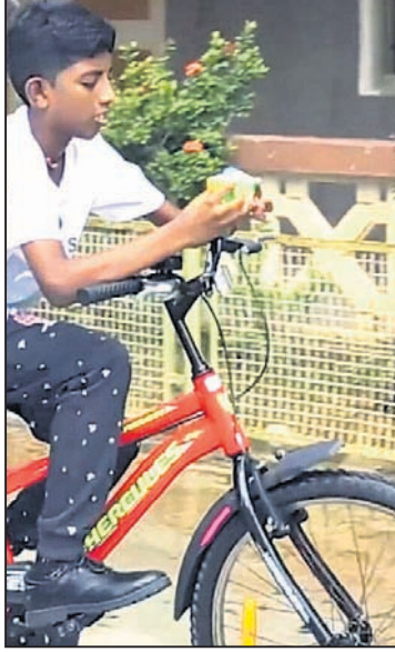
ଶେୟାର କରାଯାଇଥିବାବେଳେ ଭିଡିଓ ୬୬ ହକାରରୁ ଅଧିକ ଭୋକେ ଦେଖିପାରିବେ।

ଭୁବନେଶ୍ୱର: ୧୪.୩୨ ସେକେଣ୍ଡରେ ରୁବିନ୍ଦ୍ର କ୍ୟୁବ୍ ସମାପାନ କରାଯାଇଛି। ୧୪.୩୨ ସେକେଣ୍ଡରେ ରୁବିନ୍ଦ୍ର କ୍ୟୁବ୍ ସମାପାନ କରାଯାଇଛି।