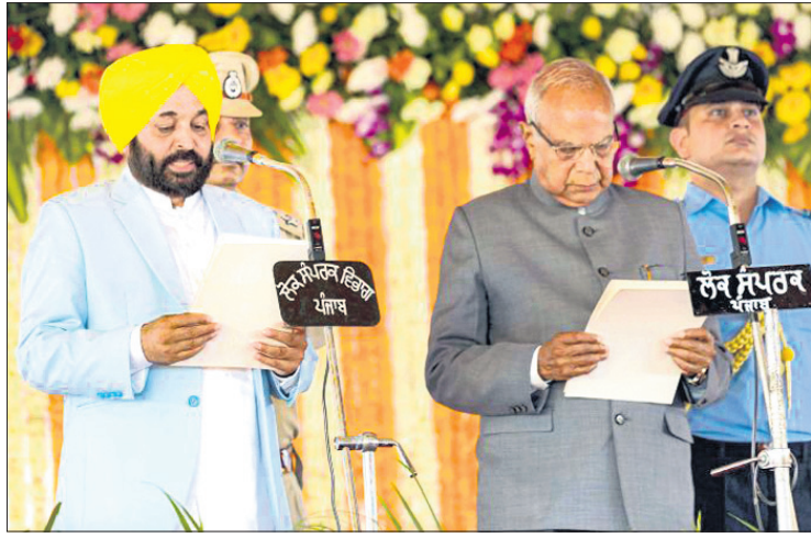
ପଞ୍ଚାବ ରାଜ୍ୟପାଳ ବନପ୍ରିୟାଲଲ ପୁରୋହିତ ମୁଖ୍ୟମନ୍ତ୍ରୀ ଭାବେ ଭଗାଓଡ଼ ମାନ୍ ଶପଥ ଗ୍ରହଣ କରାଉଛନ୍ତି।

ଆର୍. ଆଦ୍ୟା ପାଟି ନେତା ଭଗାଓଡ଼ ମାନ୍ ଗୁପ୍ତାବାର ପଞ୍ଚାବ ମୁଖ୍ୟମନ୍ତ୍ରୀ ଭାବେ ଶପଥ ଗ୍ରହଣ କରିଛନ୍ତି।