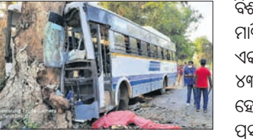
ଭର୍ତ୍ତି କରାଯାଇଛି। ଖବରରୁ ଜଣାପଡ଼ିଛି ଦାମନଯୋଡ଼ିରୁ ଏହି ବସ୍ (ଏପିଏୱେଜେଡ୍ -୦୩୪୬) ବସ୍ଟି ବାହାରିଥିବା ଟଙ୍କା ଗଣତି ଚାଲିଛି।

ପଟ୍ଟାଳୀ, ୧୬୩(ଡି.ଏନ.ଏ.) କୋରାପୁଟ ଜିଲା ପଟ୍ଟାଳୀ ଥାନା ଅଞ୍ଚଳରେ ମାଲିପୁଟ ଗ୍ରାମ ନିକଟସ୍ଥ ମଶାଣିଠାରେ ଭାରସାମ୍ୟ ହରାଇ ଏକ ଯାତ୍ରାବାହୀ ବସ୍ ଦୁର୍ଘଟଣାଗ୍ରସ୍ତ ହୋଇଛି।