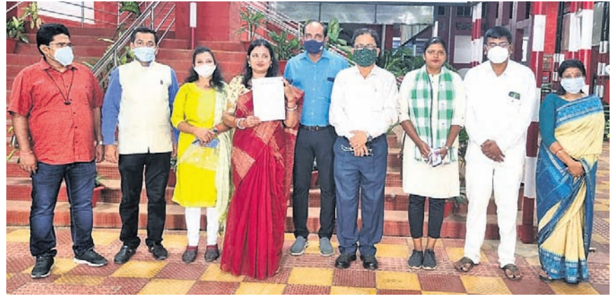
ରାଜ୍ୟ ମୁଖ୍ୟ ନିର୍ବାଚନ କମିଶନରଙ୍କୁ ଦାବିପତ୍ର ଦେଇ ଫେରାଦ ପରେ ବିଜେଡି ନେତୃତ୍ୱ।