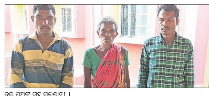
ବୁଲ ପୁଅଙ୍କ ସହ ପୁଲତାନୀ ।

ଲାଞ୍ଚ ଗ୍ରହଣ କରୁଥିବା ବେଳେ ଦୁର୍ନୀତି ନିବାରଣ ବିଭାଗ ଦ୍ୱାରା ଧରା ପଡ଼ିଥିଲେ ତାଙ୍କୁ କାର୍ଯ୍ୟରୁ ନିଲମ୍ବିତ କରାଯାଇଥିଲା।