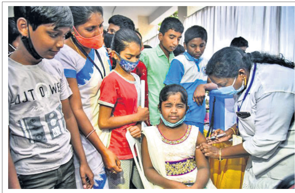
ହାଇଦ୍ରାବାଦରେ ଜଣେ ସ୍ଵାସ୍ଥ୍ୟକର୍ମୀ ୧୨ରୁ ୧୪ ବର୍ଷ ବୟସର ପିଲାଙ୍କୁ କୋଭିଡ଼ ଟିକା ଦେଉଛନ୍ତି।

ଭାରତରେ ସଡ଼କ ଦୁର୍ଘଟଣା ଜନିତ ମୃତ୍ୟୁସଂଖ୍ୟା ବିଶ୍ଵରେ ସର୍ବାଧିକ। ପ୍ରତିବର୍ଷ ୧.୫ ଲକ୍ଷ ଲୋକଙ୍କର ଦୁର୍ଘଟଣାରେ ମୃତ୍ୟୁ ହେଉଛି।