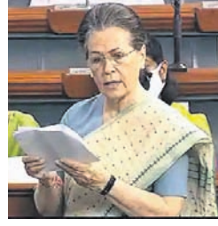
କେନ୍ଦ୍ର ଶିକ୍ଷା ବିଭାଗ ମନ୍ତ୍ରୀ କେ. ଅନୁଭୂତ୍ୟାଙ୍କୁ ପରାମର୍ଶ ଦେଉଥିବା ଚିତ୍ର।