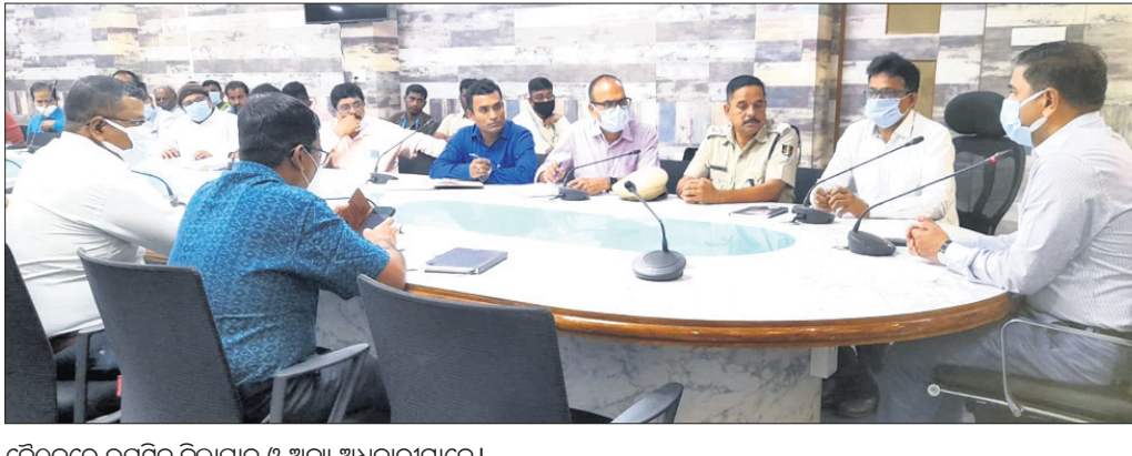
ବୈଠକରେ ଉପସ୍ଥିତ ଜିଲାପାଳ ଓ ଅନ୍ୟ ଅଧିକାରୀମାନେ ।

ମା'ଙ୍କ ଚୈତ୍ର ପର୍ବ ପ୍ରସ୍ତୁତି ଶୈଳୀ ଅସୁସ୍ଥ, ବୟସ୍କ ବ୍ୟକ୍ତିଙ୍କୁ ନ ଆସିବାକୁ ପରାମର୍ଶ