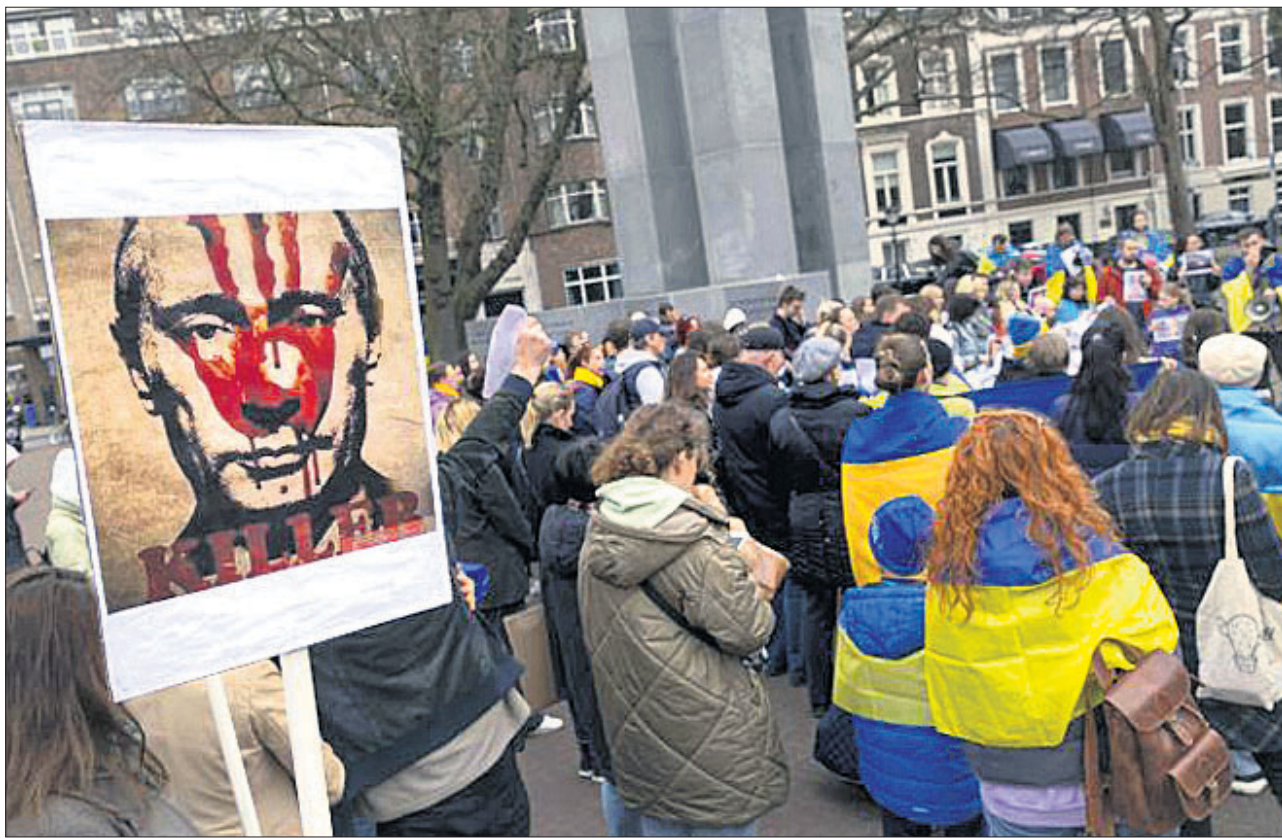
ନେଦରଲ୍ୟାଣ୍ଡସର ହେଗ୍ରେଡ଼ ଅନ୍ତର୍ଜାତୀୟ ଅଦାଲତରେ ଶୁଣାଣି ଚାଲିଥିବାବେଳେ ବାହାରେ ଯୁକ୍ତରାଷ୍ଟ୍ର ସପକ୍ଷବାଦୀମାନେ ବିକ୍ରୋଧ କରୁଛନ୍ତି।

ଫ୍ଲାଣ୍ଡର୍ସ, ୧୬ ମାର୍ଚ୍ଚ: ଯୁକ୍ତରାଷ୍ଟ୍ର ଆକ୍ରମଣ କରି ଚଳୁଥିବା ରାଷ୍ଟ୍ରପତି ଭାଙ୍ଗିବା ପ୍ରତି ଯୁଦ୍ଧ ଅପରାଧୀ କରିଛନ୍ତି ବୋଲି ଆମେରିକା ନିର୍ବାଚକମାନଙ୍କ ଦ୍ଵାରା ତଦନ୍ତ କରି ଅପରାଧୀ ସାବ୍ୟସ୍ତ ନିମନ୍ତେ ଆମେରିକା ସିନେଟରେ ମଫତଦାବୀ ଦର୍ଶାଯାଇଛି।