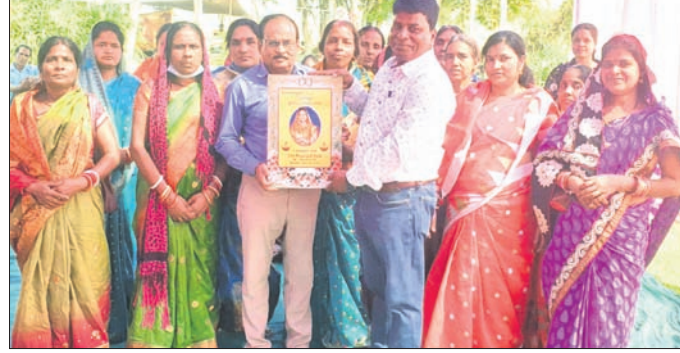
ବନ୍ଧୁମିଳନ ଉତ୍ସବରେ ଅତିଥି ସହ ପୁରାତନ ବିଦ୍ୟାର୍ଥୀ।

ପ୍ରାୟ ୫୦ ବର୍ଷ ପୂର୍ବରୁ ଉପସ୍ଥାପିତ ହୋଇଥିବା ପୁରାତନ ବିଦ୍ୟାର୍ଥୀଙ୍କ ବନ୍ଧୁମିଳନ କାର୍ଯ୍ୟକ୍ରମର ଅନ୍ତର୍ଗତ ଭାଗ୍ୟବାନ ଶିକ୍ଷକଙ୍କୁ ସମ୍ମାନିତ କରାଯାଇଥିଲା।