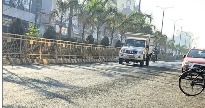
କେନ୍ଦୁଝର ମୁଖ୍ୟରାସ୍ତାରୁ ପିରୁ ଉଠିଯାଇଛି।

କେନ୍ଦୁଝର ଜିଲା ମୁଖ୍ୟାଳୟ ରାସ୍ତାର ମରାମତି ପାଇଁ ବହୁ ଅର୍ଥ ଖର୍ଚ୍ଚ କରାଯାଉଥିଲେ ହେଁ ଉପଯୁକ୍ତ ତଦାରଖ ଅଭାବରୁ ନିମ୍ନମାନର କାମ ଯୋଗୁଁ କିଛି ଦିନ ମଧ୍ୟରେ ରାସ୍ତାର ଅବସ୍ଥା ଖୋରାଣା ହୋଇପାରି ନାହିଁ। ଏହାକୁ ଦୂର କରିବା ପାଇଁ ବିଭାଗୀୟ ଅଧିକାରୀଙ୍କୁ ନିର୍ଦ୍ଦେଶ ଦିଆଯାଇଛି।