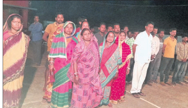
ଥାନା ସମ୍ମୁଖରେ ବିଜେଡି କର୍ମୀମାନେ ଧାରଣା ଦେଇଛନ୍ତି।