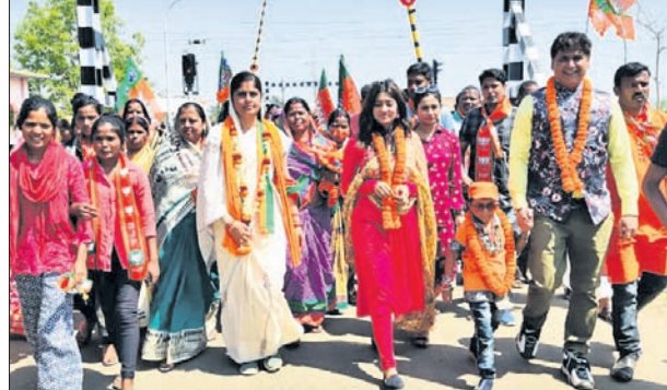
ସିନେ ତାରକାମାନେ ପ୍ରାର୍ଥନା ନିକୁ ସାହୁଙ୍କ ପାଇଁ ପ୍ରଚାର କରୁଛନ୍ତି।