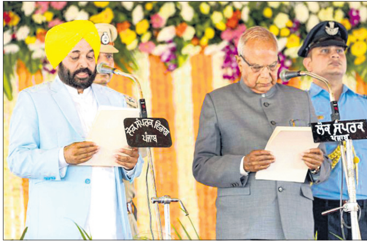
ପଞ୍ଜାବ ରାଜ୍ୟପାଳ ବନଖିରଲାଇ ପୁରସ୍କାର ପାଇଁ ଶପଥ ଗ୍ରହଣ କରୁଥିବା ପଞ୍ଜାବ ପୁରସ୍କାର ପ୍ରାପ୍ତ ହୋଇଛନ୍ତି।

ଆମ୍ ଆଦମା ପାର୍ଟି ନେତା ଭଗତ୍ସେବ ମାନ୍ ରୂପକାର ପଞ୍ଜାବ ପୁରସ୍କାର ପାଇଁ ଶପଥ ଗ୍ରହଣ କରିଛନ୍ତି। କିମ୍ବଦନ୍ତୀ ସାଧାରଣ ସଂଗ୍ରାମୀ ଭଗତ୍ସେବ ଫିଲ୍ମ ପ୍ରତିଷ୍ଠାପକ ଶ୍ରୀମତୀ ଶ୍ରୀମତୀ ଭଗତ୍ସେବ (ଏକ୍ସିକ୍ୟୁଟିଭ ନେତା) ଶପଥ ଗ୍ରହଣ କରିବା ପରେ ପଞ୍ଜାବ ପୁରସ୍କାର ପାଇଁ ଶପଥ ଗ୍ରହଣ କରିଛନ୍ତି। କିମ୍ବଦନ୍ତୀ ସାଧାରଣ ସଂଗ୍ରାମୀ ଭଗତ୍ସେବ ଫିଲ୍ମ ପ୍ରତିଷ୍ଠାପକ ଶ୍ରୀମତୀ ଶ୍ରୀମତୀ ଭଗତ୍ସେବ (ଏକ୍ସିକ୍ୟୁଟିଭ ନେତା) ଶପଥ ଗ୍ରହଣ କରିବା ପରେ ପଞ୍ଜାବ ପୁରସ୍କାର ପାଇଁ ଶପଥ ଗ୍ରହଣ କରିଛନ୍ତି।