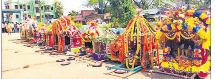
ମୁନ୍ସୀ ମେଳଣକୁ ଆସିଥିବା ବିମାନ।