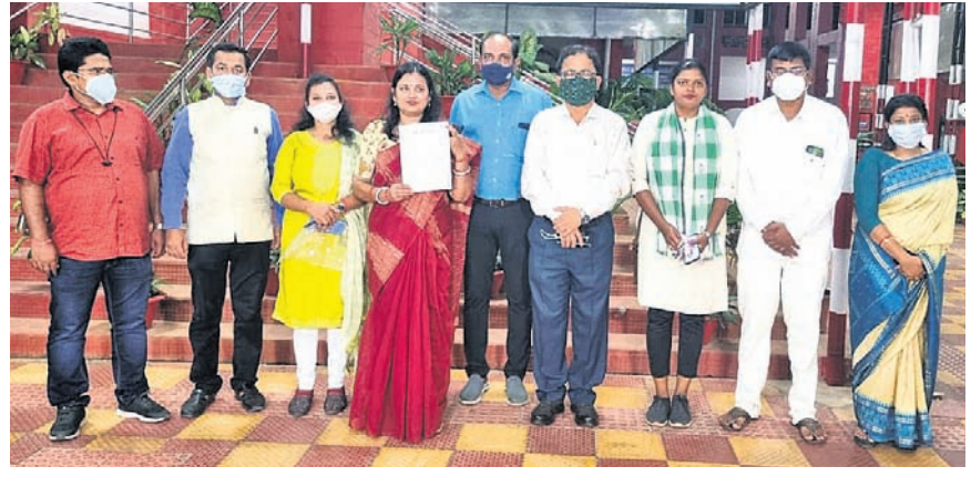
ରାଜ୍ୟ ପୁଞ୍ଜୀ ନିର୍ବାଚନ କମିଶନରୁକ୍ ଦାବିପତ୍ର ଦେଇ ଫେରାଦ ପରେ ବିଜେଡି ନେତୃତ୍ଵ।