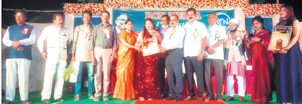
ମହୋତ୍ସବର ଉଦ୍ଘାଟନା ଦିବସରେ ଉପସ୍ଥିତ ଅତିଥି।