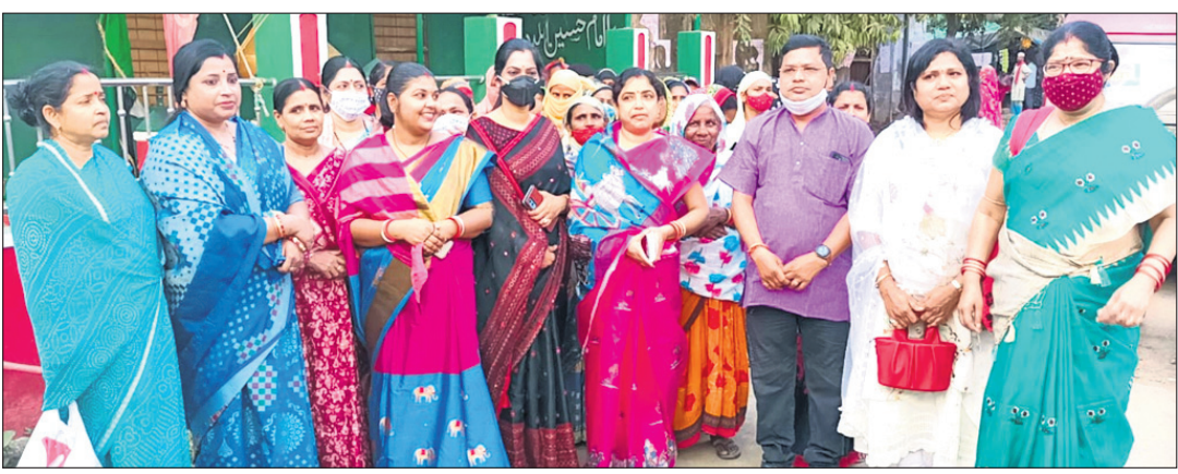
ସ୍ୱାଧୀନ ପ୍ରାର୍ଥନା ପ୍ରଶଂସିତ ଦାୟ ସମର୍ଥକଙ୍କ ସହ ପ୍ରଚାର କରୁଛନ୍ତି।

ବାଲେଶ୍ୱର ପୌର ନିର୍ବାଚନ ଆସନ୍ତା ୨୪ତାରିଖରେ ଅନୁଷ୍ଠିତ ହେବ। ପ୍ରାର୍ଥନାପୂର୍ଣ୍ଣ ମତଦାନ କେନ୍ଦ୍ର ତାଲିକା ଘୋଷଣା ପରେ ପ୍ରାର୍ଥନା ଓ ପ୍ରାର୍ଥୀମାନେ ପ୍ରଚାରକୁ କୋରଦାର କରିଛନ୍ତି। ଘରକୁ ଘର ବୁଲି ପ୍ରତିଶ୍ରୁତି ପରେ ପ୍ରତିଶ୍ରୁତି ଦେଇ ତାଲିମ୍ମାନଙ୍କୁ ପୂର୍ବତନ ନେତାମାନେ ଦେଇଥିବା ପ୍ରତିଶ୍ରୁତିକୁ ପାଳନ କରି ନ ଥିବାରୁ ଭୋଟରଙ୍କ ଅସନ୍ତୋଷର ଶିକାର ହେଉଛନ୍ତି। ସେହିପରି ଦଳୀୟ ପ୍ରାର୍ଥୀମାନଙ୍କୁ ମଧ୍ୟ ଭୋଟରମାନେ ନାପସନ୍ଦ କରୁଥିବା ଘ୍ନାନେ ଘ୍ନାନେ ନଜର ଆସୁଛି। ସ୍ୱାଧୀନ ଭାବେ ପ୍ରାର୍ଥନା କରିବାକୁ କଳ୍ପନା ପ୍ରାର୍ଥୀମାନେ ସିଧାସଳଖ ଭୋଟରଙ୍କୁ ସାକ୍ଷାତ କରି ଖର୍ଚ୍ଚ ଉତ୍ତର ଦେବା ପାଇଁ ଅନୁରୋଧ କରୁଛନ୍ତି। କୌଣସି ଦଳର ଯତ୍ନ କିମ୍ବା ଅର୍ଥସାହାଯ୍ୟ ବିନା ସ୍ୱାଧୀନ ପ୍ରାର୍ଥୀମାନେ ଭୋଟରମାନଙ୍କୁ ସଫଳତା ପ୍ରାପ୍ତ କରିବା ପାଇଁ ଉଦ୍ୟମ କରୁଛନ୍ତି।