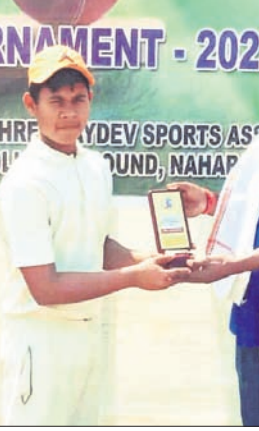
ଟୁଲନ୍ ସିଟି ୨୩ ବର୍ଷରୁ କମ୍ କ୍ରିକେଟ ପ୍ରତିଯୋଗିତାରେ ଭାଗନେଇ ପାରିବେ।

ଟୁଲନ୍ ସିଟି ୨୩ ବର୍ଷରୁ କମ୍ କ୍ରିକେଟ ପ୍ରତିଯୋଗିତାରେ ଭାଗନେଇ ପାରିବେ। ଟୁଲନ୍ ସିଟି ୨୩ ବର୍ଷରୁ କମ୍ କ୍ରିକେଟ ପ୍ରତିଯୋଗିତାରେ ଭାଗନେଇ ପାରିବେ।