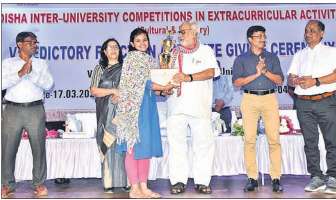
ରାଜ୍ୟପାଳ ପ୍ରଫେସର ଗଣେଶ ଲାଲ କୃତ୍ରିମ ପ୍ରତିଯୋଗୀଙ୍କୁ ପୁରସ୍କୃତ କରୁଛନ୍ତି।

ପ୍ରତିଯୋଗୀ ନ ଥିଲେ ବିଜେତା ସୃଷ୍ଟି ହୋଇପାରନ୍ତି ନାହିଁ। କୃତ୍ରିମ ଭାବରେ ଯୋଗାଯୋଗ କରାଯାଇ ପାରୁଥିବା ପରିସ୍ଥିତିରେ ପ୍ରତିଯୋଗୀଙ୍କ ସମ୍ପର୍କରେ ସଂକଳନ ହୋଇପାରେ ନାହିଁ। ରାଜ୍ୟପାଳ ତଥା ଉଚ୍ଚତମ ବିଶ୍ୱବିଦ୍ୟାଳୟ କୁଳାଧିପତି ପ୍ରଫେସର ଗଣେଶ ଲାଲ କହିଛନ୍ତି। ଭୁବନେଶ୍ୱର ଉଚ୍ଚତମ ବିଶ୍ୱବିଦ୍ୟାଳୟରେ ଓଡ଼ିଶା ଆନ୍ତର୍ଜାତୀୟ ପ୍ରତିଯୋଗୀ ପ୍ରତିଯୋଗିତା (ସାଂସ୍କୃତିକ ଓ ସାହିତ୍ୟିକ)ର ଉଦ୍‌ଘାଟନ ସମାରୋହ ଅନୁଷ୍ଠିତ ହୋଇଥିଲା। ମୁଖ୍ୟଅତିଥି ଭାବେ ରାଜ୍ୟପାଳ ଯୋଗଦେଇ କହିଲେ, ପ୍ରତିଯୋଗିତାରେ ଉପାଦାନ ସହିତ ଅଂଶଗ୍ରହଣ କରିବା ହିଁ ଛାତ୍ରଛାତ୍ରୀଙ୍କ ପାଇଁ ସଫଳତା ଓ ପ୍ରତିଯୋଗିତା ପ୍ରଦର୍ଶନର ମାର୍ଗ ଉନ୍ମୋଚନ କରିଥାଏ। ନୀତିଗତ ସହିତ