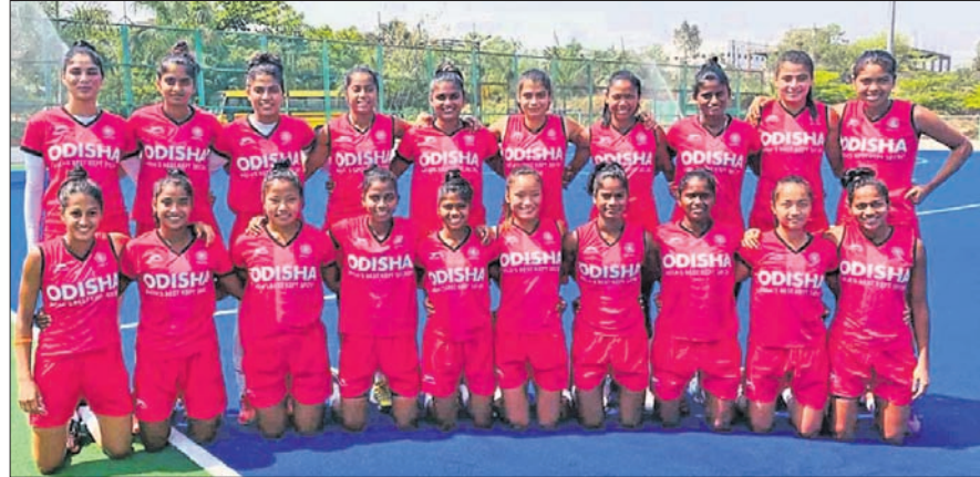
ଓଡ଼ିଶାର ଆଜମିନା ଓ ଜିଓନ କିଶୋରୀ ଦଳ ଯୋଗରେ ଓଡ଼ିଆ ଲୀଗରେ ପ୍ରତିଯୋଗିତାରେ ଭାଗନେଇ ପାରିବେ।

ଭୁବନେଶ୍ୱର, ୧୭ମାର୍ଚ୍ଚ (ପି.ଟି.) ଓଡ଼ିଶାର ଆଜମିନା ଓ ଜିଓନ କିଶୋରୀ ଦଳ ଯୋଗରେ ଓଡ଼ିଆ ଲୀଗରେ ପ୍ରତିଯୋଗିତାରେ ଭାଗନେଇ ପାରିବେ। ଓଡ଼ିଆ ଲୀଗରେ ପ୍ରତିଯୋଗିତାରେ ଭାଗନେଇ ପାରିବେ। ଓଡ଼ିଆ ଲୀଗରେ ପ୍ରତିଯୋଗିତାରେ ଭାଗନେଇ ପାରିବେ।