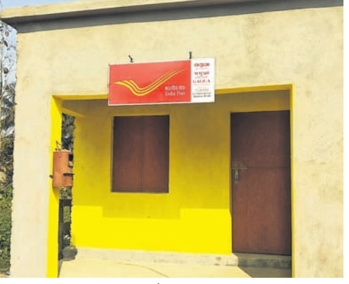
ସେଦିନର କରାକାର୍ଣ୍ଣ ଗୋରୁଆ ପୋଷ୍ଟ ଅଫିସ୍ ।