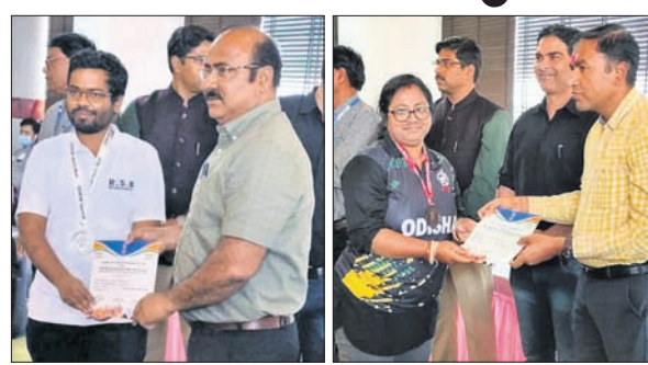
ଓଡ଼ିଆ ଲୀଗରେ ପ୍ରତିଯୋଗିତାରେ ଭାଗନେଇ ପାରିବେ। ଓଡ଼ିଆ ଲୀଗରେ ପ୍ରତିଯୋଗିତାରେ ଭାଗନେଇ ପାରିବେ।

ଭୁବନେଶ୍ୱର, ୧୭ମାର୍ଚ୍ଚ (କ୍ରୀଡ଼ା ପ୍ରତିନିଧି): ଭୁବନେଶ୍ୱର ଅନୁଷ୍ଠିତ ସର୍ବଭାରତୀୟ ବିଭିନ୍ନ ପ୍ରତିଯୋଗିତାରେ ଓଡ଼ିଆ ଲୀଗରେ ପ୍ରତିଯୋଗିତାରେ ଭାଗନେଇ ପାରିବେ। ଓଡ଼ିଆ ଲୀଗରେ ପ୍ରତିଯୋଗିତାରେ ଭାଗନେଇ ପାରିବେ।