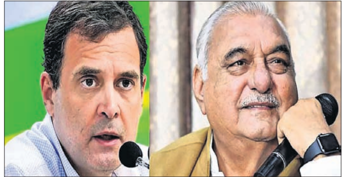
ରାହୁଲ ଗାନ୍ଧୀ (ବାମ) ଓ ଭୂପେନ୍ଦ୍ର ସିଂହ (ଡାହାଣ) ଏକ ସମ୍ମିଳନୀରେ ଉପସ୍ଥିତ ଅଛନ୍ତି।

ପଞ୍ଚ ରାଜ୍ୟରେ ନିର୍ବାଚନ ପରାଜୟ ପରେ କଂଗ୍ରେସ ଦଳରେ ମତଭେଦ ବୃଦ୍ଧି ପାଇଛି। ଗତ ୨୪ ଘଣ୍ଟା ମଧ୍ୟରେ ନେତାମାନଙ୍କ ଦ୍ୱିତୀୟ ବୈଠକ ବରିଷ୍ଠ ନେତା ଗୁଲ୍‌ମାନ ନବା ଆଜ୍ଞାପକ ଘରେ ଗୁରୁବାର ସନ୍ଧ୍ୟାରେ ବସିଛି। ଏଥିରେ କପିଲ ସିଂହ, ଆନନ୍ଦ ଶର୍ମା ଏବଂ ଭୂପେନ୍ଦ୍ର ସିଂହ ଛଡ଼ା ପ୍ରମୁଖ ଯୋଗ ଦେଇଛନ୍ତି। ଦଳୀୟ ନେତୃତ୍ୱରେ ସମ୍ପୂର୍ଣ୍ଣ ପରିବର୍ତ୍ତନ ଦାବିକୁ ଜିଏମ ନେତାମାନେ ଜୋରଦାର କରିଛନ୍ତି। ଗୁରୁବାର ରାତିରେ ଗୁଲ୍‌ମାନ ନବା ଆଜ୍ଞାପକ ବାସଭବନରେ ୧୮ ଅସଂଖ୍ୟ ନେତାଙ୍କ ବୈଠକ ବସି ଏନେଇ ଆଲୋଚନା ହୋଇଥିଲା। ଗୁରୁବାର ସକାଳେ ବରିଷ୍ଠ କଂଗ୍ରେସ ନେତା ରାହୁଲ ଗାନ୍ଧୀ