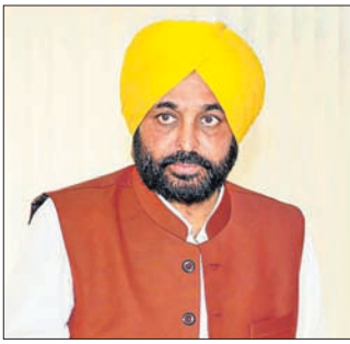
ଭଗତ୍ ସିଂହ ମାନ୍

ପଞ୍ଚାବକୁ ଦୁର୍ନୀତିମୁକ୍ତ କରିବା ଲାଗି ମାର୍ଚ୍ଚ ୨୩ ଶହାଦ ଦିବସରେ ସେଠାର ଏଏପି ସରକାର ଦୁର୍ନୀତି ନିରୋଧୀ ହେଲୁଲାଈନ ନୟର ଭାବେ ବ୍ୟବହାର କରାଯିବ। ଯଦି କେହି ଆପଣଙ୍କୁ ଲାଞ୍ଜ ମାଗନ୍ତି, ତେବେ ଏହାର ଅତି ଠିକ୍ କିମ୍ବା ଭିତ୍ତି ରେକର୍ଡ୍