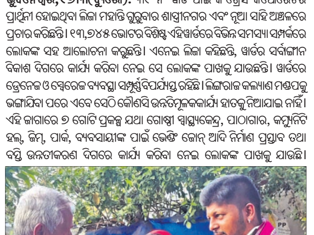
ଲୋକଙ୍କଠାରୁ ଭୋଗ ଭିକ୍ଷା କରୁଛନ୍ତି କଂଗ୍ରେସ ପ୍ରାର୍ଥୀ।