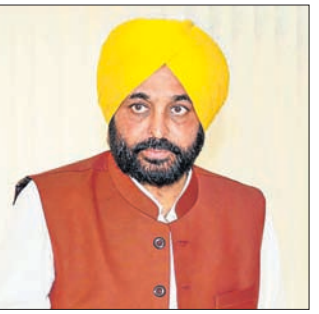
ଭଗଦତ୍ତ ମାନ୍ କରି ତାଙ୍କ ପାଖକୁ ପଠାଇବାକୁ ମାନ୍ ଏହାର ଅତି ଠିକ୍ କିମ୍ବା ଭିତ୍ତି ରେକର୍ଡ୍

ନ୍ୟାସିକା, ୧୭ମାର୍ଚ୍ଚ ପଞ୍ଜାବକୁ ଦୁର୍ନୀତିମୁକ୍ତ କରିବା ଲାଗି ମାର୍ଚ୍ଚ ୨୩ ଶହାଦ ଦିବସରେ ସେଠାର ଏଏପି ସରକାର ଦୁର୍ନୀତି ନିରୋଧୀ ହେଲୁଲାଈନ ନୟର ଭାବେ ବ୍ୟବହାର କରାଯିବ। ଯଦି କେହି ଆପଣଙ୍କୁ ଲାଞ୍ଚ ମାଗନ୍ତି, ତେବେ ଏହାର ଅତି ଠିକ୍ କିମ୍ବା ଭିତ୍ତି ରେକର୍ଡ୍