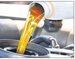
ଉପଲବ୍ଧ ଅଗୋଧ୍ୟ ଟେଲ୍ କ୍ରୟ କରିଛନ୍ତି। ହେଉଛି ଫାଇଲ୍ଟ୍ରିଂ ଟେଲ୍ କ୍ରୟ କରିଛନ୍ତି।

ଦ୍ୟାବିଲା, ୧୭୩୩: ଗୋଦରେଇ ପ୍ରଦୂର କମ୍ପାନୀ ଗୋଦରେଇ ଆଣ୍ଡ ବ୍ୟସ୍ନର୍ ଅଂଶ ତଥା ଭାରତର ଅଗ୍ରଣୀ ପର୍ଯ୍ୟଟର ବ୍ରାଣ୍ଡ ଗୋଦରେଇ