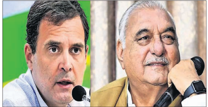
ରାହୁଲ ଗାନ୍ଧୀ ଭୃଗୁନାଥ ଶର୍ମା ଗାନ୍ଧୀ ଅସଭାରେ ନେତା ହରିୟାଣାର ପୂର୍ବତନ ମୁଖ୍ୟମନ୍ତ୍ରୀ ଭୃଗୁନାଥ ଶର୍ମାଙ୍କୁ ଭେଟିଥିଲେ। ଗୁରୁବାର ବୈଠକରେ ହୁଡ଼ାଙ୍କ ସମେତ ବରିଷ୍ଠ ନେତା ଆନନ୍ଦ ଶର୍ମା, କପିଳ ସିଂହ, ମନୀଷ ଡିଓରା, ଶଶୀ ଥରୁର, ରାଜ ବଜର, ସୟାପ

ନ୍ୟାସିକା, ୧୭ମାର୍ଚ୍ଚ ପାଞ୍ଚ ରାଜ୍ୟରେ ନିର୍ବାଚନ ପରାଜୟ ପରେ କଂଗ୍ରେସ ଦଳରେ ମତଭେଦ ବୃଦ୍ଧି ପାଇଛି। ଗତ ୨୪ ଘଣ୍ଟା ମଧ୍ୟରେ ଅସଭାକୁ ନେତାମାନଙ୍କ ଗୋଷ୍ଠୀ (ଜି୨୩) ନେତାମାନଙ୍କ ଦ୍ଵିତୀୟ ବୈଠକ ବରିଷ୍ଠ ନେତା ଗୁଲ୍‌ମାନ ନବା ଆଜ୍ଞାପକ ଘରେ ଗୁରୁବାର ସନ୍ଧ୍ୟାରେ ବସିଛି। ଏଥିରେ କପିଳ ସିଂହ, ଆନନ୍ଦ ଶର୍ମା ଏବଂ ଭୃଗୁନାଥ ଶର୍ମା ହୁଡ଼ା ପ୍ରମୁଖ ଯୋଗ ଦେଇଛନ୍ତି। ଦଳୀୟ ନେତୃତ୍ଵରେ ସମ୍ପୂର୍ଣ୍ଣ ପରିବର୍ତ୍ତନ ଦାବିକୁ ଜି୨୩ ନେତାମାନେ ଗୋରୁବାର କରିଛନ୍ତି। ଗୁରୁବାର ରାତିରେ ଗୁଲ୍‌ମାନ ନବା ଆଜ୍ଞାପକ ବାସଭବନରେ ୧୮ ଅସଭା ନେତାଙ୍କ ବୈଠକ ବସି ଏନେଇ ଆଲୋଚନା ହୋଇଥିଲା। ଗୁରୁବାର ସକାଳେ ବରିଷ୍ଠ କଂଗ୍ରେସ ନେତା ରାହୁଲ