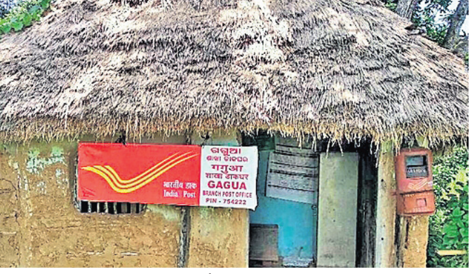
ସେଦିନର କରାକାର୍ଯ୍ୟ ଗୋଷ୍ଠୀ ପୋଷ୍ଟ ଅଫିସ୍ ।