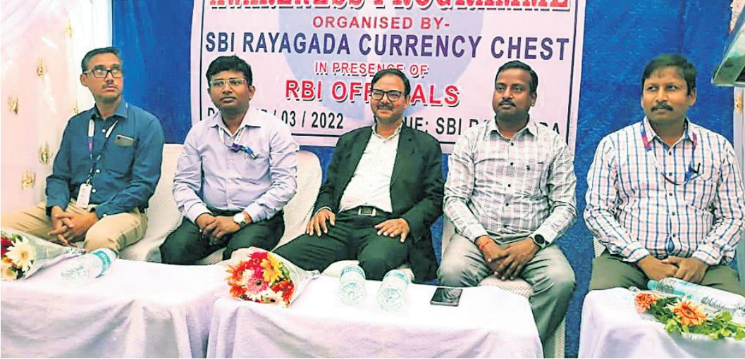
କାର୍ଯ୍ୟକ୍ରମରେ ଆରବିଆଇ ଓ ଏସ୍‌ବିଆଇର ଅଧିକାରୀମାନେ।