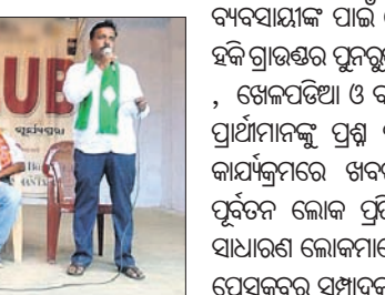
ଖୋଲାମଞ୍ଚରେ ଉପସ୍ଥିତ ପୌରାଧ୍ୟକ୍ଷ ପ୍ରାର୍ଥୀ