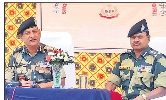
ଖବରଦାତା ସମ୍ମିଳନୀରେ ବିଏସ୍ଏଫ୍ ଆଇଜି ବୁଡ଼ାକଟି ସୂଚନା ଦେଉଛନ୍ତି।