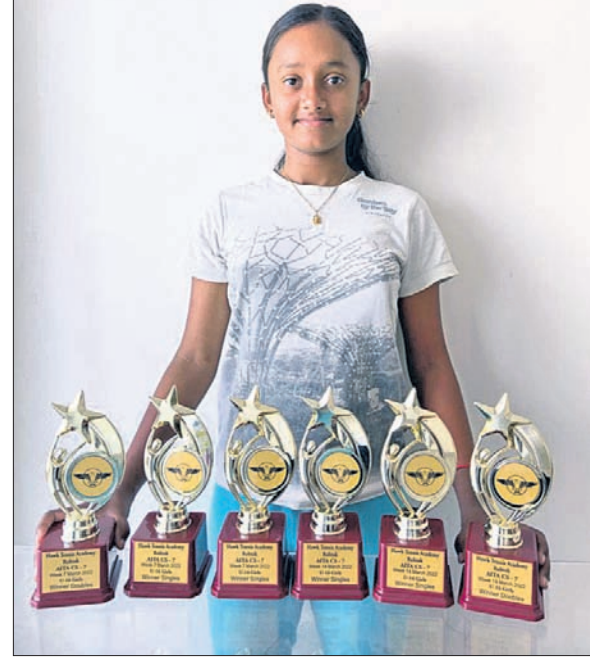
ଓଡ଼ିଶାରେ ୨ ପଦ୍ମାହରେ ୬ ଟ୍ରଫି ହାସଲ କରିଥିବା ଓଡ଼ିଶାର ଆରାଧ୍ୟା

ଭୁବନେଶ୍ୱର, ୧୭ମାର୍ଚ୍ଚ (କ୍ରୀଡ଼ା ପ୍ରତିନିଧି) ଓଡ଼ିଶାର ଆରାଧ୍ୟା କ୍ରୀଡ଼ା ମନ୍ତ୍ରାଳୟର ପ୍ରତିଭା ଓ ଟାଲେଣ୍ଟ ହାସଲ କରିଛନ୍ତି।