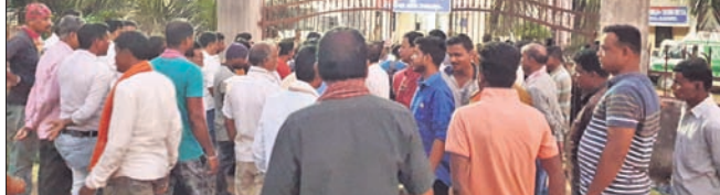
ସିପୁଲିଆ ଥାନା ସମ୍ମୁଖରେ ଭାଙ୍ଗିପାର ବିକ୍ଷୋଭ।

ବାଲେଶ୍ଵର ଜିଲ୍ଲା ସିପୁଲିଆ ଥାନା ଅଧୀନ ବଡ଼ଜୟାପୁର ଅଞ୍ଚଳରେ ନିର୍ବାଚନ ପରବର୍ତ୍ତୀ ହିଂସାରୁ ଏକ ହତ୍ୟାକାଣ୍ଡ ଘଟିଛି।