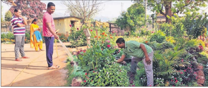
ଆନା ଅଧିକାରୀଙ୍କ ଦ୍ଵାରା ବଦଳିଥିବା ଆନା ପରିବେଶ।

ଦ୍ଵିତିକ ଅନଳର ଆନା ଏବେ ଖେଳୁଛି ଫଳ ଉଦ୍ୟାନରେ। ଭଳିକ ଭଳି ଫଳ ମନ ମୋହୁଛି। ଆନାକୁ ଯାତାୟତ କରୁଥିବା ଲୋକ ଏବଂ ସେହି ରାସ୍ତାରେ ଯାଉଥିବା ଯେକେହି ଚିକେଟ ଅନେକପାଇଁ ଆନା ପାଖରେ। ଏପରି ଏକ ଆନା ହେଉଛି କୋରାପୁଟ ଜିଲ୍ଲା ଦଶମହର ପ୍ରାନ୍ତ। ଆନାର ଚତୁର୍ଦ୍ଧାପାର୍ଶ୍ଵ ସୁନ୍ଦରତା ଲାଗି ଏବଂ କଣ୍ଠାବୁଦାରେ ପରିଚ୍ଛନ୍ନ ହୋଇଥିଲା। ଏକ ପ୍ରକାର ଅସ୍ଵାସ୍ଥ୍ୟକର ପରିବେଶ ଆସିବା ବଦଳିଲା ଆନାକୁ ଅନେକ ଆନା ଅଧିକାରୀ ଆହୁରିଲେ ଯାଉଥିଲେ ମଧ୍ୟ କେହି ଏହାର ପରିବେଶ ପ୍ରତି ଯତ୍ନବାନ ହେଉ ନ ଥିଲେ।