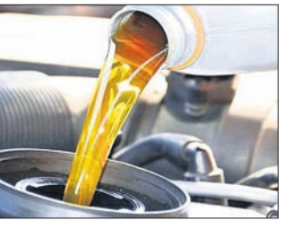
ଉପଲବ୍ଧ ଅଣ୍ଡୋଲ୍ ତେଲ (କ୍ରୟ କରିଛନ୍ତି) ଯେଉଁଠି ମାଜାଲୋର ରିଫାଇନେରି ଆଣ୍ଡ ପେଟ୍ରୋକେମିକାଲ୍ ଲିମିଟେଡ୍ (ଏମଆରପିଏଲ୍) ପକ୍ଷରୁ ୧୦ଲକ୍ଷ ବ୍ୟାରେଲ୍ ଅଣ୍ଡୋଲ୍ ତେଲ କ୍ରୟ କରିବାକୁ ପ୍ରସ୍ତାବ କାରି ରଖିଛନ୍ତି।

ଏମଆରପିଏଲ୍ ପ୍ରକାର ଅଣ୍ଡୋଲ୍ ତେଲ କ୍ରୟ କରିବାକୁ ଚେଷ୍ଟା କରୁଛନ୍ତି। ରୁଷିଆ-ୟୁକ୍ରେନ୍ ଯୁଦ୍ଧ ମଧ୍ୟରେ ବିଭିନ୍ନ ପକ୍ଷରୁ ଦେଶଗୁଡ଼ିକ ରୁଷିଆ ଉପରେ ବିଭିନ୍ନ ପ୍ରକାର ପ୍ରତିବନ୍ଧକ ଲଗାଯାଇଛି।