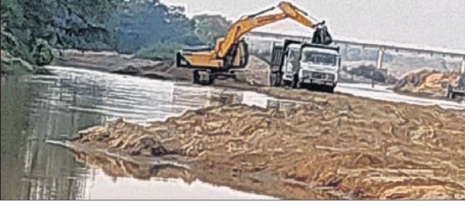
ତିର୍ତ୍ତୋଲ ସରକାରଙ୍କୁ ବାଲି ଖନନ କରାଯାଉଛି।

ଖଜୁରା ବ୍ଲକ୍ ସିପୁଲିଆ ଥାନା ଅଧୀନ ବଡ଼ଜୟାପୁର ପଞ୍ଚାୟତର ସମିତିସଭା ଶୁଣ୍ଠିରୁ ଏକ ସମ୍ମୁଖରେ ମୃତ୍ୟୁ ଘଟଣାରେ ଏକ ନିର୍ଦ୍ଦେଶ ଦିଆଯାଇଛି।