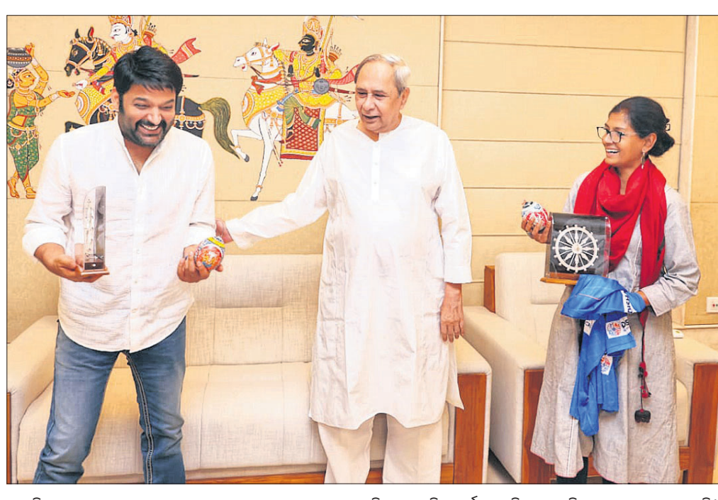
ନବୀନ ନିବାସରେ ଗୁରୁବାର ମୁଖ୍ୟମନ୍ତ୍ରୀ ନବୀନ ପଟ୍ଟନାୟକଙ୍କୁ ହାସ୍ୟ ଅଭିନେତା କପିଳ ଶର୍ମା ଓ ଅଭିନେତ୍ରୀ ନନ୍ଦିତା ଦାସ ସାକ୍ଷାତ୍ କରୁଛନ୍ତି।

ପିଲା କରୁଥିବା ଶିଳ୍ପୀଙ୍କୁ ଚାକିରି ଦେବା ପାଇଁ ନିର୍ଦ୍ଦେଶ ଦିଆଯାଇଛି।