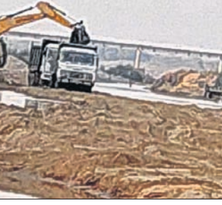
ତିର୍ତ୍ତୋଲ ସରକାରଙ୍କୁ ବାଲି ଖନନ କରାଯାଉଛି।