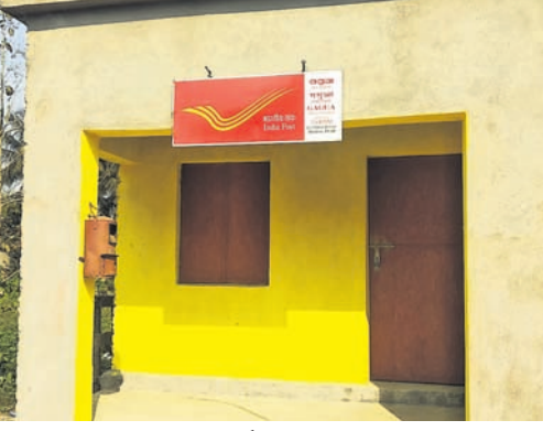
ଗ୍ରାମବାସୀଙ୍କ ଦ୍ୱାରା ନିର୍ମାଣ କରାଯାଇଥିବା କୋଠା ।

କେନ୍ଦ୍ରାପଡ଼ା ଅଫିସ୍, ୧୭ମାର୍ଚ୍ଚ କୁହାଯାଏ ମିଳିତ ହାତ ବଳ ଯେମିତି ଶକ୍ତିଶାଳୀ, ତା'ର ଫଳ ବି ସେମିତି ମିଳେ। ଏହି କଥାକୁ ପ୍ରମାଣିତ କରି ଦେଖାଇଛନ୍ତି କେନ୍ଦ୍ରାପଡ଼ା ଜିଲ୍ଲା କେନ୍ଦ୍ରାପଡ଼ା ବ୍ଲକ୍ ଅଧୀନ ଗୋଷ୍ଠୀ ଗ୍ରାମବାସୀ। ସେମାନଙ୍କ ମିଳିତ ଉଦ୍ୟମ, ଆର୍ଥିକ ସହାୟତା ଓ ଶ୍ରମଦାନ ଫଳରେ ଗ୍ରାମର ମୃତପ୍ରାୟ ପୋଷ୍ଟ ଅଫିସ୍ ଏବେ ଜୀବନ୍ତ ହୋଇଛି। ଏହି ରିପୋର୍ଟ ପ୍ରସ୍ତୁତ କରିବା ବେଳେ ଆମେ ସେଦିନର କରାକାର୍ଯ୍ୟ ପୋଷ୍ଟ ଅଫିସର ଫଟୋ ସହିତ