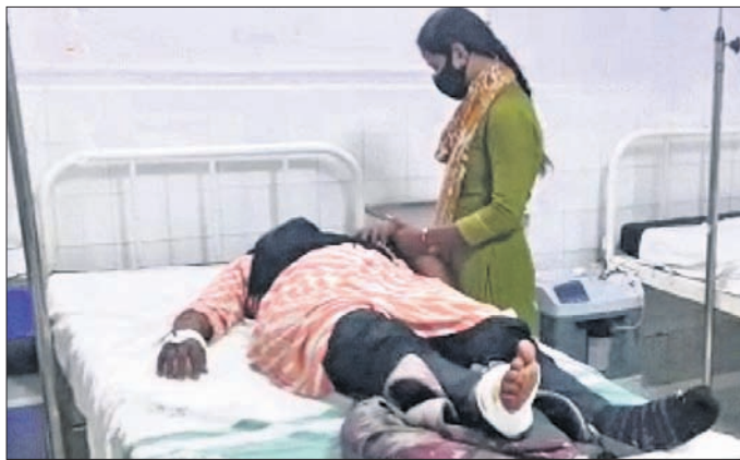
ଆହତ ମହିଳା ପାଇନାସ୍ କର୍ମଚାରୀ

ଖୋର୍ଦ୍ଧା ଜିଲ୍ଲାରେ ଲୁଚେଇବା ପାଇଁ ମହିଳା କର୍ମଚାରୀଙ୍କୁ ଚାକିରି ଦେବା ପାଇଁ ନିର୍ଦ୍ଦେଶ ଦିଆଯାଇଛି।